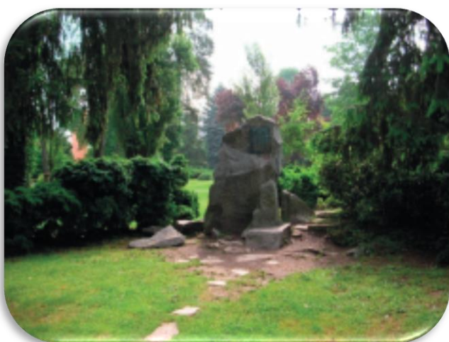
Slika 11: Spomenik dr. Mülleru u središnjem dijelu šetališta