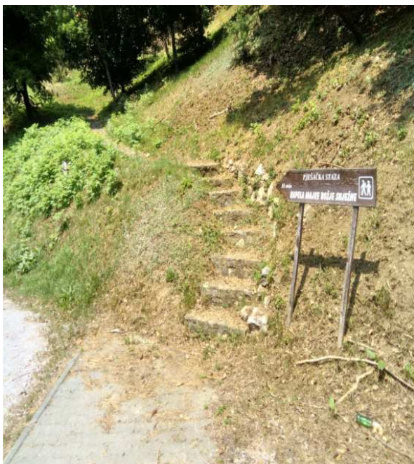
Slika 10. Info-tabla koja prikazuje vremensko trajanje pješačke rute (Darko Pasariček, 2017)