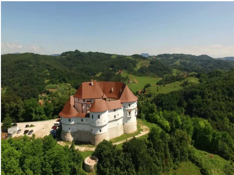
Slika 6. Dvor Veliki Tabor