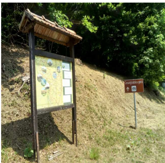
Slika 8. Info-tabla u sklopu odmorišta (Darko Pasariček, 2017))

• Uz samu državnu cestu 205 (D205), nasuprot restorana „Villa Zelenjak – Ventek“, postavljena je drvena info-tabla na kojoj su prikazane trase kružne biciklističke rute koja započinje i završava u Krapinskim Toplicama. Tekstualni sadržaj table nije preveden na engleski jezik, dok je očuvanost table u vrlo dobrom stanju.