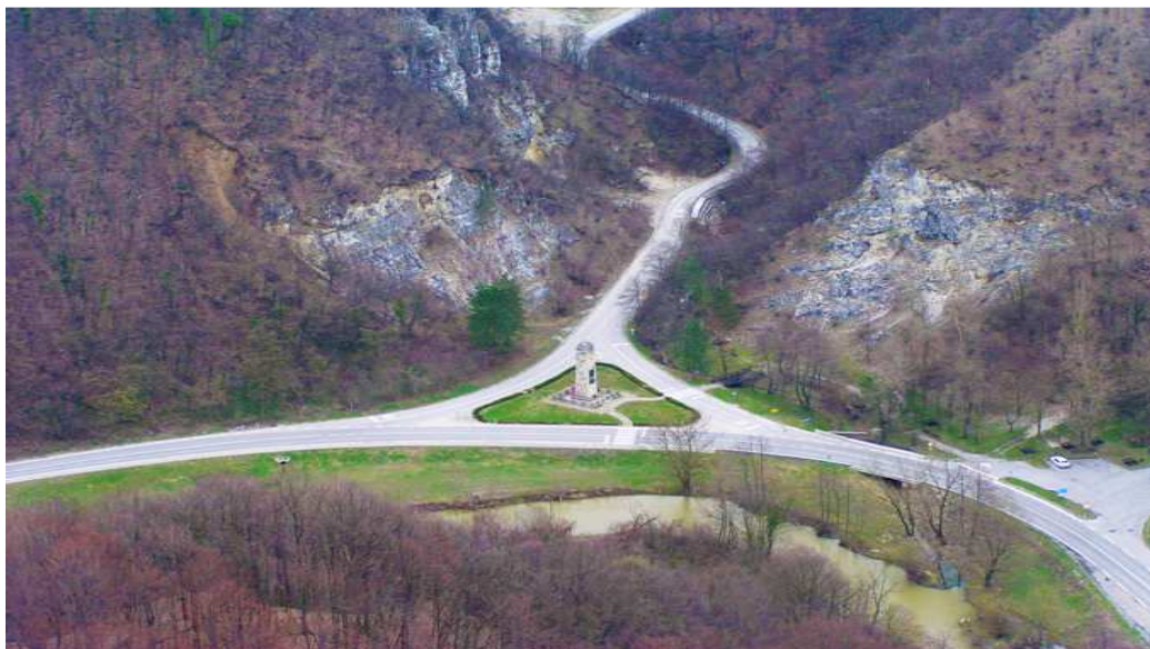
Slika 1. Središnji dio značajnog krajobraza ( http://www.zagorje-priroda.hr/vrijednosti.aspx?catId=35 )

„Kategorija V zaštićenih područja obuhvaća ona područja gdje je dugotrajna interakcija čovjeka i prirode proizvela osebujne ekološke, biološke, kulturne i estetske vrijednosti, i gdje je održavanje tog odnosa nužno da bi se ove vrijednosti sačuvala.“ 2