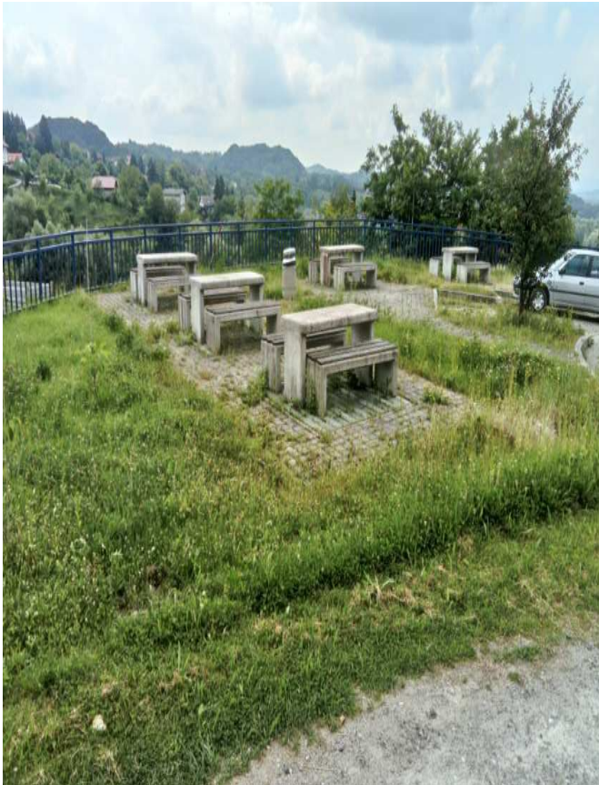
Slika 15. Odmaralište iznad Grada Klanjca (Darko Pasariček, 2017)