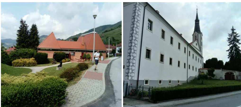
Slika 3. Galerija A. Augustinčića te franjevački samostan i crkva u Klanjcu (Darko Pasariček, 2017)