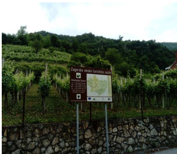
Slika 11. Info-tabla prikazuje trase zagorskih vinskih cesta (Darko Pasariček, 2017)