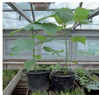
Morfološki izgled kontrolne (lijevo) i mikorizirane (desno) sadnice iz korjenjaka hibrida paulownije 9501 starog 48 dana

Osim toga, putem sjemena ne mogu se vjerno prenijeti sva obilježja roditeljske biljke na potomstvo, tako da će buduća plantaža od biljaka proizvedenih sjemenom imati raznolik rast i prirast, te neujednačenu kvalitetnu drvene sirovine.