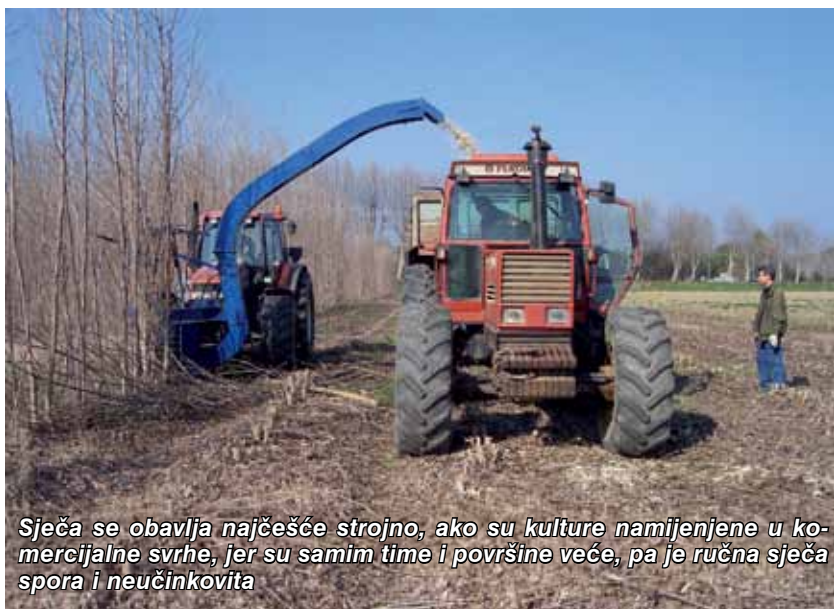
Sječa se obavlja najčešće strojno, ako su kulture namijenjene u komercijalne svrhe, jer su samim time i površine veće, pa je ručna sječa spora i neučinkovita

Kulture kratkih ophodnji se sijeku nakon što su biljke odbacile listove pa sve do formiranja novih pupova. Sječa se odvija do kasno u veljaču, s tim da pri dnu ostane 10 cm pri-