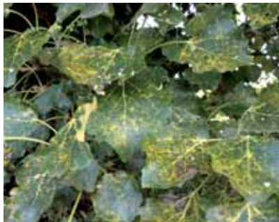
Hrđa je najučestalija bolest kultura kratkih ophodnji te joj treba posvetiti osobitu pažnju

Također ih često napada bakterija Xanthomona populi koja uzrokuje rak kore. Najveća opasnost koja se teško može kontrolirati je uvoz sadnog materijala i s njim različitih