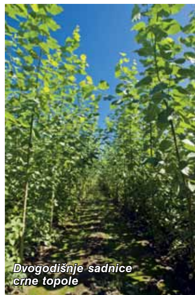
Dvogodišnje sadnice crne topole

Danas postoji 11 priznatih klonova vrba, a od topola se proizvode klonovi kanadske topole ( Populus x canadensis Moench), klonovi američke crne topole ( Populus deltoides W Bertram ex Marshall), klonovi crne topole ( Populus nigra L.), selekcije unutarvrskih hibrida bijele vrbe. Uglavnom se u rasadnicima