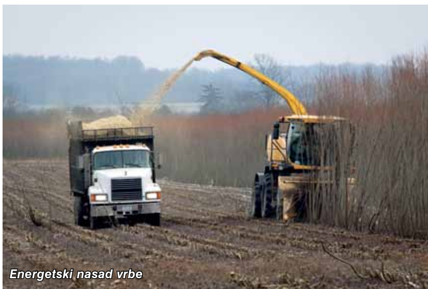
Energetski nasad vrbe

Neposredno prije sadnje u proljeće, potrebno je dovršiti obradu tla odnosno provesti dopunsku