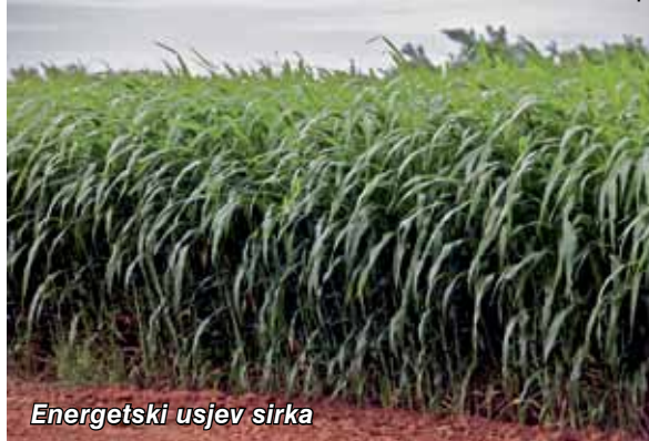
Energetski usjev sirka

Prinos energetskih usjeva poput sirka ( Sorghum sp. ) može iznositi i do 37 tona suhe mase po hektaru. Za poljodjelce koji su zainteresirani za potencijalnu proizvodnju sirovina za etanol iz celuloze, jednogodišnji usjev poput energetskog sirka mogao bi u početku biti više poželjan, budući da je većina naših poljodjelaca i navikla uzgajati jednogodišnje usjeve.