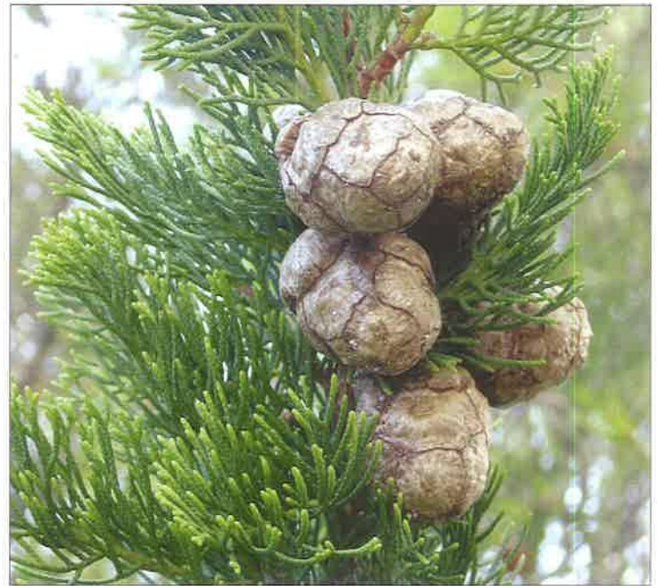
Slika 12. Obični čempres ( Cupressus sempervirens L.)

Piotto i Di Noi (2001) smatraju da sjeme s vlagom 5–6 % zadržava vitalnost dulje vrijeme (7–20 godina) ako se drži u hermetički zatvorenim posudama i na temperaturi od 3 °C.