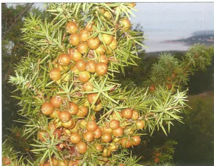
Slika 13. Pukinja, ljuskavac ( Juniperus oxycedrus L. Ball. syn. J. macrocarpa /Sm./ Ball.)

Skupljanje, vađenje i čuvanje sjemeni. Načini skupljanja, vađenja i čuvanja sjemeni jednaki su kao i kod pukinje. Piotto i Di Noi (2001) pišu kako je sjeme gluhaca vrlo osjetljivo prema gubitku vlage (ne podnosi jako isušivanje). Prema istim autorima sjeme rasprostiru ptice (većinom drozdovi) ili sitni mesožderi kao što je lisica. Sjemenom primorske somine hrane se i ostale životinje poput divljega zeca ili divlje svinje, ali i mrava. Zreli, crvenkasti plodovi skupljaju se od rujna do listopada. Plodovi, koji sadrže prosječno 5 sjemenki, moraju se preko noći