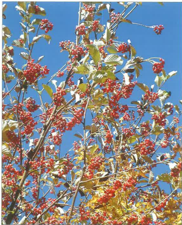
Slika 8. Mukinja ( Sorbus aria /L./ Crantz.) Figure 8 Whitebeam ( Sorbus aria /L./ Crantz.)

zrijevaju od kolovoza do rujna. Prema Youngu i Youngu (1992) mukinja cvjeta u svibnju, plodovi dozrijevaju od rujna do listopada, a otpadaju od listopada do proljeća. Isti autori naglašavaju kako se plodovima vrsta iz roda Sorbus rado hrane ptice koje su i glavni prenosioci sjemena na veće udaljenosti. Prema Oršaniću i dr. (2006) mukinja u Hrvatskoj ne plodonosi obilno svake godine, a u istraživanom razdoblju 2003–2005. godine urod je procijenjen prosječno kao pun, loš i nikakav.