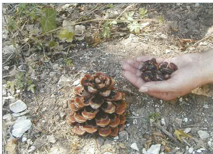
Slika 11. Pinija ( Pinus pinea L.)

Prema Pravilima ISTA-e za ispitivanje klijavosti sjemena pinijevo se sjeme ispituje na podlozi od filter-papira metodom