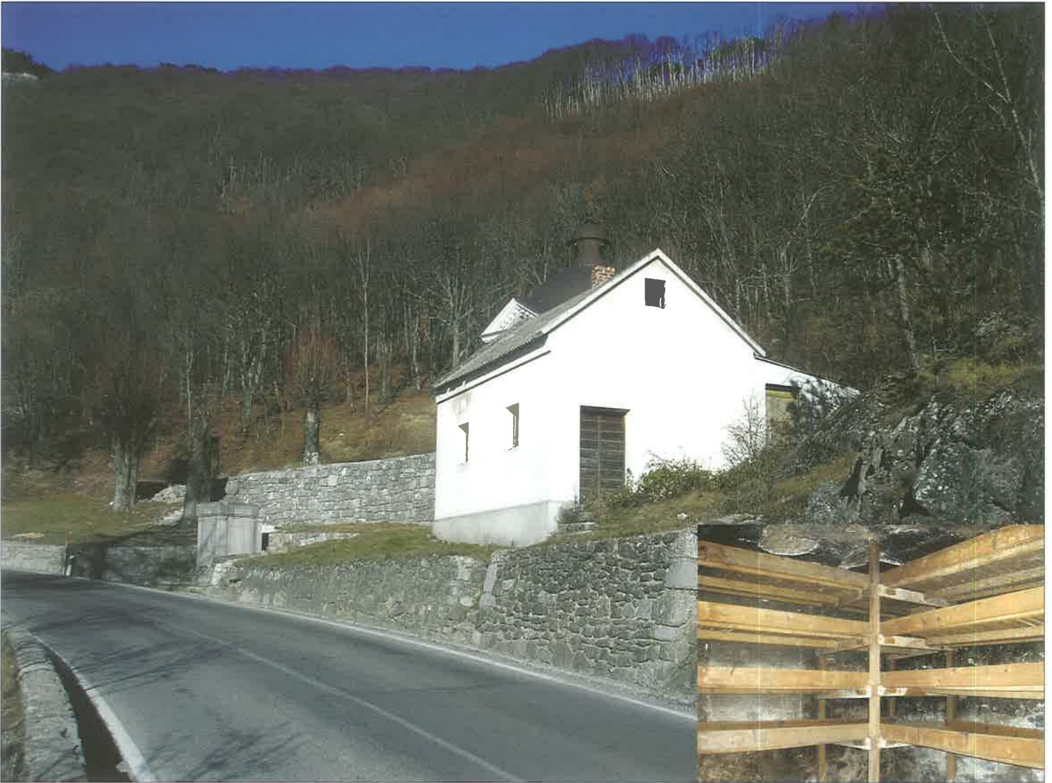
Slika 1. Trušnica na području Senjske drage (UŠP Senj) Figure 1 Seed extraction plant in the Senjska Draga area (FA Senj)