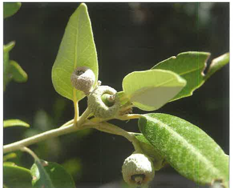
Slika 2. Hrast crnika ( Quercus ilex L.) Figure 2 Holm oak ( Quercus ilex L.)

U 1 kg žira crnike nalazi se od 200 do 500 odnosno prosječno 350 plodova (Regent 1980). Cvjetni pupovi i cvjetovi najčešće se pojavljuju u mjesecu svibnju i lipnju na ovogodišnjim izbojcima. Cvatnja može potrajati sve do kraja lipnja kada počinje razvoj žira. Urod žira kod crnike pokazuje veliku varijabilnost s obzirom na stabla i godine. Za oba čimbenika ključne su kombinacije gena unutar populacija. Može se reći kako se dobar urod pojavljuje svake (2) 4–6 godine (Michaudu i dr. 1992). Spoznaje o intervalu punoga uroda sjemena treba uzeti s rezervom jer ne postoje dugoročna istraživanja o tome. Treba istaknuti da je stanište značajan čimbenik koji utječe na sve životne manifestacije vrste drveća, pa tako i na urod sjemena što, djelomično ističu Piotto i Di Noi (2001) kad kažu da je cvatnja i rađanje sjemenom kod hrasta uvjetovana klimom.