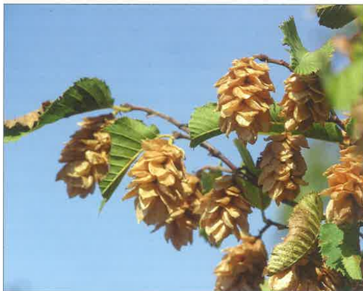
Slika 6. Crni grab ( Ostrya carpinifolia Scop.) Figure 6 Hop hornbeam ( Ostrya carpinifolia Scop.)

Žuti koprivić je rasprostranjen uglavnom u istočnom Sredozemlju i Maloj Aziji. U nas je reliktna vrsta u području mediteranskih i submediteranskih šuma (Anić 1983).