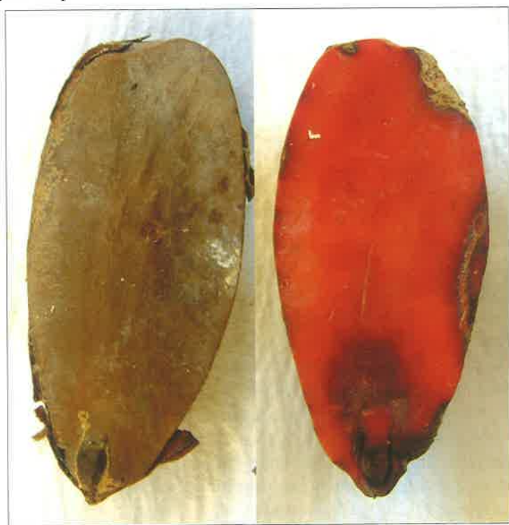
Figure 5 Vital and non-vital acorn tested by means of the tetrazol method and assessed according to the ISTA Rules

Slika 5. Vitalan i nevitlan žir ispitani metodom tetrazola i procijenjeni prema Pravilima ISTA