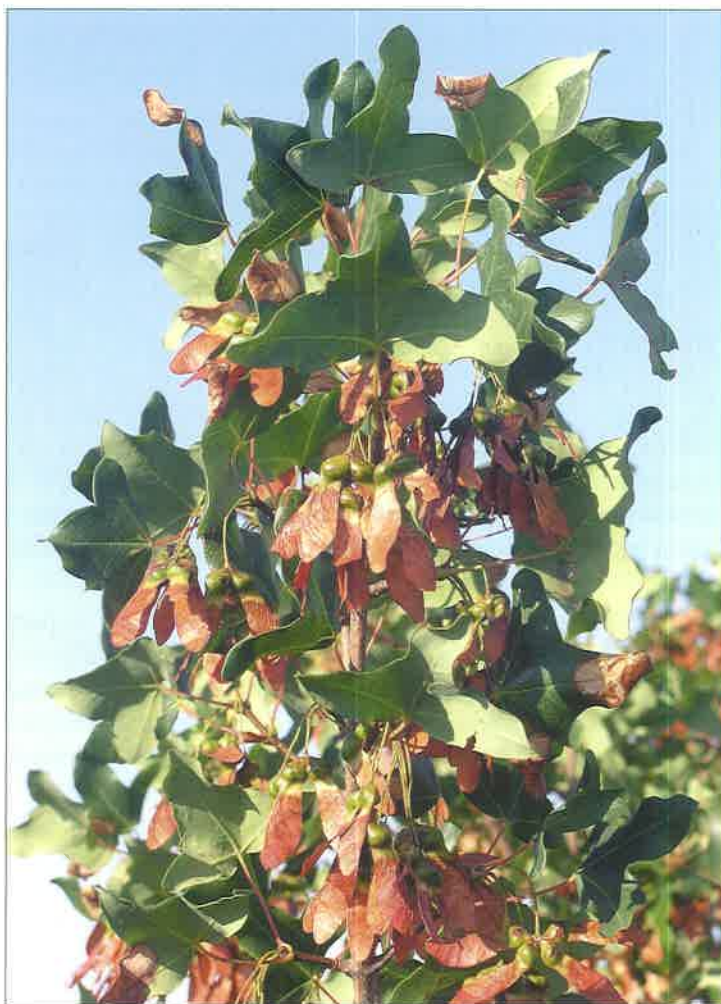
Slika 7. Maklen ( Acer monspessulanum L.)

Tretiranje sjemena prije sjetve i klijanje. Slično je kao kod običnoga koprivića.