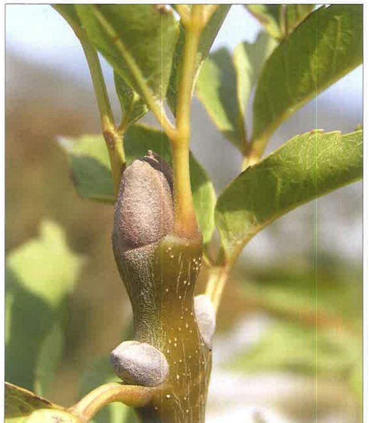
Slika 4. Crni jasen ( Fraxinus ornus L. ) Figure 4. Manna ash ( Fraxinus ornus L. )

U skladu s Pravilima ISTA (International Rules for Seed Testing 2007) sjeme vrsta iz roda Quercus ispituje se na podlozi od pijeska (metodama “na pijesku” i “u pijesku”). Temperatura pri ispitivanju treba iznositi 20 °C, prvo brojenje obavlja se sedmoga, a zadnje 28. dana. Prije ispitivanja kljavosti sjeme se moći u vodi u trajanju od 48 i više sati, zatim se plitko zarezati sa svih strana i ukloni mu se perikarp.