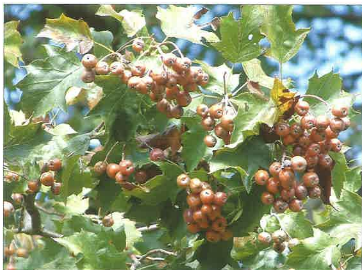
Slika 9. Brekinja u punom urodu

Prema nekim autorima puni urod kod brekinje događa se svake dvije godine ili tri puta u četiri godine, a u sastojini plodonose stabla koja imaju osvijetljenu krošnju. Prema Oršaniću i dr. (2006) brekinja u Hrvatskoj ne plodonosi obilno svake godine, a za istraživano razdoblje 2003–2005. godine urod je procijenjen prosječno kao pun, loš i loš. Po sposobnosti plodonošenja u Hrvatskoj navedene vrste pokazuju svojstva više prijelaznih nego pionirskih vrsta drveća.