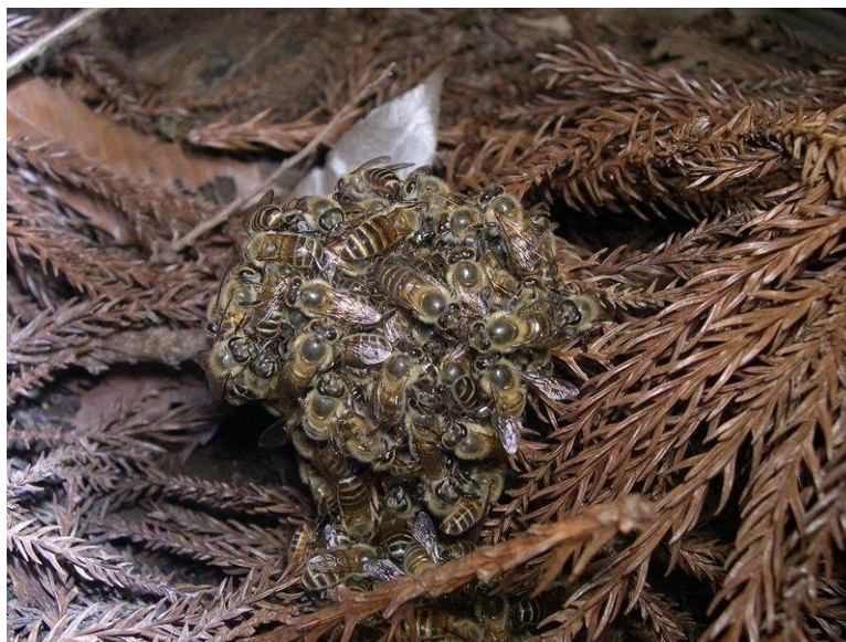
Slika 6. Obrambeni mehanizam japanskih pčela medarica

Kod japanskih pčela medarica ( Apis cerana japonica ) postoji određen mehanizam obrane od stršljenova. Iako stršljeni imaju tvrd oklop kojeg žalac pčela ne može probiti oni nisu otporni na visoke temperature kao pčele. Prilikom dolaska izviđača stršljena one, prije nego stršljen stigne obilježiti košnicu svojim feromonima pomoću kojih ostali stršljenovi pronađu tu košnicu, si vibrirajući zadkom signaliziraju uljeza i plan napada. Nakon toga pčele se čvrsto skupe u kuglu u čijoj sredini se nalazi uljez te vibrirajući podižu temperaturu što uzrokuje da se stršljen doslovno skuha.