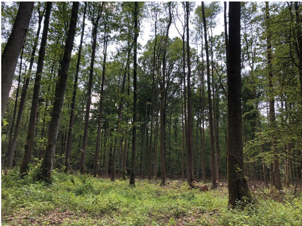
Slika 3. Zajednica Leucoja aestivi-Fraxinetum angustifoliae u GJ Opeke (Ptić)

Vrlo poučan primjer sukcesije šumske vegetacije u kojoj jasen igra značajnu ulogu nalazi se u Lonjskom polju, ispod mjesta Osekovo. Nekadašnje pašne površine još se uvijek poplavljaju. Sjeverni, nešto viši dio polja obrastao je sastojinama čivitnjače ( Amorpha fruticosa ) i mjestimično barskom ivom ( Salix cinerea ). Već nakon nekoliko godina u njih se pojedinačno počeo naseljavati poljski jasen, poslije sve gušće te danas na rubnim dijelovima čini mlade sastojine kojima bi se trebalo početi gospodariti. Sam je proces trajao tridesetak godina i amorfa je odigrala pozitivnu pionirsku ulogu jer je pri vraćanju poplavne vode zaustavila i taložila hranjive tvari i stvarala uvjete za rast jasena. Jasen pojedinačno prvi osvaja takve terene, no često stradava od leda pa ga u sklopu s amorfom lakše podnosi (Vukelić, 2012).