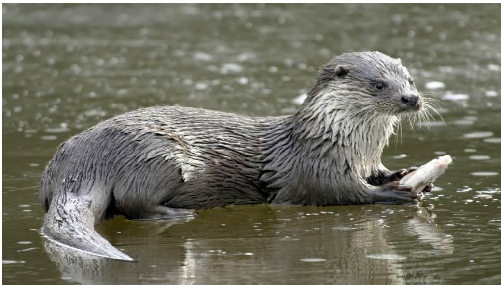
Slika 1. Vidra

Kako bi se vidra zaštitila, treba osigurati djelotvorniju zaštitu od krivolova i onemogućiti ilegalnu prodaju te preradu koža i krzna. Pri izgradnji prometnica treba planirati i izgraditi prolaze za vidre. Također treba zaustaviti daljnje onečišćenje i kanaliziranje prirodnih vodotoka. S obzirom na to da je vidra nedovoljno istražena, trebalo bi organizirati istraživanje sadašnjeg stanja i brojnosti vrste te praćenje stanja (Tvrtković, Flajšman, 2006).