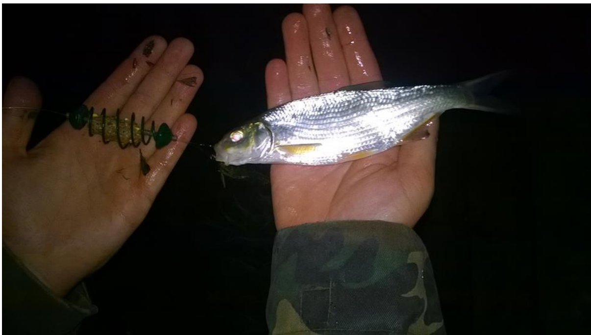
Slika 1. Osjetljiva (VU) vrsta nosara ( Vimba vimba ) registrirana na starom toku Drave prije utjecanja u akumulaciju HE Donja Dubrava (Autor: Ivan Bajrović)

tok rijeke Drave posebno ugrožava vađenje šljunka i pijeska iz korita što uzrokuje izravan gubitak staništa za brojne vrste riba, ali i ostale životinje (Mrakovčić i sur., 2006).