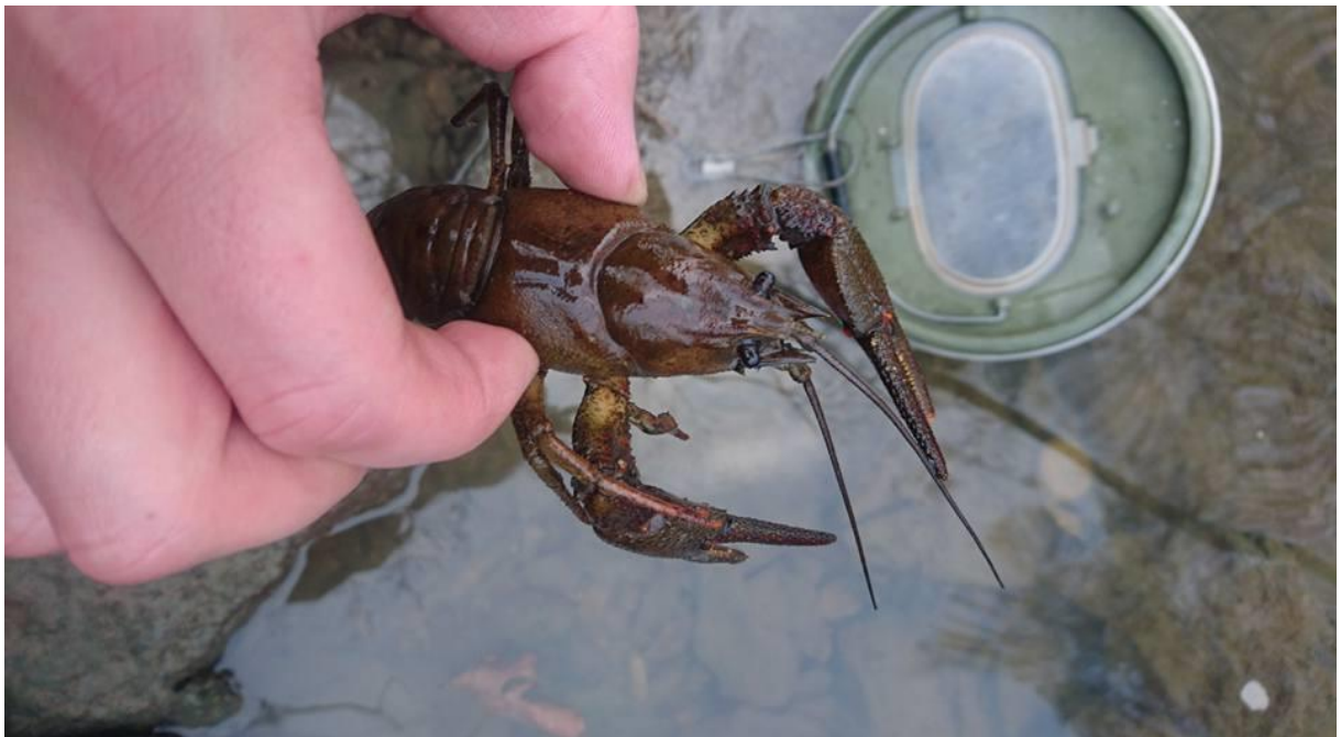
Slika 2. Strogo zaštićena svojta riječni rak ( Astacus astacus ) opažen u rukavcu starog toka Drave u blizini Struge (autor: Ivan Bajrović)