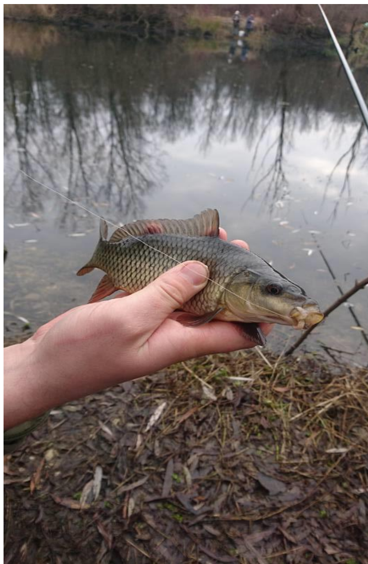
Slika 2. Šaran „ljuskaš“ ( Cyprinus carpio ), ugrožena (EN) dravska vrsta registrirana na rukavcu starog toka Drave u blizini Hrženice