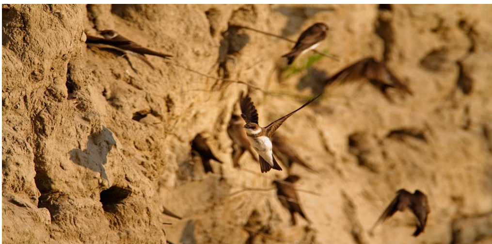
Slika 2. Gnijezda bregunica na strmim obalama Drave (Goran Šafarek)

Stanovnici sprudova još su i kulici i male prutke. Neke vrste ptica stanovnici su golih strmih obala nastalih erozijom rijeke. Zbog strmine i nepristupačnosti položaja zaštićene su od grabežljivaca. U toj zemlji kopaju kanale i gnijezde se. Jedna od takvih ptica je vodomar koji buši rupe i do metar dubine. Izvanredan je ribolovac i živi uz močvare, jezera i rijeke. Na sličan se način gnijezde i bregunice, no one žive u kolonijama od nekoliko stotina do čak nekoliko tisuća parova. Neke od najvećih kolonija nalaze se kod Gata na Dravi. Tu su također ptice pčelarice čiji tuneli dosežu i do 2,7 metara (Šafarek, Šolić, 2011).