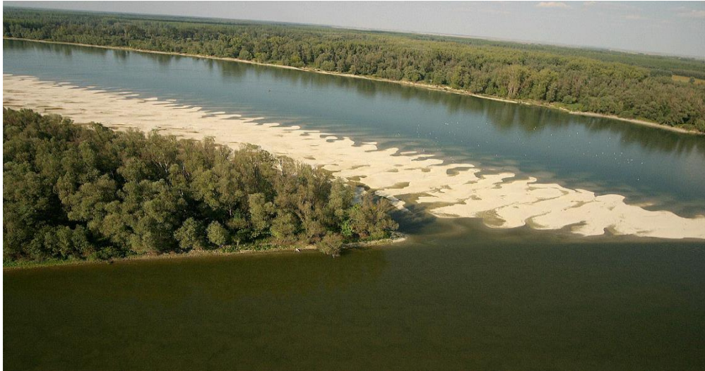
Slika 1. Pogled na sprud i ritsku šumu kod ušća Drave u Dunav