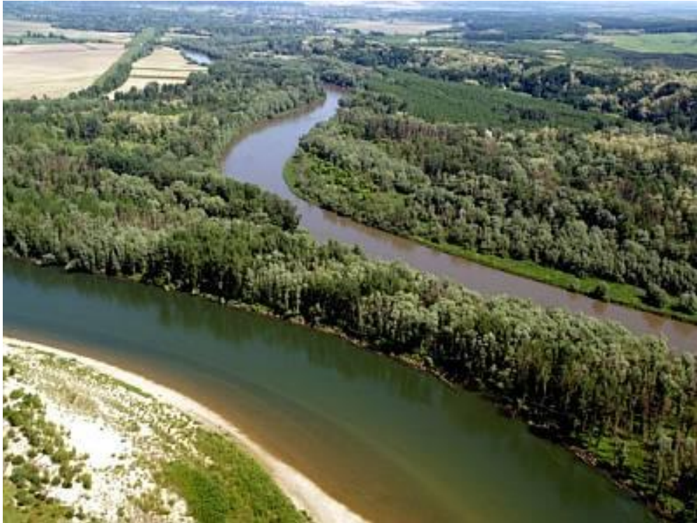
Slika 1. Usporedan tok Mure i Drave prije samog ušća kod Legrada

korito Drave sačuvano je jedino između akumulacija te djelomice u starim tokovima. Priobalje Mure i Drave u Hrvatskoj i Mađarskoj predstavlja jednu tek rijetko očuvanu oazu prirodnog okoliša u srednjoj Europi, stoga je i razumljivo veliko zanimanje europske i hrvatske ekološke javnosti za njegovo očuvanje (Feletar, 2013).