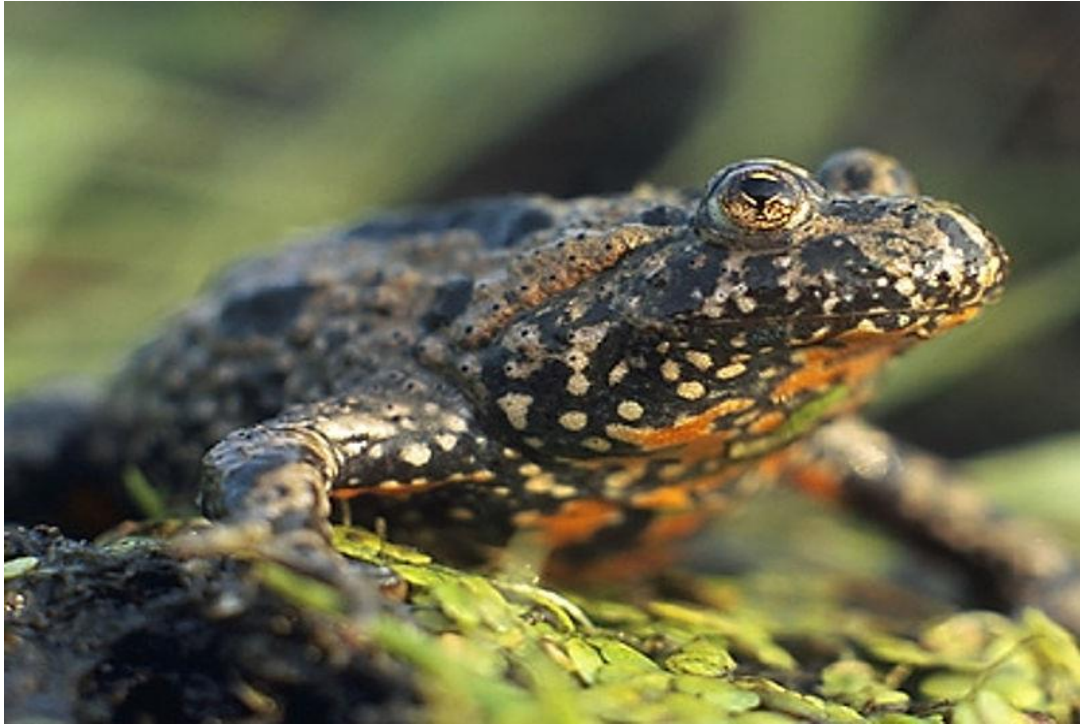
Slika 1. Crveni mukač (Autor : Marek Szczepanek)