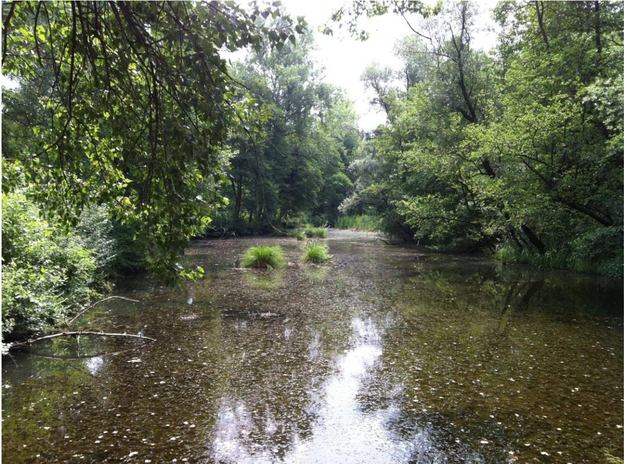
Slika 1. Jedan od brojnih dravskih rukavaca (autor : Goran Šafarek)