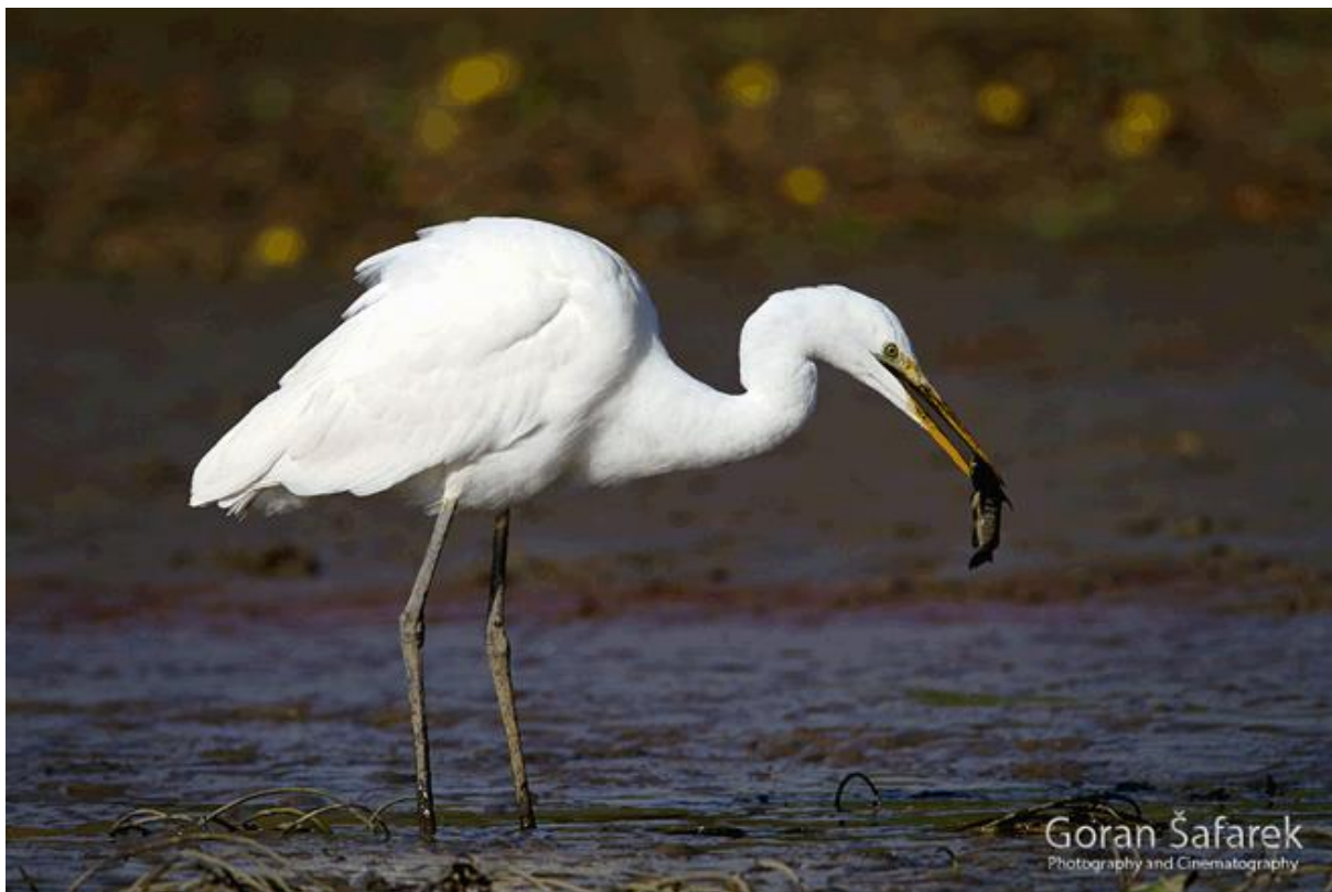
Slika 2. Velika bijela čaplja