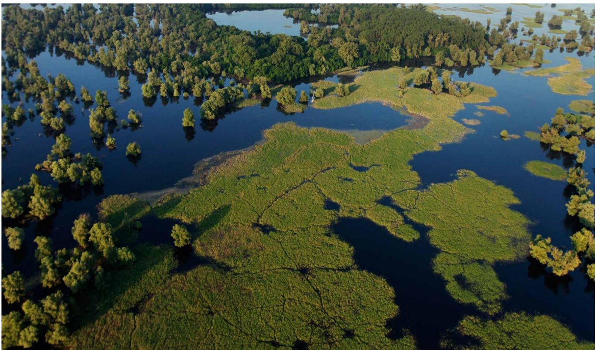
Slika 1. Park prirode Kopački rit

Naša su vrijedna poplavna područja Lonjsko polje i Kopački rit. Iako ne spada u Regionalni park Mura-Drava, Park prirode Kopački rit na istočnom se završetku Regionalnog parka Mura-Drava naslanja na njega i dio je tvorevine rijeke Drave s Dunavom. To je jedno od najpoznatijih močvarnih područja u Europi i svakako ga treba spomenuti u kontekstu očuvanja vodenog i šumskog ekosustava RP Mura-Drava. Takva su područja pokazatelj da očuvane rijeke i njihove poplave nisu štetne, nego predstavljaju izuzetnu prirodnu baštinu. U Kopačkom ritu prevladavaju ritske šume bijele vrbe u kojima žive jeleni, divlje svinje i manji sisavci poput divljih mačaka, lisica, tvorova, kuna i vidra. Ovdje se pojavljuje čak 285 vrsta ptica od kojih se oko 140 i gnijezdi. Poplava pogoduje i mnogim ribama pa tako šarani, štuke, somovi, smuđevi i ostali dolaze ovamo u miru polagati jaja. Mlada riba nakon poplavnog razdoblja snabdijeva okolne rijeke koje obiluju ribljim fondom (Šafarek, Šolić, 2011).