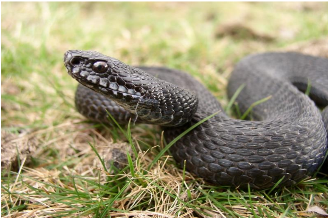
Slika 1. Potpuno crni (melanistički) primjerak riđovke