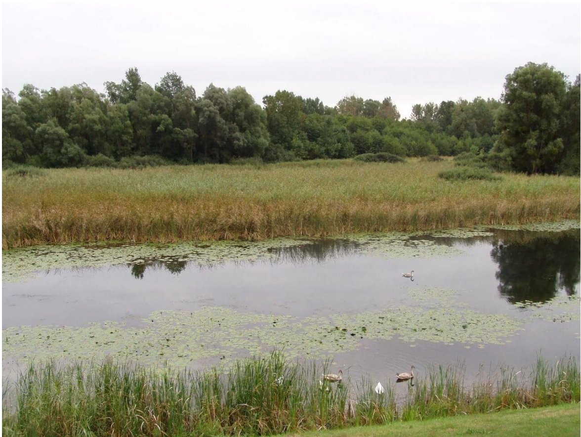
Slika 1. Mrtvica

Mrtvica ili mrtvi rukavac nastaje nakon što rukavac izgubi posljednju nit povezanosti s maticom i kada prestane teći. Ako rijeka duže vrijeme ne poplavi mrtvicu, jezero postaje sve pliće i s vremenom vrbe, johe i šaševi počinju osvajati površinu. Nakon mnogo godina izrast će i klimatogena zajednica šume. Mrtvice su močvare koje vrve životom. One su iznimno vrijedno stanište brojnim vrstama živih organizama. Životinje se ondje hrane, a mnoge se ptice močvarice poput pataka, liski, čaplji i ostalih gnijezde. Mnoge se manje ptice poput velikog trstenjaka, trstenjaka cvrkutića, velikog cvrčića, trstenjaka rogožara i trstenjaka mlakara skrivaju u trsci (Šfarek, Šolić, 2011).