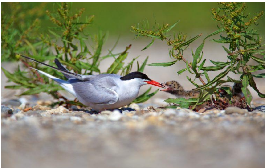
Slika 1 – Crvenokljuna čigra na dravskom sprudu

Stanovnici sprudova još su i kulici i male prutke. Neke vrste ptica stanovnici su golih strmih obala nastalih erozijom rijeke. Zbog strmine i nepristupačnosti položaja zaštićene su od grabežljivaca. U toj zemlji kopaju kanale i gnijezde se. Jedna od takvih ptica je vodomar koji buši rupe i do metar dubine. Izvanredan je ribolovac i živi uz močvare, jezera i rijeke. Na sličan se način gnijezde i bregunice, no one žive u kolonijama od nekoliko stotina do čak nekoliko tisuća parova. Neke od najvećih kolonija nalaze se kod Gata na Dravi. Tu su također ptice pčelarice čiji tuneli dosežu i do 2,7 metara (Šafarek, Šolić, 2011).