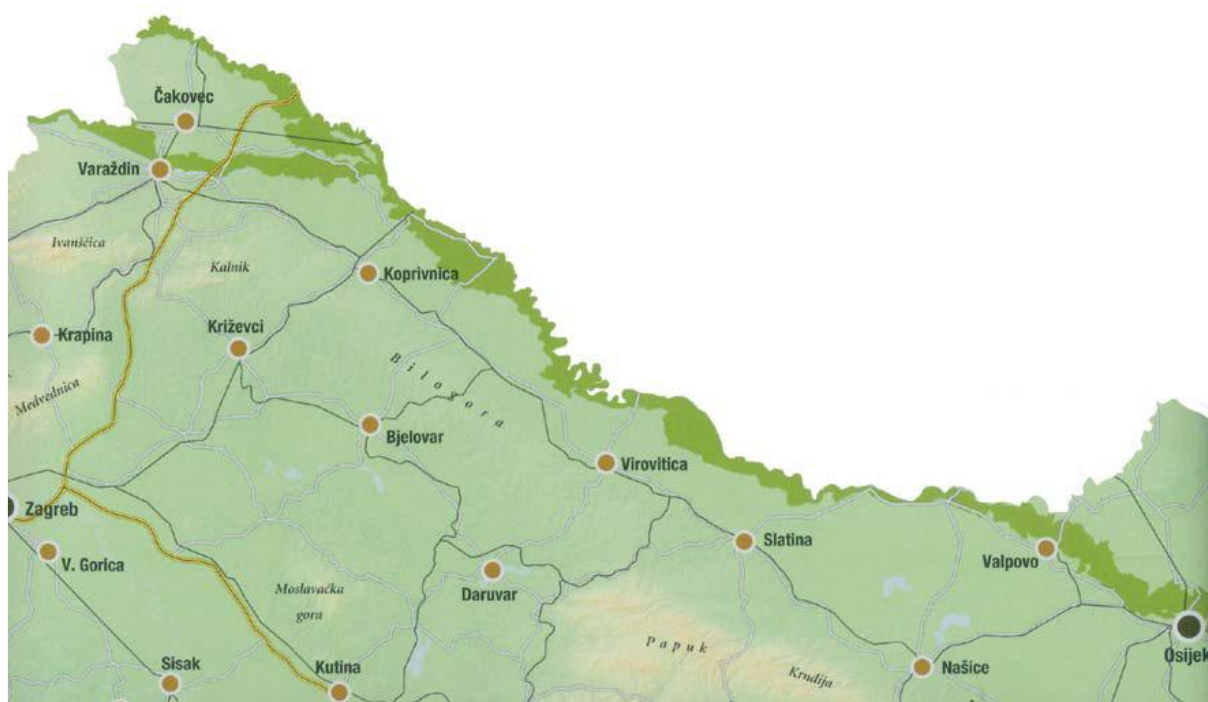
Slika 1. Zaštićeno područje Regionalnog parka Mura-Drava u Hrvatskoj (izvor: demografske značajke RP Mura-Drava, Dragutin Feletar)

Regionalni park Mura-Drava obuhvaća područje dviju rijeka. «S južne, hrvatske strane Mure na području Međimurja taj je poloj nešto širi i proteže se u dužini od 83 kilometra, od naselja Čestijanec na ulasku Mure u Hrvatsku do sutoka u Dravu kod Legrada. Poloj uz Dravu od Dubrave Križovljanske na zapadu do Aljmaša na istoku zaštićen je u dužini od 323 kilometra. Zaštićeni poloj uz Dravu je nešto uži, a na nekoliko se mjesta prostorni kontinuitet prekida. Ukupna površina zaštićenoga područja Regionalnoga parka Mura-Drava proteže se na oko 877 četvornih kilometara, što je nešto više od ukupne površine Međimurja. Sa sjeverne, mađarske strane Drave uski holoceni poloj proglašen je 1996. Nacionalnim parkom Drava-Dunav (od Legradske gore, odnosno Ertiłoša na zapadu do područja oko Dunava u Mađarskoj), pa dakle ima viši stupanj zaštite. Uz taj mađarski nacionalni park, naš je Regionalni park Mura-Drava po kilometraži najdulje zaštićeno područje u Europi. (D. Feletar, Geografsko-demografske značajke Regionalnog parka Mura-Drava)»