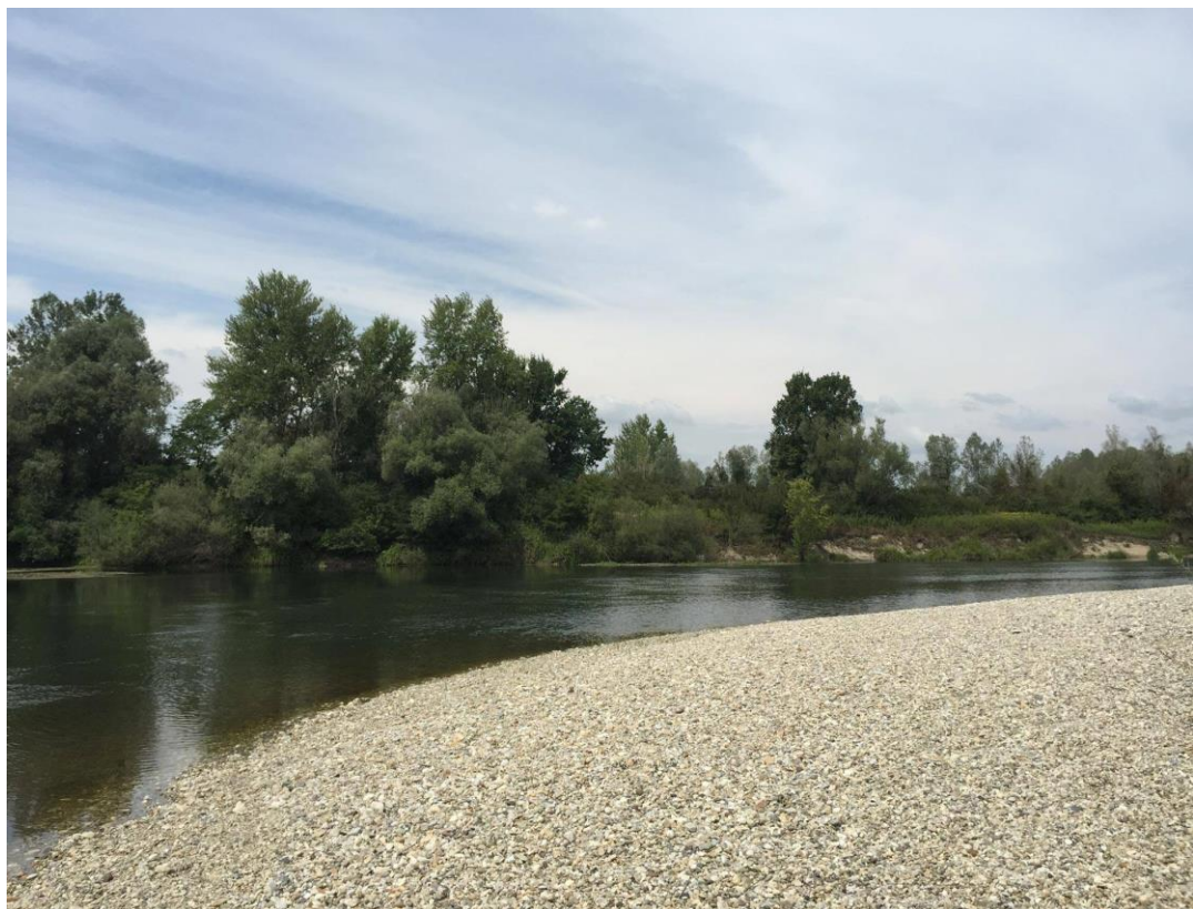
Slika 1. Sprud kod varaždinske Drave

proglasilo je početkom 2008. godine preventivnu zaštitu koridora Mure i Drave u kategoriji regionalnog parka čime je nastupila i obveza da se u roku od tri godine izrade sve potrebne studije i izvrše pripreme za proglašenje Regionalnog parka Mura-Drava. To je u roku i izvršeno te je u veljači 2011. godine park službeno proglašen. Osim što je time zaštićen prirodni okoliš Mure i Drave, proglašenje Regionalnog parka Mura-Drava omogućit će i stvaranje boljeg života stanovništvu koje u njemu živi. Proglašenjem parka gospodarski razvoj neće biti zakočen. Svrha je zaštite očuvanje tipova staništa ugroženih i posebnih vrsta bilja i životinja te krajobraznih vrijednosti i kulturno-tradicijske baštine. Ova razina zaštite dopušta uglavnom sve dosadašnje gospodarske aktivnosti na području parka. Dapače, otvaraju se i nove razvojne mogućnosti, prije svega vezane uz razvoj ekološke poljoprivrede, ekoturizma, rekreacije i kulturnih djelatnosti. I u svim županijama uz Dravu osnovane su profesionalne ustanove za upravljanje prirodnim vrijednostima koje su vrlo aktivne i doprinose poštivanju zakona o zaštiti prirode, vrše stručna istraživanja, ali uvelike pridonose i popularizaciji tih područja te njihovoj turističkoj valorizaciji. Regionalni park, kao stupanj zaštite, povoljan je oblik za ulazak u sufinanciranje iz međunarodnih fondova Europske unije što dodatno unapređuje istraživanja i život uz Muru i Dravu.