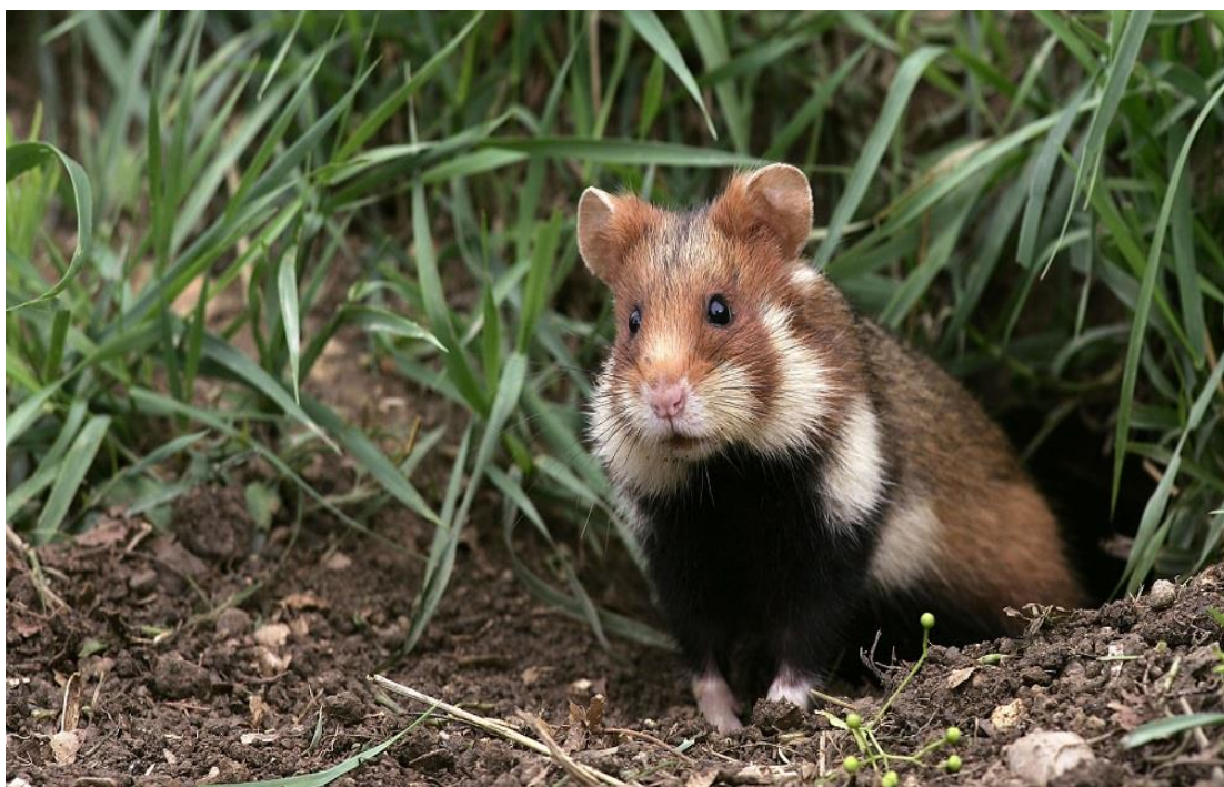
Slika 1. Hrčak

Kako bi se mogle uspostaviti adekvatne mjere zaštite navedenih vrsta, potrebno je organizirati istraživanja areala, stanja i brojnosti populacija, te promjena brojnosti. Cilj je zaštite održavanje populacija u postojećoj brojnosti (Tvrtković, 2006).