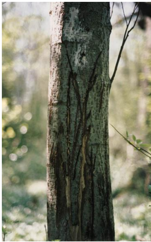
Slika 8. i 9. Rane na kori od kljova vepra