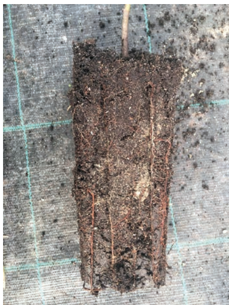
Slika 2. Aktivacija korijena podloge sadnice vrste Acer palmatum vidljiva je po bijelim sitnim korjenčićima

Figure 2. Activation of rootstock roots of Acer palmatum seedlings is visible on white small roots