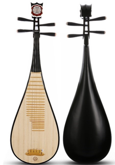
Slika 4. Kineski tradicionalni instrument izrađen iz drva paulovnije

Drvo paulovnije se koristi i za izradu raznih drvnih ploča. Trupci paulovnije velikih su promjera i bez kvrga te se drvo dobro lijepi i dobar je materijal za furnirske ploče (Zhao-Hua i sur., 1986). Uz furnirske ploče, izrađuju se masivne ploče i stolarske ploče. Drvo paulovnije ima dobra akustična svojstva pa se tako koristi za izradu tradicionalnih instrumenata (Slika 10.). Glasnjača kineskih tradicionalnih instrumenata uvijek se izrađuje od paulovnije (Zhao-Hua i sur., 1986).