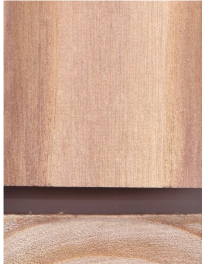
Slika 5. Piljenica paulovnije

Drvo paulovnije se u Aziji koristi za gradnju drvnih konstrukcija i drugih sličnih primjena. Čvrstoća drva nije velika tako nije primjerena kada je potrebna mehanička čvrstoća, ali svejedno ima široku primjenu kod kuća (slika 11.) (Zhao-Hua i sur., 1986.). Manjak čvrstoće se nadomještava većim dimenzijama građe.