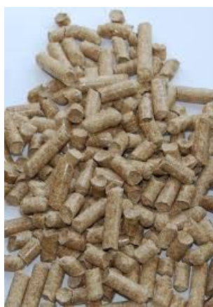
Slika 7. Peleti od paulovnije

jer navodi se da je koncentracija pepela dovoljno mala te je moguća proizvodnja peleta visoke kvalitete. Drvo paulovnije u svakom slučaju može ispuniti zahtjeve za najbolju standardnu klasu peleta (EN plus A1) (Kamperidou i sur., 2018). Problem je u gustoći, jer drvo paulovnije ima malu gustoću, ali to se može nadomjestiti velikim godišnjim prirastom stabla. Ako se gustoća poveća (komprimiranje usitnjenog drva) (slika 14.) ogrjevno drvo tako može imati visoku temperaturu. Tako usitnjavanje drva paulovnije i izrada peleta svakako može smanjiti troškove proizvodnje i u konačnici cijenu peleta i briketa u odnosu na druge vrste drva.