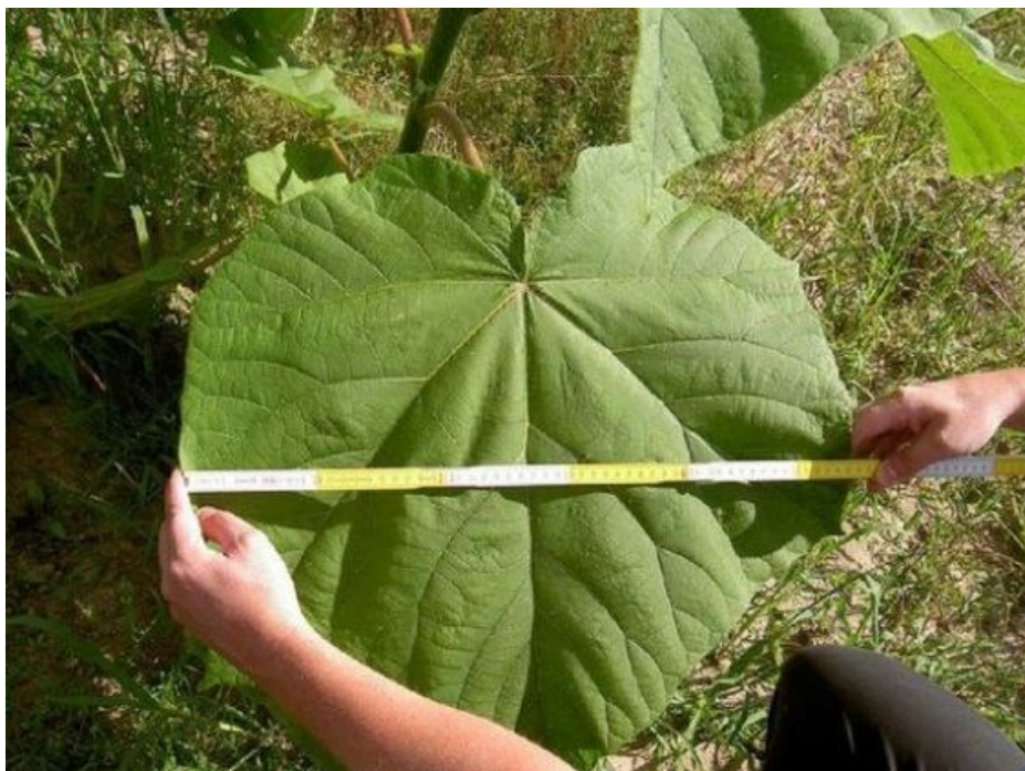
Slika 2. Mjerenje lista klona paulovnije

Paulovnja se naziva i kinesko carsko drvo, princezino drvo ili Kiri drvo (Zhao-hua i sur., 1986). Ostatku svijeta postala je zanimljiva za uzgoj radi iznimno brzog rasta. Većina vrsta paulovnije mogu se komercijalno koristiti već nakon 15 godina, a sirovina niže kvalitete već nakon 6 do 7 godina (Ates i sur., 2008). Zbog brzog rasta dovodi se u pitanje njen utjecaj na okoliš jer ima velike zahtjeve za vodom i hranjivim tvarima. Paulovnja je vrlo agresivna vrsta koja se brzo rasprostranjuje po prirodnim staništima uključujući šume, obalna područja i strme krševе (Remaley, 2005). Iz tog razloga postaje veliki problem domicijalnom staništu, jer nakon sadnje paulovnije postoji mogućnost problema s iskorijevanjem iste. Nakon sječe, potrebno je cijeli korijenov sustav u potpunosti odstraniti jer dijelovi mogu proklijati (Remaley, 2005). Paulovnja također ima vrlo velike listove te tako stvara sjenu drugim biljkama, a na taj način „krade“ svjetlost i potiče svoj rast (Slika 2.). Listovi mogu doseći duljinu od 15-30 cm i širinu od 10-12 cm (Icka i sur., 2016).