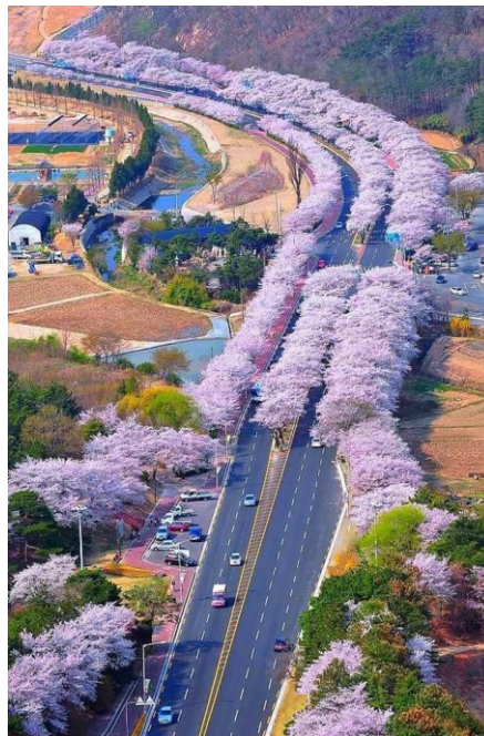
Slika 6. Paulovnica u cvatu kraj prometnice

razlog tomu su isključivo ljudi koji uglavnom ne istražuju o mogućim posljedicama sadnje paulovnije već žele postići što veću ekonomsku korist. Stoga sade stabla iz sjemenja koji kupuju putem interneta, a ne iz ovlaštenih plantažnih nasada koji reguliraju invazivnost tj. uzgajaju klonove. Time se stvara veliki problem šumarima koji će teško suzbiti paulovnicu ako se krene nekontrolirano širiti. Uz nedostatke također postoje i prednosti. Jedna takva je da je paulovnica medonosna biljka, te bi tako pomogla pčelarima i pčelama. Također se koristi kao ukrasno stablo. Mnogi parkovi i vrtovi u Europi su staništa paulovnije. Kao ukrasno stablo u gradskim parkovima može pomoći u pročišćavanju zraka. Stablo paulovnije adsorbira oko 22 kg CO 2 i ispusti 6 kg O 2 u jednoj godini rasta (Icka i sur., 2016). Tako da sadnja uz prometnice (slika 13.) ili u centru grada gdje je zagađenje veliko može pomoći smanjenjem zagađenja zraka.