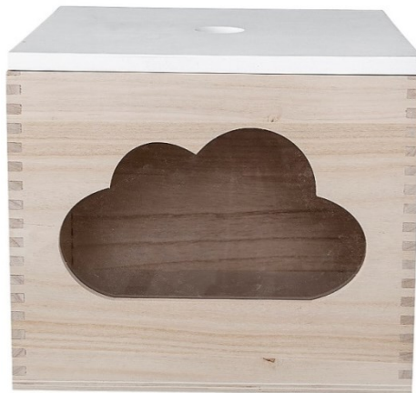
Slika 5. Ukrasna kutijica izrađena od paulovnije

peleta (EN plus A1) (Kamperidou i sur., 2018). Uz dobra svojstva za izradu peleta i veliki prinos, može se koristiti u proizvodnji papira uz kombiniranje s drugim materijalima radi smanjenja troška proizvodnje. Drvna vlakanca P. elongate mogu se koristiti u papirnoj industriji ako se pomiješaju s dugim vlaknastim materijalima kao što su slama, kukuruzna trska i sl. (Ates i sur.,2008). Glavna prednost paulovnije je mala masa koja stoga paulovnicu svrstava kao poželjno drvo za ambalažu. Paulovnica ima oko 40% manju masu od ostalih vrsta drva pa se tako povećava volumen za dostavu zbog manje mase ambalaže (Zhao-Hua i sur., 1986). Mala gustoća drva može biti prednost, kao na primjer u industriji ambalaže (Koman i Feher, 2020). Ambalaža od drva paulovnije smanjuje ukupnu masu tereta te omogućuje prijevoz veće količine dobara ili smanjuje potrošnju goriva tokom prijevoza. Uz ambalažnu primjenu, spominje se uporaba drva paulovnije za izolaciju. Vuna od drva paulovnije idealan je materijal za filtre, izolacijski materijal za sisteme za hlađenje, a piljevina za pokrivanje podova štala ili posuda za nuždu kućnih životinja ili za proizvodnju igračaka (Zhao-Hua i sur., 1986) (slika 8.).