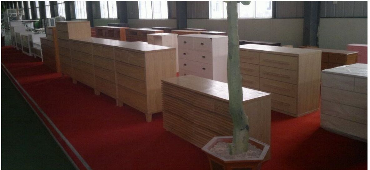
Slika 6. Namještaj od paulovnije

Drvo paulovnije se koristi i za izradu raznih drvnih ploča. Trupci paulovnije velikih su promjera i bez kvrga te se drvo dobro lijepi i dobar je materijal za furnirske ploče (Zhao-Hua i sur., 1986). Uz furnirske ploče, izrađuju se masivne ploče i stolarske ploče. Drvo paulovnije ima dobra akustična svojstva pa se tako koristi za izradu tradicionalnih instrumenata (Slika 10.). Glasnjača kineskih tradicionalnih instrumenata uvijek se izrađuje od paulovnije (Zhao-Hua i sur., 1986).