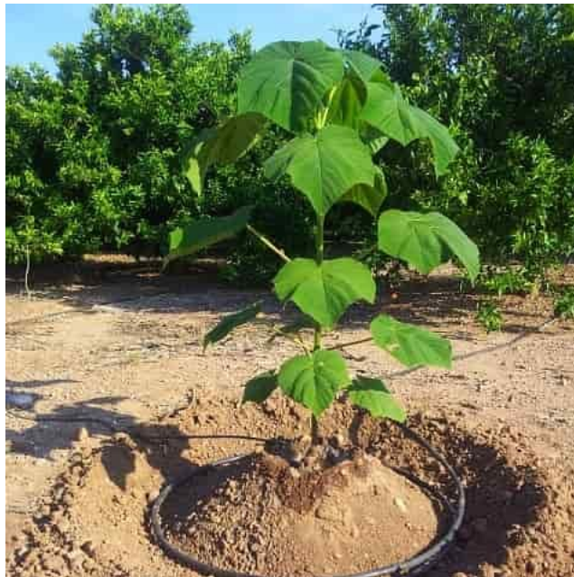
Slika 3. Navodnjavanje sadnice paulovnije (Izvor: https://www.kalliergeia.com )

Paulovnja ima velike zahtjeve za vodom, naročito u toplim mjesecima. Brzo raste u periodu od lipnja do rujna. U tom je periodu oko 65% godišnjih padalina što je u skladu s periodom rasta vrste (Zhao-Hua i sur., 1986). Iz tog se razloga prilikom sadnje paulovnije treba postaviti sustav za navodnjavanje koji bi osigurao potrebnu količinu vode (30-40 litara unutar 1-2 tjedna, po biljci) (Slika 3.). Sustav navodnjavanja prskalicama koji je primijenjen u pokusu rezultirao je porastom broja listova paulovnije i njihove površine, što je rezultiralo povećanjem godišnjeg prirasta (Ptach i sur., 2018). Nakon nekoliko godina sustav navodnjavanja više nije potreban jer stablo postaje otpornije zbog razvijenog korijenovog sustava te zahtijeva vrlo malo održavanja (El-Showk S. i El-Showk N., 2003).