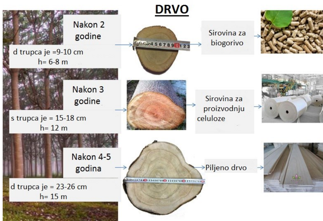
Slika 1. Prikaz rasta paulovnije u određenim vremenskim razdobljima

U današnje vrijeme sve je veća potreba za drvnom sirovinom. Dio te potrebe pokušava se zadovoljiti sadnjom brzorastućih vrsta drva. Brzorastućim vrstama drva smatraju se one vrste drva koje u kratkom vremenskom razdoblju postižu optimalni promjer tj. imaju ekstremno brzi prirast. U te vrste spada i Paulownia sp. , koja je izrazito brzog rasta (ophodnja od 5 do 10 godina) (Sedlar i sur., 2020). Paulovnja potječe iz jugoistočne Azije, odnosno s prostora Kine i Japana. U normalnim uvjetima nakon 10 godina stablo Paulovnije dostiže prsni promjer od 30 - 40 cm i volumen od 0,3 – 0,5 m 3 (Zhao-Hua i sur., 1986). Takve vrste se uglavnom koriste za proizvodnju drvnih vlakana i biomase radi velike potrebe za sirovinom koja se može ostvariti kratkom ophodnjom stabala. Paulovnja je karakteristična radi vrlo brzog rasta u juvenilnoj fazi rasta. Vertikalni rast je do 4 m tijekom druge godine, a unutar istog vremenskog perioda rast u promjeru je oko 5 – 7 cm (Vilotić i sur., 2013).