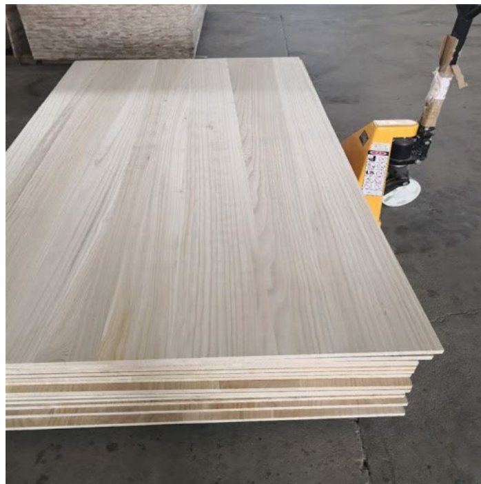
Slika 8. Masivne ploče paulovnije