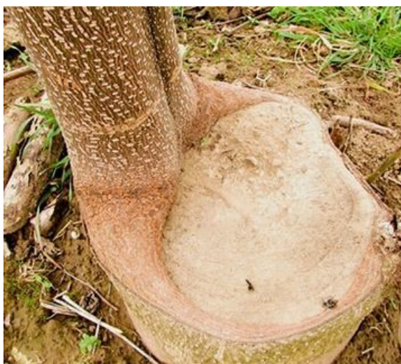
Slika 9. Rast paulovnije iz panja već oborenog stabla

Paulovnja je stablo koje potječe iz jugoistočne Azije i još uvijek je nepoznanica u Europi. U Europi se tek otkriva kao materijal za industrijsku ili drugu proizvodnju i to uglavnom od klonova paulovnije. Primjena drva paulovnije je široka, ide od industrijskih primjena, kroz agro-kulturne i medicinske primjene do ukrasnih funkcija u parkovima i vrtovima (Koman i sur., 2017). Problem tijekom uzgoja paulovnije su veliki zahtjevi za vodom tijekom rasta (ljetni mjeseci) i potrebe za velikim ulaganjima da bi se ostvarili idealni uvjeti za rast. Paulovnja raste brzo od lipnja do rujna, a u Aziji 65% godišnjih padalina je unutar tog razdoblja (Zhao-Hua i sur., 1986). Za idealan rast neke domaće vrste kao hrastovine ili topolovine je također poželjno imati plantažne nasade te tako osigurati što veću kvalitetu sirovine, a po potrebi primijeniti i navodnjavanje. Paulovnja nakon obaranja ponovno raste iz panja, točnije rast kreće iz bijeli (slika 12).