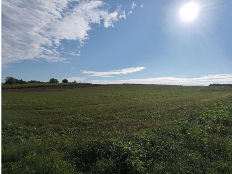
Slika 13. Rezultat korištenja premale količine sjemena prilikom sjetve

U nedostatku ekološki certificiranog sjemena člankom 22. Uredbe 834/2007 i člankom 45. Uredbe 889/2008 propisani su uvjeti pod kojim se može koristiti konvencionalno sjeme u slučaju da isto nije upisano u bazu sjemena ili dobavljač količine, naručene u razumnom roku, ne može isporučiti. Konvencionalno sjeme može se koristiti ukoliko nije tretirano sredstvima za zaštitu bilja koji nisu dopušteni Uredbama. Odobrenje za korištenje konvencionalno sjemena izdaje kontrolno tijelo temeljem Zakona o poljoprivredi i njegova članka 105. stavak 2. Odobrenje mora biti izdano prije same sjetve.