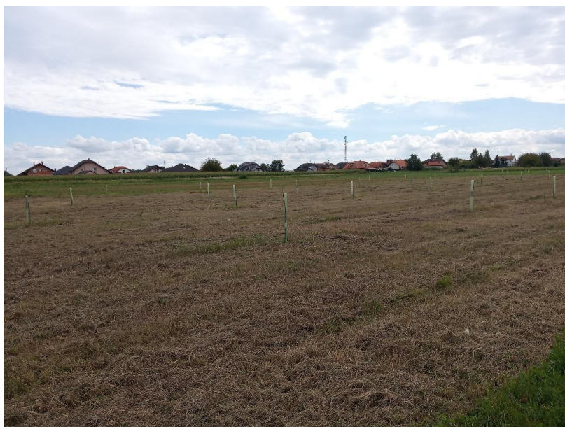
Slika 14. Prikaz zaštite mladog nasada oraha tulijevim cijevima