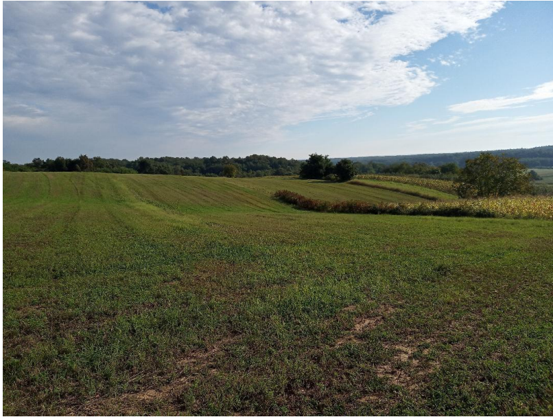
Slika 8. Prikaz prirodne drvenaste grmolike zaštitne barijere

Usljed reljefnih promjena parcele se mogu nalaziti na različitim visinama (slika 9). Zbog korištenja kemijskih sredstava na konvencionalnim poljima poželjnije je da se parcele pod ekološkim uzgojem nalazi na povišenijem dijelu zbog ispiranja tla vodom.