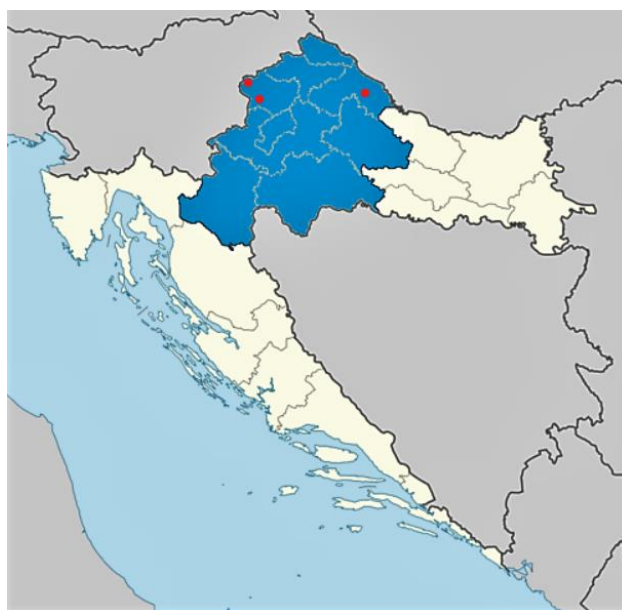
Slika 6. Karta Hrvatske sa obilježenim područjima provedenog istraživanja

Za potrebu izrade ovog diplomskog rada, autorica je provela dva radna dana na terenu sa ovlaštenom kontrolorkom iz poduzeća HŠ d. o. o. Zagreb. Terenski izvid obuhvatio je pet OPG-a koja se bave poljoprivrednom proizvodnjom, što spada prema Pravilniku u A kategoriju- Proizvođači, potkategorija - biljna proizvodnja. Pregledani OPG-ovi imaju sklopljen ugovor na neodređeno, temeljem članka 18. Pravilnika o kontrolnom sustavu ekološke poljoprivrede, sa ovlaštenim kontrolnim tijelom HŠ d.o.o. Zagreb. Terensko istraživanje provedeno je na područjima: Desinić, Tuhelj i Đurđevac (Slika 6).