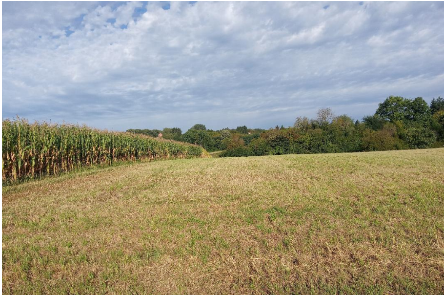
Slika 10. Eko parcela uz parcelu sa konvencionalnom proizvodnjom

Odvijanje certificirane ekološke poljoprivrede uz parcelu sa konvencionalnom poljoprivredom, a bez zaštitnih barijera, nije dozvoljeno (slika 10).