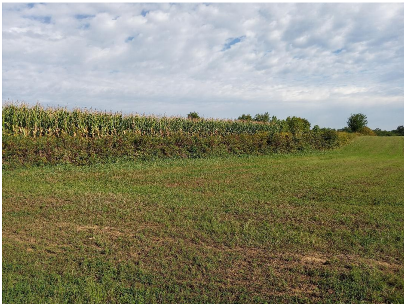
Slika 9. Visinska razlika između parcela

Usljed reljefnih promjena parcele se mogu nalaziti na različitim visinama (slika 9). Zbog korištenja kemijskih sredstava na konvencionalnim poljima poželjnije je da se parcele pod ekološkim uzgojem nalazi na povišenijem dijelu zbog ispiranja tla vodom.