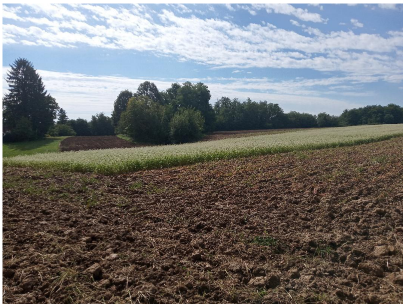
Slika 12. Prikaz zaoranih dijelova oranice heljdom i ostavljene heljde u cvatnji zbog sjemena