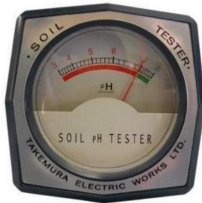
Slika 11. Prikaz pH-metar

te može sam pomoću analognog pH- metra (slika 11) jeftinom metodom odrediti pH svojstvo svoga tla ili pomoću digitalnog pH- metra utvrditi potrebu za dopuštenim gnojivima.