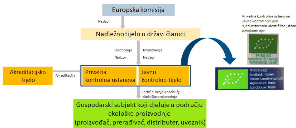
Slika 4. Sustav ekološke kontrole unutar Europske unije