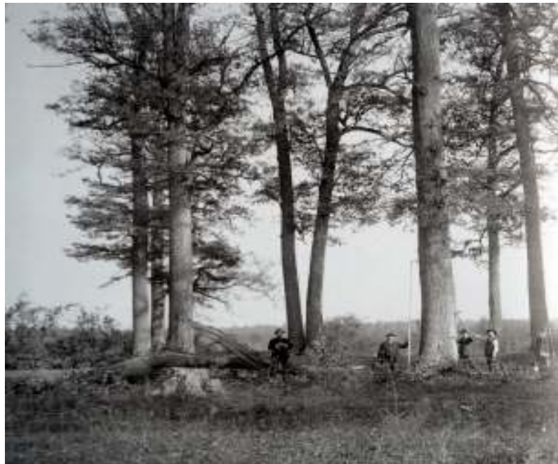
Slika 1. „Trizlovi – odabranici za dovršni sijek“