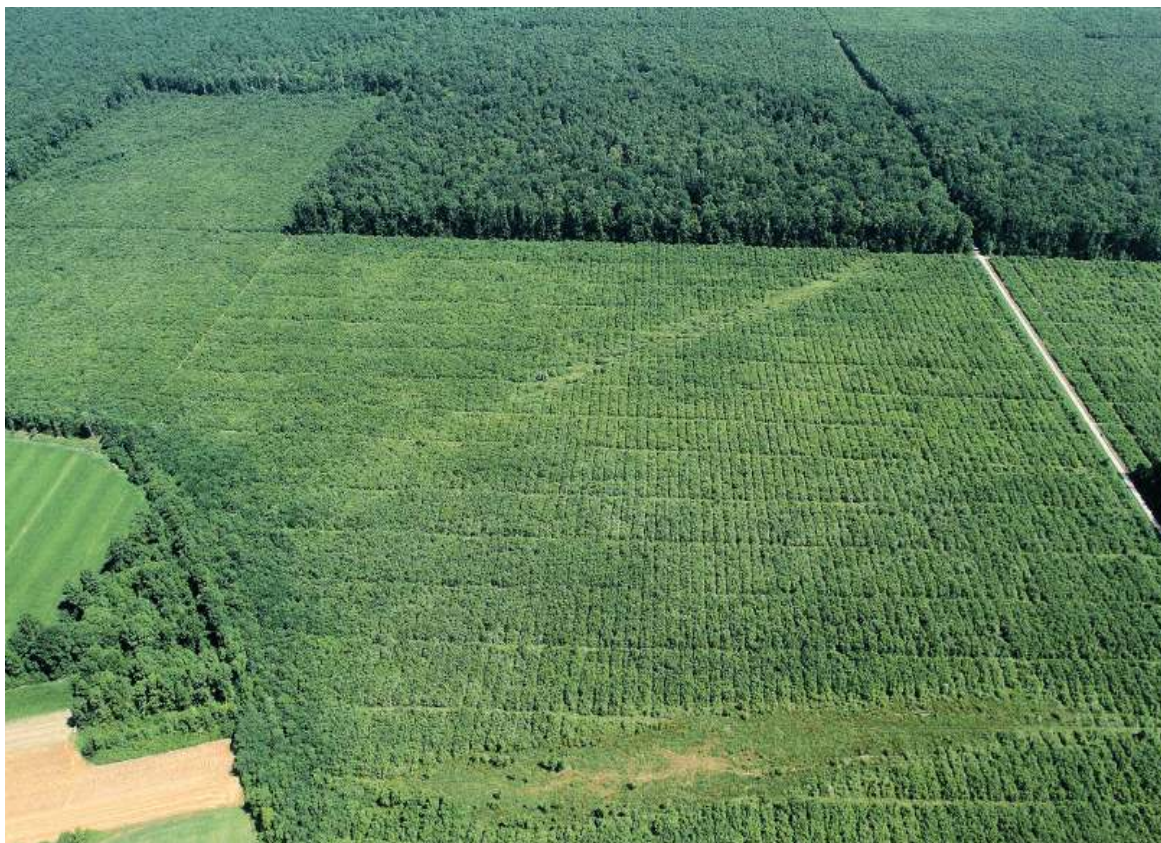
Slika 6. Formirana mreža izvoznih vlaka i uzgojnih staza u hrastovom pomlatku (Z. Tanocki)

istraživanja, intenzitet odumiranja stabala lužnjaka povećao se sa starošću sastojina i bio je veći u sastojinama V., VI., i VII. dobnog razreda. Također, na osnovi istraživanja autori zaključuju da su klimatski, hidrološki i strukturni čimbenici imali utjecaj na odumiranje ove vrste. Lužnjakova stabla osjetljiva su na klimu i klimatske promjene, pa je tako na njegovo odumiranje uvelike utjecala maksimalna ljetna i srednja godišnja temperatura zraka, količina oborina u proljeće i godišnja količina oborina. Učestalost sušnih i izostanak kišnih razdoblja, smanjenje srednjeg i minimalnog vodostaja vodotoka, te pad razine podzemne vode, pogotovo u dubljim slojevima pedosfere također značajno utječu na njegovo sušenje.