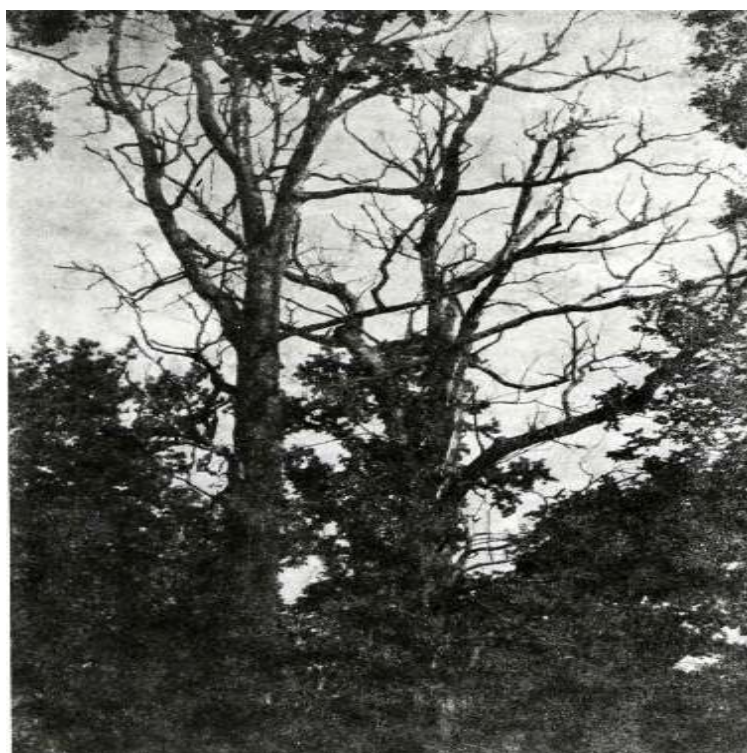
Slika 3. Skupina oštećenih stabala hrasta lužnjaka (1988.)

Prema istraživanju iz 1988. godine oštećeno je 38% lužnjakovih stabala u Hrvatskoj. Autor smatra da su naše najvrijednije nizinske šume hrasta lužnjaka u dolinama Save i Drave ozbiljno ugrožene radi promjene vodnog režima. Do promjene vodnog režima dolazi zbog različitih vodotehničkih zahvata kao što su regulacije rijeka te izgradnje hidrocentrala (Prpić i sur., 1988). Poseban problem predstavlja propadanje šuma u GJ „Žutica“ gdje je u razdoblju od 1988. – 1995. godine posječeno sanitarnom sječom sušaca 26 269 m 3 . Osim promjene vodnog režima, na sušenje je utjecala i izgradnja šumskih prometnica u duljini od 76 km te istraživanja i vađenja nafte i plina na 289 bušotina (Rauš i sur., 1996).