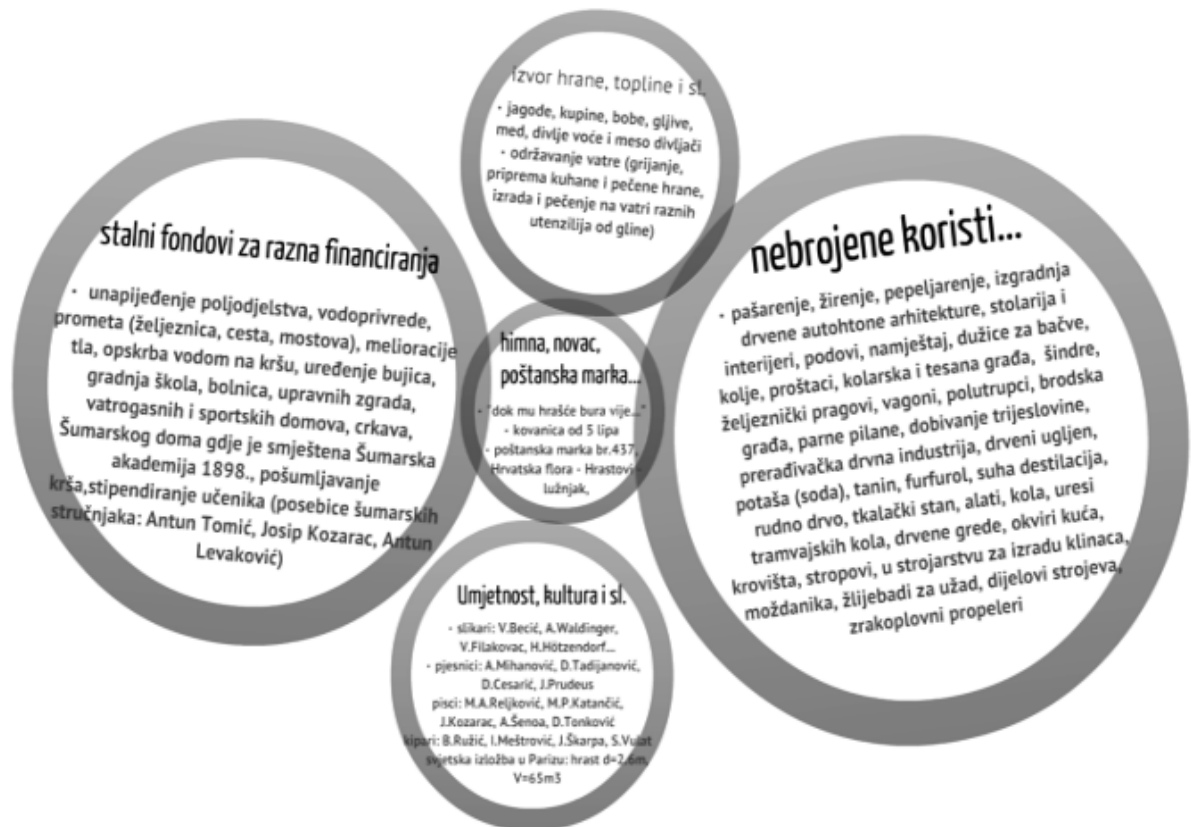
Slika 7. Doprinos hrasta lužnjaka Hrvatskoj; izvor: Zaštita od glodavaca (Rodentia, Murinae, Arvicolinae) u šumama hrasta lužnjaka ( Quercus robur L.) – Integrirani pristup i zoonotički aspekt, Vucelja M., 2013.