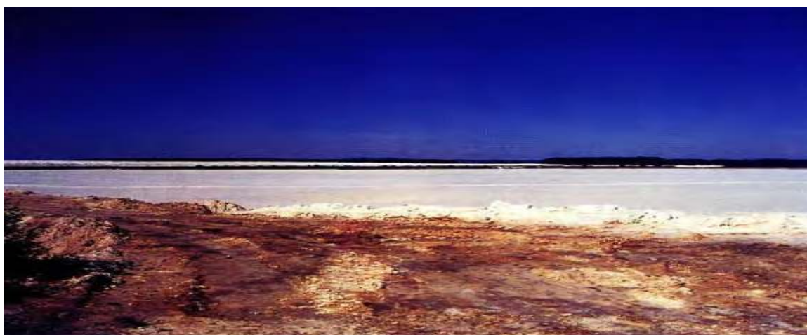
Slika 5. Izgled kazeta u koje se odlaže fosfogipsa

U neposrednoj blizini odlagališta fosfogipsa na području Kutinskog bazena primijećeno je sušenje i propadanje hrasta lužnjaka. Provedeno je istraživanje o tom problemu, sluteći da je do odumiranja lužnjaka došlo zbog utjecaja fosfogipsa, nusprodukta koji nastaje kod proizvodnje umjetnih gnojiva. Hrast lužnjak u blizini tog odlagališta sa 60-70% oštećenosti krošnje pripada kategoriji jako oštećenih stabala. Provedenim istraživanjem utvrđeno je da postoji poveznica između odlaganja fosfogipsa i propadanja stabala hrasta (Roša, 1998).