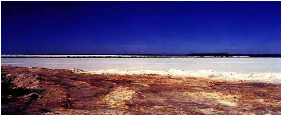
Slika 5. Izgled kazeta u koje se odlaže fosfogipsa

U neposrednoj blizini odlagališta fosfogipsa na području Kutinskog bazena primijećeno je sušenje i propadanje hrasta lužnjaka. Provedeno je istraživanje o tom problemu, sluteći da je do odumiranja lužnjaka došlo zbog utjecaja fosfogipsa, nusprodukta koji nastaje kod proizvodnje umjetnih gnojiva. Hrast lužnjak u blizini tog odlagališta sa 60-70% oštećenosti krošnje pripada kategoriji jako oštećenih stabala. Provedenim istraživanjem utvrđeno je da postoji poveznica između odlaganja fosfogipsa i propadanja stabala hrasta (Roša, 1998).