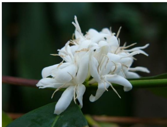
Slika 2. Coffea arabica – cvjetovi. Wikiwand, 2020b.