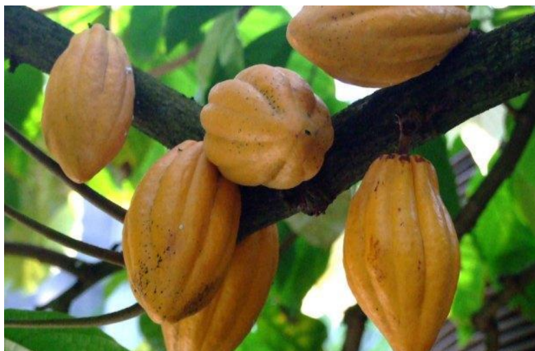
Slika 8. Theobroma cacao L. - plodovi. Kew Science, 2020.