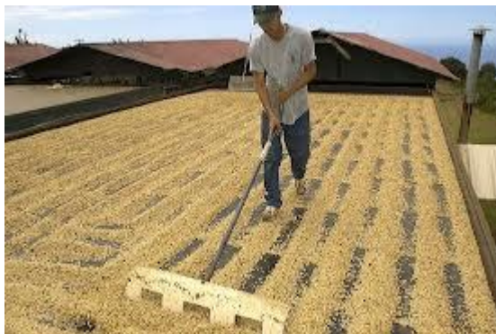
Slika 3. Obrada zrna kave – sušenje. Wikiwand, 2020c.