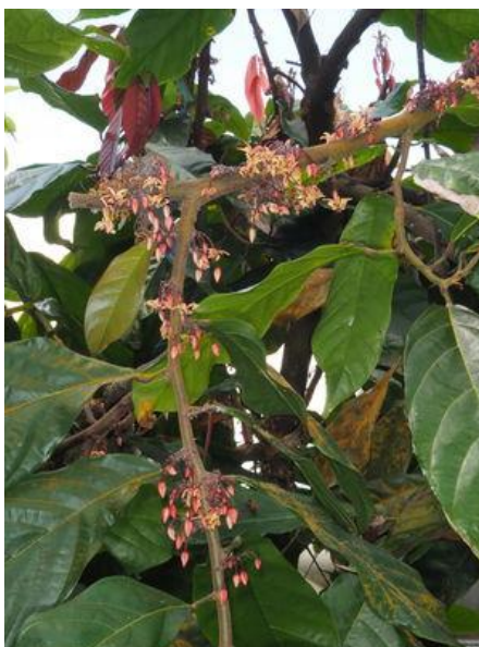
Slika 6. Theobroma cacao L. - listovi i cvjetovi. Kew Science, 2020.

Kakaovac raste u suptropskom i tropskom području, s velikom godišnjom količinom oborina, od 1000 do 3000 mm (raspon od 480 do 4290 mm) i srednjom godišnjom temperaturom od 18 do 28,5 °C. Raste na različitim tipovima tala, čija je pH od 4,3 do 8,7. Tlo treba biti bogato hranjivima, dobro propusno, vlažno i duboko. Većinom dolazi na nadmorskim visinama do 300 m, a u Kolumbiji i do 900 m. Kakaovac nije tolerantan na vjetar pa se sadi na zaštićenim položajima. Nije tolerantan na sušu te zahtjeva visoku zračnu vlagu i velike količine oborina. Biljke su tolerantne na zasjenu (Morton, 1987).