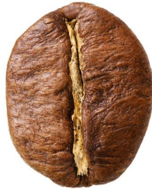
Slika 5. Zrna kave C. arabica i C. robusta .