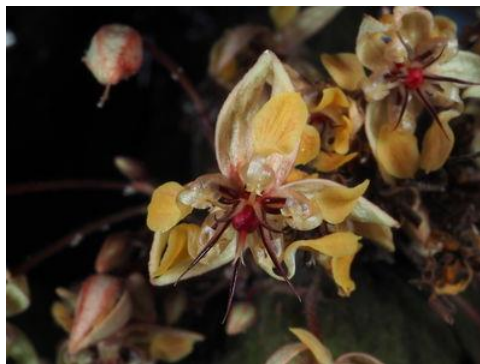
Slika 7. Theobroma cacao L. - cvijet. Kew Science, 2020.