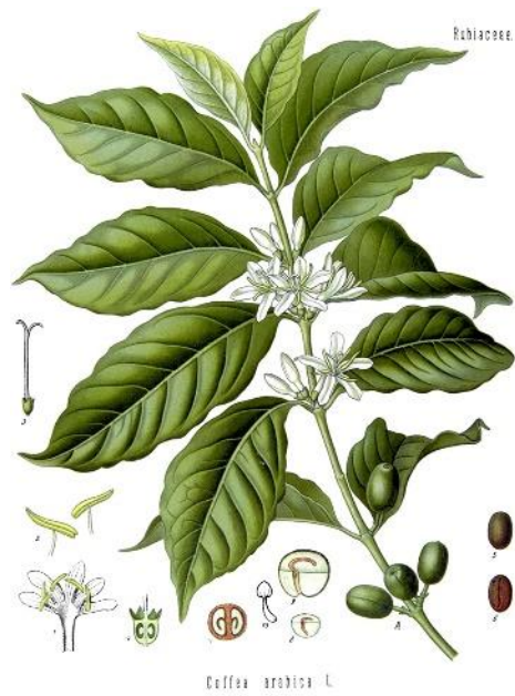
Slika 1. Coffea arabica - listovi. Wikiwand, 2020a.