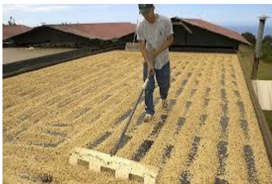
Slika 3. Obrada zrna kave – sušenje. Wikiwand, 2020c.