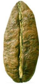
Slika 4. Zrno kave C. liberica . Wikiwand, 2020d.