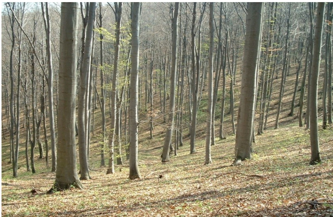
Slika 3 Bukova šuma sa žutom grahoricom.