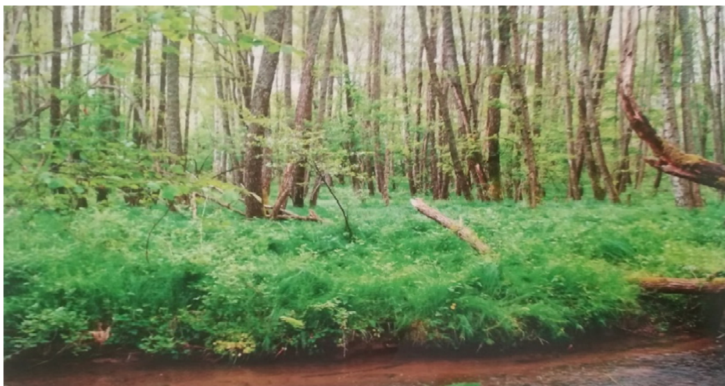
Slika 10 Šuma crne joha sa blijedožučkastim šašem