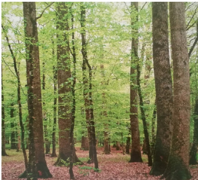
Slika 7 Šuma hrasta lužnjaka i običnog graba.

fitocenolozi Pocs i Soo (1958) ovu asocijaciju imenovali Quercus robori-Carpinetum betuli , a hrvatske su označili pridjevima slavonicum i praeillyricum . Zatim su Soo (1962,1964) i Borhidi (1963) dali novi naziv Fraxino pannonicae-Carpinetum betuli smjestivši je u svezu ilirskih bukovih šuma. Anić (1965) je prihvatio inverzni naziv od Quercus robori-Carpinetum betuli . Zajednica pridolazi u središnjim i jugoistočnim dijelovima Požeške gore (Baričević 2012). To su zaravni ili blaže padine, južnih ili istočnih izloženosti i nadmorskih visina od 85 do 150 m. Asocijacija raste na ocjedinim povišicama ili gredama (tlo nije izloženo poplavama), na pseudoglejnom, odnosno podzolastom tlu koje se slabo kiselo do neutralno. U sloju drveća se nalaze hrast lužnjak i obični grab, zatim Fraxinus angustifolia , Ulmus minor , Glechoma hederacea i dr. Sloj grmlja čine Corylus avellana , Cornus sanguinea , Euonymus europaeus , Rosa arvensis i druge. Prizemno rašće čine Stellaria holostea , Galium sylvaticum , Vinca minor , od mezofilnih vrsta tu su Anemona nemorosa , Hedera helix , Pulmonaria officinalis , Veronica montana , Asarum europaeum , Arum maculatum i ostale. Zajednica hrasta lužnjaka i običnog graba nastala je prirodnom sukcesijom iz šume hrasta lužnjaka s velikom žutilovkom. Ova se sastojina odražava dobrom kvalitetom i stabilnošću.