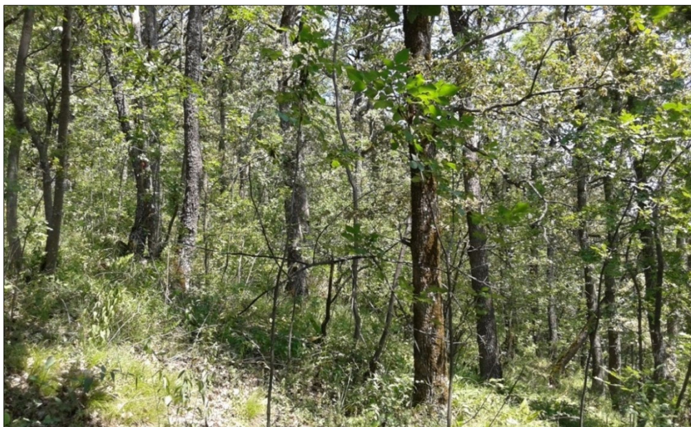
Slika 5 Sastojina hrasta medunca.

Florni sastav u sloju drveća čine hrast medunac i crni jasen, cer, klen i brekinja. U sloju grmlja prevladavaju Fraxinus ornus , Cornus mas , Rosa arvensis , Ligustrum vulgare , Pyrus pyraeaster , Viburnum lantana , Sorbus torminalis i dr. Sloj prizemnog rašća je obilno razvijen dolaze Carex flaca , Tanacetum corymbosum , Galium lucidum , Veratrum album , Melittis melissophyllum , Buglossoides purpureocaerulea i druge. Iz reda Fagetalia pojavljuju se Hedera helix , Helleborus odorus , Brachypodium sylvaticum , Cruciata glabra , Clinopodium vulgare . Također su prisutne i vrste otvorenih staništa Juniperus communis i Clematis alba . Medunčeve sastojine imaju više zaštitni karakter, te veliko značenje u zaštiti tla i očuvanju biološke raznolikosti. Sastojine hrasta medunca na južnom Papuku su pretežito panjače, lošije kakvoće i nepotpunog sklopa (Lončarević 2017).