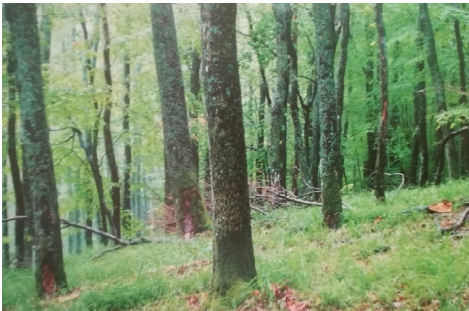
Slika 9 Šuma hrasta kitnjaka s brdskom vlasuljom.

5. Šuma hrasta kitnjaka s vlasuljom ( Festuco drymeiae-Quercetum petraeae , (Janković 1968), Hruška-Dell`Uomo, 1975.) - prva ju je opisala Hruška služeći se sastojinama sličnoga florističkoga sastava na Fruškoj gori (Janković & Mišić 1954, Janković, Mišić & Popović 1961, Janković 1968, Janković & Mišić 1980) gdje su po prvi puta ustanovljene i imenovane kao Festuco drymeiae-Quercetum . Potpuno poznavanje asocijacije provela je Hruška-De`Uomo (1974,1975) na području Moslavačkog gorja. Baričević (2002) ju je istražio na Požeškoj gori. Asocijacija se razvija na toplim, prisojnim padinama južne i jugozapadne ekspozicije. Raste na nadmorskoj visini od 200 do 500 m, tip tla na kojem dolazi su uglavnom luvisol tipični na silikatnom supstratu, no razvija se i na luvisolu pseudoglejnom na silikatnom supstratu, distričnom kambisolu na škriljevcu. Sloj drveća tvori hrast kitnjak, s manjim udjelom crnog jasena i brekinje. U sloju grmlja veći udio imaju Fraxinus ornus , Genista tinctoria , Sorbus torminalis , Quercus petraea i dr. U sloju prizemnog rašća potpuno prevladava Festuco drymeia . Za njom dolaze i vrste Carex pilosa , Luzula pilosa , Stellaria holostea , Melica uniflora , Brachypodium sylvaticum , Euphorbia amygdaloides i Carex sylvatica . Ove sastojine su većinom panjače, što smanjuje gospodarsku vrijednost.