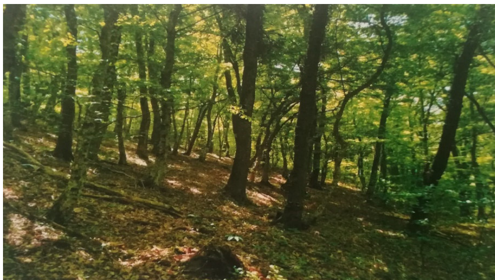
Slika 8 Šuma hrasta kitnjaka i običnog graba.