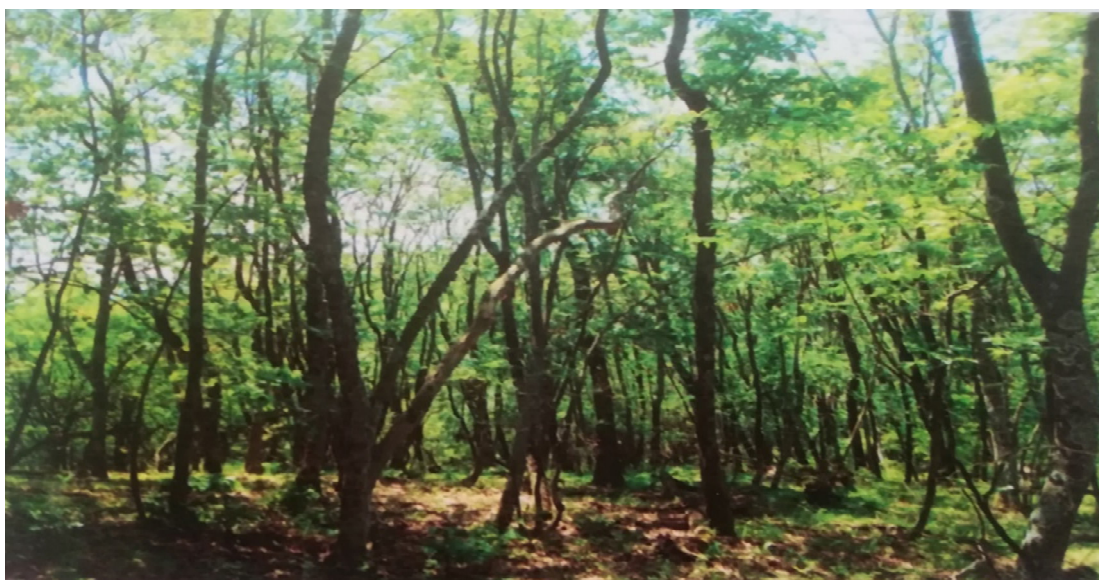
Slika 6 Sastojina sladuna.

Baričević i dr. (2015) u okolini Kutjeva. Na slavonskom gorju je rasprostranjen na južnim padinama Krndije. Dolazi na južnim ekspozicijama i nadmorskim visinama do 400 m. Raste na podlozi koju čine prapor i praporasti sedimenti na kojima je razvijeno ilimerizirano tipično i pseudoglejno tlo. Florni sastav čine hrast sladun, uz manji udio hrasta cera i kitnjaka. Sloj grmlja je dobro razvijen, a u njega pridolaze Pyrus pyraister , Chamaecytisus supinus , Genista tinctoria , Carpinus betulus , Acer campestre , Fraxinus ornus , Ligustrum vulgare i dr. Od prizemnog rašća rastu Dactylis glomerata , Helleborus croaticus , Potentilla micrantha , Glechoma hirsuta , Carex flacca , Brachypodium sylvaticum i druge. Ova zajednica ima veliku prirodnoznanstvenu vrijednost. Zajednica se na padinama Krndije nalazi na zapadnoj granici svog areala, a inače pridolazi u Slavoniji i na par mjesta u Dalmaciji.