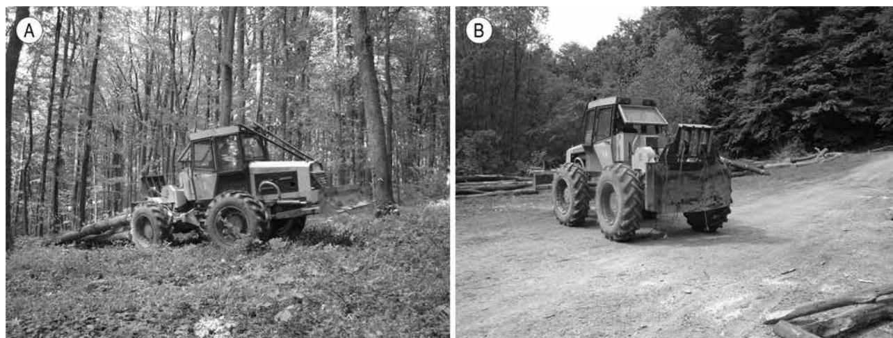
Slika 1. Ecotrac 120V na vlaci (A) i na pomoćnom stovarištu (B) Fig. 1 Ecotrac 120V on skidding trail (A) and on landing site (B)

Terenska su istraživanja provedena na dvama radilištima. Radilište A (odsjek 2 A) nalazi se na području Uprave šuma podružnice Bjelovar, Šumarije Garešnica, u gospodarskoj jedinici »Dišnica-Zobikovac-Petkovača«, a radilište B (odsjek 46 A) nalazi se na području Uprave šuma podružnice Koprivnica, Šumarije Đurđevac, u gospodarskoj jedinici »Đurđevačka Bilogora«. Na radilištu A, u mješovitoj sastojini bukve (48,74 %), hrasta kitnjaka (4,47 %), graba (21,06 %) i lipe (15,65 %), u dobi od 57 godina, obavljena je proredna sječa. Posječeno je 34,07 m 3 /ha, a prosječni obujam posječenoga stabla iznosi 0,63 m 3 . Na radilištu B, u bukovoj (92,03 %) sastojini, u dobi od 111 godina, obavljen je dovršni sijek. Posječeno je 89,50 m 3 /ha, a prosječni obujam posječenoga stabla iznosi 3,51 m 3 . U oba istraživana slučaja primijenjena je poludeblovna metoda privlačenja drva skiderom Ecotrac 120V. Na radilištu A drvo je privlačeno