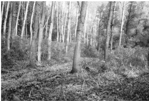
Slika 2. Sastojina euroameričke topole, odsjek 68 C Fig. 2 Euroamerican poplar stand, subcompartment 68 C