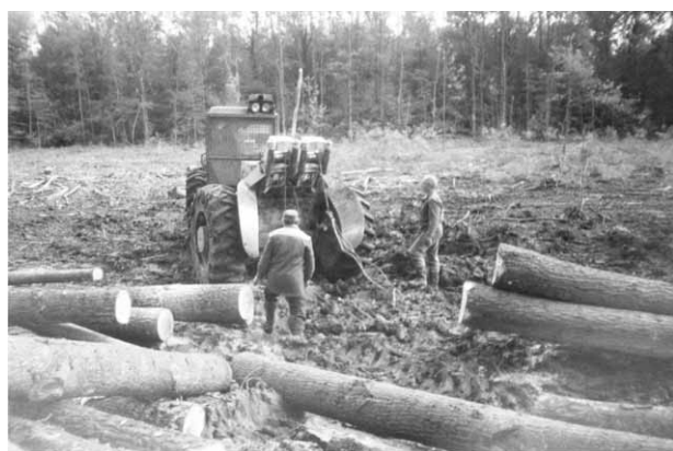
Slika 5. Traktor Timberjack 240C na pomoćnom stovarištu Fig. 5 Tractor Timberjack 240C on landing

gustoga grmlja i slabe vidljivosti traktor je s glavne vlake prilazio oborenim deblima. Na radilištu su se istodobno odvijala sječa i izrada drvnih sortimenata i privlačenje drva, s tim da se dorada, trupljenje, mješenje i preuzimanje izrađenih drvnih sortimenata odvijalo na pomoćnom stovarištu.