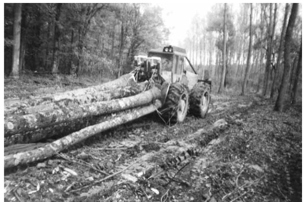
Slika 4. Traktor Timberjack 240C na vlaci Fig. 4 Tractor Timberjack 240C on skid trail

manje vrijedne dijelove debala te gubitke pri mjerenju dimenzija izrađenih drvnih sortimenata prema Hrvatskim normama.