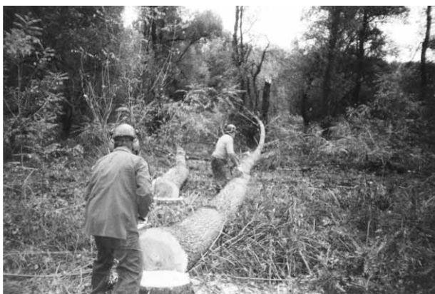
Slika 3. Kresanje grana Fig. 3 Delimiting