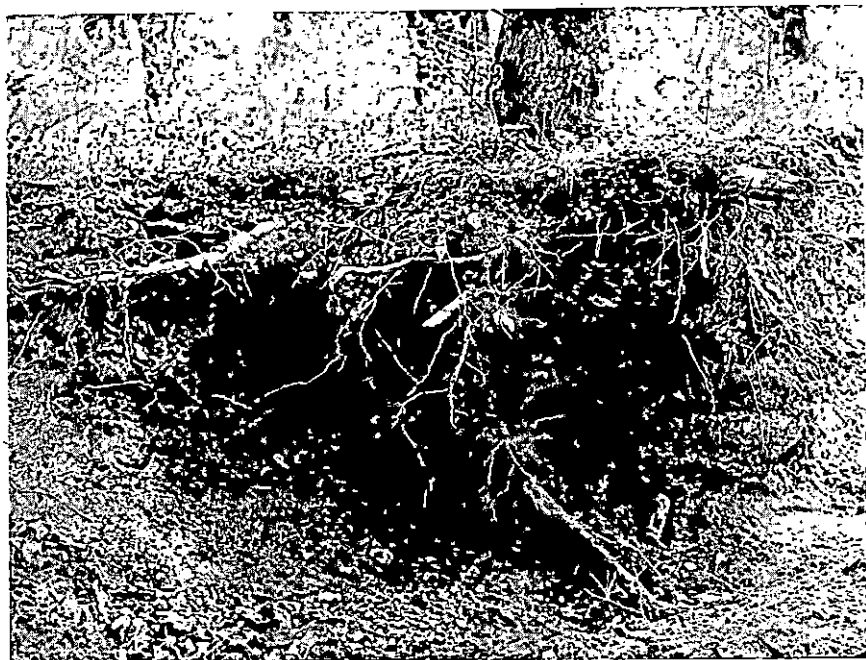
Sl. 1. Razvedenost korijenja 25-godišnjih hrastova u šljunkovitom tlu šume Telek. Abb. 1. Wurzelbildung 25-jähriger Eichen im Schotterboden des Waldes Telek.

DR A. SEIWERTH : Prilozi za poznavanje tla hrastovih šuma u Podravini.