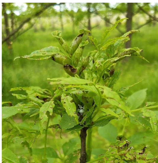
Slika 7. Šiške jasenove lisne muhe šiškarice

Jasenova lisna muha šiškarica ( Dasineura acrophila Winnertz) pripada porodici Cecidomyiidae (muhe šiškarice). Bijele ličinke žive društveno i uzrokuju abnormalan rast lišća. Napadnuto lišće presavija se u smjeru središnje žile prema gore, postaje zadebljano i formira se šiška u kojoj se razvijaju ličinke. Obično je napadnuto lišće na mladim izbojcima. Ima jednu generaciju godišnje, a prezimljuje u tlu. (Skuhravá i dr., 2006)