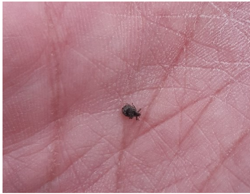
Slika 19. Imago jasenove pipe