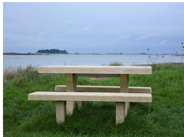
Slika 31. Kamene stol s dvije klupe bez naslona uz more