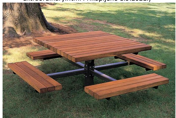
Slika 39. Drveni stol i klupe sa metalnim postoljem.