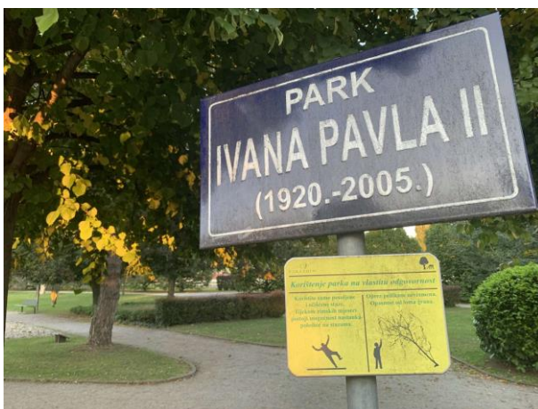
Slika 48. Tabla sa nazivom Parka Ivana Pavla II. u Varaždinu

Neki od dobrih primjera korištenja klupa u parku su klupe postavljene uz stazu, okrenute prema vodenom elementu (Slika 49). Na slici 50. može se vidjeti da su klupe postavljene na ravnoj, stabilnoj i pošljunčanoj podlozi. Iza njih se nalazi živica, a okrenute su prema unutrašnjosti parka. U parku je prisutno proširenje u obliku kruga na čijem rubu je postavljeno 6 zaobljenih klupa od kojih svaka klupa ima tri sjedišta (Slika 51).