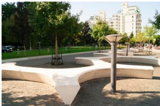
Slika 46. Parkovna klupa od betona

Beton se također može koristiti kao temelj stola ili klupe, ili kao nosač na koji se potom stavljaju letvice od drva ili drvo-plastičnog kompozita. Beton može biti različite boje ili teksture. Betonske klupe i stolovi mogu se napraviti na licu mjesta ulijevanjem betona u kalup ili se dopremaju gotovi elementi. Što se tiče otpornosti na trošenje, beton je najizdržljiviji i može se primjenjivati svugdje i u svim namjenama. Ako mu se doda armatura, imati će jako dug životni vijek. Zbog svoje tvrdoće i upijanja topline, vrlo je neudoban za duži boravak na suncu. Zbog svoje težine, klupe i stolove od betona gotovo je nemoguće pomaknuti (Reliance Foundry Co 2020).