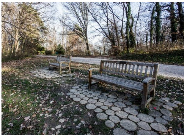
Slika 17. Formalne drvene klupe iz Maksimira

Elegantni „gotički“ dizajn od kovanog željeza je bio popularan krajem 18. i početkom 19. stoljeća. Najčešće su takve klupe u nijansama plave i zelene boje. Dovoljno su