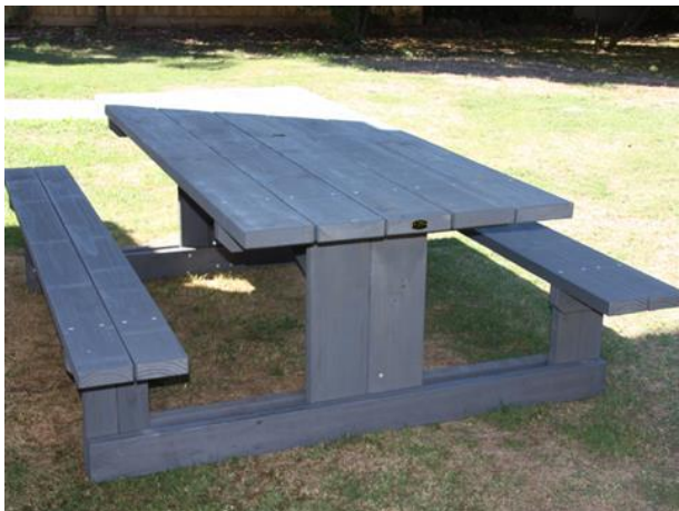
Slika 26. T-okvir piknik garnitura