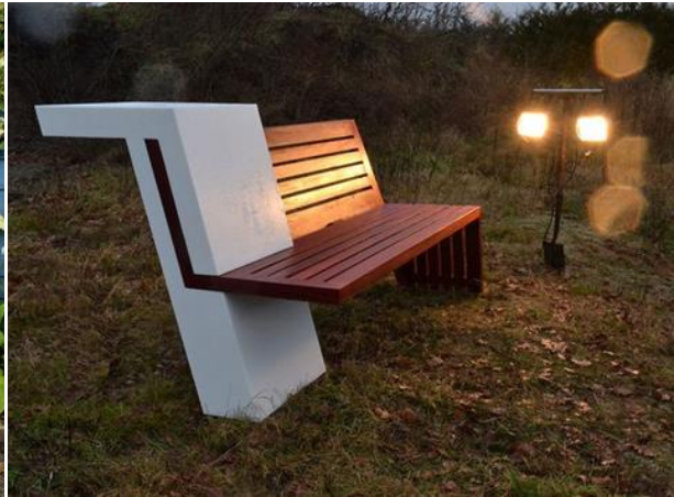
Slika 19. Moderna parkovna klupa