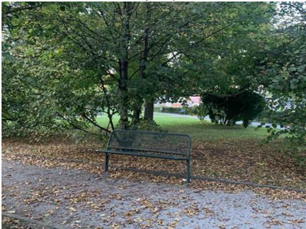
Slika 52. Primjer postavljanja klupe ispred velikog stabla