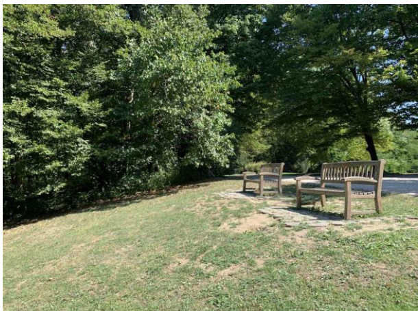
Slika 62. Formalne drvene klupe sa pogledom na dolinu