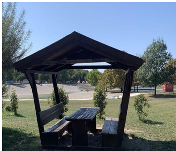
Slika 71. Drvena piknik garnitura s krovom