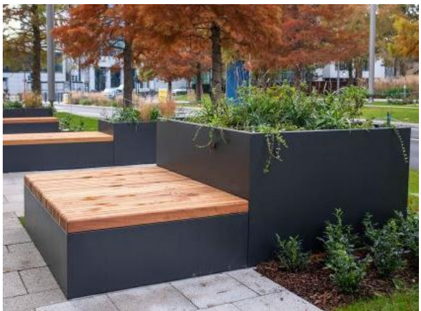
Slika 14. Samostojeća sadilica sa klupom