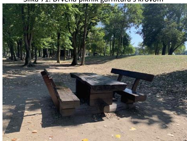
Slika 73. Drvena garnitura za piknik rustikalnog dizajna s naslonom

Osim u sjenicama, setovi rustikalnih klupa i stolova smješteni su i na ne natkrivenim površinama parka (Slika 73). Baš kao i u prethodnim parkovima, parkovne klupe na Bundeku smještene su tako da se pogled korisnika pruža prema odabranim vizurama. U ovom slučaju je to pogled na soliterno stablo i livadu (Slika 74) te jezero (Slika 75).