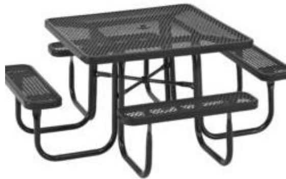
Slika 41. Metalna piknik garnitura

Metalne klupe i stolovi su dugotrajni i ne zahtijevaju česte popravke i dorade. Što se tiče udobnosti metalnih klupa, ona ovisi o dizajnu. One sa debljim letvicama su udobnije od onih sa sitnijim rešetkama. Osim toga, takve klupe su hladne zimi, a vruće ljeti jer je metal dobar vodič topline. Čelične klupe su teške i učvršćuju se, a aluminijske su lagane te su pogodne za premještanje (Reliance Foundry Co 2020). Metalni proizvodi su čvrsti, pouzdani i jednostavni za održavanje. S vremena na vrijeme dovoljno je pokriti metalne površine sa antikorozijskim sredstvom koje onda štiti stolove i klupe od destruktivnog utjecaja vlage (Transsib, službene stranice 2021).