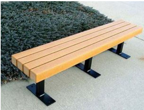
Slika 8. Klupa bez naslona

Također razlikujemo klupe sa naslonom i bez naslona. Klupa bez naslona je najjednostavnijeg dizajna i najbolje izgleda uz neki oslonac. Bez oslonca imaju ukočen i neugodan izgled kad se ističu na otvorenom, na travi ili šljunku (Thonger 1903). Klupe bez naslona su manje praktične i udobne, ali su korisne za kratka zaustavljanja na kojima se ljudi mogu odmoriti s bilo koje strane klupa (Reliance Foundry Co 2020).