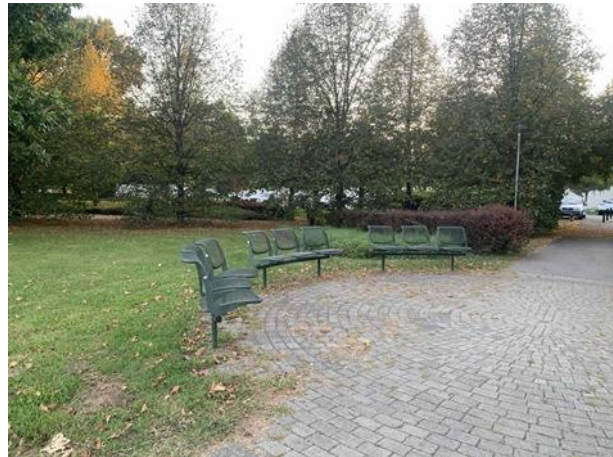
Slika 51. Tri zaobljene klupe sa tri sjedala