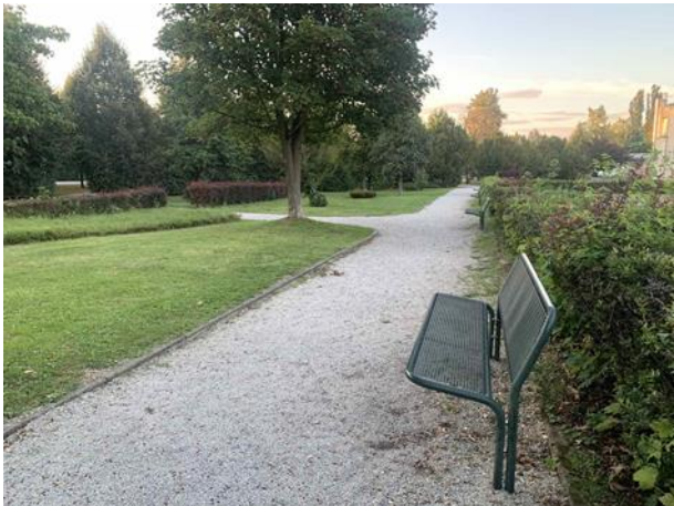
Slika 50. Klupa na stabilnoj podlozi okrenuta prema unutrašnjosti parka

U parku se može vidjeti dobar primjer postavljanja klupa u sjenu velikih stabala, što omogućuje ugodnije korištenje klupe tijekom ljetnih mjeseci (Slika 52). Kako bi se osigurala čistoća parka, uz klupe su postavljene košarice za otpatke (Slika 53).