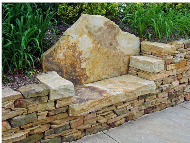
Slika 12. Klupa ugrađena u kameni zid

Klupa ugrađena u obložni zid se najčešće izrađuje od kamena ili opeke i drva. Sa gornje strane klupe se nalazi povišena gredica za cvijeće. Stražnji zid se upotrebljava kao naslon i zato je blago nakošen kako bi sjedenje bilo udobnije (Williams 1995).