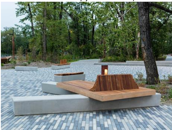
Slika 20. Klupe modernog dizajna napravljene od betona i drva