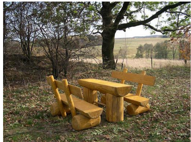
Slika 27. Rustikalni stol i klupe