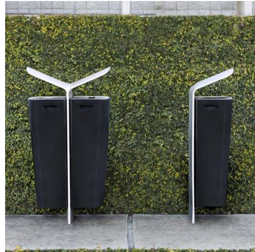
Slika 3. Primjer parkovne i urbane opreme- kanta za otpatke