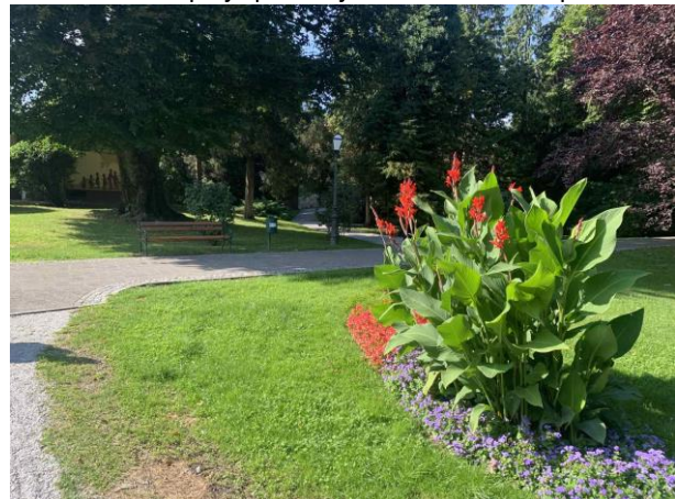
Slika 57. Klupa s pogledom na cvjetnu gredicu