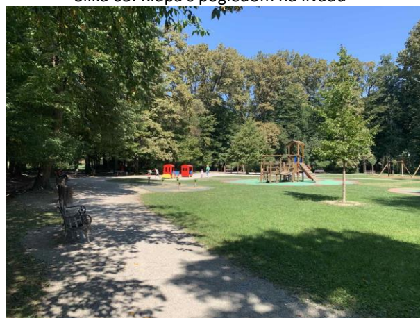
Slika 67. Klupe uz rubove dječjeg igrališta