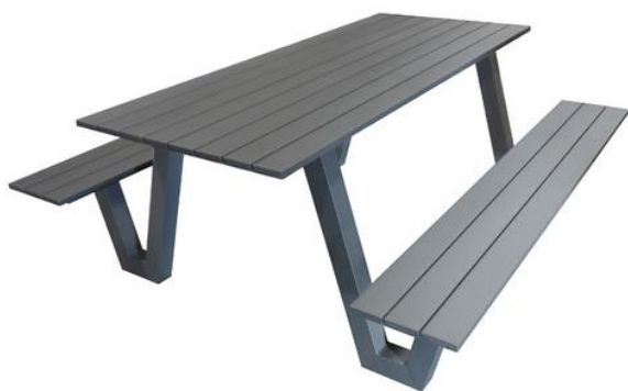
Slika 42. Aluminijska piknik garnitura