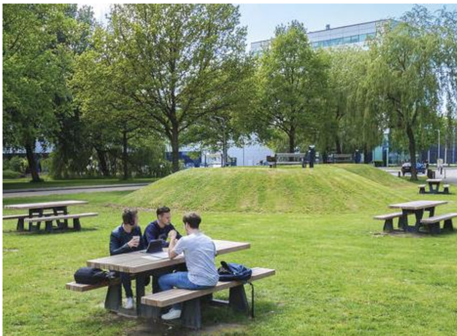
Slika 7. Druženje za parkovnim stolom

S obzirom da sve više građana želi što više vremena provesti na otvorenom, nije rijetkost druženja i održavanja piknika za parkovnim stolovima i klupama. Ručajući u parku, možete poboljšati raspoloženje, povećavajući tako koncentraciju i produktivnost na poslu. Odvajanje vremena izvan kuće i njezinih električnih uređaja može pomoći potaknuti više ljudi na komunikaciju. Dan upotpunjen razgovorima s prijateljima ili obitelji pomaže u borbi protiv posljedica izolacije i depresije. Postavljanjem stolova i klupa za piknik, potiče se korisnike zelenih površina da objeduju na otvorenom (Broxap 2017).