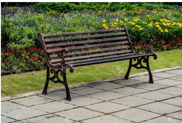
Slika 40. Klupe od lijevanog željeza

Legure željeza predstavljaju najčešće korištene metalne materijale. Takva sjedala i stolovi su izdržljivi i sasvim prihvatljivi tamo gdje su korisnost i praktičnost važniji od same estetike. Danas postoje brojni dizajni od lijevanog željeza, ali je poželjno da oni budu jednostavni, bez ikakvih ukrasa. Oni bi trebali biti vrlo jasno izrađeni, bez ikakvih ukrasa. Sjedala izrađena od željeznih letvica mogu biti pomalo neudobna pa se željezo najčešće koristi u kombinaciji sa drvenim ili plastičnim sjedalom. Često se koristi nehrđajući čelik koji se može ostaviti neobrađen jer je otporan na koroziju. Aluminijske klupe i stolovi mogu varirati od svijetlo srebrne boje do raznobojnih dizajna i tekstura (Reliance Foundry Co 2020).