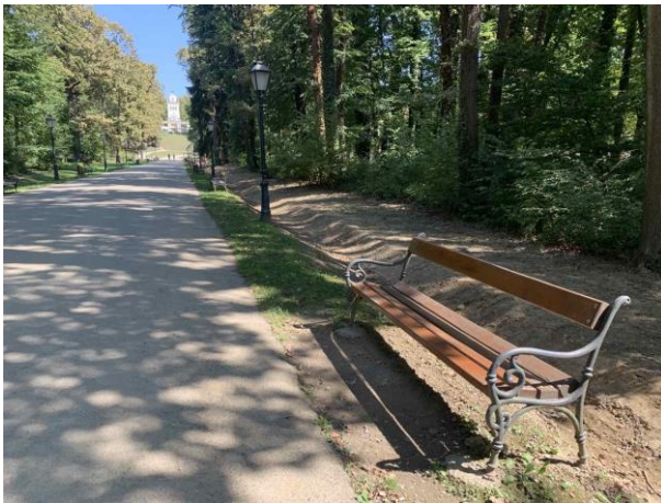
Slika 58. Klupa uz pravocrtnu ulaznu aleju prema Vidikovcu.

kao i klupe iz šetališta Vatroslava Jagića u Varaždinu. One su postavljene u čestim intervalima sa obje strane aleje. Visoko drveće u većem dijelu dana omogućava hladovinu (Slika 58). Klupe su postavljene u blizini istaknutijih objekata parka kao što je to na primjer Paviljon Jeka (Slika 59). U parku su prisutni i manji usponi uz koje su također postavljene klupe kako bi se korisnici na njima mogli odmoriti od napora koji su uložili u uspon (Slika 60). Osim klupa od lijevanog željeza sa drvenim sjedištem i naslonom, prisutne su i klupe drugih dizajna. U blizini Vidikovca nalazi se klupa postavljena uz kameni zidić koji je ukopan u brežuljak i ima pogled na cvjetnjak i jezero (Slika 61). Iznad puta koji vodi prema Obelisku, mogu se vidjeti dvije formalne drvene klupe (Slika 62). One su postavljene na popločenu podlogu kako vlaga ne bi uništila drvo. Sjedeći na njima, korisnicima se pruža prekrasan pogled na obližnju dolinu. Više klupa postavljeno je kod Obeliska na proširen prostor i šljunčanu podlogu. Ondje se korisnici mogu odmoriti u hladu gustih krošanja (Slika 63).