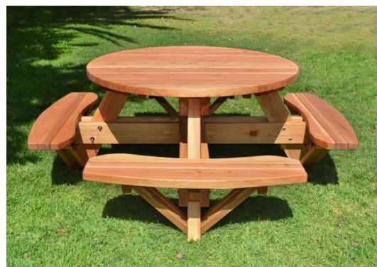
Slika 23. Kružni stol