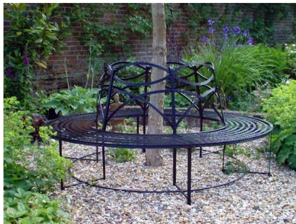
Slika 11. Kružna metalna klupa

Klupa ugrađena u obložni zid se najčešće izrađuje od kamena ili opeke i drva. Sa gornje strane klupe se nalazi povišena gredica za cvijeće. Stražnji zid se upotrebljava kao naslon i zato je blago nakošen kako bi sjedenje bilo udobnije (Williams 1995).