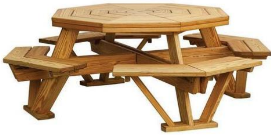
Slika 24. Osmerokutni stol