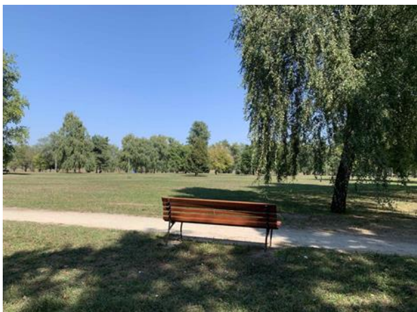
Slika 74. Klupa na Bundeku s pogledom na livadu i soliterno stablo

Osim u sjenicama, setovi rustikalnih klupa i stolova smješteni su i na ne natkrivenim površinama parka (Slika 73). Baš kao i u prethodnim parkovima, parkovne klupe na Bundeku smještene su tako da se pogled korisnika pruža prema odabranim vizurama. U ovom slučaju je to pogled na soliterno stablo i livadu (Slika 74) te jezero (Slika 75).