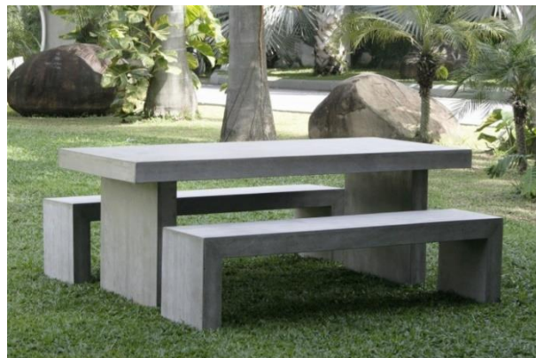
Slika 47. Stol i klupe od betona