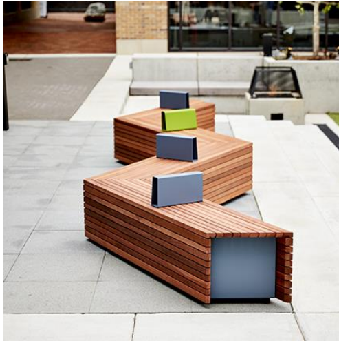
Slika 2. Primjer parkovne i urbane opreme-klupa