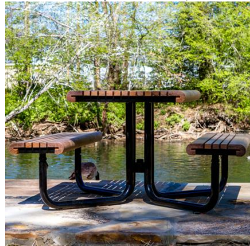
Slika 5. Primjer parkovne i urbane opreme- stol s dvije klupe

Posjetiteljima koji se koriste parkovima i ostalim zelenim površinama iznimno je važno osigurati mjesta za odmor kao što su klupe i stolovi.