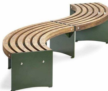
Slika 43. Metalna klupa sa drvenim krivudavim sjedištem