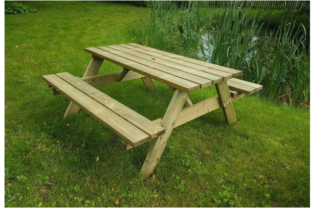
Slika 25. A-okvir piknik garniture