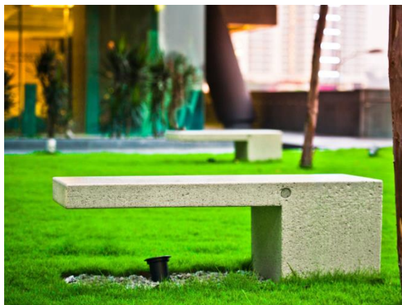
Slika 35. Moderna kamena klupa