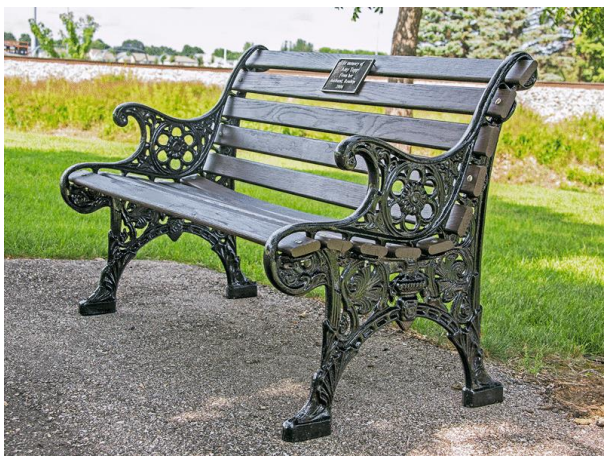
Slika 16. Klupa od lijevanog željeza

Formalna drvena klupa u dizajnu iz početka 20. stoljeća prikladna je kao formalnije sjedalo. Najbolje izgleda u bljeđim bojama ili u svijetlom prirodnom drvu. One se postavljaju na prethodno pripremljeno podnožje od ukopanih opeka ili blokova. Važno je da ono ne bude upadljivo (Williams 1995).