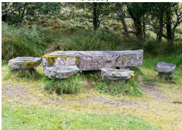
Slika 34. Grubo obrađeni kameni stol i stolci (Izvor: 123RF https://www.123rf.com/photo_84771975_rough-stone-table-and-chairs-at-parking-of-knockan-crag-in-north-west-highlands-geopark-scotland-ii.html Pristupljeno: 7.9.2021.)