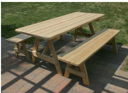
Slika 22. Tradicionalni pravokutni stol

Stolovi za piknik mogu biti u potpunosti izrađeni od drveta ili kamena, ili mogu biti pametno smišljene kombinacije oba materijala. Ponekad se stolovi izgrađeni u cijelosti ili djelomično od kamena lakše uklapaju u prirodno okruženje nego stolovi od trupaca ili drva. Možda imaju estetske prednosti i ekstremno su izdržljivi, ali njihova nepokretnost umanjuje te prednosti. Parkovi su obično područja intenzivne uporabe, a njihova oprema je podložna jakom trošenju. Vegetacija i tlo oko mjesta postavljenih stolova može se degradirati pa je potrebno premjestiti stolove na drugu lokaciju kako bi priroda dala vremena da se „izliječi“. Zbog toga kameni stolovi nisu najpraktičniji izbor (National Service, službene stranice). Ponekad su u parkovima prisutni i amaterski izrađeni stolovi koji su rustikalniji i lako se stapaju sa prirodom. Baš kao i kod parkovnih klupa, danas postoje brojni moderni i unikatni dizajni stolova. Oni se najčešće dizajniraju po narudžbi kako bi se u potpunosti mogli uklopiti u prostor za kojeg su namijenjeni.