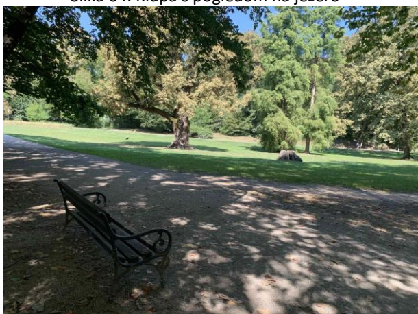
Slika 66. Klupa s pogledom na livadu i soliterna stabla