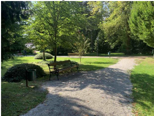
Slika 56. Klupa na proširenju staze iza koje se nalazi grm i visoka stabla.