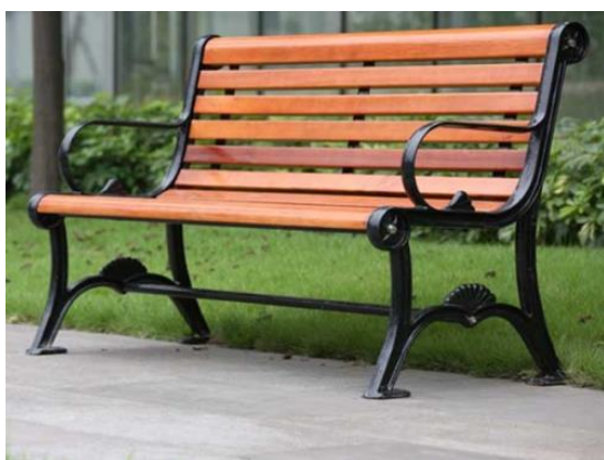
Slika 44. Klupa sa sjedištem od drvo-plastičnog kompozita

Plastični proizvodi posjeduju brojne prednosti kao što su jednostavnost, manja težina, učinkovitost te širok izbor boja koji omogućuje lakše uklapanje u dizajn parka i zelene površine (Transsib 2021).