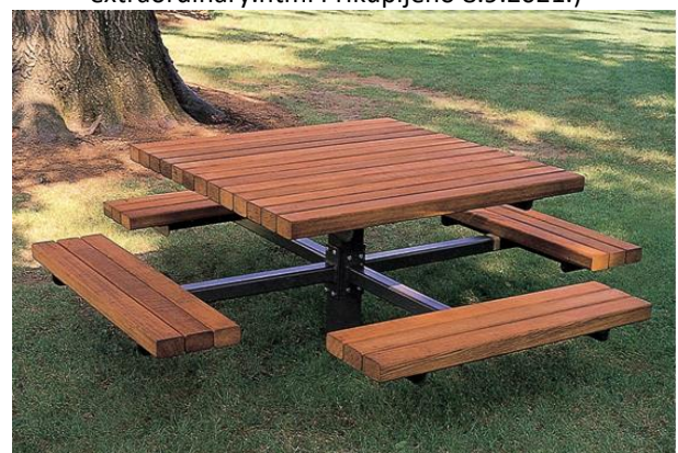
Slika 39. Drveni stol i klupe sa metalnim postoljem.