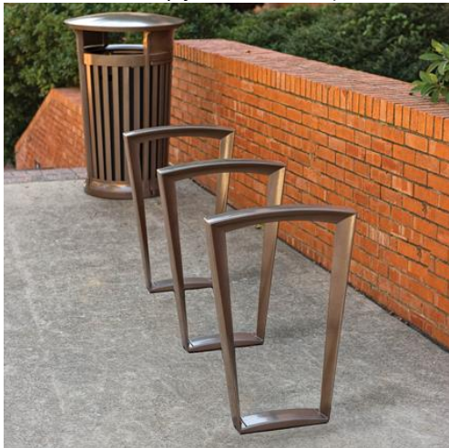
Slika 4. Primjer parkovne i urbane opreme- stalak za bicikle