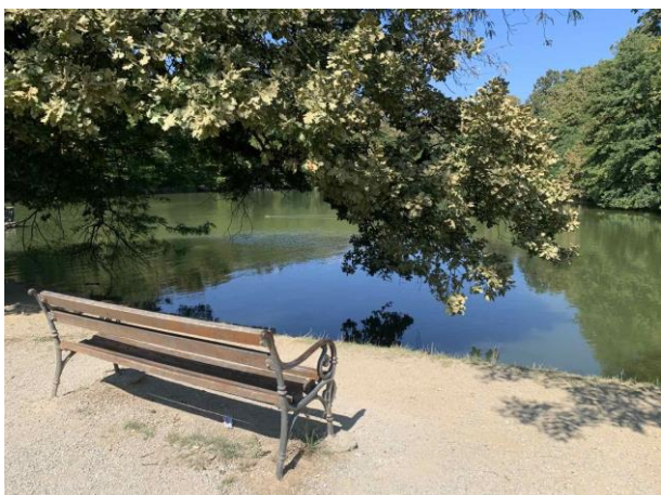
Slika 64. Klupa s pogledom na jezero

Vrlo je važno kamo je pogled usmjeren prilikom sjedenja na parkovnoj klupi. Dobri primjeri iz Maksimira su klupe koje su usmjerene prema otvorenim slikovitim scenama, livadama i jezerima (Slike 64, 65 i 66). Oko dječjih igrališta su postavljene klupe usmjerene prema igralištu kako bi roditelji sa njih mogli promatrati svoju djecu u igri (Slika 67). Isto kao i u prethodnim parkovima, u Maksimiru nisam naišla ni na jedan stol.