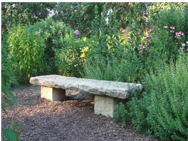
Slika 30. Kamena klupa bez naslona uz koju je posađeno bilje