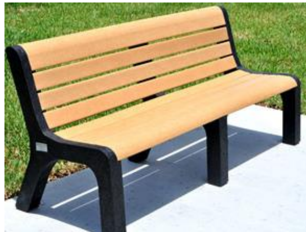
Slika 9. Klupa sa naslonom

Klupa s naslonom je klasičan dizajn i najčešće se koristi. Nasloni trebaju biti predviđeni za bilo koju klupu namijenjenu za duže sjedenje, poput onih u parku ili u blizini igrališta (Reliance Foundry Co 2020). Osim statičnog, klupa može imati i sklopivi naslon. Takav naslon klupe se može preklopiti kako bi zaštitio sjedalo od kiše (Transsib 2021).