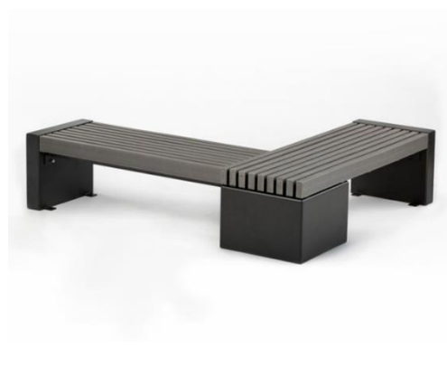
Slika 45. Klupa od reciklirane plastike