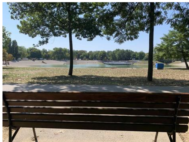
Slika 75. Klupa na Bundeku sa pogledom na jezero