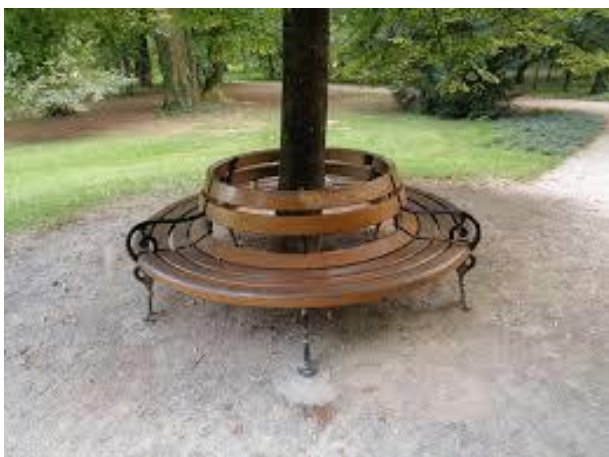
Slika 10. Kružna drveno-metalna klupa u parku Maksimir