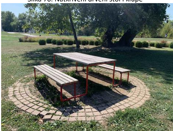
Slika 72. Garnitura za piknik u kombinaciji metala i drva na popločenom postolju