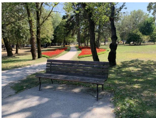
Slika 69. Klupa postavljena na proširenju staze u sjeni stabla