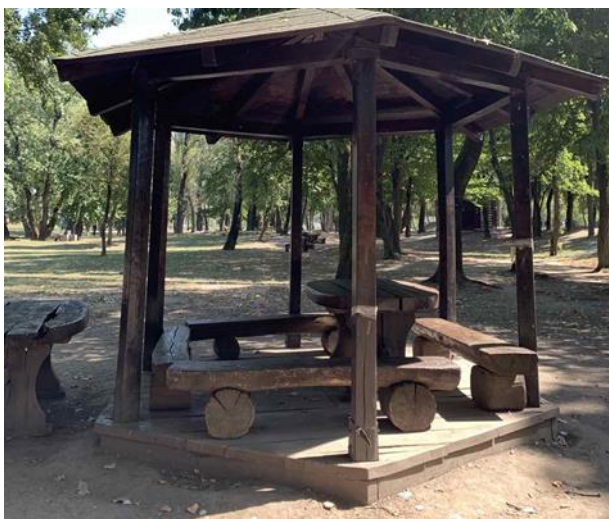
Slika 70. Natkriveni drveni stol i klupe