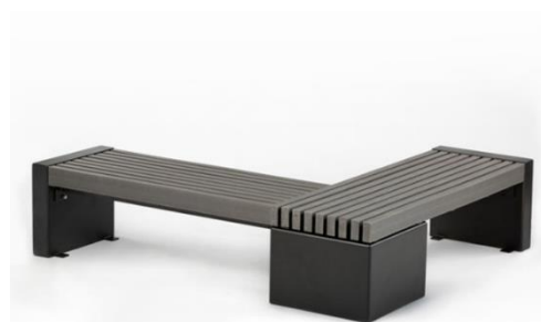
Slika 45. Klupa od reciklirane plastike