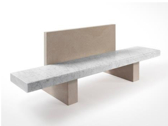
Slika 32. Moderna parkovna klupa s naslonom