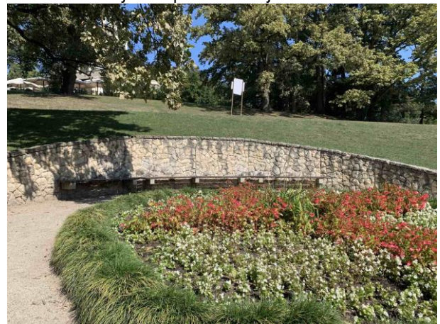
Slika 61. Primjer klupe postavljene uz kameni zidić koji je ukopan u brežuljak i ima pogled na cvjetnjak i jezero