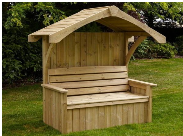
Slika 15. Natkrivena klupa