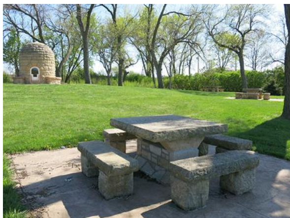
Slika 33. Kameni stol i četiri klupe bez naslona