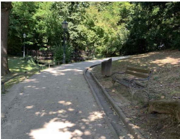
Slika 60. Klupa uz uspon