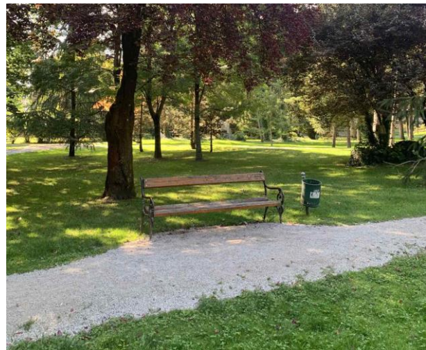
Slika 55. Primjer klupe postavljene na proširenju, u hladu. Uz klupu je postavljena košarica za otpatke.