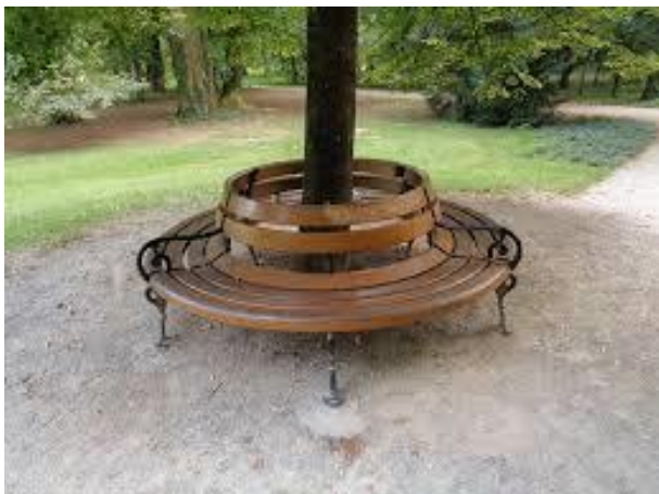
Slika 10. Kružna drveno-metalna klupa u parku Maksimir