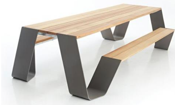
Slika 28. Moderna piknik garnitura