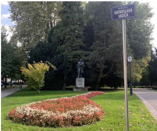
Slika 54. Tabla sa nazivom šetališta i spomenik Vatroslavu Jagiću na ulazu u šetalište