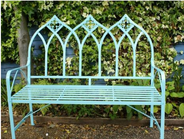
Slika 18. Gotička željezna klupa

Moderne klupe su izrađene od različitih materijala u različitim i unikatnim dizajnim. Klupe su dizajnirane tako da su sve površine prostora u kojem se nalaze, međusobno povezane i stapaju se jedna u drugu. Postoji niz okruglih, pravokutnih, drvenih ili metalnih klupa; kakve god možemo zamisliti (Designrulz 2021).