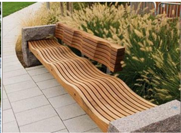
Slika 21. Krivudava parkovna klupa od kamena i drva (Izvor: Hobby Ane https://www.hobbyane.com/?arsae=https%3A%2F%2Fbenchten.netlify.app%2Fmodern-park-benches.html Prikupljeno: 8.9.2021.)