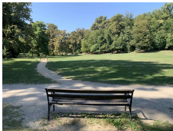
Slika 65. Klupa s pogledom na livadu