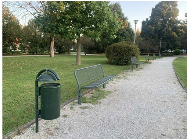
Slika 53. Košarica za otpatke uz klupu