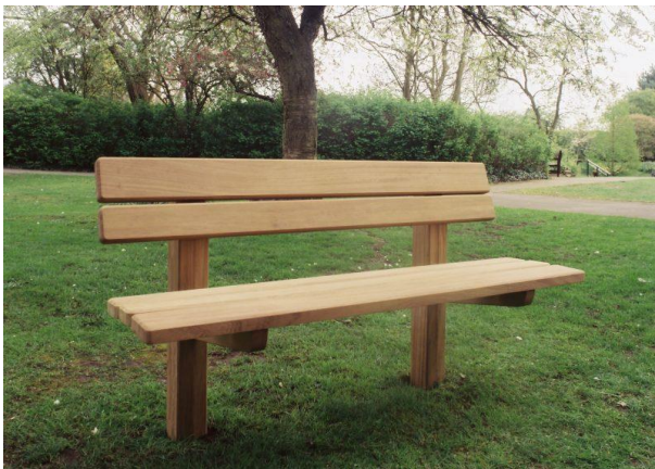
Slika 36. Parkovna klupa u potpunosti izrađena od drva

Neka su istraživanja pokazala kako su sve dobne skupine preferirale drvene klupe, u usporedbi s klupama napravljenih od drugih materijala. Razlog preferencije drveta je taj da je drvo toplije od ostalih materijala (Baris & Ozer 2012).