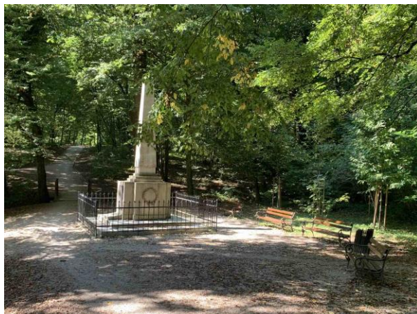
Slika 63. Obelisk oko kojeg je postavljeno nekoliko klupa

Vrlo je važno kamo je pogled usmjeren prilikom sjedenja na parkovnoj klupi. Dobri primjeri iz Maksimira su klupe koje su usmjerene prema otvorenim slikovitim scenama, livadama i jezerima (Slike 64, 65 i 66). Oko dječjih igrališta su postavljene klupe usmjerene prema igralištu kako bi roditelji sa njih mogli promatrati svoju djecu u igri (Slika 67). Isto kao i u prethodnim parkovima, u Maksimiru nisam naišla ni na jedan stol.