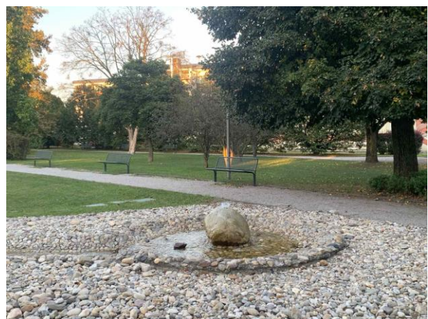
Slika 49. Klupe postavljene uz stazu okrenute u smjeru vodenog elementa