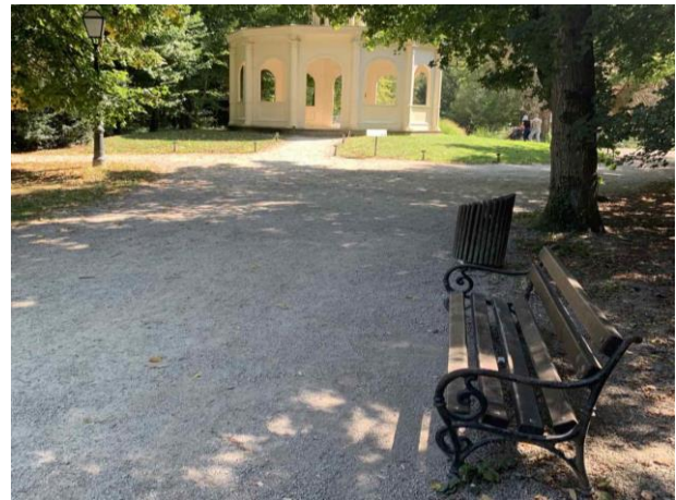
Slika 59. Primjer položaja klupe u blizini istaknutijih objekata parka - Paviljon Jeka.