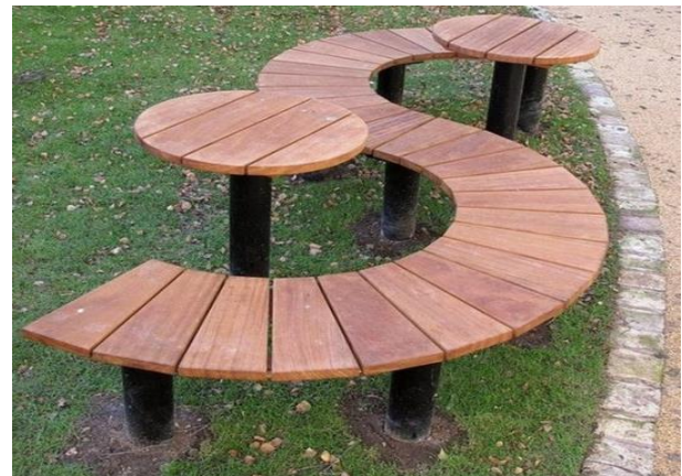
Slika 37. Parkovna klupa i stol od drveta i metala