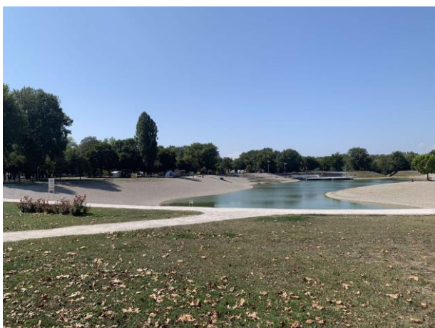
Slika 68. Park Bundek

Najčešći dizajn parkovnih klupa je dizajn koji sadrži metalnu konstrukciju sa drvenim naslonom i sjedištem bez naslona za ruke. Klupe su trajno postavljene na stabilna i čvrsta proširenja uz staze. Obično su postavljene tako da budu u sjeni visokih stabala. Pošto je Bundek omiljeno odredište za roštiljanje, u njemu sam naišla na brojne primjere dizajna piknik garnitura. U parku se nalazi mnogo sjenica u kojima se nalaze rustikalni drveni stolovi sa pripadajućim drvenim klupama (Slika 70). U parku se nalaze i natkrivene drvene piknik garniture. One čine jednu cjelinu, naime klupe i stol su povezani sa konstrukcijom koja drži krov (Slika 71). U Bundeku su prisutne i piknik garniture sa metalnom konstrukcijom i tablom stola i sjedištima od drva. Takve garniture smještene su na popločene površine kružnoga oblika (Slika 72).