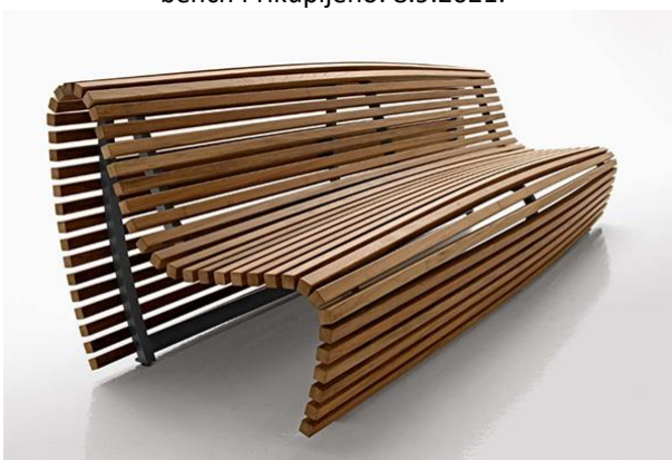
Slika 38. Valovita drvena klupa sa metalnom konstrukcijom