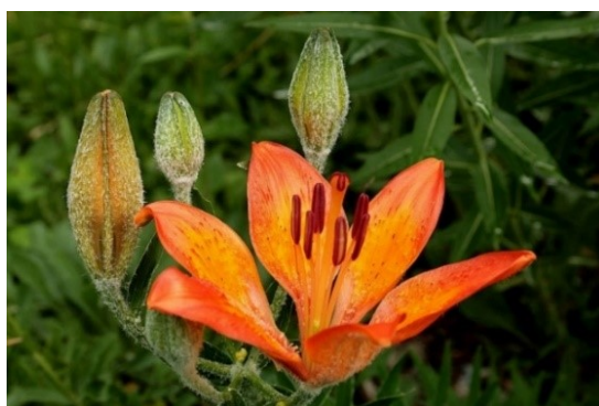
Slika 32. Lilium bulbiferum L. www.garden.org

Opis: trajna zeljasta biljka s uspravnom i pri vrhu dlakavom stabljikom. Na sredini stabljike rastu linealni i goli listovi koji su naizmjenični. Cvjetovi su joj dvospolni i krupni, mogu biti pojedinačni ili skupni, cvjetaju u lipnju i srpnju. Plod je bridasti tobolac. Raste na osunčanim livadama i obroncima koji se nalaze u brdskim i planinskim područjima (Žitković 2009).