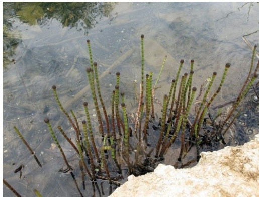
Slika 30. Equisetum hyemale L.

Opis: ovo je trajna biljka još iz doba mezozoika, stabljike su joj jednake. Na vrhovima stabljika joj se razvijaju strobili na kojima sazrijevaju spore od svibnja do kolovoza. Otrovnost je za neke životinje. Raste na močvarnim područjima i vlažnim šumama (Nikolić 2021).