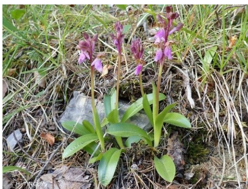
Slika 82. Orchis spitzelii Saut. ex W.D.J. Koch.

Opis: biljka trajnica sa okruglom stabljikom visokom do 40 cm. Ima duguljate jajolike listove. Cvjetovi su skupljeni u cvatove i dvospolni su. Plodovi su tobolci a biljka raste na suhim livadama i kamenitim padinama (Nikolić 2021).