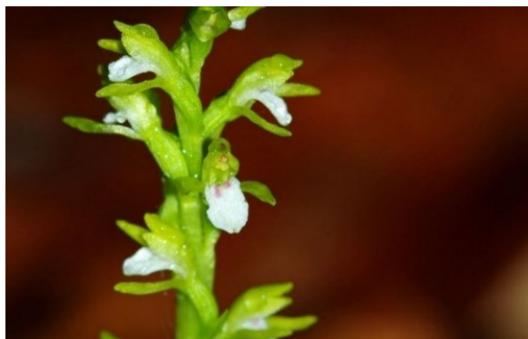
Slika 56. Corallorrhiza trifida Chatel. www.atlas.roslin.pl

Opis: trajna zeljasta biljka čija je stabljika uspravna i glatka. Pravih listova nema, ima samo prilegle ljuskaste listove. Cvjetovi su dvospolni i skupljeni u rahle cvatove, cvjeta od svibnja do srpnja. Plod je viseći tobolac. Raste u pretplaninskim listopadnim šumama (Žitković 2009).