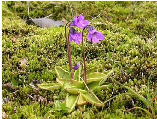
Slika 46. Pinguicula vulgaris L. www.flickrriver.com

Opis: zeljasta trajnica visoka do 10 cm, listovi su cjeloviti i jajoliki, izlučuju ljepljivu tekućinu koja privlači kukce koji se gore zalijepe i biljka ih pojede. Cvijeće cvjeta od svibnja do kolovoza a plod je tobolac sa više sjemenki. Raste na vlažnim livadama i močvarama (Franjić i Škvorc 2014).