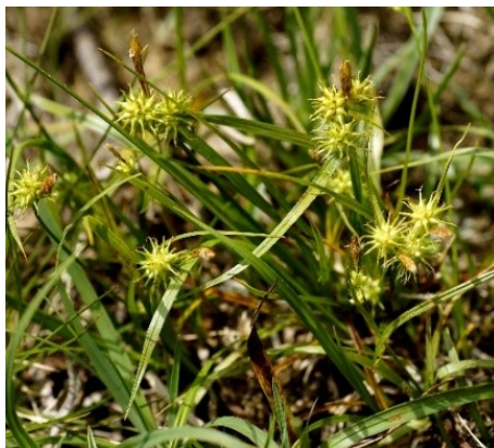
Slika 19. Carex flava L.

Opis: zeljasta trajnica visoka 60 cm, listovi su plosnati i dugački su skoro kao stabljika. Cvijeće je skupljeno u cvatove, cvjeta od svibnja do srpnja. Plod je oraščić. Raste na vlažnim područjima uz rječice, potoke i jarke (Franjić i Škvorc 2014).