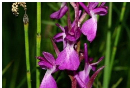
Slika 75. Orchis laxiflora Lam. www.atlas.roslin.pl

Opis: biljka trajnica, stabljika joj je okrugla i šuplja, može narasti i do 100 cm. Listovi su joj naizmjenično postavljeni, duguljasti i linealno-lancelastoog oblika. Cvjetovi su skupljeni u cvat, dvospolni, cvjetaju od lipnja do srpnja. Plod je tobolac i raste na vlažnim i suhim područjima poput močvara, pašnjaka i livada (Žitković 2009).