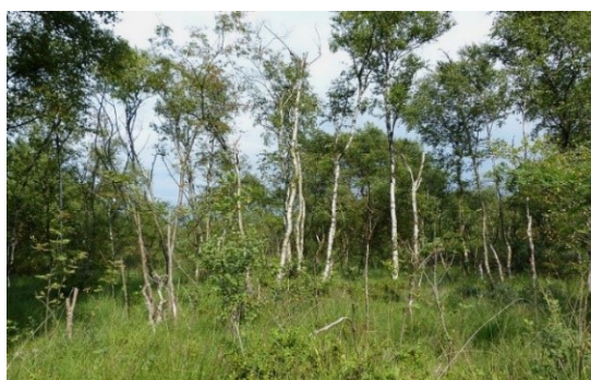
Slika 17. Betula pubescens Ehrh. (stabla).