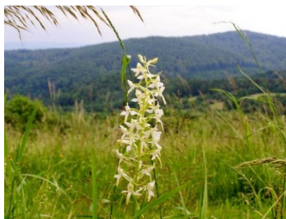
Slika 85. Platanthera bifolia (L.) L.M.Rich.

Opis: trajna zeljasta biljka sa stabljikom koja je uspravna, šuplja i gola, može narasti do 60 cm. Listovi su joj široko eliptični i goli, lancelasti, nasuprotno smješteni. Cvjetovi su dvospolni i skupljeni u cvatove koji cvjetaju od svibnja do kolovoza. Plod je tobolac sa mnoštvo sitnih sjemenki. Raste na sjenovitim tlima bukovih i crnogoričnih šuma (Franjić i Škvorc 2014).