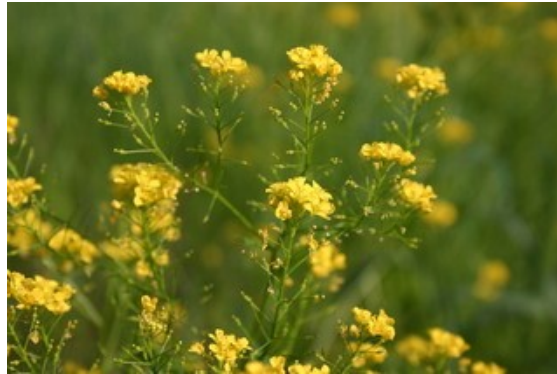
Slika 13. Rorippa lippizensis (Wulfen) Rchb.

Opis: zeljasta trajnica kojoj su prizemni listovi okruglasto-jajastog oblika a oni na stabljici perasti. Cvijetovi su žute boje i skupljeni su u cvatove. Cvjeta od travnja do srpnja. Plodovi su komuške. Ova vrsta raste na vlažnim i ilovastim tlima (Žitković 2009).