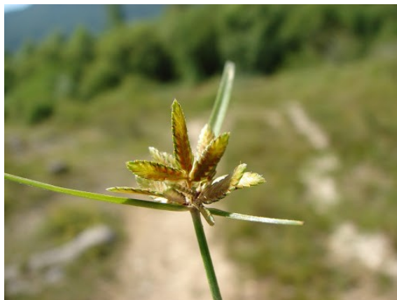
Slika 22. Cyperus flavescens L. www.freenatureimages.eu

Opis: jednogodišnja biljka, ima 2 do 3 lista koja se nalazi na donjem dijelu stabljike. Cvjetovi su jednospolni ili dvospolni skupljeni u cvatove, cvjeta od srpnja do listopada. Plod je jednosjemeni oraščić. Raste u uvjetima polusjene gdje je vlažno (Žitković 2009).