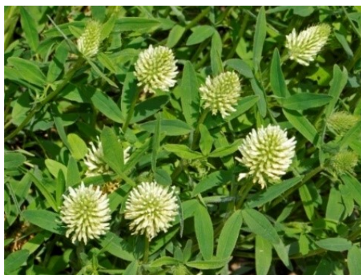
Slika 49. Trifolium pannonicum Jacq. www.wikiwand.com

Opis: zeljasta trajnica koja je visoka od 20 cm do 60 cm. Listovi i peteljke su obrasle dlakama. Cvjetovi su su zbijeni u cvat, dvospolni su. Plod je jednosjemena mahuna. Raste na osunčanim travnjacima (Nikolić 2021).