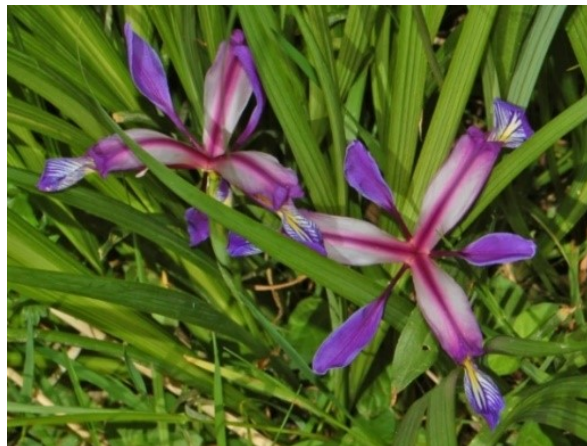
Slika 37. Iris graminea L.

Opis: zeljasta biljka do 70 cm visoka, lišće joj je široko i više od stabljike. Cvjetovi su dvospolni i pojedinačni, rastu u svibnju i lipnju. Plod je tobolac. Ova biljka raste u svijetlim šumama i na kamenitom tlu (Ravlić 2021).