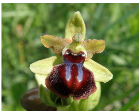
Slika 73. Ophrys sphegodes Mill.

Opis: zeljasta trajnica, na stabljici se nalaze naizmjenično smješteni lanceolasti listovi. Cvjeta od travnja do lipnja. Plod je tobolac a biljka raste na osunčanim i polusjenovitim livadama i obroncima (Žitković 2009).