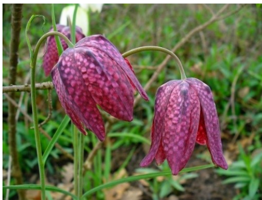
Slika 31. Fritillaria meleagris L. www.lumeasatului.ro

Opis: trajna zeljasta biljka čija je stabljika uspravna i gola, listovi su joj naizmjenični i duguljasti. Cvjetovi su pojedinačni i krupni, cvjetaju u ožujku i travnju. Plod je kuglasti tobolac. Ova biljka raste u vlažnim i toplim dolinama (Nikolić 2021).