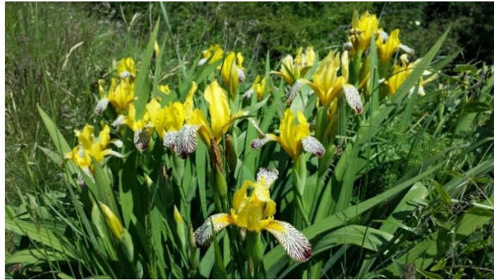
Slika 38. Iris variegata L.

Opis: zeljasta biljka do 40 cm visoka, lišće je široko i raste na stabljici. Cvjetovi su dvospolni i pojedinačni, cvjetaju od svibnja do lipnja. Plod je tobolac. Raste na suhim mjestima i pašnjacima (Žitković 2009).