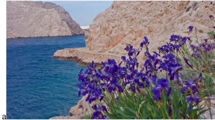
Slika 36. Iris croatica I. Horvat et M. Horvat.

Opis: zeljasta biljka sa stabljikom od 70 cm, listovi joj počinju od baze stabljike i dugački si gotovo kao stabljika. Cvjetovi su dvospolni i skupljeni u cvatove. Plod je tobolac. Biljka raste na čistinama i stijenama (Franjić i Škvorc 2014).