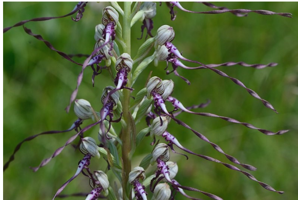
Slika 66. Himantoglossum adriaticum

Opis: na doljen dijelu stabljike su veliki listovi dok su na gornjem dijelu manji. Cvjeta u svibnju i lipnju. Ova biljka raste na suhim područjima poput livada, šikara i šumskih čistina.