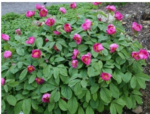
Slika 44. Paeonia mascula (L.) Miller. www.jardineriaon.com

Opis: zeljasta biljka koja naraste do 50 cm čija je stabljika uspravna i gola. Listovi su naizmjenični i veliki sa ušiljenim vrhovima i glatkim rubovima. Cvjetovi su dvospolni i pojedinačni, cvjetaju od ožujka do svibnja. Plod je višesjemeni mješur. Raste u šikarama i gorskim šumama, na svijetlim i toplim mjestima (Žitković 2009).