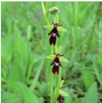
Slika 72. Ophrys insectifera L.

Opis: zeljasta trajna biljka sa stabljikom visokom do 60 cm. Cvjetovi rastu na bazi stabljike. Cvjetovi su skupljeni u cvat, jednospolni su i cvjetaju u svibnju i lipnju. Plod je tobolac. Biljka raste na svijetlim travnjacima i pješčanim obalama (Nikolić 2021).