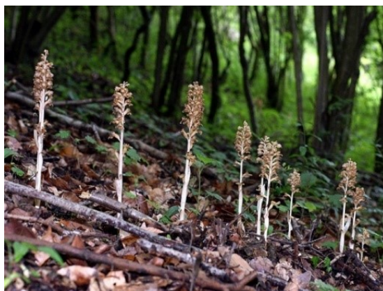
Slika 69. Neottia nidus-avis (L.) Rich. www.turistmagazin.hu

Opis: trajna zeljasta biljka, stabljika joj je uspravna, debela i žljebasta. Lišća nema. Cvjetovi su dvospolni i pri vrhu skupljeni u cvat. Plod je kapsula sa mnoštvo sjemenki. Raste na humusnim i rastresitim tlima (Ravlić 2021).