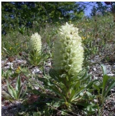
Slika 18. Campanula thyrsoides L.

Opis: zeljasta biljka visoka do 50 cm, ima šiljaste listove obrasle sjajnim dlakama. Cvjetovi su zvonoliki i skupljeni u cvat, cvjeta od lipnja do kolovoza. Plod je višesjemeni tobolac. Raste na brdskom području, livadama (Nikolić 2021).