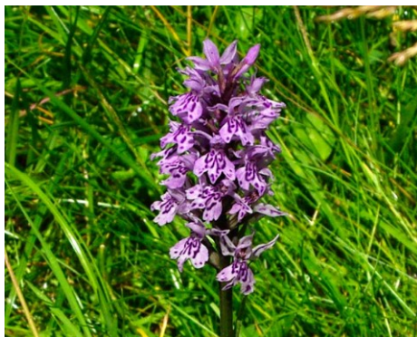
Slika 58. Dactylorhiza fuchsii (Druce) Soo. www.gardensonline.com.au

Opis: biljka trajnica visoka do 50 cm, stabljika je uspravna a listovi su joj pjegasti. Cvjetovi su skupljeni u cvatove, dvospolni su i cvjeta u lipnju i srpnju. Plod je kapsula sa više sićušnih sjemenki. Biljka raste na suhim brdskim livadama i polusjenovitim šumama (Nikolić 2021).