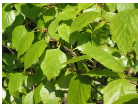
Slika 16. Betula pubescens Ehrh. (list).

Opis: listopadno stablo, kora je u mladosti bijela i glatka a u starosti je u podnožju grubo ili plitko ispucala. Listovi su naizmjenični i široko jajasti ili četvrtasti. Cvjetovi su jednospolni i jednodomni skupljeni u resaste cvatove, cvjetaju u travnju i svibnju. Plod je okriljeni oraščić. Raste uglavnom na močvarnim tlima koja su vlažna i kisela (Žitković 2009).