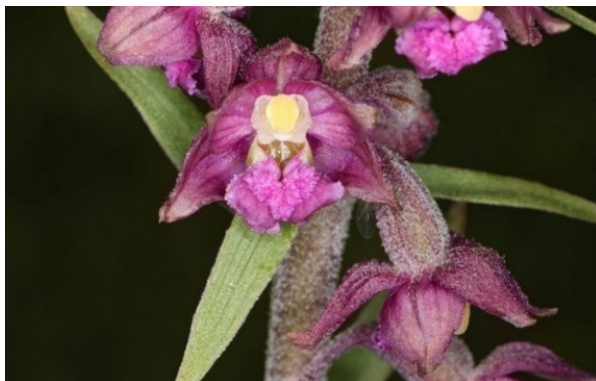
Slika 62. Epipactis atrorubens (Hoffm.) Besser.

Opis: višegodišnja zeljasta biljka, stabljika joj je uspravna i na gornjem dijelu malo dlavaka. Listovi su naizmjenični, veliki i jajoliki. Cvjetovi su dvospolni i skupljeni u cvatove, cvjeta od lipnja do kolovoza. Plod je kapsula sa mnoštvo sitnih sjemenki (Nikolić 2021).