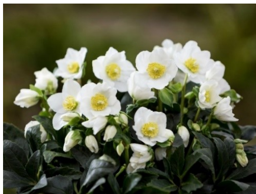
Slika 8. Helleborus niger L. www.famiflora.be

Opis: stabljika ove biljke je zeljasta sa zelenim kožastim dugim listovima, cvijetovi bijeli do svjetloružičasti i sastoje se od 5 lapova, cvjeta od prosinca do ožujka. Plod je mjehur. Raste uz rubove šuma i puteve, odgovaraju joj sjenovita do polusjenovita mjesta. Otrovnost je za ljude i životinje (Nikolić 2021).