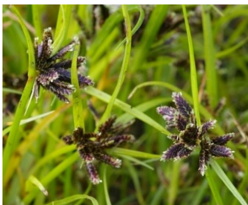
Slika 23. Cyperus fuscus L.

Opis: jednogodišnja biljka, ima lišće samo na bazi stabljike, lišće je ušiljeno i uspravno. Cvijeće je jednospolno ili dvospolno, skupljeno u cvat, cvjeta od lipnja do rujna. Plod je jednosjemeni oraščić. Raste na vlažnim područjima sa puno svjetla (Žitković 2009).