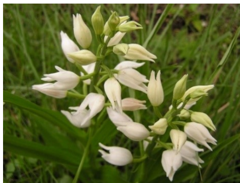
Slika 54. Cephalanthera longifolia (L.) Fritsch. www.commons.wikimedia.org

Opis: višegodišnja zeljasta biljka čija je stabljika uspravna i glatka bez dlačica. Listovi su joj nasuprotni, lanceolasti sa ušiljenim vrhom. Cvjetovi su dvospolni i skupljeni u cvatove, cvjetaju od travnja do srpnja. Plod je višesjemena kapsula. Raste na rubovima šuma i šikarama, polusjenovita staništa (Nikolić 2021).