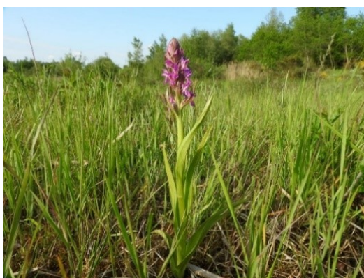
Slika 59. Dactylorhiza incarnata (L.) Soo.

Opis: trajna zeljasta biljka, stabljika joj je čvrsta, uspravna i suha. Listovi su joj uspravni, naizmjenični i izduženo kopljasti. Cvjetovi su skupljeni u cvatove i cvjetaju od svibnja do srpnja. Plod je kapsula koja sadrži brojne sjemenke. Raste na vlažnim i močvarnim livadama (Franjić i Škvorc 2014).