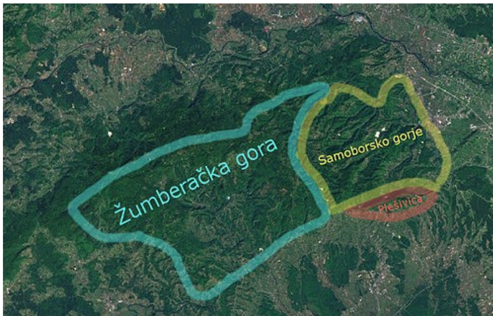
Slika 2. Lokacija Samoborskog gorja u odnosu na Žumberačku goru.

Razlog zašto je biljni pokrov toliko raznolik na području Samoborskog gorja je zbog utjecaja reljefa, geološke podloge, klime, vodotočja i mnogih drugih čimbenika okoline. Reljef je sličan alpskom i dinarskom, a karakteriziraju ga elementi poput duboko usječenih dolina, strmih padina, zašiljenih vrhova, špilja, ponikvi i ponora u vapnencu. Geološku podlogu čine stijene koje datiraju još od perma (prije više od 250 milijuna godina), a te stijene su građene od dolomita i krednih naslaga što tvori kršnu građu područja (90 % krša), što uvjetuje mnogo površinskih i dubinskih krških oblika poput jama, uvala, ponikva i špilja (Dinarsko Gorje 2021). Klima na području Samoborskoga gorja je hladna i vlažna, zato što godišnji prosjek temperature ne prelazi 10 °C, a sunčanih sati ima u prosjeku od 1800 – 1900 godišnje. Godišnji prosjek oborina iznosi od 1000 - 1250 mm i snijeg je uobičajena pojava kojega može napadati 100 - 150 cm godišnje (Vrbek 2010). A to je sve zbog geografskog položaja između dinarskog, alpskog i panonskog područja (Slika 2, Dinarsko Gorje 2021).