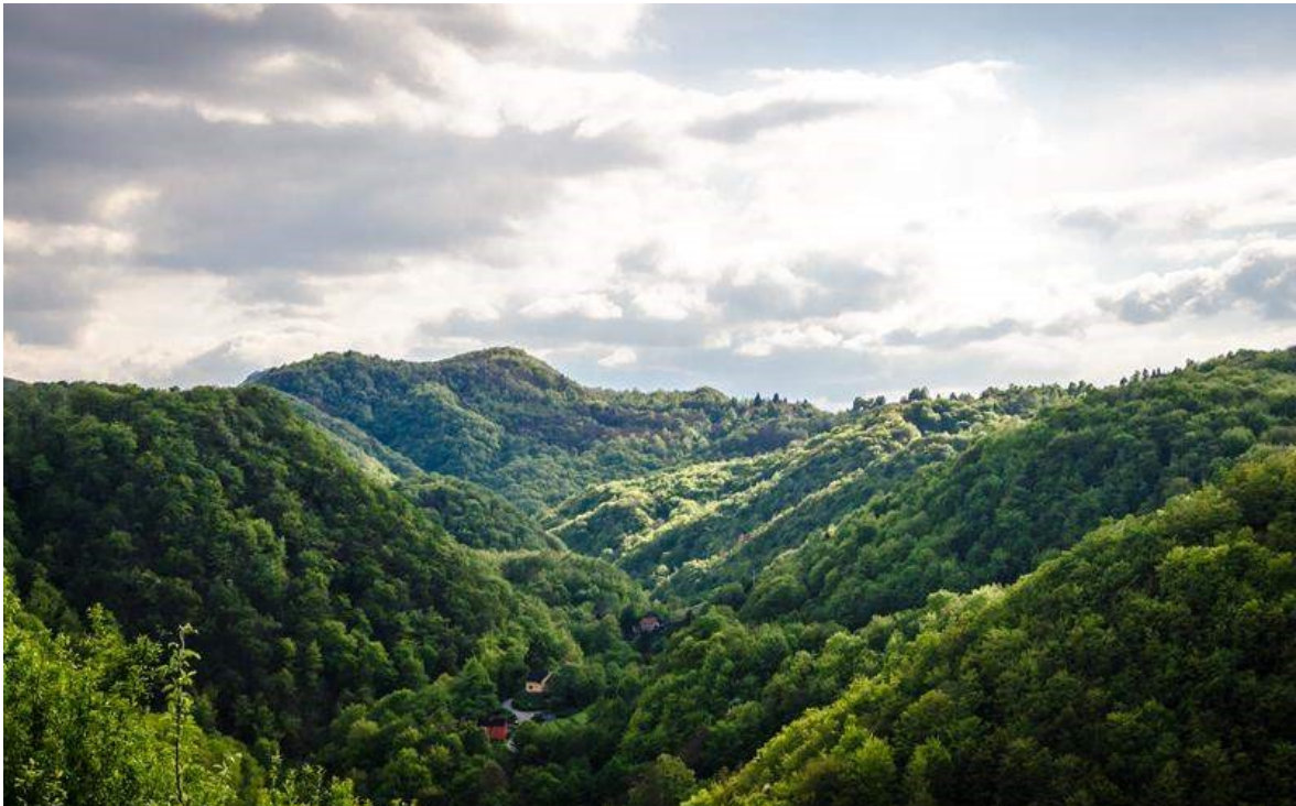
Slika 1. Park prirode Žumberak-Samoborsko gorje.

Samoborsko gorje (Slika 1) odlikuje vrlo različiti krajobraz, a to su livade, voćnjaci, pašnjaci, travnjaci, lokve, oranice i šume. Na tim područjima je zabilježeno preko 1000 od sveukupno oko 5055 vrsta i podvrsta, od kojih je značajan dio zaštićen i one će biti pobliže opisane u ovom radu (Parkovi Hrvatske 2021). Na području Samoborskoga gorja zemljište se najviše koristi za lov, šumarstvo, turizam i rekreaciju, poljoprivredu, ribarstvo i akvakulturu, skupljanje autohtonih biljaka, zaštitu prirode i istraživanje, te za upravljanje vodama (Vrbek 2010).