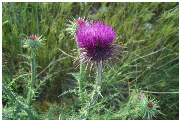
Slika 15. Carduus micropterus (Borbás) Teyber.

Opis: dvogodišnja zeljasta biljka sa krpasto rasperanim listovima koji su zajedno sa stabljikom prekriveni bodljama. Cvjetovi su dvospolni i skupljeni u cvatove, cvjeta od srpnja do rujna. Plod je kratki ahenij s papusom. Raste na pašnjacima i travnjacima (Nikolić 2021).