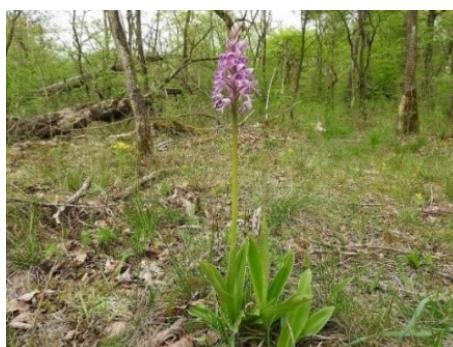
Slika 77. Orchis militaris L.

Opis: trajna zeljasta biljka čija je stabljika uspravna, bridasta i visoka do 40 cm. Listovi su joj duguljasto eliptični i kožasti. Cvjetovi su skupljeni u cvatove, dvospolni su i cvjetaju od travnja do lipnja. Plod je tobolac sa sjemenka. Raste na polusjenovitim područjima poput livada, šuma, travnjaka (Žitković 2009).