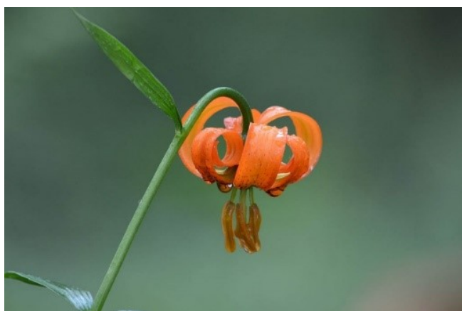
Slika 33. Lilium carniolicum Bernh. Ex W.D.J.Koch.

Opis: trajna zeljasta biljka, stabljika joj je uspravna i gola. Listovi su joj naizmjenični kopljasti. Cvjetovi su joj dvospolni i najčešće pojedinačni a rijetko kada u cvatovima, cvjeta od svibnja do srpnja. Plod je tobolac. Raste na livadama i šumskim rubovima (Ravlić 2021).