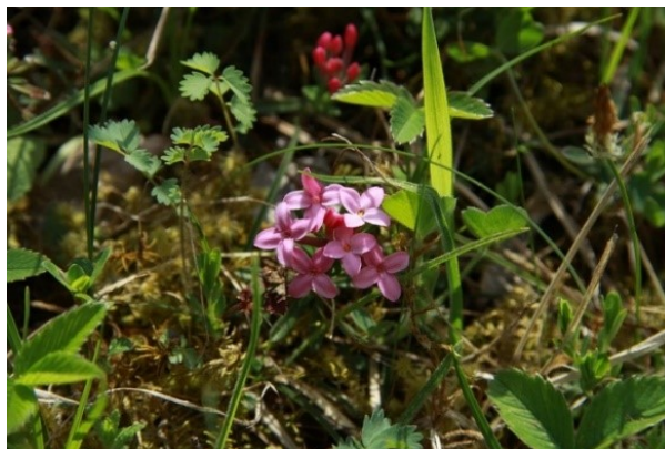
Slika 26. Daphne cneorum L. www.freenatureimages.eu

Opis: zeljasta trajnica čiji su listovi kožasti i obrnuto jajasti. Cvjetovi su dvospolni i skupljeni u cvatove, cvjetaju od svibnja do kolovoza. Plodovi su bobice. Raste na sunčanim i suhim mjestima (Žitković 2009).