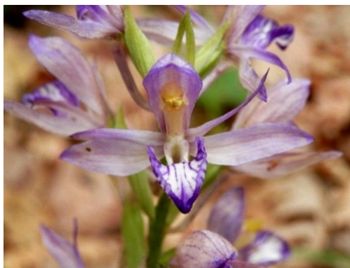
Slika 67. Limodorum abortivum (L.) Sw.

Opis: višegodišnja zeljasta biljka, stabljika joj je uspravna, kruta i mesnata. Listovi su joj u obliku sjedećih listova. Cvjetovi su dvospolni i skupljeni u grozdaste cvatove, cvjeta u travnju i svibnju. Plod je tobolac. Raste na kamenjarima od nizinskog do brdskog područja (Nikolić 2021).