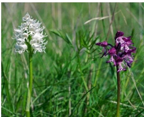
Slika 81. Orchis simia Lam.

Opis: trajnica sa zeljastom stabljikom, listovi su joj duguljasto-jajoliki. Cvjetovi su joj dvospolni i skupljeni u cvatove, cvjetaju od travnja do lipnja. Plod je tobolac. A biljka raste na suhim livadama i proplancima, te u listopadnim šumama (Nikolić 2021).