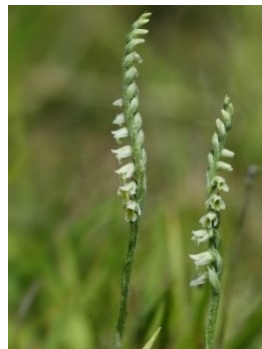
Slika 86. Spiranthes spiralis (L.) Chevall.

Opis: zeljasta trajnica s dlakavom stabljikom. Listovi su izduženo-jajoliki i na vrhu ušiljeni. Cvjetovi su dvospolni i skupljeni u spiralni duguljasti cvat, cvjetaju od kolovoza do listopada. Plod je ovalna kapsula s mnoštvom sjemenki. Raste na sunčanim i suhim staništima nizinskog i gorskog pojasa (Nikolić 2021).