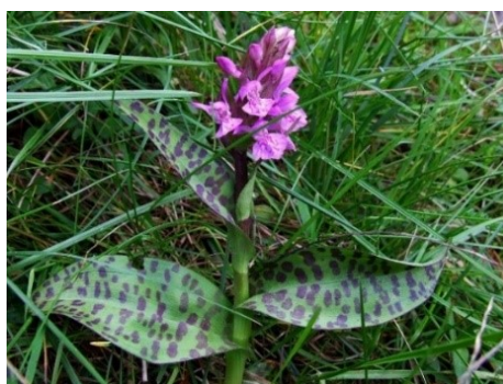
Slika 60. Dactylorhiza maculata (L.) Soo.

Opis: trajna biljka čija je stabljika uspravna, valjkasta i vitka. Listovi su joj naizmjenični, obrnuto jajasti ili kopljasti. Cvjetovi su joj dvospolni i nepravilni, cvjeta u lipnju u srpnju. Plod je kapsula koja sadrži mnogo sitnih sjemenki. Raste na vlažnim i rastresitim tlima (Nikolić 2021).