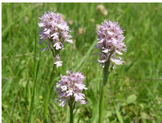
Slika 83. Orchis tridentata Scop. www.prodass.ru

Opis: biljka trajnica, stabljika je uspravna i visoka do 40 cm na kojoj rastu lancelasti listovi. Cvjetovi su dvospolni i skupljeni u jajaste cvatove koji cvjetaju od svibnja do lipnja. Plod je tobolac a biljka raste na suhim livadama i u svijetlim šumama (Žitković 2009).