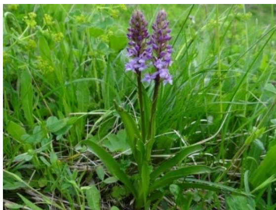
Slika 65. Gymnadenia conopsea (L.) R.Br.

Opis: trajna zeljasta biljka čija je stabljika uspravna i vitka. Listovi su lanceolasti i obavijaju stabljiku. Cvjetovi dvospolni i skupljeni u cvatove, cvjetaju od svibnja do kolovoza. Plodovi su kapsule. Raste na vlažnim livadama i u svjetlim šumama (Franjić i Škvorc 2014).