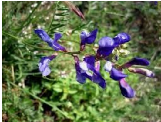
Slika 50. Vicia onobrychioides L.

Opis: zeljasta biljka trajnica koja ima голу stabljiku, može narasti do 120 cm visine. Ima perasto sastavljene listove sa ovalnim liskama. Cvjetovi su sklopljeni u cvat, dvospolni su. Plod je mahuna sa 10 sjemenki. Raste uz rubove šuma i na suhim livadama (Žitković 2009).