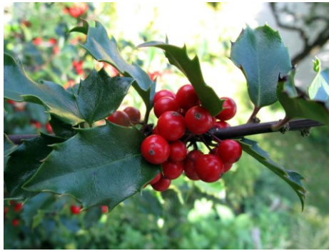
Slika 42. Ilex aquifolium L.

Opis: grm ili niže stablo koje naraste do 5 m visine. Kora je tanka i glatka a lišće je naizmjenično poredano i jajolikog oblika, ima bodlje na rubovima, zimzeleno je. Cvijet je je jednospolan dvodomn, cvjeta u travnju, svibnju i lipnju. Plodovi su koštunice koje su otrovne. Raste na brdskim, gorskim i vlažnim područjima (Ravlić 2021).