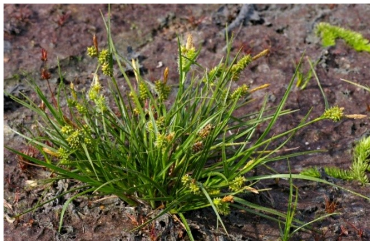
Slika 21. Carex serotina Merat.

Opis: trobridna stabljika, lišće raste samo na bazi stabljike. Cvijet je dvospolan i skupljen u cvat. Plod je trobridan. Ove vrste rastu na vlažnim livadama i cretovima (Nikolić 2021).