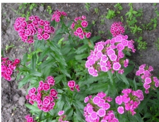
Slika 27. Dianthus barbatus L. www.plantsoftheworldonline.org

Opis: zeljasta biljka visine do 50 cm, ima duguljaste ušiljene listove. Cvjetovi su skupljeni u čuprak a cvjeta od lipnja do rujna. Plod je jednosjemeni tobolac. Raste na dobro osunčanim područjima (Žitković 2009).