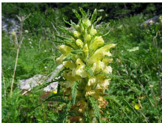
Slika 45. Pedicularis hoermanniana K.Maly.

Opis: zeljasta trajnica koja ima uspravnu i голу stabljiku visoku do 100 cm. Listovi su joj mlohavi i perasto razdijeljeni. Cvjetovi su gusto zbijeni i dvospolni, cvjeta od lipnja do kolovoza. Plod je višesjemeni tobolac. Raste na kamenitim tlima (Nikolić 2021).