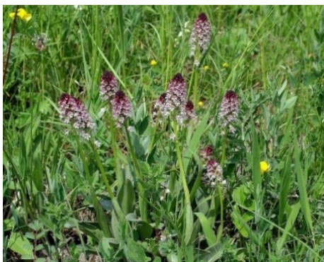
Slika 84. Orchis ustulata L. www.otpolov.ru

Opis: trajna zeljasta biljka sa uspravnom i cilindričnom stabljikom i visokom do 30 cm. Listovi su kopljasti sa izraženom nervaturom. Cvjetovi su dvospolni i skupljeni u valjkaste cvatove, cvjetaju od travnja do srpnja. Plod je tobolac sa mnogo malih sjemenki a biljka raste na suhim i vlažnim područjima od nizina do planinskog područja (Žitković 2009).