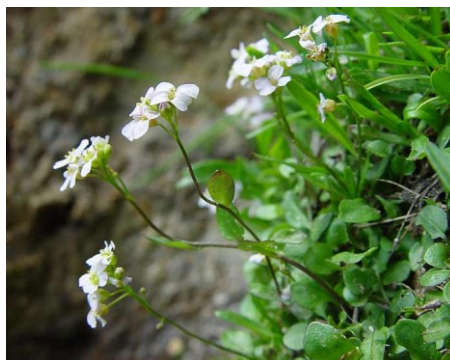
Slika 11. Cardaminopsis halleri (L.) Hayek.

Opis: višegodišnja biljka sa uspravnom stabljikom, prizemni listovi su u rozeti a oni na stabljici su smješteni naizmjenično. Cvjetovi su skupljeni u cvatove koji cvjetaju u travnju, svibnju i lipnju. Plodovi su komuške. Raste na brdskim travnjacima i šumskim čistinama (Žitković 2009).