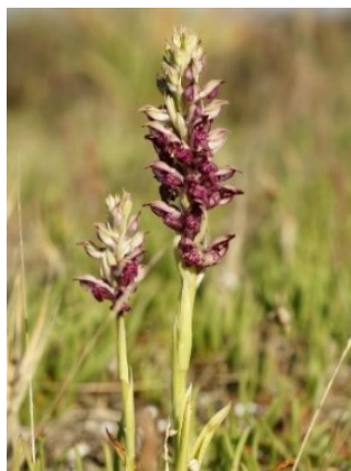
Slika 74. Orchis coriophora L.

Opis: trajna zeljasta biljka čija je stabljika uspravna i okrugla. Listovi su naizmjenično postavljeni, kopljasto linealnog oblika. Cvjetovi su dvospolni i skupljeni u guste cvatove koji cvjetaju od travnja do srpnja. Plod je tobolac s mnoštvo sjemenki. Raste na vlažnim i suhim područjima poput travnjaka od nizina do gorskog područja (Nikolić 2021).