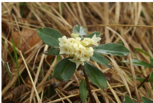
Slika 25. Daphne blagayana Freyer. www.tecen.si

Opis: to je zimzeleni grm kojemu su listovi spiralno smješteni i obrnuto jajasti. Cvjetovi su mu dvospolni jednodomni i skupljeni u cvatove, cvjetaju od ožujka do svibnja. Plod je boba. Raste u svijetlim listopadnim šumama i livadama na brdskim i planinskim područjima (Nikolić 2021).