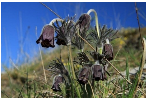
Slika 9. Pulsatilla pratensis (L.) Miller ssp. nigricans (Storck) Zam.

Opis: to je zeljasta biljka sa stabljikom koja je gusto prekrivena dlačicama, listovi su joj složeno razgranati. Cvjetovi su joj dvospolni, pojedinačni, zvonastog oblika i vise, cvjetaju u svibnju. Plod je jednosjemeni oraščić. Raste na šumskim čistinama i prosjekama (Žitković 2009).