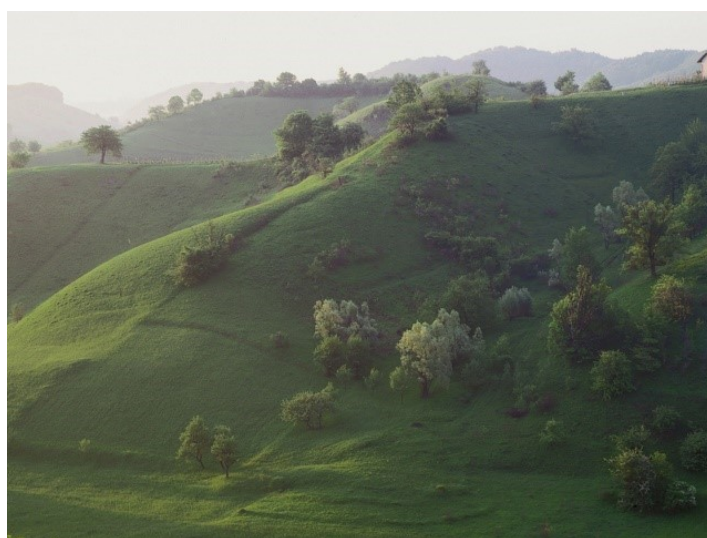
Slika 4. Travnjaci.