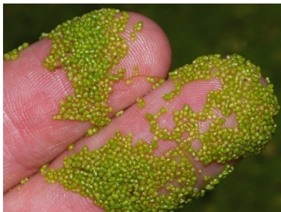
Slika 51. Wolffia arrhiza (L.) Horkel ex wimm.

Opis: sitna biljka trajnica koja pluta i nema korijena, stabla niti listova. Razmnožava se vegetativno (diobom) i spolno. Cvijet se rijetko razvija, ako se razvije onda su jednospolni jednodomni. Živi u stajaćim i toplim vodama (Ravlić 2021).