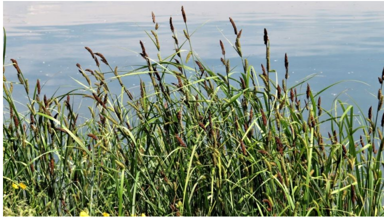
Slika 20. Carex riparia Curtis. www.antropocene.it

Opis: ima trobridnu stabljiku, listovi rastu na donjem dijelu stabljike i na gornjem dijelu stabljike. Cvijetovi su dvospolni i skupljeni u cvat. Plod je jajolik i trobridan. Raste na poplavnim područjima (Žitković 2009).