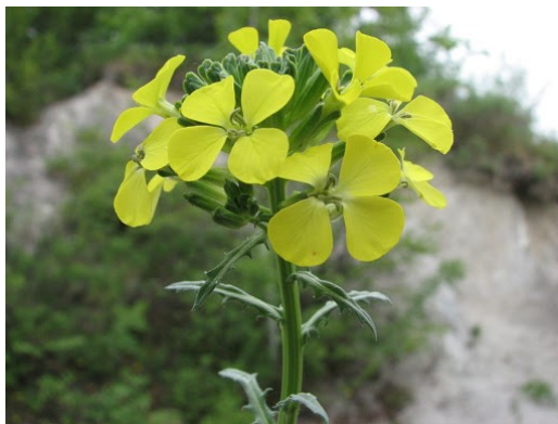
Slika 12. Erysimum carniolicum Dolliner.

Opis: zeljasta biljka koja je obrasla prileglim dlakama. Prizemni listovi su skupljeni u rozetu i imaju peteljku, a gornji listovi su sjedeći na stabljici. Cvat je grozdast i cvijeće je žuto, cvjeta od travnja do srpnja. Plod je komuška. Pronalazimo ju na kamenitim padinama sa puno sunca te na travnjacima (Franjić i Škvorc 2014).