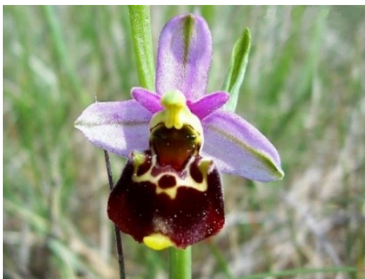
Slika 71. Ophrys fuciflora Haller

Opis: listovi su joj ovalni i ušiljeni. Cvjetovi su jednospolni i pojedinačni koji cvjetaju od travnja do lipnja. Plod je tobolac. Biljka raste na travnjacima na vapnenastim tlima (Žitković 2009).