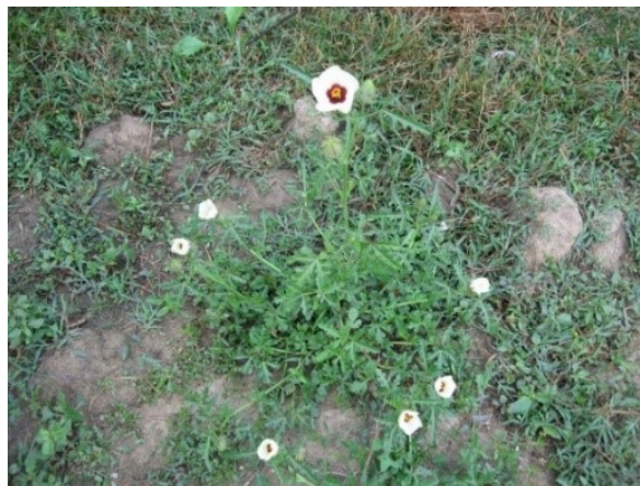
Slika 39. Hibiscus trionum L. www.vetemenyem.hu

Opis: zeljasta biljka čija je stabljika uspravna i ragranata, visoka do 50 cm. Listovi su naizmjenični i razdijeljeni. Cvjetovi su pojedinačni i cvjetaju od srpnja do kolovoza. Plod je tobolac. Raste kao korov na obrađenim tlima, uz putove, u nizinama i brdima (Ravlić 2021).