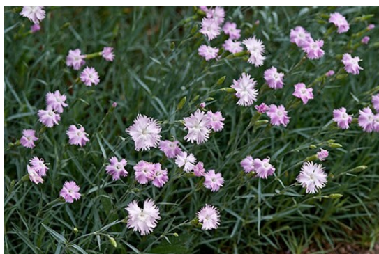
Slika 29. Dianthus monspessulanus L.

Opis: zeljasta trajnica koja je visoke do 50 cm, listovi su joj uski i obavijaju stabljiku. Cvjetovi su dvospolni i cvjetaju od lipnja do kolovoza. Plod je jednosjemeni tobolac. Raste na kamenitim područjima i šikarama, može i uz rubove šuma (Žitković 2009).