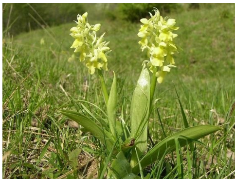
Slika 79. Orchis pallens L.

Opis: biljka trajnica, na čijoj stabljici rastu obrnuto jajasti listovi ušiljenih vrhova. Cvjetovi su skupljeni u cvatove koji cvjetaju od travnja do lipnja. Plod je tobolac a biljka raste u svijetlim šumama, šikarama i također na livadama (Žitković 2009).