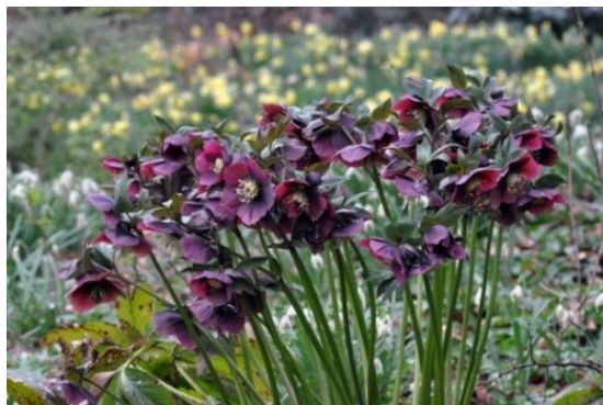
Slika 7. Helleborus atrorubens Waldst.et Kit. www.beautifulnow.is

Opis: ima голу stabljiku na kojoj se nalaze razdijenjani listovi s nazubljenim rubom. Cvijet se sastoji od mnogo prašnika i cvjeta u ožujku i travnju. Plod je mjehur. Raste na rubovima šuma i u živicama. Biljka je otrovna (Žitković 2009).