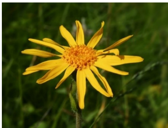
Slika 14. Arnica montana L.

Opis: ovo je zeljasta trajnica kojoj je stabljika obrasla kratkim dlačicama, listovi su nasuprotni i uzdužno jajolikog oblika. Cvijetovi su skupljeni u glavičasti cvat i cvjeta od lipnja do kolovoza. Plod je jednosjemena roška. Raste na brdskim i planinskim obroncima (Franjić i Škvorc 2014).