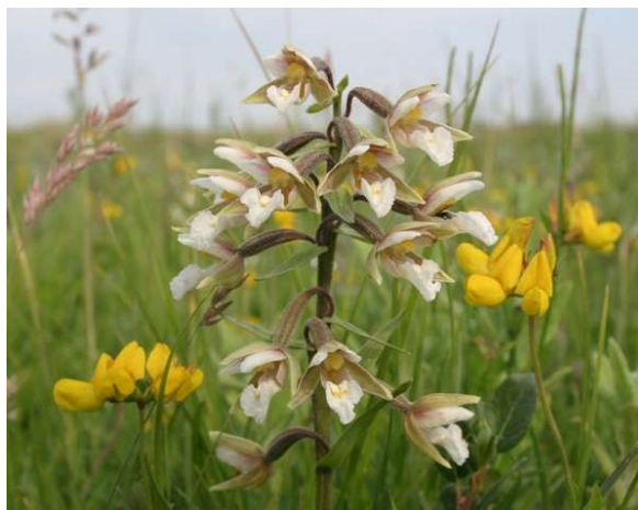
Slika 63. Epipactis palustris (L.) Crantz.

Opis: stabljika visoka 80 cm, do pola obrasla listovima. Cvijeće je skupljeno u cvat, dvospolno je i cvjeta od lipnja do kolovoza. Plod je kapsula sa mnogo sitnih sjemenki. Raste na vlažnim livadama i u vlažnim šumama (Žitković 2009).