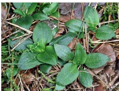
Slika 64. Goodyera repens (L.) R.Br. www.atlas.roslin.pl

Opis: trajna zeljasta biljka, stabljika je prilegla i u gornjem dijelu dlakava. Listovi su ovalni i skupljeni u rozete. Cvjetovi su dvospolni i skupljeni u cvatove, cvjetaju od srpnja do kolovoza. Plod je tobolac. Raste na humusnim tlima crnogoričnih i miješanih šuma (Nikolić 2021).