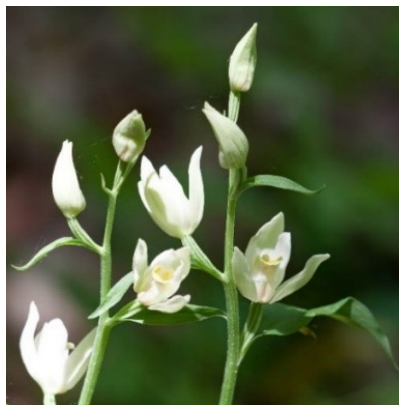
Slika 53. Cephalanthera damasonium (Mill.) Druce. www.lhbkw.com

Opis: trajna zeljasta biljka koja ima uspravnu i голу stabljiku. Listovi su joj naizmjenični i jajasti. Cvjetovi su dvospolni i pojedinačni, cvjetaju u svibnju i lipnju. Plod je kapsula sa sjemenkama. Biljka raste u listopadnim šumama i rjeđe vlažnim područjima (Žitković 2009).