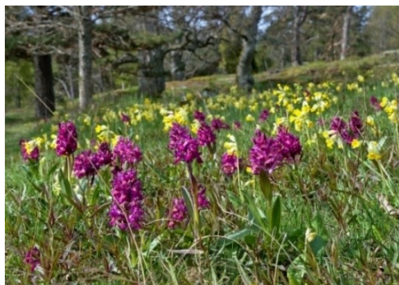
Slika 61. Dactylorhiza sambucina (L.) Soo. www.data.abuledu.org

Opis: zeljasta biljka s glatkom i šupljom stabljikom. Listovi su kopljasti i nemaju mrlja. Cvjetovi su dvospolni i skupljeni u cvatove, cvjetaju od travnja do srpnja. Plod je kapsula s mnogo sitnih sjemenki. Raste od nizinskih do planinskih osunčanih mjesta (Žitković 2009).