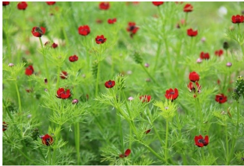
Slika 5. Adonis aestivalis L.

Opis: ljetni gorocvijet je višegodišnja biljka, biljka naraste do 40 cm visine. Listovi su mu naizmjenični a cvjetovi pojedinačni, krupni i dvospolni, cvjetaju od svibnja do srpnja. Plodovi su jednosjemeni oraščići. Biljka je najviše rasprostranjena u Europi osim krajnjeg sjevera europa, raste na suhim i sunčanim zapuštenim zemljištima. Cijela biljka je otrovna (Nikolić 2021).