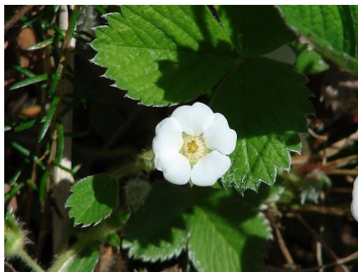
Slika 47. Potentilla carniolica A.Kern.

Opis: zeljasta trajnica do 12 cm visoka. Listovi su dlanasto razdijeljeni ja jajolike liske. Cvjetovi su pojedinačni i cvjetaju od ožujka do svibnja. Plod je oraščić. Raste u svijetlim šumama i na šumskim čistinama (Žitković 2009).