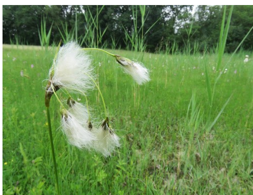
Slika 24. Eriophorum latifolium Hoppe.

Opis: višegodišnja biljka, ima okrugle i glatke stabljike. Lišće raste na bazi stabljike i na stabljici, izduženi su i lanceolasti. Cvjetovi su dvospolni i skupljeni u klasiće, cvjeta od travnja i lipnja. Plod je oraščić. Raste na vlažnim livadama a može i na suhim mjestima (Franjić i Škvorc 2014).