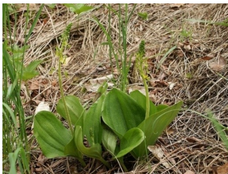
Slika 68. Listera ovata (L.) R.Br.

Opis: trajna zeljasta biljka čija je stabljika uspravna, snažna i bezlisna. Listovi su joj nasuprotni, jednostavni i ovalni. Cvjetovi su dvospolni i skupljeni u dvospolne cvatove, cvjeta od svibnja do lipnja. Plod je tobolac s mnoštvo sjemenki. Raste u toplim šumama (Franjić i Škvorc 2014).