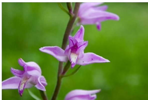
Slika 55. Cephalanthera rubra (L.) Rich. www.longwood.cz

Opis: trajna zeljasta biljka čija je stabljika uspravna i vijugava, dlakava samo pri gornjem dijelu. Listovi su naizmjenični i lanceolasti. Cvjetovi su dvospolni i nepravilni i cvjetaju u lipnju i srpnju. Plod je trodijelna kapsula. Raste u svijetlim šumama (Žitković 2009).