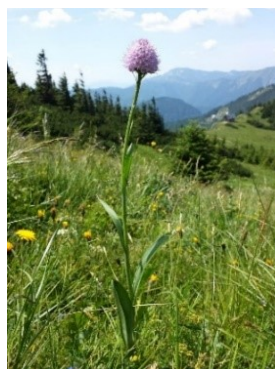
Slika 87. Traunsteinera globosa (L.) Rchb.

Opis: trajnica sa stabljikom do 60 cm. Ima lancetaste listove. Cvjetovi su skupljeni u čunjast cvat i dvospolni su, cvjetaju od svibnja do srpnja. Plodovi su tobolci. Biljka raste na svježim tlima s malo dušika koja su dobro osunčana (Franjić i Škvorec 2014).