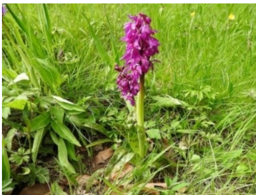
Slika 76. Orchis mascula (L.) L.

Opis: biljka trajnica, na čijoj donjoj strani stabljike rastu duguljasto kopljasti listovi sa ušiljenim vrhom. Cvjetovi su dvospolni i skupljeni u metličasti cvat, cvjetaju od travnja do lipnja. Plod je je tobolac sa više sjemenki. Biljka raste na travnjacima i livadama, vlažnim i osunčanim područjima (Nikolić 2021).