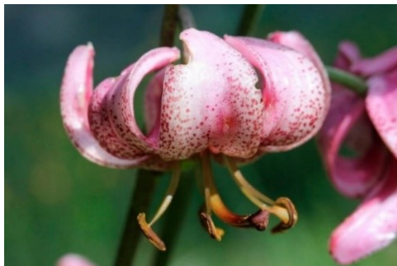
Slika 34. Lilium martagon L.

Opis: trajna zeljasta biljka, stabljika je uspravna i gola. Listovi su joj naizmjenično smješteni, duguljasto eliptični. Cvjetovi su dvospolni i skupljeni u cvatove, cvjetaju od svibnja do srpnja. Plod mu je tobolac. Rastu na humusnim tlima livada i šuma (Žitković 2009 ).