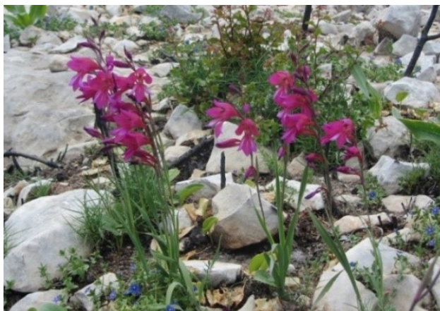
Slika 35. Gladiolus illyricus W.D.J. Koch.

Opis: zeljasta trajnica do 50 cm visoka, ima uspravnu i tanku stabljiku na kojoj su kruti listovi. Cvjetovi su pojedinačni i cvjetaju od lipnja do srpnja. Raste na suhim brdskim travnjacima (Nikolić 2021).