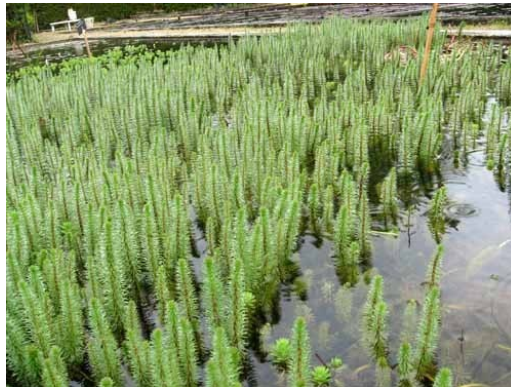
Slika 40. Hippuris vulgaris L.

Opis: zeljasta i močvarna biljka čija je stabljika člankovita, može doseći visinu od 100 cm. Listovi su joj uspravni i linealni, skupljeni u pršljenove. Cvjetovi su dvospolni i cvjetaju od svibnja do kolovoza. Plod je jednosjemena koštunica. Biljka raste u močvarnim staništima (Franjić i Škvorc 2014).