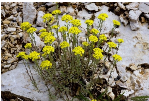
Slika 10. Alyssum montanum L.

Opis: zeljasta biljka čiji su stabljika i listovi prekriveni sa zvjezdastim dlačicama, listovi su jajastog oblika a prema vrhu su suženi. Cvjetovi su žuti i skupljeni u grozdove koji cvjetaju u ožujku i travnju. Plod je komuščica. Ova biljka raste na kamenjarskim travnjacima (Nikolić 2021).