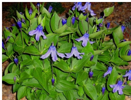
Slika 6. Clematis integrifolia L.

Opis: ovo je biljka sa krutom stabljikom na kojoj rastu jajoliki listovi sa ušiljenim vrhovima. Cvjetovi su pojedinačni ili u sastavljenim cvatovima, zvonoliki. Cvjeta u svibnju i lipnju. Plod je jednosjemeni oraščić. Biljka raste na polusjenovitim toplijim livadama. Cijela biljka je otrovna (Žitković 2009).