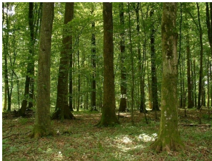
Slika 3. Šuma hrasta kitnjaka i običnog graba.

travnjaka su srednjoeuropske mezofilne livade koje nalazimo u nižim predjelima, dok su subkontinentalni suhi travnjaci u višim predjelima (Vrbek 2010).