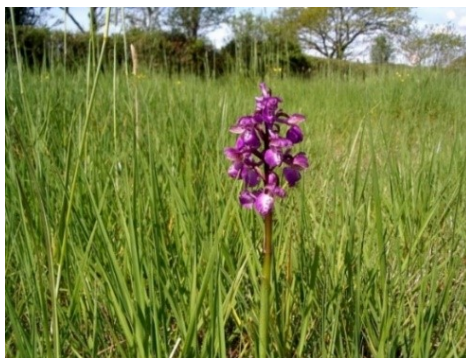
Slika 78. Orchis morio L. www.freenatureimages.eu

Opis: višegodišnja zeljasta biljka, stabljika je uspravna koja može narasti do 15 cm. Listovi su naizmjenični, izduženo lanceolasti i ušiljeni. Cvjetovi su dvospolni i skupljeni u dugi klasasti cvat, cvjeta od travnja do srpnja. Plod je tobolac sa mnogo sitnih sjemenki. Raste na dobro osunčanim, suhim ili umjereno vlažnim livadama i travnjacima, može i šumama (Franjić i Škvorc 2014).