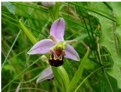
Slika 70. Ophrys apifera Huds.

Opis: zeljasta trajnica čija je stabljika gola i uspravna. Lišće joj je naizmjenično raspoređeno, duguljasto je. Cvjetovi su skupljeni u okruglasti cvat, jednospolni cvjetovi koji cvjetaju od svibnja do srpnja. Plod je tobolac sa mnoštvo sjemenki. Raste u svijetlim šumama i na suhim livadama (Nikolić 2021).