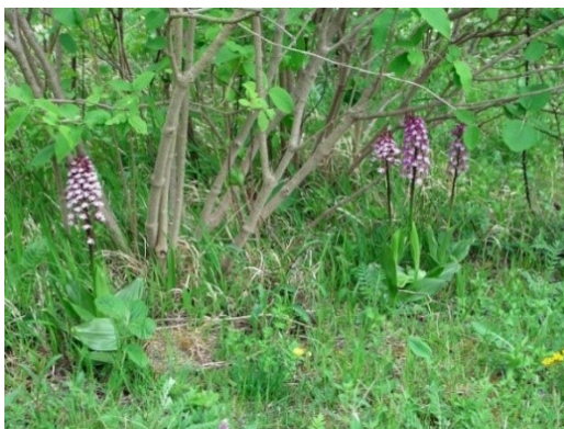
Slika 80. Orchis purpurea Huds. www.atlas.roslin.pl

Opis: trajna zeljasta biljka čija je stabljika vitka i uspravna, visoka do 80 cm. Listovi su joj široko eliptični. Cvjetovi su joj dvospolni i skupljeni u cvatove, cvjetaju od travnja do lipnja. Plod je tobolac sa mnogo malih sjemenki. Raste na toplim i vlažnim livadama te šumama (Franjić i Škvorc 2014).