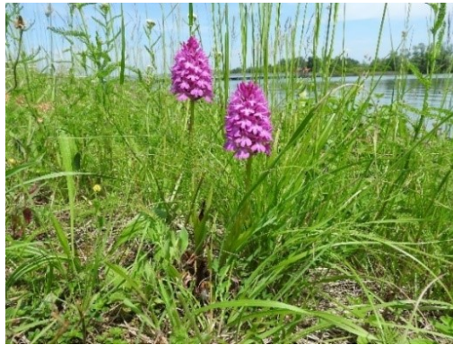
Slika 52. Anacamptis pyramidalis (L.) www.jardin-secrets.com

Opis: trajna zeljasta biljka čija je stabljika uspravna i tanka. Listovi su naizmjenični i duguljasti. Cvjetovi su dvospolni i skupljeni u grozdasti cvat, cvjetaju od travnja do srpnja. Plod je višesjemeni tobolac. Raste na sunčanim zemljištima poput livada, travnjaka (Franjić i Škvorc 2014).