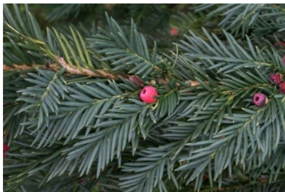
Slika 48. Taxus baccata L. www.os-vnazor-cepin.skole.hr

Opis: zimzeleni grm ili nisko stablo, kora je tanka a mladosti vrlo glatka. Ima plosnate iglice koje su mekane i otrovne, raspoređene su česljasno na oba dvije strane. Cvjetovi su jednospolni dvodomni. Muški cvjetovi cvjetaju u jesen a ženski u proljeće. Plod je otrovna sjemenka obavijena sa jestivim arilusom. Raste na sjenovitim područjima (Nikolić 2021).