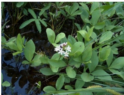
Slika 43. Menyanthes trifoliata L.

Opis: zeljasta biljka trajnica, visine do 20 cm. Stabljika je uspravna i gola bez listova. Listovi rastu na bazi stabljike i trodijelni su. Cvjetovi su dvospolni i skupljeni u grozdaste cvatove, cvjetaju u svibnju i lipnju. Plod je okruglasta kapsula. Stanište su joj bare i močvare (Nikolić 2021).