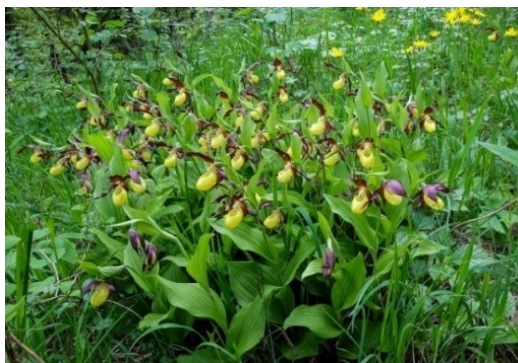
Slika 57. Cypripedium calceolus L.

Opis: trajna zeljasta biljka čija je stabljika uspravna i jednostavna, pri gornjem dijelu kratko dlakava. Listovi su naizmjenični i široko eliptični sa ušiljenim vrhom. Cvjetovi su dvospolni i pojedinačni, cvjetaju od svibnja do srpnja. Plod je tobolac sa mnoštvo sitnih sjemenki. Biljka raste na polusjenovitim listopadnim šumama i rubovima šuma (Žitković 2009).