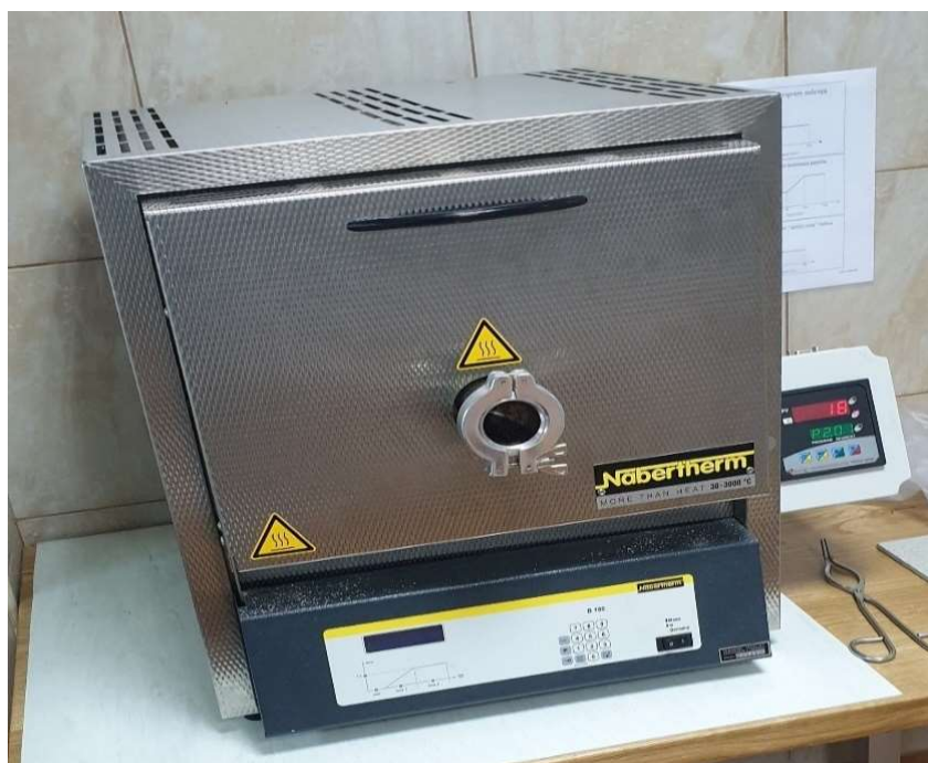
Slika 10. Mufolna peć

Određivanje sadržaja pepela provodi se u mufolnoj peći marke Nabertherm L9/13/B180 (slika 10). Pomoću analitičke vage s preciznošću od 1 mg važe se masa praznih keramičkih posudica koje se napune s 1 g uzorka nakon čega se slažu unutar peći, a svojstvo svakog uzorka određuje se u tri ponavljanja. Ispitivanje započinje jednolikim podizanjem temperature na 250 °C u trajanju od 30 minuta, a postignuta temperatura se zadržava sljedećih 60 minuta radi isparavanja hlapivih komponenti iz materijala. U sljedećih 30 minuta peć se zagrijava do konačne temperature od 550±10 °C i sama temperatura se zadržava još 120 minuta.