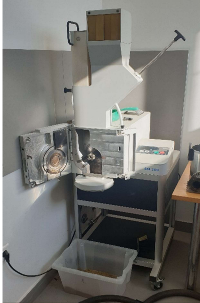
Slika 5. Mlin SM 300

Druga se faza izvodila pomoću mlina Retsch SM 300 (slika 5) koji za usitnjavanje koristi spiralni nož (slika 6) i sito četvrtastog otvora (promjera 2 mm), a sama frekvencija vrtnje noža je iznosila 1500 \text{ min}^{-1} .