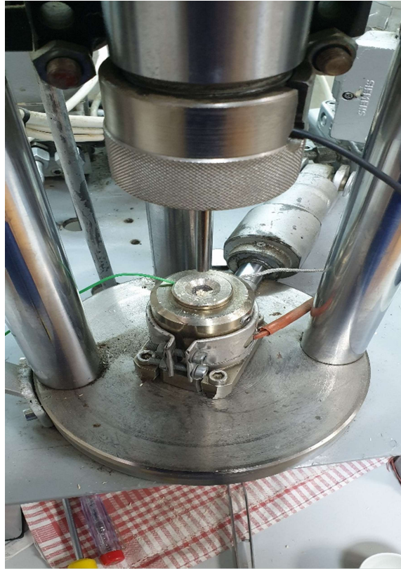
Slika 19. Spuštanje klipa na uzorak

Nakon što se preša zagrije, uzorak se pomoću lijevka stavlja u matricu (slika 18) i započinje s prešanjem uzorka tako što se povećava sila s kojom klip (slika 19) djeluje na uzorak do iznosa 5 kN. Nakon postignute sile ona se zadržava još 10 sekundi. Sila prestaje djelovati, otvara se matrica i lagano se djelovanjem klipa istisne uzorak u posudicu. Pelet se važe na analitičkoj vagi, a potom se na mikrometru mjere promjer i duljina peleta i tako se za svaku skupinu uzoraka ponavlja 20 puta. Na kraju se uzorci odlažu u epruvete (slika 20).