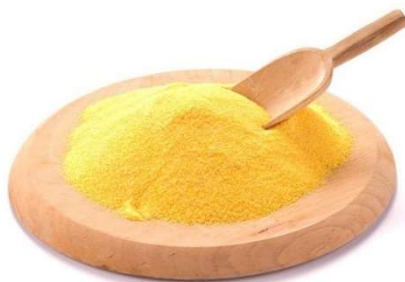
Slika 4. Kukuruzno brašno

Kukuruzno brašno (slika 4) je brašno dobiveno mljevenjem kukuruza. Nutritivne vrijednosti u 100 g brašna su: energetska vrijednost (361 kcal/1518 kJ), masti (2.6 g), zasićene masne kiseline (0.4 g), ugljikohidrati (24 g), šećeri (1.3 g), bjelančevine (7 g), sol (0.2 g). Dodavanjem kukuruznog brašna peletima probala se postići bolja povezanost između čestica unutar peleta ( www.podravka.hr ).