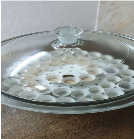
Slika 11. Eksikator s uzorcima

Nakon završetka procesa peć se prazni, a uzorci (slika 12) se 5 do 10 minuta hlade na otvorenom nakon čega se stavljaju u eksikator (slika 11) da se ohlade na sobnu temperaturu i na kraju se uzorak ponovno važe.