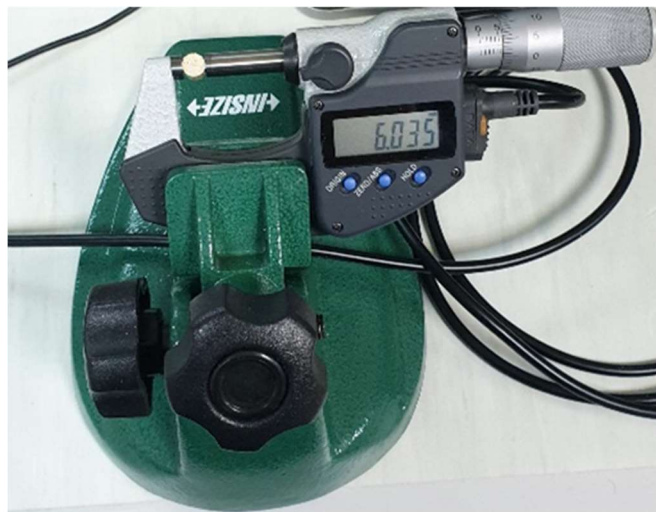
Slika 21. Mjerenje dimenzija peleta

Mjerenje dimenzija peleta (duljine i promjera) i mase nakon prešanja provodi se pomoću mikrometra sa stalkom (slika 21), a masa se važe na analitičkoj vagi s točnošću 1mg (Sartorius Talent TE214S-OCE). Uređaji su povezani s računalom koji pomoću softvera sprema podatke izmjera.