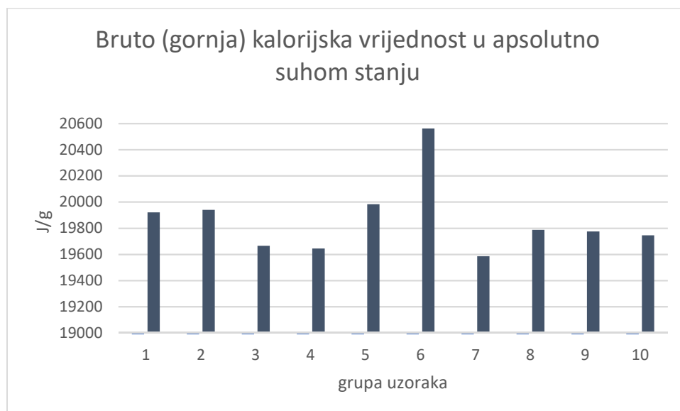
Dijagram 12. Kalorijska vrijednost peleta

U Excel tablicama se upisivao prosječan sadržaj vode svih uzoraka i rezultati ispitivanja kalorijske vrijednosti. Bruto kalorijska vrijednost pri sadržaju vode se prepisivala s ekrana uređaja (kalorimetra), dok se bruto kalorijska vrijednost u apsolutno suhom stanju računala pomoću bruto kalorijske vrijednosti pri sadržaju vode te prosječnog sadržaja vode uzoraka.