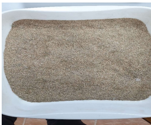
Slika 7. Usitnjena jelovina