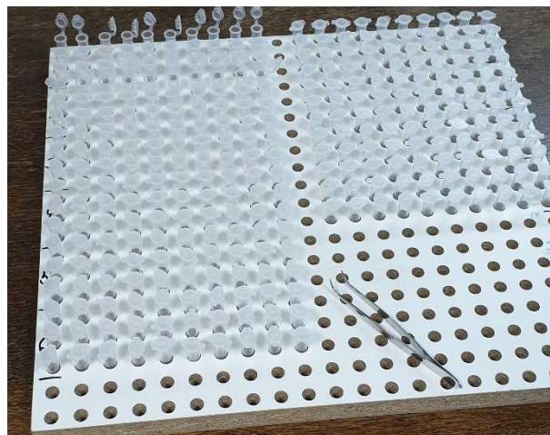
Slika 20. Izrađeni peleti u epruvetama

Nakon što se preša zagrije, uzorak se pomoću lijevka stavlja u matricu (slika 18) i započinje s prešanjem uzorka tako što se povećava sila s kojom klip (slika 19) djeluje na uzorak do iznosa 5 kN. Nakon postignute sile ona se zadržava još 10 sekundi. Sila prestaje djelovati, otvara se matrica i lagano se djelovanjem klipa istisne uzorak u posudicu. Pelet se važe na analitičkoj vagi, a potom se na mikrometru mjere promjer i duljina peleta i tako se za svaku skupinu uzoraka ponavlja 20 puta. Na kraju se uzorci odlažu u epruvete (slika 20).