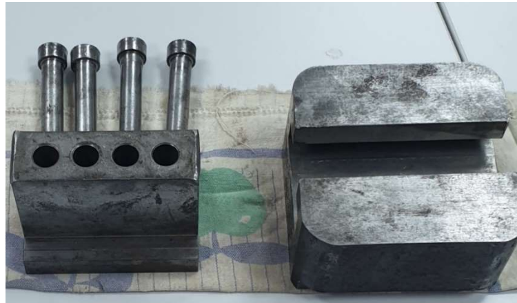
Slika 27. Kalup za prešanje tableta iz drvene sirovine

Ispitivanje započinje vaganjem materijala za izradu tablete, a za svaka tableta ima masu približno 1 g. Izvagani uzorci pune se u kalup koji ima 4 kanala promjera 13 mm.(slika 27).