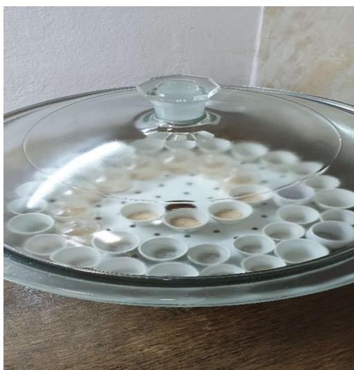
Slika 11. Eksikator s uzorcima

Nakon završetka procesa peć se prazni, a uzorci (slika 12) se 5 do 10 minuta hlade na otvorenom nakon čega se stavljaju u eksikator (slika 11) da se ohlade na sobnu temperaturu i na kraju se uzorak ponovno važe.