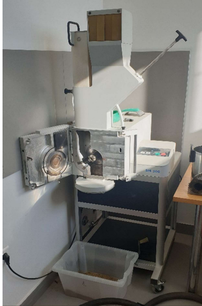
Slika 5. Mlin SM 300

Druga se faza izvodila pomoću mlina Retsch SM 300 (slika 5) koji za usitnjavanje koristi spiralni nož (slika 6) i sito četvrtastog otvora (promjera 2 mm), a sama frekvencija vrtnje noža je iznosila 1500 \text{ min}^{-1} .