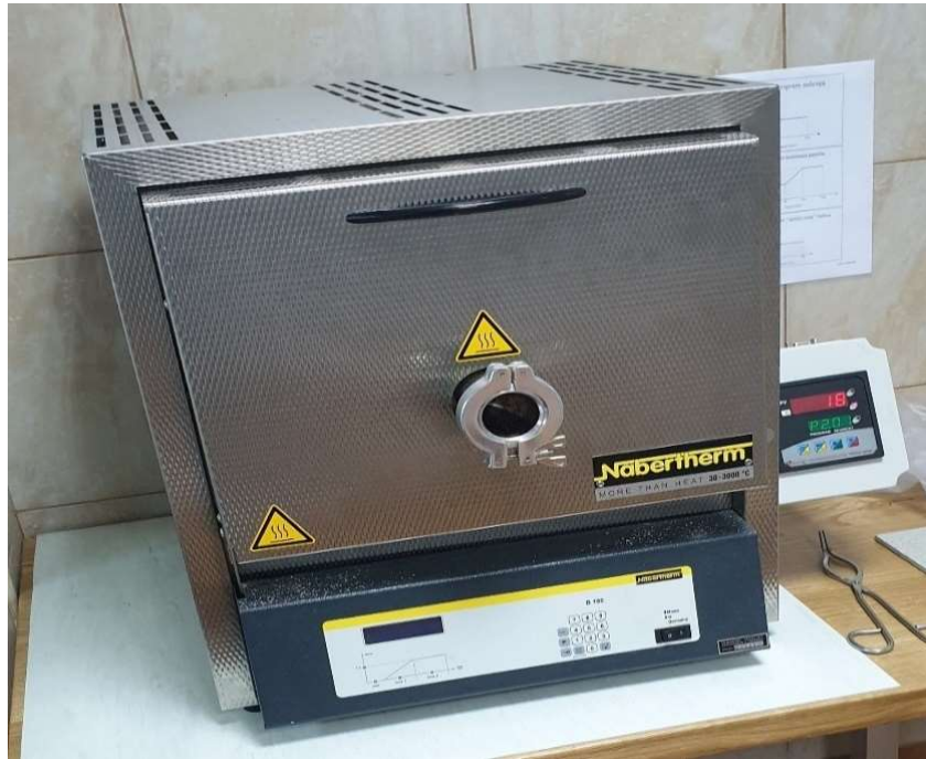
Slika 10. Mufolna peć

Određivanje sadržaja pepela provodi se u mufolnoj peći marke Nabertherm L9/13/B180 (slika 10). Pomoću analitičke vage s preciznošću od 1 mg važe se masa praznih keramičkih posudica koje se napune s 1 g uzorka nakon čega se slažu unutar peći, a svojstvo svakog uzorka određuje se u tri ponavljanja. Ispitivanje započinje jednolikim podizanjem temperature na 250 °C u trajanju od 30 minuta, a postignuta temperatura se zadržava sljedećih 60 minuta radi isparavanja hlapivih komponenti iz materijala. U sljedećih 30 minuta peć se zagrijava do konačne temperature od 550±10 °C i sama temperatura se zadržava još 120 minuta.