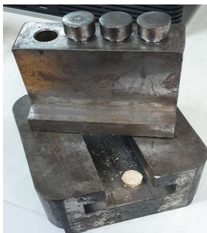
Slika 29. Isprešana tableta od drvene sirovine

Završetkom prešanja sila se otpusti, a tablete (slika 29) se istisnu iz kanala i ponovno se važu na analitičkoj vagi (slika 17). Masa tablete za određivanje kalorijske vrijednosti potrebno je unijeti u kalorimetar.