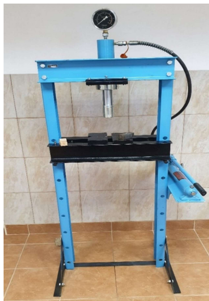
Slika 28. Hidraulična ručna preša

Ispitivanje započinje vaganjem materijala za izradu tablete, a za svaka tableta ima masu približno 1 g. Izvagani uzorci pune se u kalup koji ima 4 kanala promjera 13 mm.(slika 27).