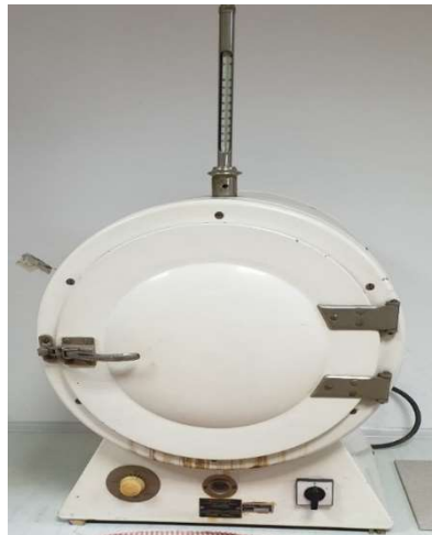
Slika 25. Sušionik

U početku ispitivanja mjeri se masa prazne posudice ( m_1 ) i masa posudice s uzorkom ( m_2 ) te se navedene vrijednosti masa oduzimaju radi dobivanja mase uzorka. Nakon mjerenja uzorci se stavljaju na sušenje u sušionik (slika 25) na temperaturu od 103 \pm 2 °C do konstantne mase.