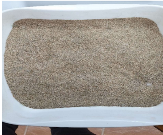
Slika 7. Usitnjena jelovina