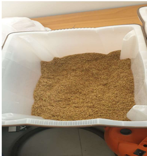
Slika 8. Usitnjena vinova loza