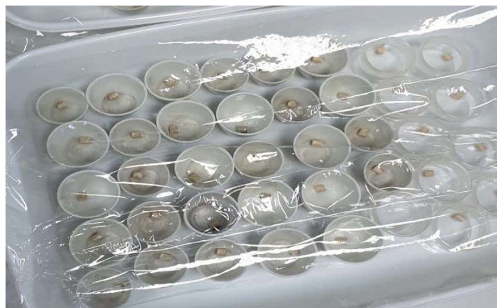
Slika 26. Osušeni pelet

Proces počinje punjenjem klima komore (MEMMERT, IPP 55) (slika 13) s apsolutno suhim uzorcima i podešavaju se parametri temperature na 30 °C te relativne vlage zraka na 90 %. Ispitivanje se provodi u šest vremenskih perioda koji sveukupno traju 180 minuta.