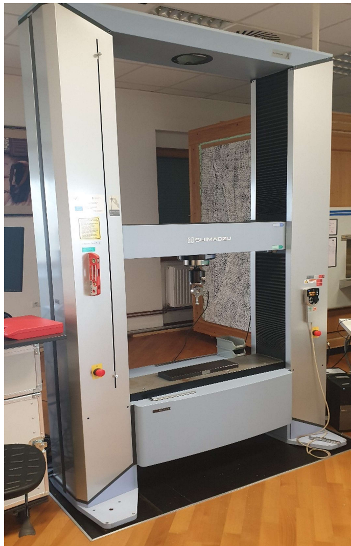
Slika 22. SHIMADZU kidalica

Nakon izmjerenih podataka o promjeru, duljini i masi, započinje određivanje maksimalne vrijednosti sile pri tlačnom ispitivanju koje se provodilo na kidalici (Shimadzu Autograph AG – X plus) (slika 22). Peleti koji su se isprešali koriste se za ispitivanje, a svaka grupa uzoraka ima 10 peleta za ispitivanje.