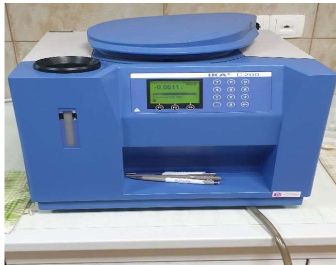
Slika 31. Kalorimetar (IKA C200)