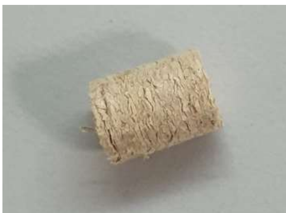
Slika 24. Pelet nakon ispitivanja

Softverom (Trapezium X) se namješta početna visina glave vijka od 15 mm do ploče s peletom i započinje pomak vijka prema uzorku brzinom 300 mm/min. Na visini od 6,5 mm od osnovne ploče brzina pomaka se smanji na 1,5 mm/min i tom brzinom se provodi tlačno ispitivanje (slika 23). Ispitivanje je gotovo kada dođe do loma uzorka nakon čega se glava vijka vrati u početni položaj, a sam softver na računalu iscrtava tokom ispitivanja dijagram F-dl . Pomoću njega je moguće odrediti maksimalnu silu pri kojoj pelet puca te međusobno uspoređivati sve skupine peleta.