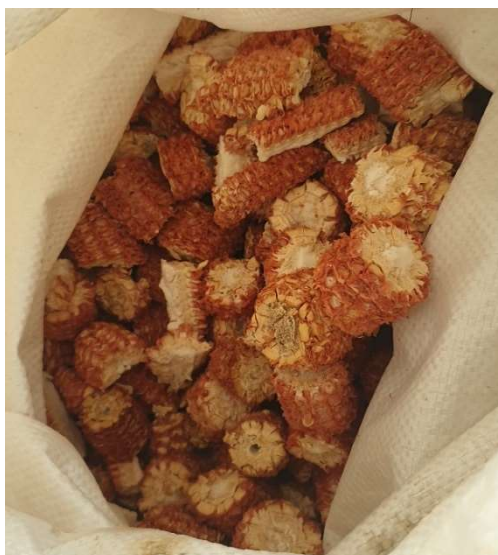
Slika 3. Uzorak kukuruznog oklasaka