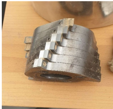
Slika 6. Spiralni nož