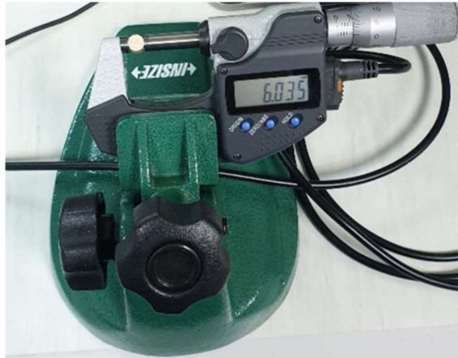
Slika 21. Mjerenje dimenzija peleta

Mjerenje dimenzija peleta (duljine i promjera) i mase nakon prešanja provodi se pomoću mikrometra sa stalkom (slika 21), a masa se važe na analitičkoj vagi s točnošću 1mg (Sartorius Talent TE214S-OCE). Uređaji su povezani s računalom koji pomoću softvera sprema podatke izmjera.