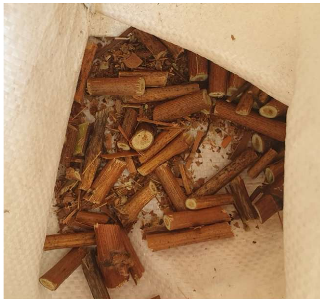
Slika 2. Uzorak vinove loze

Hrvatska je, zahvaljujući reljefu, klimi i tlu te drugim čimbenicima jedna od rijetkih zemalja gdje vinova loza uspijeva u svih pet zona. Ona najsunčanija, pa samim time i najpovoljnija zona, započinje južno od Splita, a završava južno od Dubrovnika, u Konavlima, uključujući i srednjodalmatinske otoke( https://web.archive.org/ ).