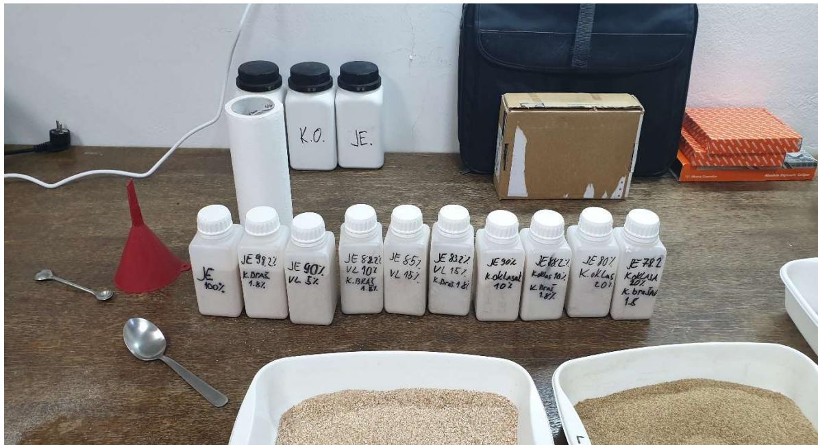
Slika 15. Bočice s pripremljenim uzorcima za peletiranje