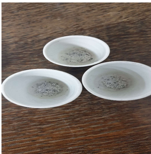
Slika 12. Isprženi uzorci

Nakon završetka procesa peć se prazni, a uzorci (slika 12) se 5 do 10 minuta hlade na otvorenom nakon čega se stavljaju u eksikator (slika 11) da se ohlade na sobnu temperaturu i na kraju se uzorak ponovno važe.