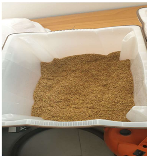
Slika 8. Usitnjena vinova loza