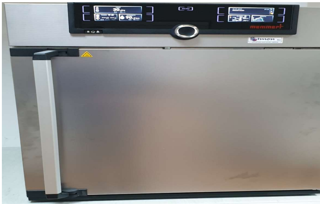
Slika 13. Klima komora

Nakon što se materijal usitnio stavlja se u klima komoru (slika 13) na kondicioniranje koje traje tjedan dana, a ono se provodilo na temperaturi od 30 °C i relativnoj vlazi zraka 80 % u svrhu postizanja što ujednačenijeg sadržaja vode koji pri navedenim parametrima iznosi 12 do 13 %.