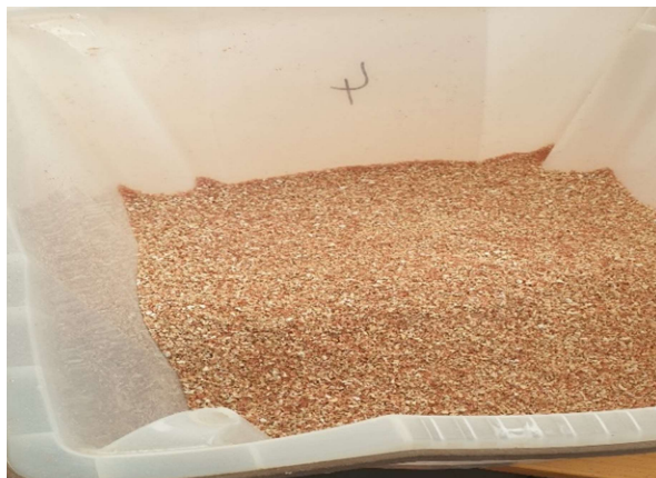
Slika 9. Usinjeni kukuruzni oklasak