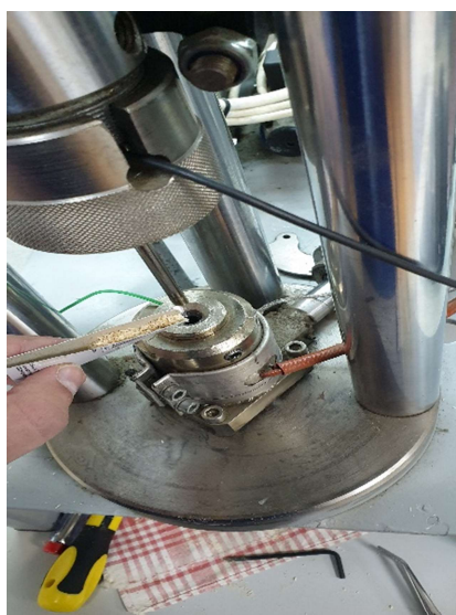
Slika 18. Punjenje matrice lijevkom

Postupak prešanja započinje vaganjem posudice s uzorkom čija masa iznosi 0.25 g, a sama matrica zagrijana je na 150 °C pomoću regulatora temperature i grijača koji je smješten na samoj matrici. Podešavanje sile od 5 kN s kojom će klip djelovati na uzorak vrši se pomoću regulatora tlaka i protoka, a sama sila se pratila pomoću pojačala i softvera na računalu. Na računalo su spojeni još analitička vaga i mikrometar pomoću kojih se mjeri masa, duljina i promjer proizvedenog peleta i svi podaci se automatski unose u odgovarajuće tablice za daljnje analize.