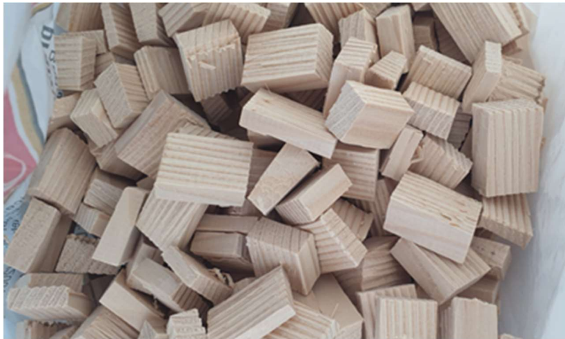
Slika 1. Uzorak drva jele

Nažalost jako je osjetljiva na štetne plinove zbog čega se ne sadi uz industrijska postrojenja te je ugrožena zbog djelovanja kiselih kiša ( https://prirodahrvatske.com ).