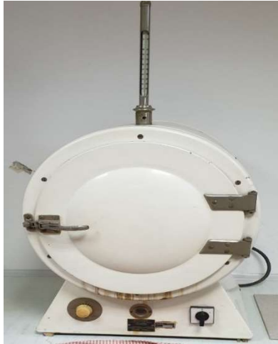
Slika 25. Sušionik

U početku ispitivanja mjeri se masa prazne posudice ( m_1 ) i masa posudice s uzorkom ( m_2 ) te se navedene vrijednosti masa oduzimaju radi dobivanja mase uzorka. Nakon mjerenja uzorci se stavljaju na sušenje u sušionik (slika 25) na temperaturu od 103 \pm 2 °C do konstantne mase.