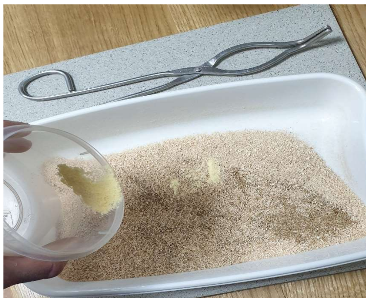
Slika 14. Miješanje uzoraka

Smjesa se priprema po legendi (tablica 4) uz pomoć analitičke vage preciznosti od 1 mg i žlice za miješanje. Izvagana željena količina uzorka sipa se u praznu posudu i miješa žlicom. Dobivena smjesa se pomoću lijevka sipa u bočicu (slika 15) koja se nakon zatvaranja treba protresti.