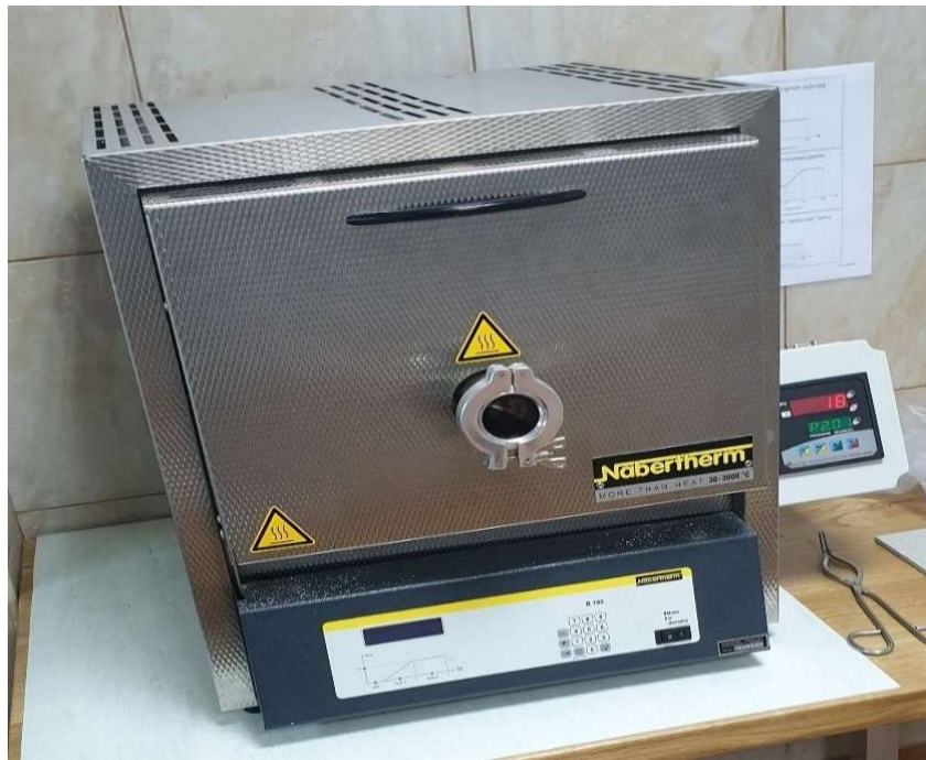
Slika 10. Mufolna peć

Određivanje sadržaja pepela provodi se u mufolnoj peći marke Nabertherm L9/13/B180 (slika 10). Pomoću analitičke vage s preciznošću od 1 mg važe se masa praznih keramičkih posudica koje se napune s 1 g uzorka nakon čega se slažu unutar peći, a svojstvo svakog uzorka određuje se u tri ponavljanja. Ispitivanje započinje jednolikim podizanjem temperature na 250 °C u trajanju od 30 minuta, a postignuta temperatura se zadržava sljedećih 60 minuta radi isparavanja hlapivih komponenti iz materijala. U sljedećih 30 minuta peć se zagrijava do konačne temperature od 550±10 °C i sama temperatura se zadržava još 120 minuta.