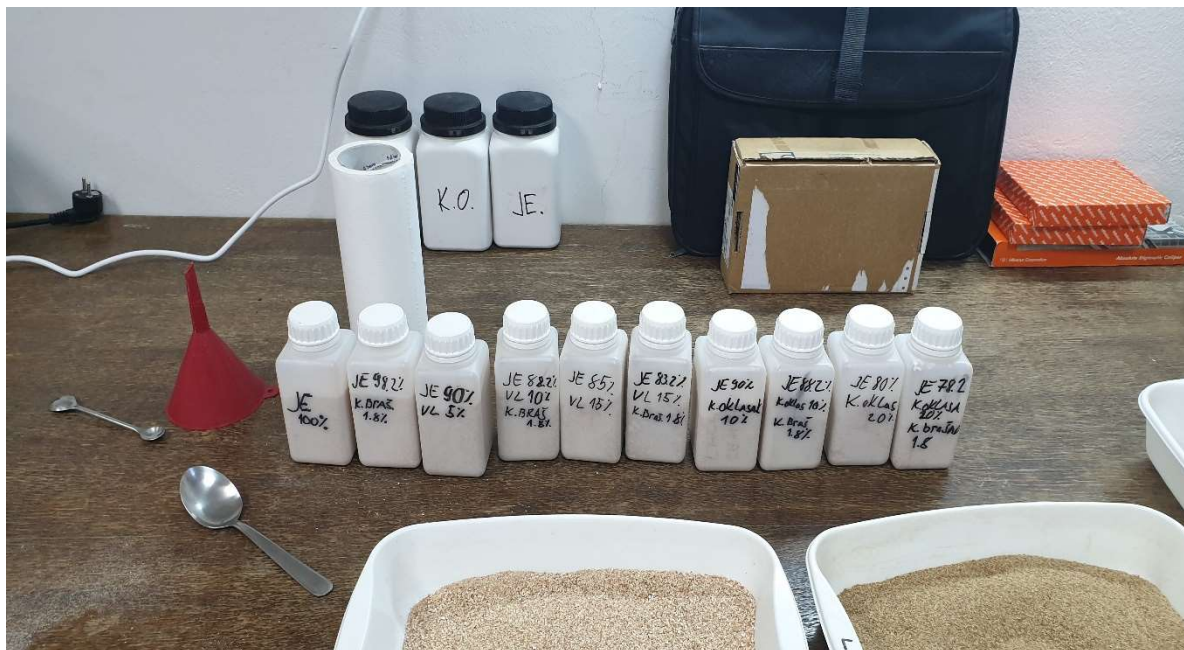
Slika 15. Bočice s pripremljenim uzorcima za peletiranje