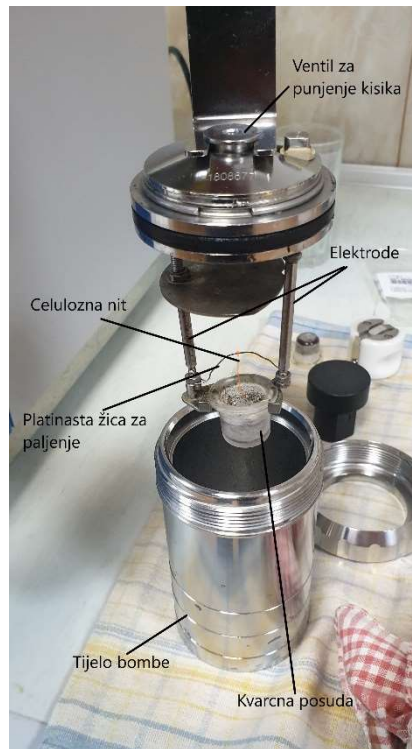
Slika 30. Osnovni dijelovi bombe kalorimetra

Na kraju treće faze na ekranu kalorimetra se iščitava bruto kalorijska vrijednost pri sadržaju vode u J/g .