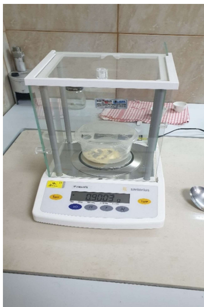
Slika 17. Analitička vaga

Postupak prešanja započinje vaganjem posudice s uzorkom čija masa iznosi 0.25 g, a sama matrica zagrijana je na 150 °C pomoću regulatora temperature i grijača koji je smješten na samoj matrici. Podešavanje sile od 5 kN s kojom će klip djelovati na uzorak vrši se pomoću regulatora tlaka i protoka, a sama sila se pratila pomoću pojačala i softvera na računalu. Na računalo su spojeni još analitička vaga i mikrometar pomoću kojih se mjeri masa, duljina i promjer proizvedenog peleta i svi podaci se automatski unose u odgovarajuće tablice za daljnje analize.