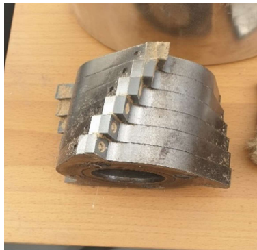
Slika 6. Spiralni nož