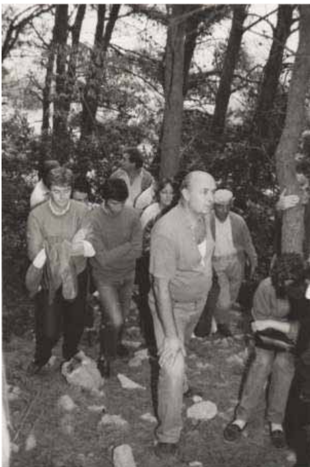
Slika 55 Prof. dr. sc. Ante Tomašević na stručnoj ekskurziji na Rabu 1985. godine

u akademskoj god. 1954./55. i na njemu diplomirao 1959. godine. Prvo zaposlenje bilo mu je u Srednjoj šumarskoj školi za krš u Splitu gdje je bio predavač više šumarskih predmeta od 1960. do 1963. godine. Od prosinca 1963. god. radio je kao upravitelj šumarije Sinj.