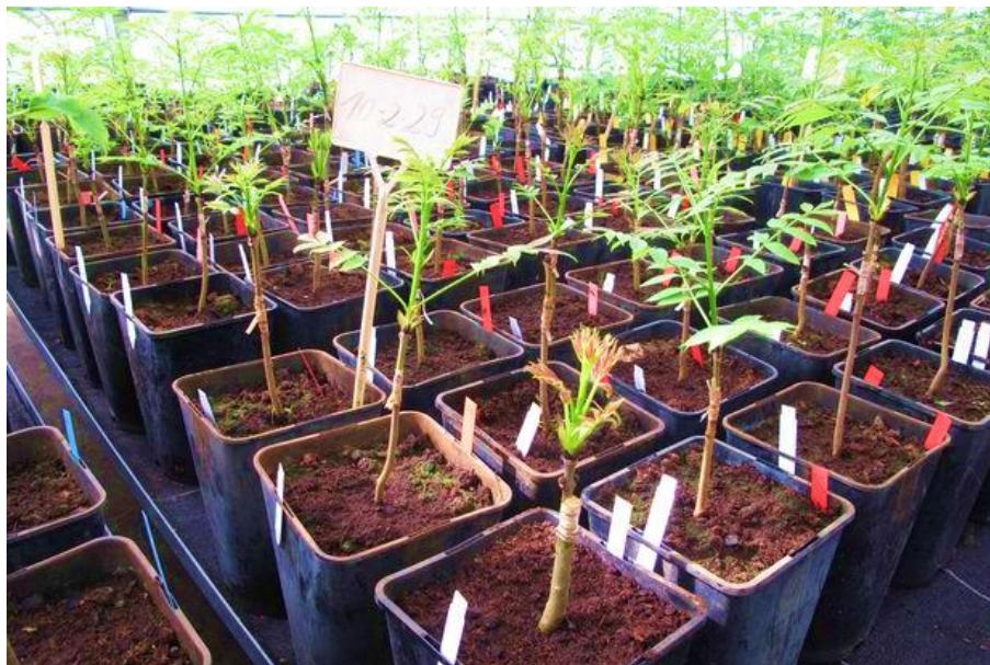
Slika 6. Genetski otporne jedinice poljskog jasena zaražene patogenom gljivom H. fraxinues