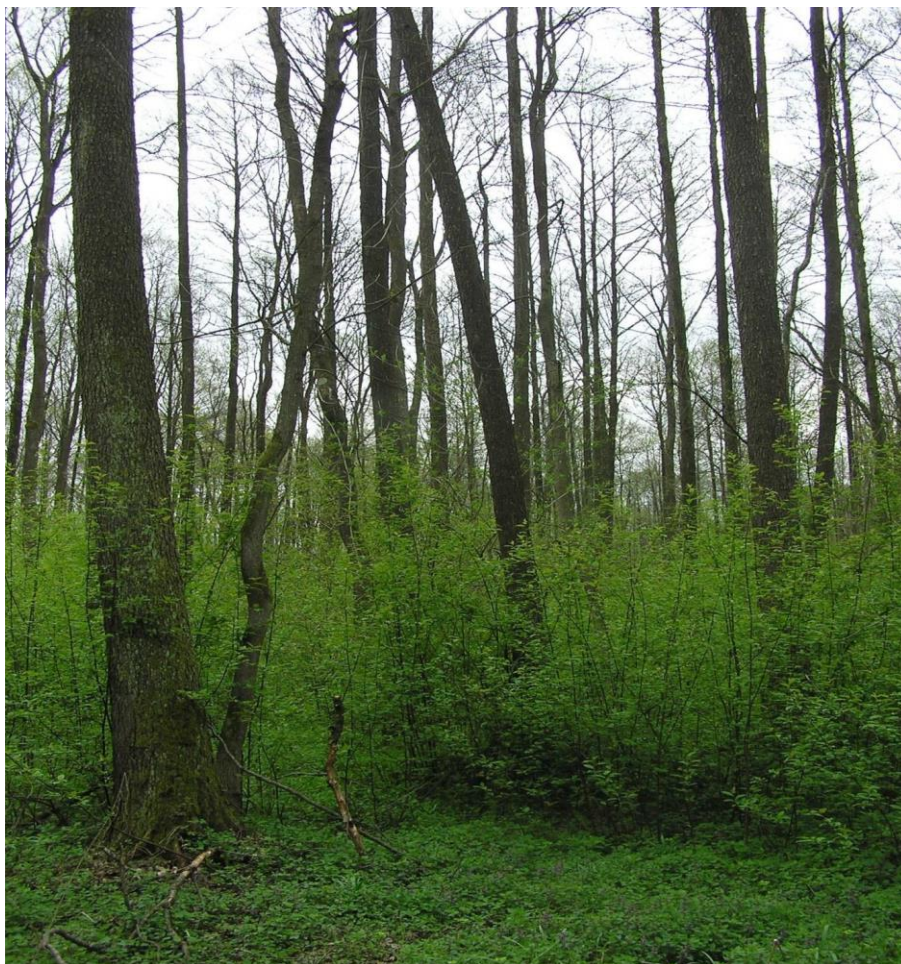
Slika 12. Slika mješovite sastojine crne johe i poljskog jasena sa sremzom