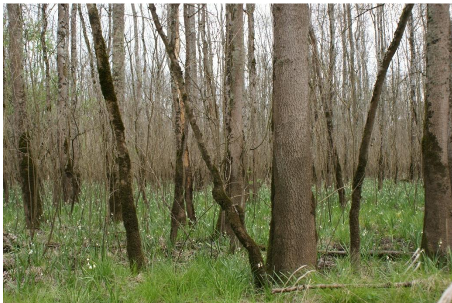
Slika 13. Izgled tipične sastojine poljskog jasena s kasnim drijemovcem (Izvor: Akcijski plan za sanaciju sastojina poljskog jasena ugroženih sušenjem i propadanjem za razdoblje od 2021.-2031.)

ovakvo stablo moglo biti potencijalno rezistentno te kasnije može poslužiti kao izvor za produkciju vegetativnog i generativnog reprodukcijskog materijala.