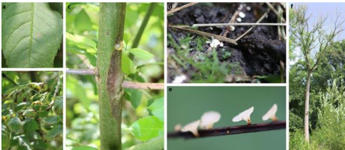
Slika 5. Simptomi zaraze gljivom H. fraxineus (Izvor: Akcijski plan za sanaciju sastojina poljskog jasena ugroženih sušenjem i propadanjem za razdoblje od 2021.-2031.)

stabala jasena te može izazvati potpuno sušenje. U slučaju da lišće padne u jesenskom periodu na tlo, kolonizirala bi ga gljiva koja stvara karakterističnu “pseudosklerocijalnu mrlju”. Tijekom ljetnih i jesenskih mjeseci (u periodu od lipnja do listopada), na pocrnjelim izraslinama te propadajućem lišću iz prethodne jeseni i zime pojavljuju se mala plodna tijela nalikom na gljive. Poslije sazrijevanja, ova sićušna plodna tijela ispuštaju velike količine mikrospora pri čemu će neke sletjeti na lišće zdravih te prethodno zaraženih stabala pri čemu ciklus ponovno počinje.