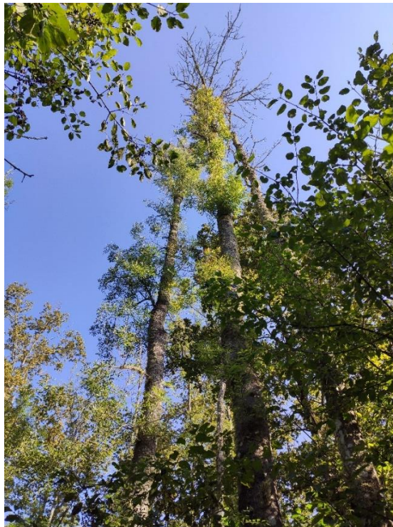
Slika 8. Šteta na stablima u srednjedobnoj sastojini unutar GJ-e Brezovica, Odjel 69 a

Bolest odumiranja pojavljuje se i u GJ-i Letovanički lug gdje je u 2018. godini izvršena doznaka i sječa cca 500 m 3 suhog jasena. U GJ-i Brezovica u zadnjih pet godina izvršena je doznaka te sječa na cca 7150 m 3 , na području GJ-e Leklan 2017. godine doznačeno i posječeno cca 1300 m 3 suhog jasena s pojavom tendencija rasta količina, a unutar GJ-e Belčičev gaj-Šikara u posljednjih pet godina doznačeno je i posječeno 2500 m 3 . Primijećen je veliki broj izvaljenih i prelomljenih stabala unutar svih GJ-a unutar šumarije Sisak.