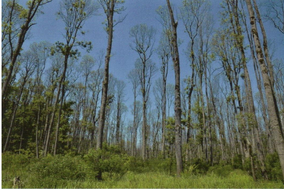
Slika 7. Odumiranje poljskog jasena u GJ Lonja, lipanj 2017.