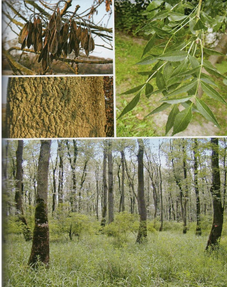
Slika 2. Poljski jasen ( F. angustifolia )