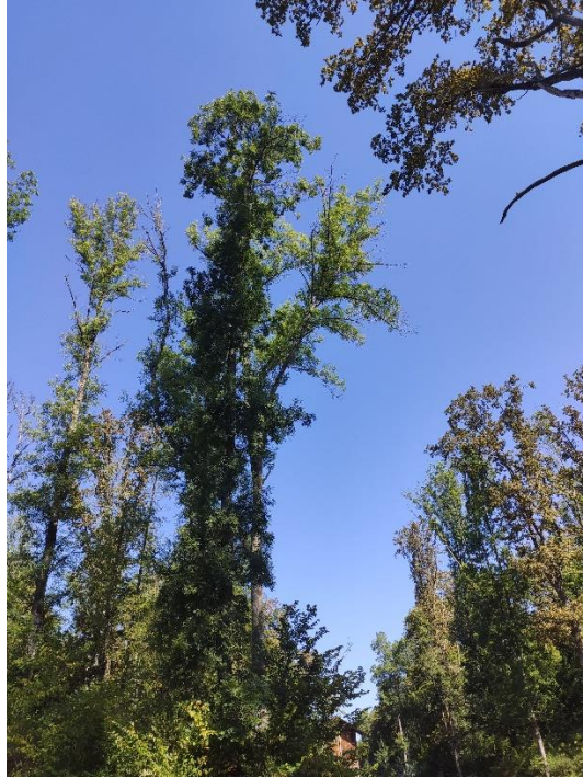
Slika 11. Stablo s jakim osutosti krošnje u staroj sastojini unutar GJ-e Brezovica; Odjel 39 b