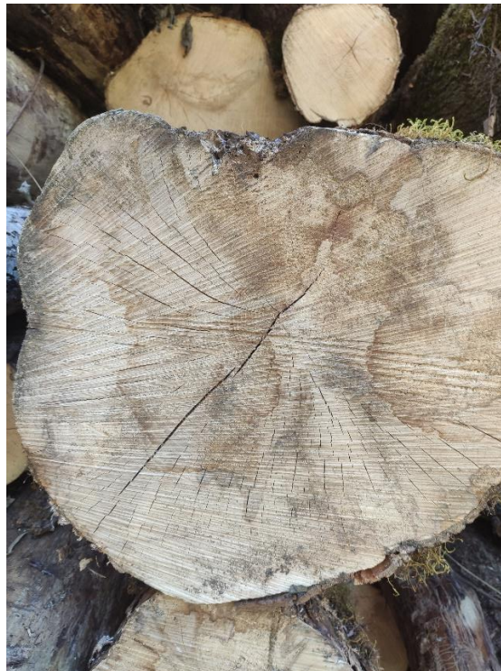
Slika 10. Vidljivi znakovi odumiranja u bazi debla unutar GJ-e Brezovica