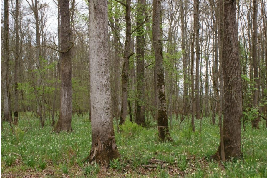
Slika 14. Izgled tipične mješovite sastojine hrasta lužnjaka i poljskog jasena (Izvor: Akcijski plan za sanaciju sastojina poljskog jasena ugroženih sušenjem i propadanjem za razdoblje od 2021.-2031.)

zdrave pričuvke poljskog jasena (3-5 kom/ha). Nakon što je dovršni sijek obavljen, moramo pratiti rast prirodnog pomlatka u sastojini. U slučaju da poslije pet godina uopće ne dođe do zadovoljavajuće prirodne obnove, potrebno bi bilo izvršiti sanaciju umjetno pomoću sadnica poljskog jasena starosti od tri do pet godina uzgojenih s otpornih stabala.