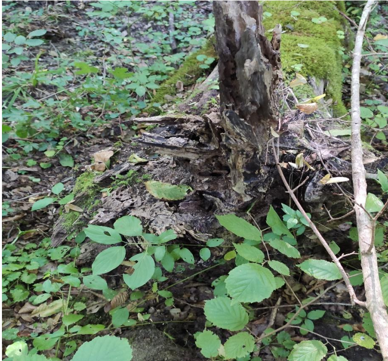
Slika 9. Šteta od vjetrozivale na stablu poljskog jasena na prostoru GJ-e Brezovica, Odjel 69 a