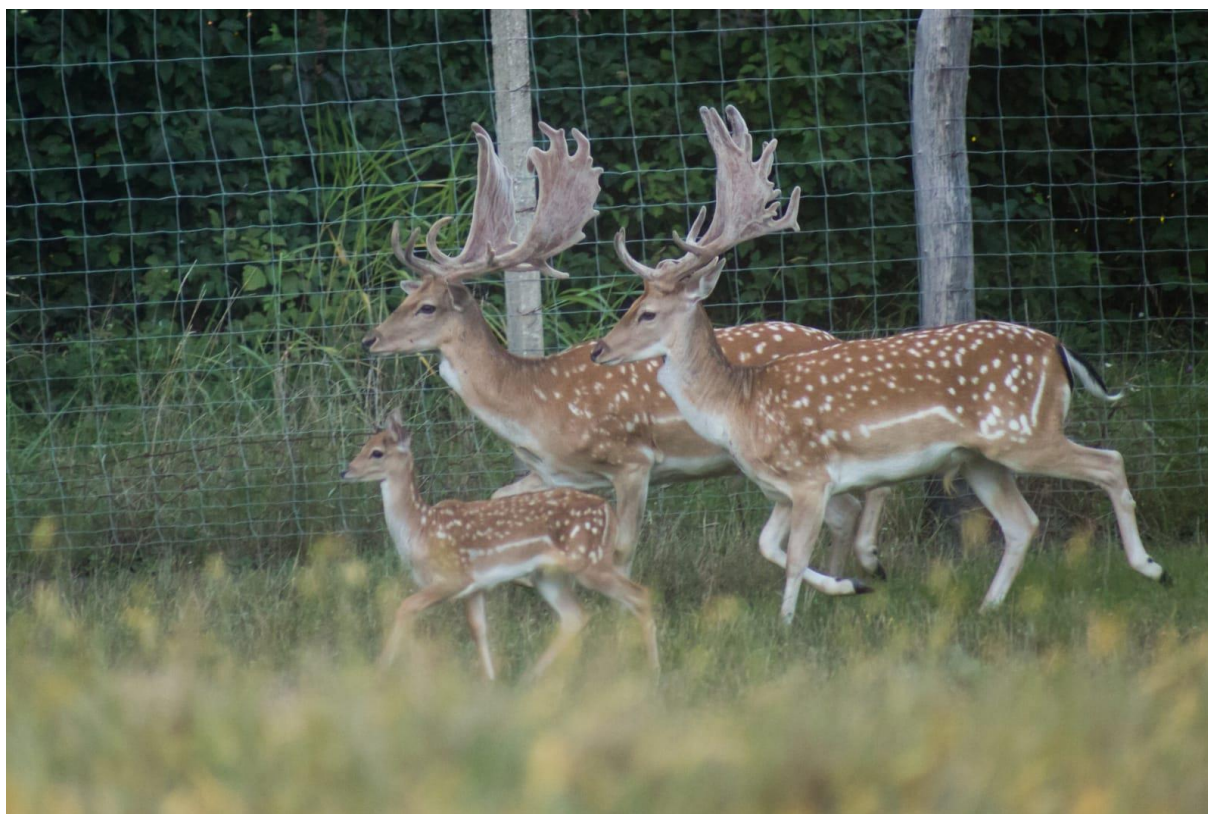
Slika 10. Primjer ograde koja ima betonske stupove te stupove od bagrema, donji dio s malim oknima te je ukopana u zemlju.

Podizanje ograde jedan je od prvih poslova pri osnivanju uzgoja jelena lopatara. Ona je najvažniji i najskuplji dio svakog uzgajališta. Vanjska ograda mora biti dovoljno visoka kako ju divljač ne bi mogla preskočiti, najmanja visina ograde je 2 metra. Ona mora biti ukopana u tlo kako ju divljač iznutra ili grabežljivci izvana ne bi mogli iskopati. Isto tako potrebno je u donjim dijelovima postaviti ogradu sa malim oknima kako bi spriječili mogućnost izlaska teladi kroz ogradu. Na svaka 3 metra ograde potrebno je postaviti stupove visine 2.5 metara koje može biti betonsko, ali zbog visoke cijene može poslužiti i bagremovo kolje. Osim ograde potrebno je osigurati i neke ostale objekte kao što su hranilište, pojilište te mjesto za zaklon (Konjević, 2007.). Za ove objekte nema propisanih pravila već ih svaki uzgajivač radi prema svojim mogućnostima i potrebama (slika 10.) .