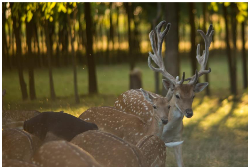
Slika 1. Ljetno krzno jelena lopatara i vidljivo odstupanje jedne jedinke tamnijeg krzna

Prema tjelesnom pokrovu jelen lopatar spada u dlakavu divljač, što znači da je prekriven dlakama. Zimska dlaka je jednolično sivo smeđa, po hrptu tamnija, a prema trbuhu svjetlija. Unutrašnja strana nogu, rep odozdo i zadnjica su bijeli. Ljetna dlaka je crvenkasto smeđa s tamnom prugom po leđima, a po tijelu se nalaze jasno vidljive bijele točke poredane duž hrpta i po rebrima. Unutarnja strana nogu, trbuh i zadnjica s unutrašnjom stranom repa su bijeli. Unutar krda postoje tamnije ili svjetlije jedinke, dok čak postoje i sasvim bijele jedinke ili sasvim smeđe jedinke. Uz to nerijetka pojava su i albino jedinke. Duž repa imaju crnu prugu koja je okružena svjetlijom dlakom. Zbog svojega krzna u prirodi je veoma neprimjetan (slika 1.).