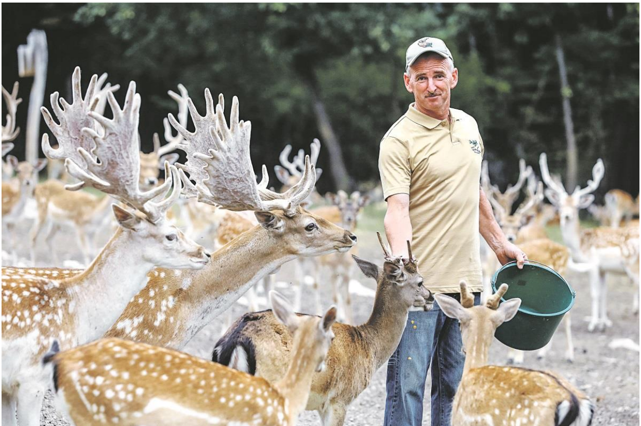
Slika 13. Vlasnik ranča hrani jelene

Ranč „Dolina jelena“ najpoznatija je Hrvatska destinacija gdje posjetitelji mogu doći u bliski susret sa ovom vrstom životinja te uživati u njihovoj ljepoti. Nalazi se u Drežnik Gracu, nedaleko od NP Plitvičkih jezera. Osnovan je 2009. godine u sklopu OPG-a Bićanić sa svega tri jedinke. Nakon što su se otelili doveli su nove jedinke postupno širili gospodarstvo. Danas se uzgajalište prostire na 15 hektara na kojem se nalazi 70-tak grla jelena lopatara, a uz njih su na uzgajalištu i 20-ak grla običnog jelena ( Cervus elaphus ), 40-ak crnih slavonskih svinja ( Sus scrofa domestica ) i tri konja ( Equus ferus caballus ). Za posjetitelje ovaj ranč otvoren je prije šest godina. Godišnje broje preko 1000 posjetitelja što domaćih, što stranih, ranč je otvoren za posjetitelje samo dva sata dnevno kako ih posjetitelji ne bi previše uznemiravali, a za posjetu se moraju rezervirati i do četiri dana prije. Iako je ova priča počela samo kao hobi, danas od uzgoja živi cijela obitelj te im je to glavni izvor zarade (slika 13.) (Pušić, 2019.).