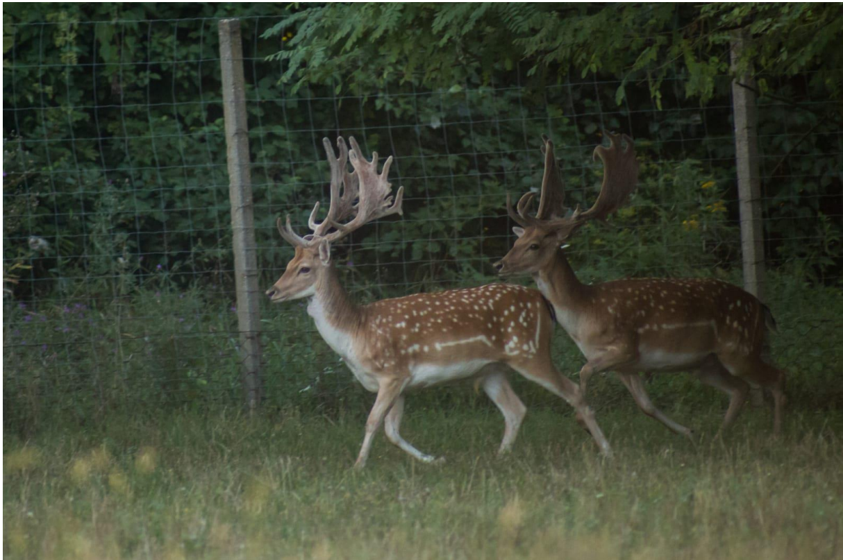
Slika 2. Mužjaci sa rogovljem u bastu

Mužjak nosi rogovlje koje je u donjem dijelu slično rogovlju običnog jelena, ali od srednjeg paroška se počinje širiti u obliku lopate zbog kojeg je i ova vrsta dobila ime. Po obliku rogovlje prve godine su šiljci, druge godine su nešto duži, a tek treće počinju razvijati lopatu. Otpadanje i rast novih rogova počinje u 4 mjesecu kako bi skidali čupu u kolovozu i imali zrele i očišćene rogove u rujnu. Osim rogovlja, mužjaci se razlikuju i po tome što imaju izraženo grlište te prepucij koji se u vrijeme tjeranja izvrće i postaje tamnije boje (slika 2.)