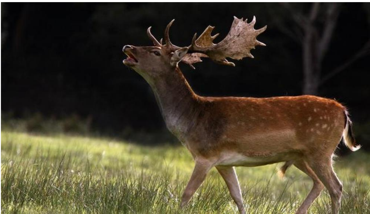
Slika 6. Jelen lopatar u rici

U vrijeme parenja događa se rika. Jeleni riku predvečer, ujutro i noću, ponekad i danju. Rikom prizivaju ženke na parenje, ali i mužjake iste jačine u borbu. Ukoliko dođe do borbe može doći do pucanja rogovlja slabijem jelenu, do sapletanja rogovlja oba jelena, dok su neke teže ozljede rjeđe. Ukoliko se jelenima sapletu rogovi, a čovjek ne intervenira, oni ostaju tako sapleteni i ugibaju. Jeleni isto tako za vrijeme parenja ne uzimaju dovoljnu količinu hrane pa zbog velikog napora znatno gube na tjelesnoj masi. Kod kasnog završetka sezone parenje, mužjaci se ne uspiju pripremiti za zimu te ugibaju, što je jedan od glavnih razloga zašto jeleni lopatari teško preživljavaju u planinskim lovištima (slika 6.).