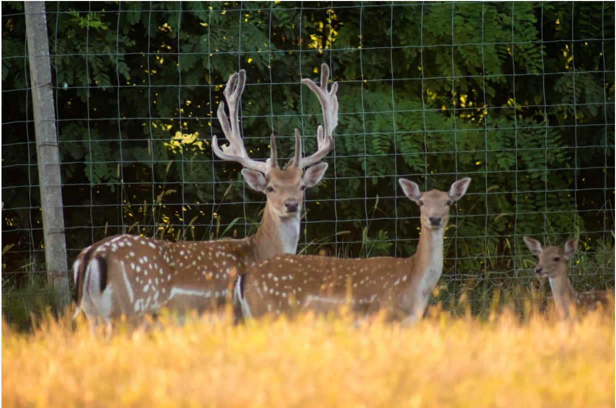
Slika 3. Mužjak, ženka i tele začuli su šum i provjeravaju moguću opasnost

Od osjetila najbolje im je razvijen njuh koji igra veliku ulogu u komunikaciji te u prikupljanju informacija iz prirode. Oči su smještene postrano na lubanji pa omogućavaju jelenu široko vidno polje, no one su astigmatične pa samim time lopatari dobro vide samo objekte u pokretu. Uši su im postavljene visoko na glavi skoro u vertikalnom položaju. Veličinom su gotovo dvostruko duže nego šire, a uške se mogu pomicati skupa ili neovisno za 180 stupnjeva naprijed ili nazad što omogućava jelenima da dobro čuju iz svih smjerova bez da se miču i na taj način privuku pažnju na sebe (slika 3.) (Janicki i sur., 2007.).