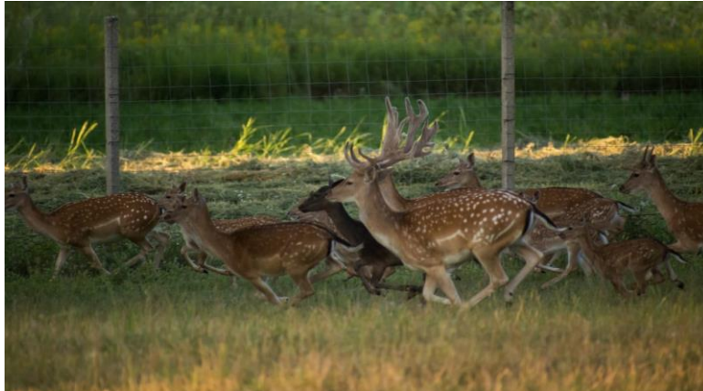
Slika 5. Kretanje jelena kasom

Kreću se hodom, skokom i kasom. Kao i druga jelenska divljač u povoljnim okolnostima može postići starost do 17 godina, što je rijedak slučaj. Pretežito obolijevaju od parazitskih bolesti, kod nas su to kožni štrk, metiljavost te helmintoze, a od prirodnih neprijatelja tu su vuk ( Canis lupus ), medvjed ( Ursidae ) i ris ( Lynx lynx ) koji su najuspješniji za zimskih dana kad je veliki snijeg čime je otežana pokretljivost jelenima (slika 5.)