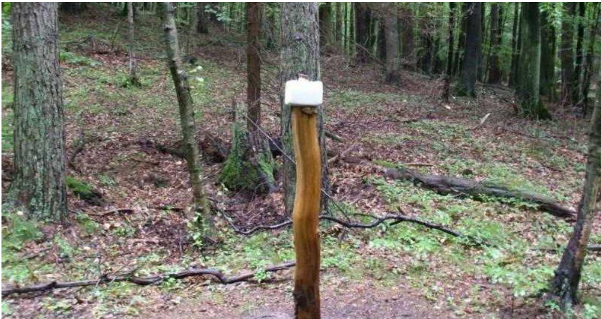
Slika 4. Postavljena kamena sol

Jelen lopatar hrani se raznovrsnim biljkama i usjevima, a može nanijeti i velike štete na šumskim nasadima. Pitku vodu lopatari nalaze u malim vodotocima, a dio žeđi utaže preko hrane. Uglavnom se hrane ispašom na pašnjacima na kojima borave, brste izbojke i pupoljke na drveću, šikari i grmlju, mladice iznikle iz zemlje ili izbojke i izdanke s panjeva. Uz to hrani se i šumskim plodovima kao što su žir, bukvice, kesten, šumsko voće te gljive. Na ispašu izlaze uglavnom u zoru ili sumrak, a preko dana se povuku u šumu. Na mjestima gdje nema ljudske opasnosti hrane se tijekom cijeloga dana. U slučaju kad opaze opasnost cijelo krdo počne bježati u skokovima koji mogu postići visinu i preko 1m. Nakon što opasnost prođe vraćaju se hrani. U uzgajalištima jelenima se često osim osiguranog brsta kao prihranu posebice u mjesecima prije bacanja rogovlja i razvijanja novih daju vitaminski čepići te voće kako bi mužjaci skupili dovoljno vitamina za razvitak što ljepšeg rogovlja. Uz to kao i sva ostala divljač, i jeleni lopatari zahtijevaju kamenu sol (slika 4.) (Janicki i sur., 2007.).