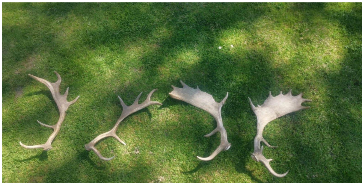
Slika 8. Drugi i treći rogovi koji ukazuju na jelena visoke trofejne vrijednosti

Trofejni uzgoj jelena lopatara ne razlikuje se mnogo od uzgoja za meso, štoviše često su povezani tako što lošiji jeleni te višak ženskih ili muških jedinki koje još nisu razvile veliko i atraktivno rogovlje koje privlači ljubitelje trofejnih jelena završi upravo prodano kao meso. Jedina razlika u trofejnom uzgoju i uzgoju samo za meso je ta da se jedinke koje ostaju za rasplod pažljivo biraju kako bi potomci naslijedili što kvalitetnija svojstva. Tako se svake godine uklanjaju ona grla koja imaju naznaku greške u rogovima, slaba grla te jedinke s bilo kakvom manom. Uzgoj jednog trofejnog jelena traje puno duže, jer najljepše rogove ima oko osme godine života (slika 8.)