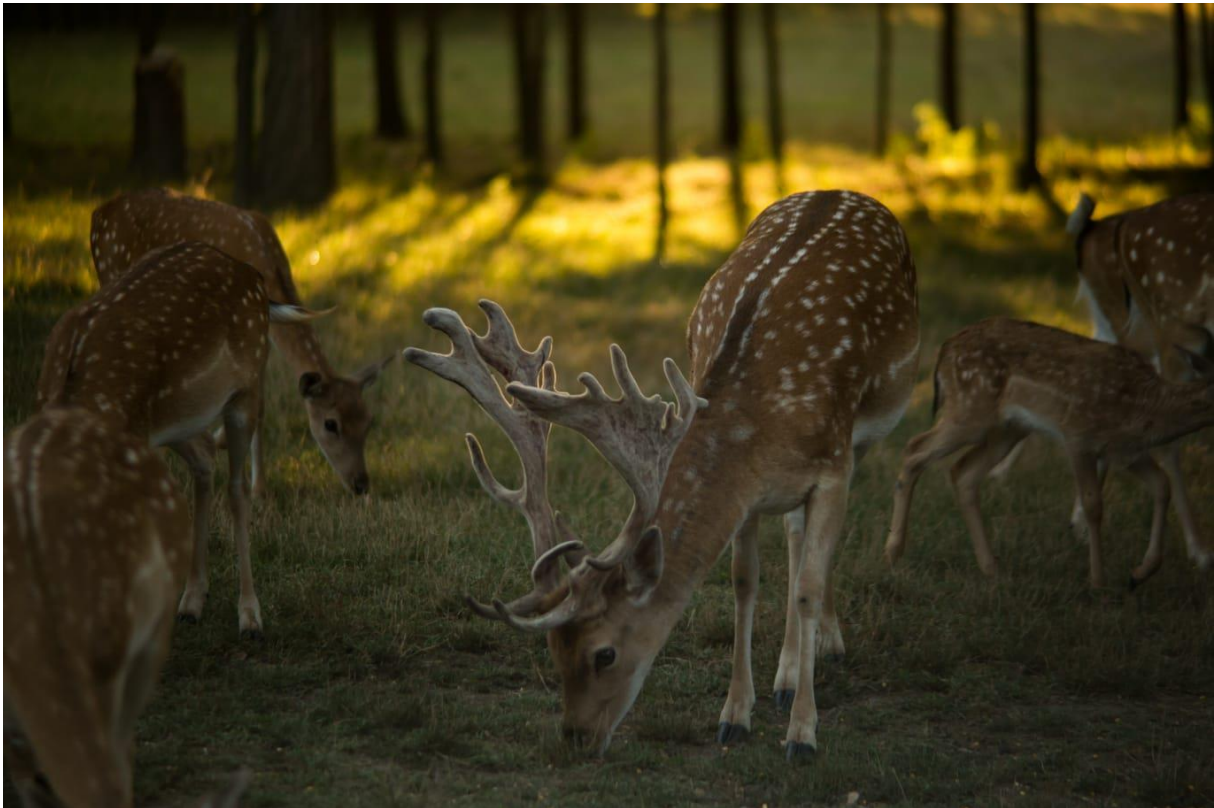
Slika 11. Prikaz mladog matičnog stada

Što se tiče omjera spolova, kod uzgoja u zatvorenim površinama on iznosi 1:10 u korist ženki. Kod kupnje matičnog stada preporuča se odlazak do prodavača sa stručnjakom kako bi bili sigurni u kvalitetu divljači te zdravstveno stanje. Za novo matično stado najbolje su jedinke starosti od 3 do 6 godina jer se kod njih mogu primijetiti potrebne osobine. Kupnja teladi nije preporučljiva iz više razloga. Jedan od njih je taj što kod teladi nisu vidljive osobine jer je ono još malo, kao ni kvaliteta te trofejna vrijednost, a drugi razlog je taj što je telad plah i jako teško se prilagođava na novi okoliš. Kupnju matičnog stada kao i prodaju i kupnju žive divljači najbolje bi bilo obaviti poslije parenja odnosno između prosinca i ožujka. U tom periodu životinje su najmirnije i lakše im se prilagoditi na nova područja. Najgore vrijeme za kupnju žive divljači je u vrijeme parenja jer su tada jedinke najagresivnije (slika 11.) (Janicki, 1997.).