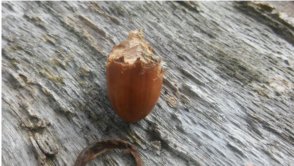
Slika 2. Štete na žiru (foto: M. Vucelja., 2016.)

Štete od glodavaca učestalije su i izraženije na listopadnom drveću, nego na crnogoričnom. Štete koje nastaju na šumskom sjemenu, u većoj se mjeri pripisuju miševima, dok štete na mladcima voluharicama. Glodavcima pogoduje gusti sloj prizemnog rašća koji im pruža potreban zaklon i uvjete za preživljavanje. Glavne štete na korijenu biljaka nastaju tijekom jesenskih i zimskih mjeseci, u vrijeme nedostatka drugih izvora hrane. Pokazalo se da glodavci, svojim hranjenjem korijenjem hrastovih biljaka starosti do pet godina, unište u prosjeku do 77% volumena korijena, 96% korijenovih vrhova te smanjenje duljine korijena i do 97% (Štete od sitnih glodavaca na stabljici i korijenu hrasta lužnjaka ( Quercus robur L.) Marko Vucelja 1, Josip Margaletić 1, Linda Bjedov2, Mario Šango2, Maja Moro 3, Šumarski list, 5–6 (2014): 283–291). Mnoge vrste veliku količinu sjemena odnose u svoja podzemna skrovišta, kako bi si pouspjehili prezimljavanje. Redukciju glodavaca opravdano je vršiti, ako je njihova relativna brojnost (iskazuje se kao omjer ulovljenih jediniki u odnosu na ukupan broj postavljenih klopi, u postotcima) između 20% i 30%, a nužno ako je iznad 30%.