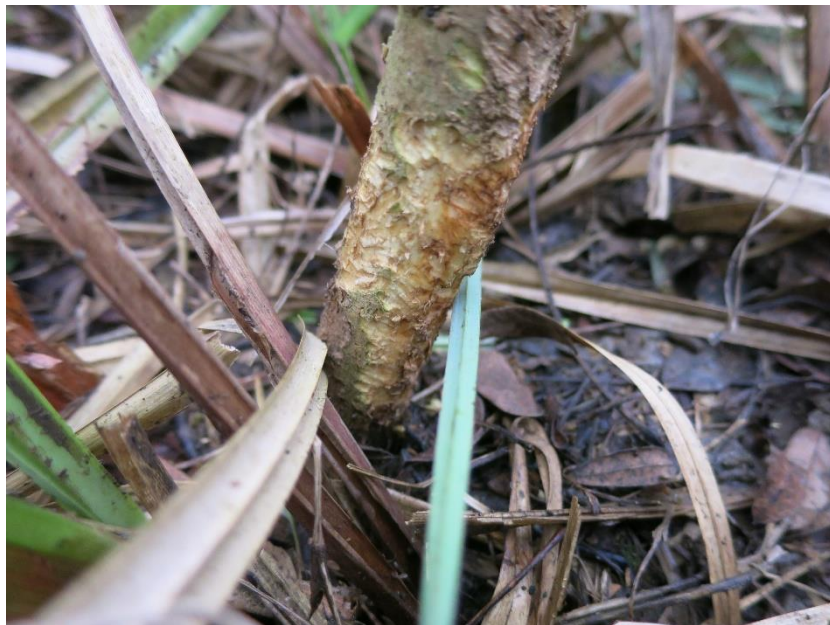
Slika 1. Štete od glodavaca na kori pomlatka

U šumama Hrvatske tipične štete od glodavaca jesu one na šumskom sjemenu, stabljici, kori i korijenu biljaka. U godinama masovne pojave glodavaca ove štete mogu imati vrlo ozbiljne posljedice vidljive kroz otežanu prirodnu obnovu, i to osobito u nizinskim šumskim zajednicama u fazi obnove, gdje može doći do gotovo potpunog uništenja uroda žira. Štete na sjemenu su posebno izražene u godinama obilnog uroda sjemena (Bjedov et al., 2017), koje prati i porast brojnosti populacija glodavaca.