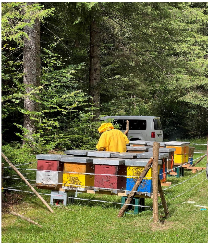
Slika 4 Košnice pčela na području Mrkoplja, Gorski kotar u bukovo-jelovoj šumi