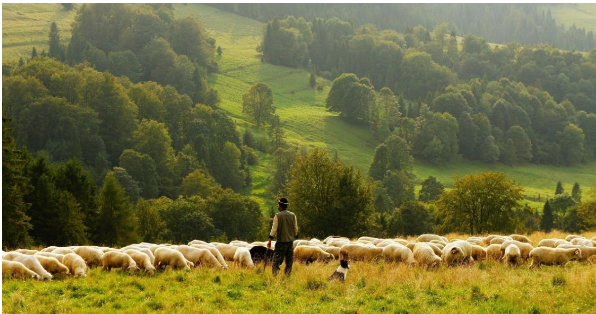
Slika 1 Šumski pašnjak (Silvopastoral)