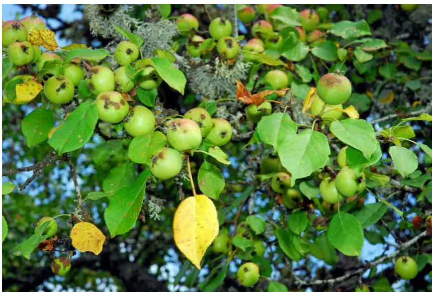
Slika 6 Šumsko drveće jestivih plodova – divlja jabuka