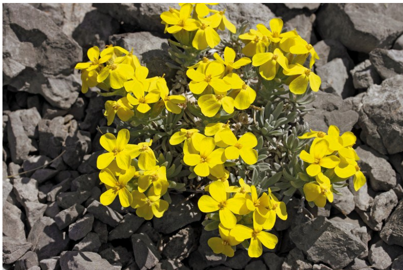
Slika 1 Velebitska degenija je endemični rod i vrsta u Hrvatskoj