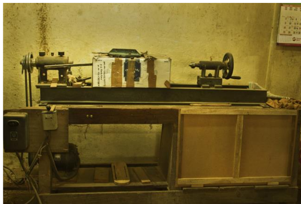
Slika 8. Stroj za tokarenje (Bibhudutta Baral i dr., 2016)