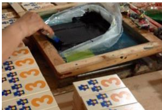
Slika 27. Sitotisak