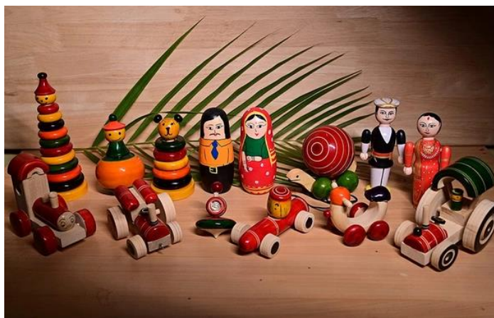
Slika 22. Gotove igraćke (Uma i dr., 2021)