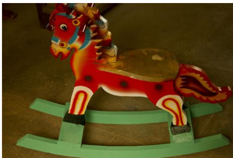
Slika 16. Konj za ljujanje (Bibhudutta Baral i dr., 2016)