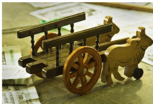
Slika 15. Volovska kolica (Bibhudutta Baral i dr., 2016)