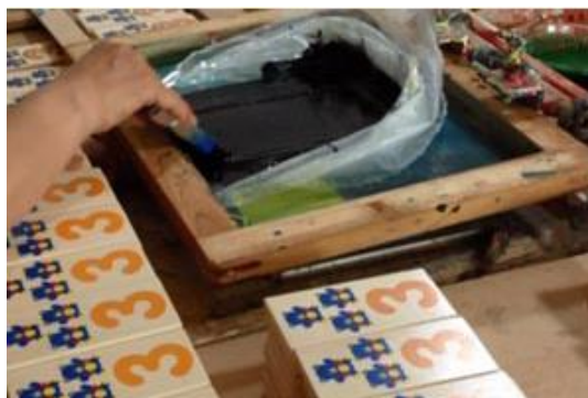
Slika 27. Sitotisak