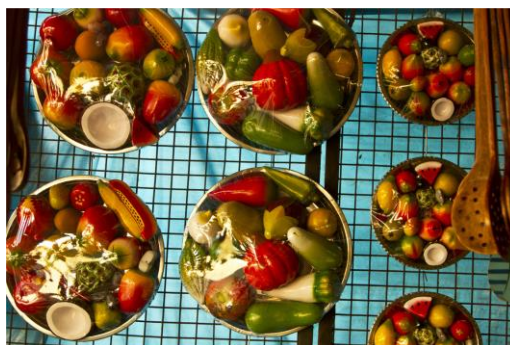
Slika 18. Drveno voće i povrće (Bibhudutta Baral i dr., 2016)