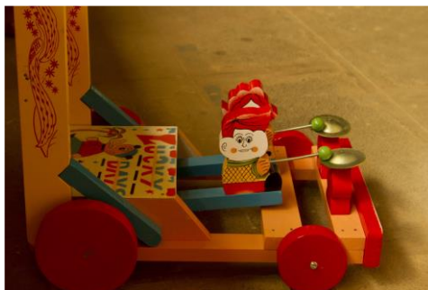
Slika 17. Šetalica za dojenčad (Bibhudutta Baral i dr., 2016)