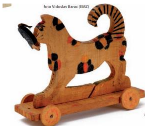
Slika 4. Mačka i miš, Vidovec, 1948.godine (Barac, 2013)

U selu Vidovec na istočnim obroncima Zagrebačke gore, 1932. godine započinje organizirana izrada drvenih dječjih igračaka osnivanjem seljačke Zadruga. Izrađivali su ih uvijek muškarci, a oslikavale najčešće žene. Uglavnom se radilo o životinjskim likovima (slika 4), osim životinja izrađivali su i prijevozna sredstva, kao i predmete vezane za kućanstvo. Drvo za izradu su nalazili na obroncima Medvednice (Biškupić Bašić, 2013).