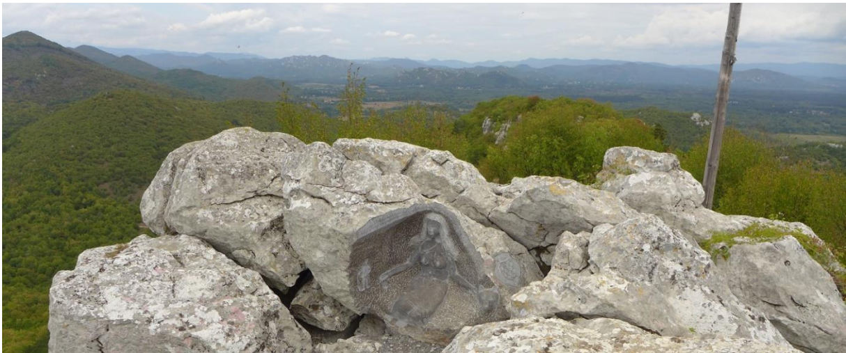
Slika 8. Panoramski pogled s brda Krčmar