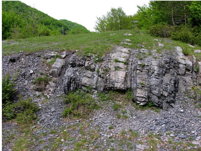
Slika 6. Prikaz Velnačke glavice

dinarskog krša. Osim "Velnačke glavice", tu se nalaze još dva važna geološka lokaliteta: "Paripov jarak" i "Košna vrelo". Na ovom području mogu se vidjeti terasasti izdanci crnih do tamnosivih vapnenaca, izmiješani s crnim vapnenim škriljancima, nastalih taloženjem prije otprilike 260 milijuna godina na padinama tropskog oceana. Kasnije su prirodne sile izdigle i savile te stijene s morskog dna, zbog čega su danas postavljene u vertikalnom položaju. Vapnenci su bogati fosilima i mikrofosilima, a do sada je otkriveno više od 30 vrsta fosilnih biljaka i životinja. Lokalitet je otkriven tijekom Drugog svjetskog rata, kada je talijanska vojska iskopala duboki rov za smještaj topa, otkrivajući tako ovaj vrijedni geološki profil.