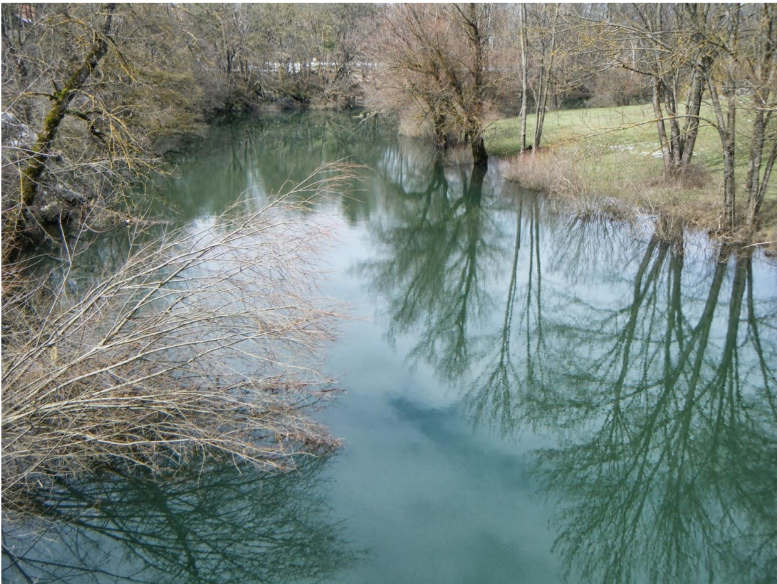
Slika 13.Tok rijeke Bogdanice