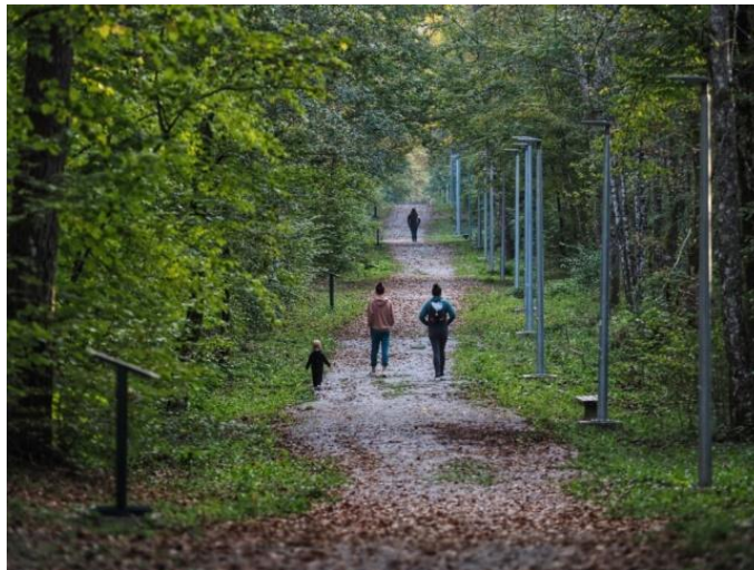
Slika 4. Park šuma Jasikovac

Danas je Jasikovac popularno odredište za rekreativce i turiste, s nekoliko uređenih šetnica i biciklističkih staza koje omogućuju posjetiteljima uživanje u prirodi. Šuma predstavlja jedan od najvažnijih zelenih resursa Gospića i odražava bogatu prirodnu baštinu regije. Jasikovac nije samo prirodni biser, već i mjesto koje spaja rekreaciju, obrazovanje i očuvanje okoliša, čime čini nezaobilazni dio života u Gospiću.