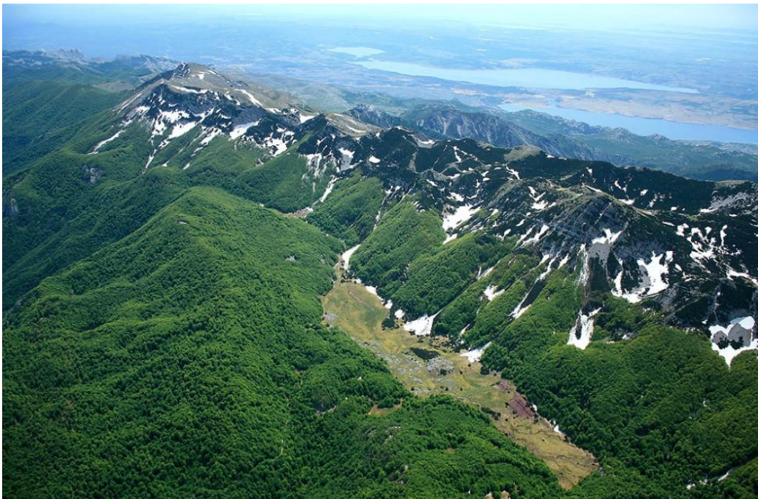
Slika 3. Pogled na Velebit

Očuvanje Parka prirode Velebit je ključno zbog njegove ekološke, geološke i kulturne vrijednosti. Zbog svoje divlje prirode i biološke raznolikosti, park je pod strogim režimom zaštite kako bi se očuvali rijetki ekosustavi i vrste koje ovdje obitavaju. Planinarske staze Velebita omiljena su destinacija za posjetitelje i jedan od prepoznatljivih znakova Parka. Park prirode Velebit nudi 14 različitih staza, koje variraju od laganih do zahtjevnih, omogućujući svim posjetiteljima da dožive planinu i njezino okruženje izbliza.