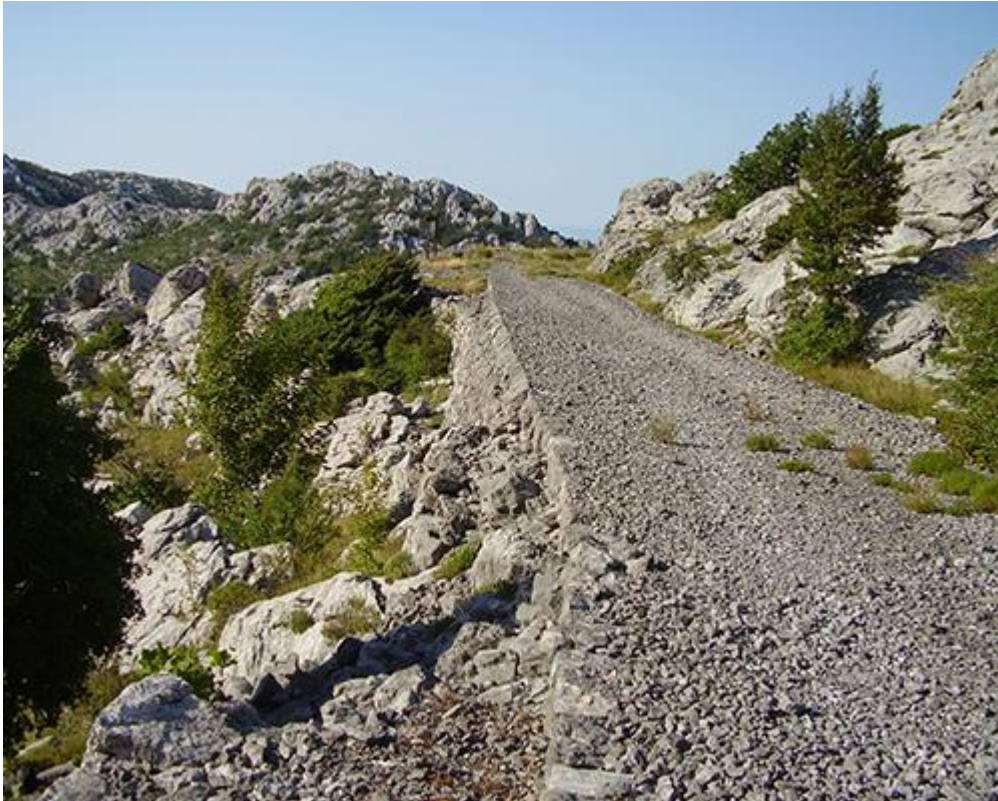
Slika 18. Prikaz staze

zadržali su svoj izvorni izgled, što daje poseban povijesni šarm cijelom području. Informativne ploče postavljene duž staze opisuju povijest ceste i njenu važnost za razvoj prometa u tom razdoblju. Terezijana je vrlo popularna među planinarima i ljubiteljima prirode zbog svoje pristupačnosti i prekrasnih krajolika. Staza je označena i uređena za sigurno pješaćenje, a zbog svoje umjerene težine prikladna je za sve uzraste. Također, tijekom šetnje moguće je susresti bogatu prirodnu raznolikost, uključujući brojne šumske životinje i ptice. Graditelj ceste bio je časnik Filip Vukasović.