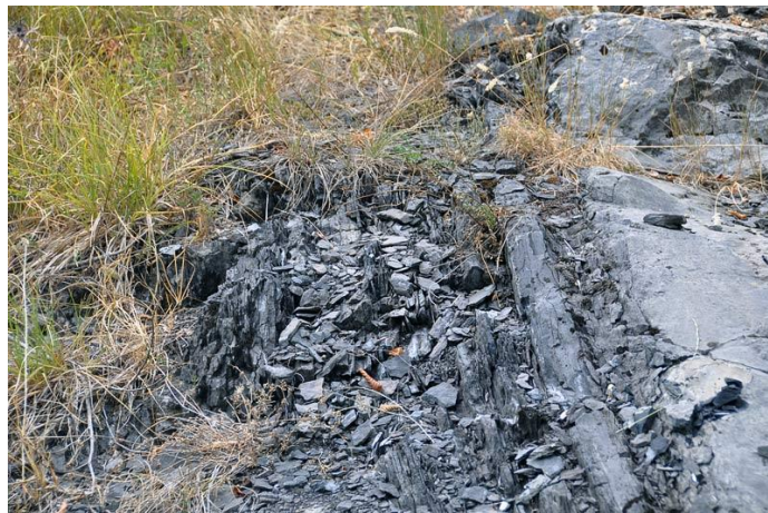
Slika 7. Prikaz ruba ceste