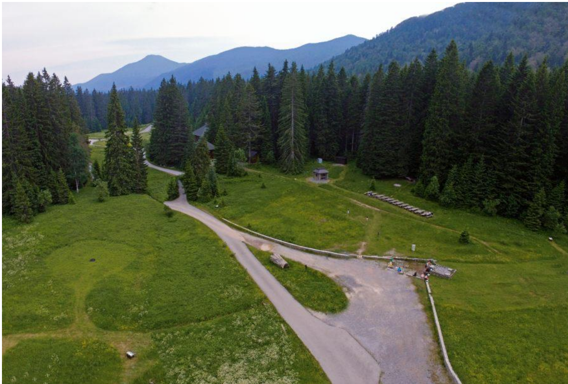
Slika 10. Panoramski prikaz Štirovače