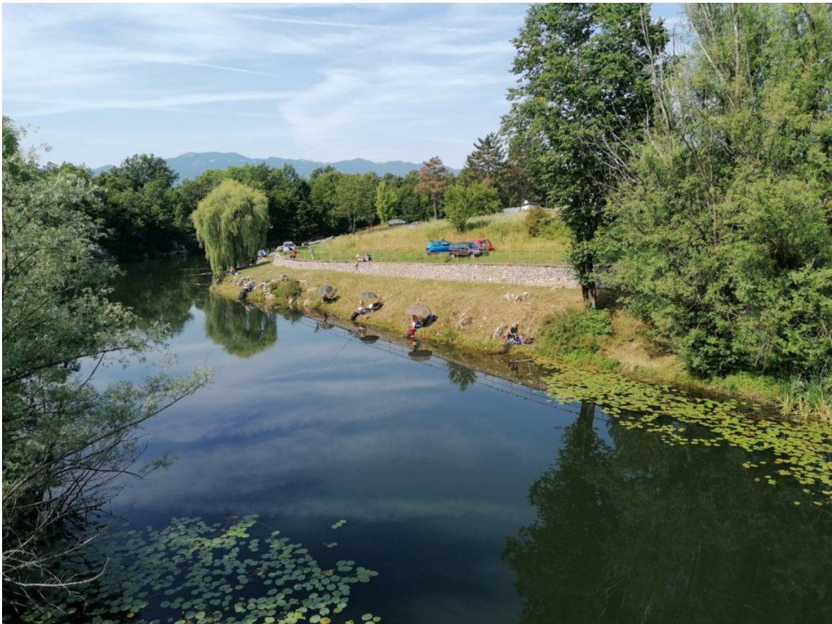
Slika 12. Prikaz toka rijeke

površine i formira Novčicu u blizini Gospića. Novčica prolazi kroz središte grada. Grad Gospić leži na njezinoj obali, a rijeka je dio urbanog pejzaža i značajna za lokalnu zajednicu. Zbog toga je rijeka od povijesnog i kulturnog značaja za stanovnike ovoga područja. Novčica se ulijeva u rijeku Liku, koja potom ponire u Ličko polje. Ovaj hidrografski sustav rijeka Like i Novčice ključan je za vodne resurse u Lici, jer se njihove podzemne vode koriste za opskrbu pitkom vodom i poljoprivredu. Rijeka Novčica je važna za vodoopskrbu i ekosustav oko grada Gospića. Iako nije velika rijeka, njezine vode su važne za lokalnu zajednicu, posebno u sušnim razdobljima kada su podzemni vodotoci ključni za osiguranje dovoljnih količina vode. Novčica je dom brojnim biljnim i životinjskim vrstama koje su karakteristične za krška područja. Unatoč blizini urbanih naselja, rijeka i njezine obale pružaju stanište za mnoge vrste riba, vodenih organizama, ptica i drugih životinja. Zbog svog toka kroz Gospić, Novčica je dostupna lokalnom stanovništvu za šetnje, ribolov i opuštanje. Iako rijeka nije poznata po velikim turističkim atrakcijama, ona doprinosi kvaliteti života stanovnika grada te pruža priliku za rekreativne aktivnosti na otvorenom.