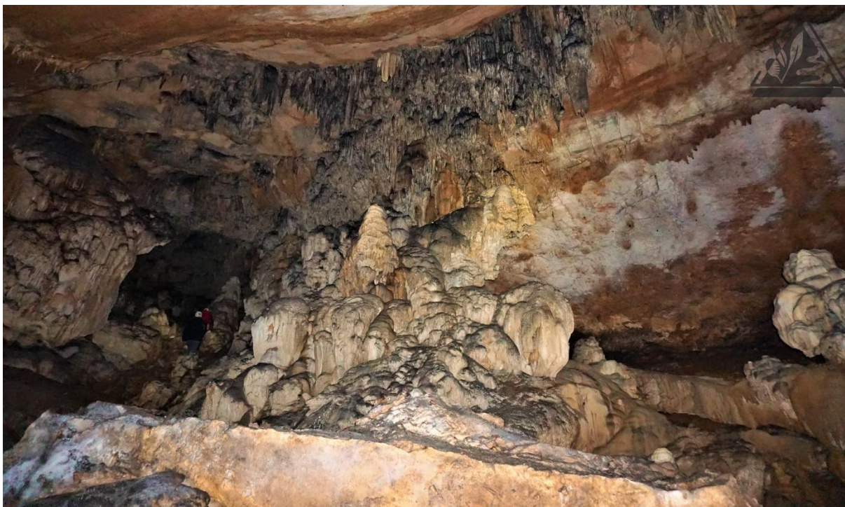
Slika 17. Prikaz unutrašnjosti špilje

Špilja se nalazi kod istoimenog sela, 300 metara istočno od vrha Ostrovice, istočno od Gospića. Označena je na topografskim kartama i spada među najznačajnije ličke špilje. Također, bogata je raznovrsnim špiljskim ukrasima najviše s kamenicama s vodom, a dužina joj iznosi 130 m. U hodniku nalazi se i malo jezero. Špilja se nalazi u blizini naselja i glavne ceste. Formirana je s nadmorskom visinom otvora 680 m u krednim vapnencima.