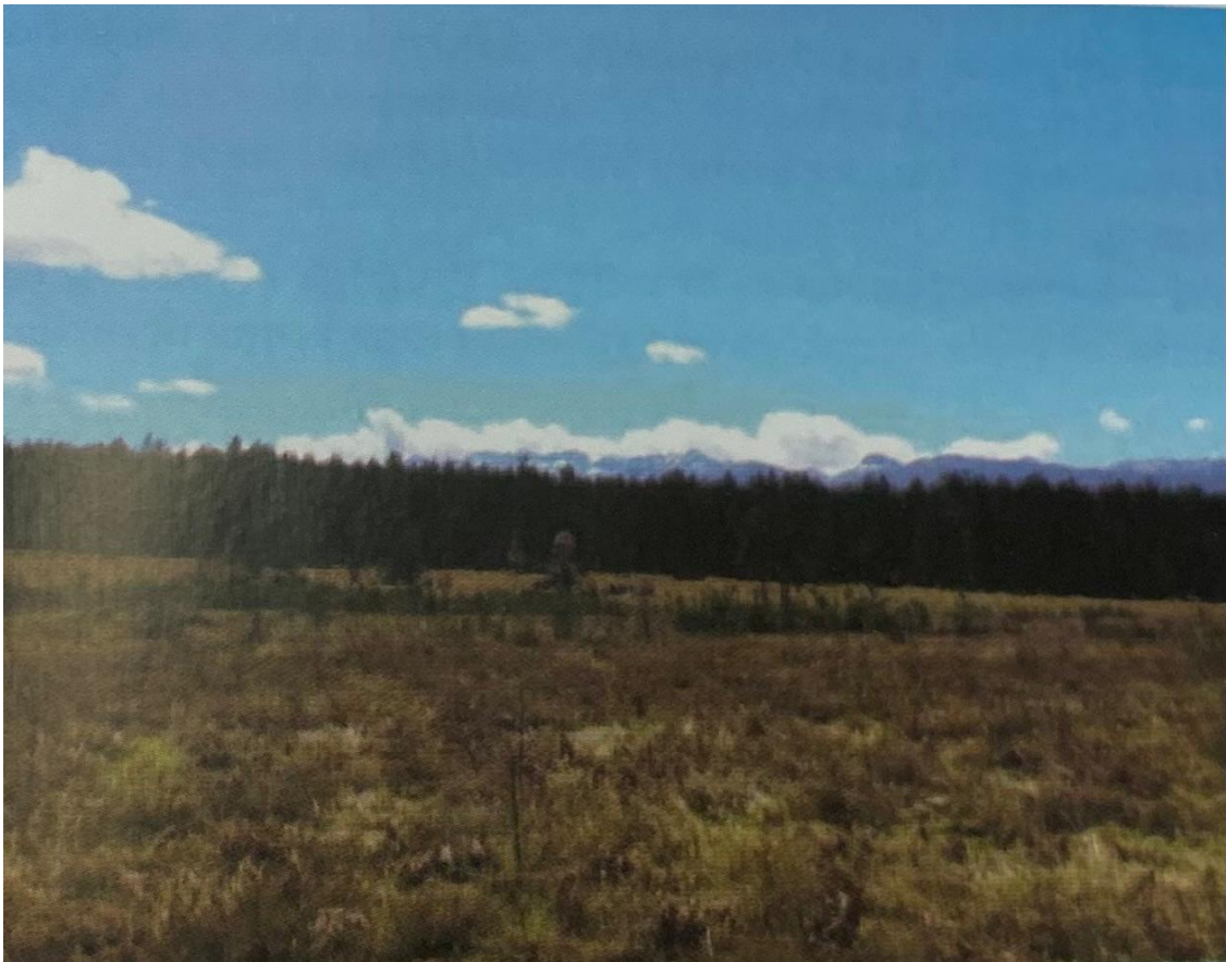
Slika 5. Prikaz Medačkih borovih kultura

Na području Gospića nalazi se najveći kompleks crnogoričnih kultura u Lici, koji je objedinjena u gospodarsku jedinicu nazvanu "Medačke borove kulture". Podizanje crnogoričnih nasada u Lici započelo je krajem 19. stoljeća, ali je najintenzivnija sadnja kultura provedena između 1963. i 1968. godine. Investicijski elaborat izradilo je tadašnje Šumarsko gospodarstvo Gospić, planirajući stvaranje plantaža intenzivnih kultura brzorastućih crnogoričnih vrsta na površini od 2000 ha. Zasadi su podignuti školovanim sadnicama crnog i običnog bora, ariša, smreke i američkog borovca. Danas "Medačke borove kulture" obuhvaćaju površinu od 2329,31 ha s drvnom zalihom od 173661 m 3 , no zbog miniranosti terena nedostupno je 967,39 ha, odnosno 102877 m 3 drvene zalihe.