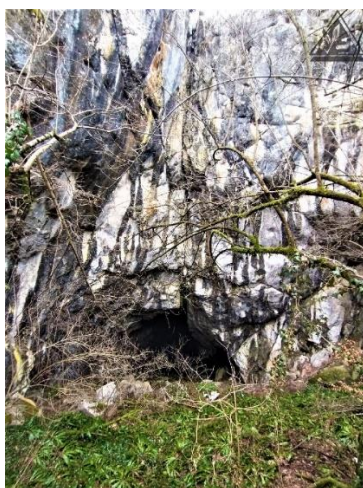
Slika 16. Prikaz ulaza u špilju

Spada u spomenik prirode pod kategorijom zaštite, proglašena je 24.2.1970.. Jedna je od najznačajnijih ličkih špilja. Odlikuje se velikim ulazom koji je 20 m širok i 14 m visok, i dužinom od 200 m, također je bogata špiljskim ukrasima kao što su stalaktiti i stalagmiti. Podatak o dužini je privremen jer se na toj udaljenosti nalazi jezero koje je spriječilo daljnja istraživanja pećinskog hodnika, a taj se dio zacijelo nastavlja. Špilja je formirana na nadmorskoj visini od 740 m s donje krednim vapnencima.