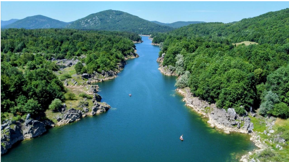
Slika 11. Prikaz toka rijeke Like

od 78 km, svrstava se među najduže ponornice u Europi. Glavni pritoci Like s lijeve strane su Novčica i Otešica, dok s desne dolaze Glamočnica i Jadova. Osim ovih pritoka, Lika prima i niz manjih pritoka, uključujući Bogdanicu, Brušanicu, Lopužu, Rizvanušu, Rakovac, Bužimicu, Počiteljicu, Crno vrelo, Glamočnicu i Balatin. U njenom kanjonu izgrađena je brana akumulacijskog jezera Kruščica, odakle se tok nastavlja prema Donjem Kosinju i vodi do ulaza u tunel Lika - Gacka. Rijeka je umjetno spojena s rijekom Gackom, a njena voda koristi se za proizvodnju električne energije u hidroelektrani Sklope Senj. Od izvora do Gospića, Lika je svrstana u prvu kategoriju po kakvoći vode i služi za vodoopskrbu primorja i otoka. Rijeka i jezero Kruščica obiluju ribom, a u jezeru su ulovljeni i impresivni primjerci somova i šarana. Kao klasična ponornica, Lika na nekoliko mjesta nestaje pod zemljom. Nakon poniranja u Ličkom polju, njena voda teče podzemnim tokovima i ponovno izbija u rijeci Novčici, dok se na kraju spaja s rijekom Gackom. U njenom ekosustavu žive 22 vrste riba, među kojima se ističe dragocjena autohtona vrsta lički pijor ( Phoxinellus croaticus ).