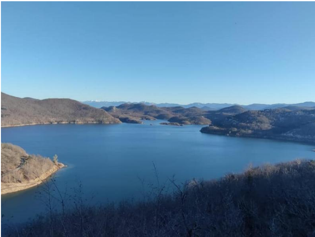
Slika 14. Jezero Kruščica