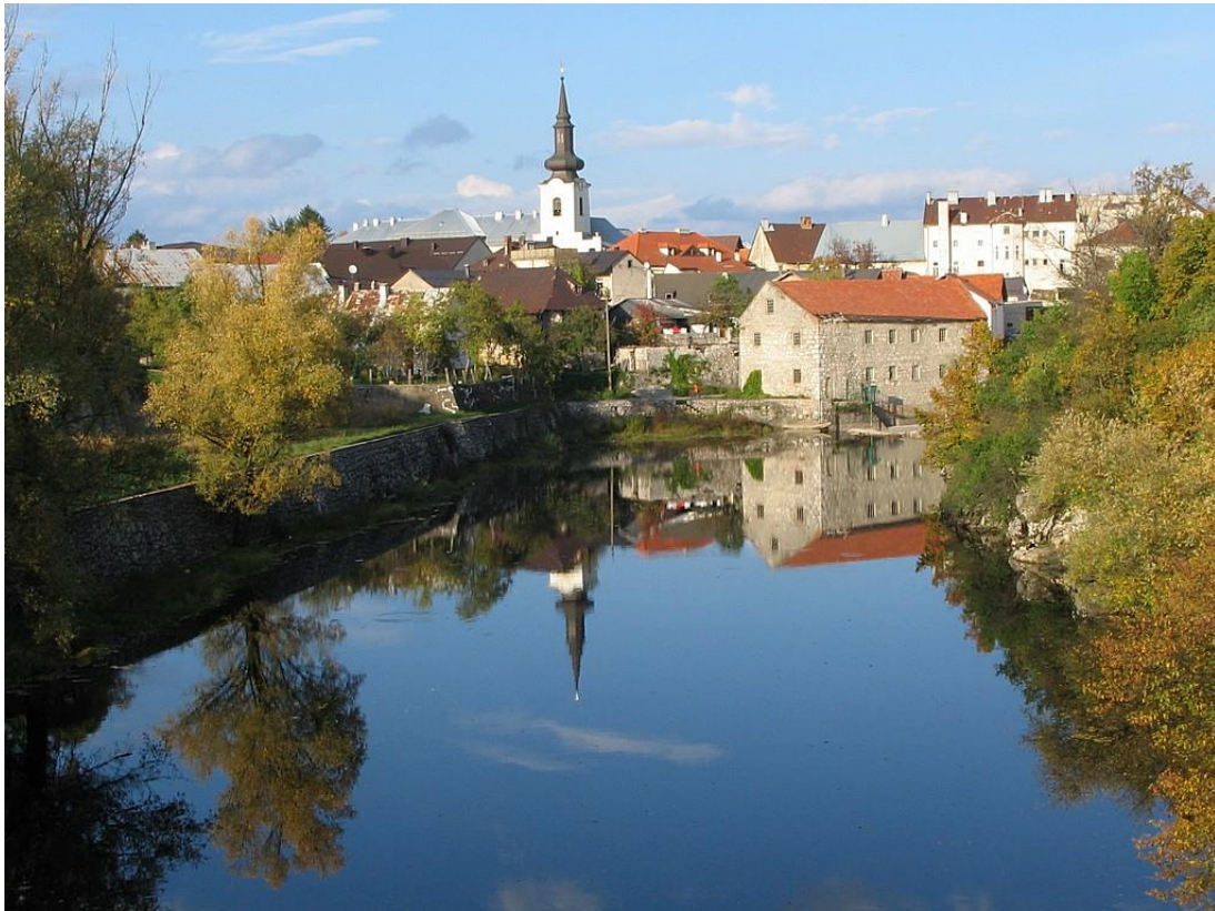
Slika 1.-Grad Gospić

Podno Velebita, na zapadnom rubu jednog od najvećih krških polja u Hrvatskoj Ličkog polja, na važnom prometnom pravcu koji spaja sjever i jug, na obalama triju rijeka Like, Novčice i Bogdanice smješten je grad Gospić, administrativno, gospodarsko, vjersko i kulturno središte Ličko-senjske županije. S populacijom od nekoliko tisuća stanovnika, Gospić je jedan od manjih gradova u Hrvatskoj, ali ima bogatu povijest i značajan kulturni identitet. Smatra se da je grad dobio ime po latinskoj riječi hospitum , što znači konačište, svratište u Kaniži kojeg su osnovali karlobaški kapucini 1721. godine. Zapisi putopisaca spominju priču o crkvi u blizini stare kule u kojoj je, ili nedaleko nje postojao kip Majke Božje s Isusom u naručju, po čemu je Gospić dobio ime. Stara legenda kaže da su u davna vremena dvije kneginje putovale ovim krajem. Jedna od njih, Gospava je bila teško bolesna, no napivši se vode iz rijeke koja je tu tekla, izliječi se, te joj dade ime Lika. Tu sagradi svoju kulu koja po njoj dobi ime Gospić. Postoji legenda po kojoj je uz kulu nekada u davnini stajala mala crkva s kipom Gospe s Isusom u naručju i da je Gospić dobio po tome ime.