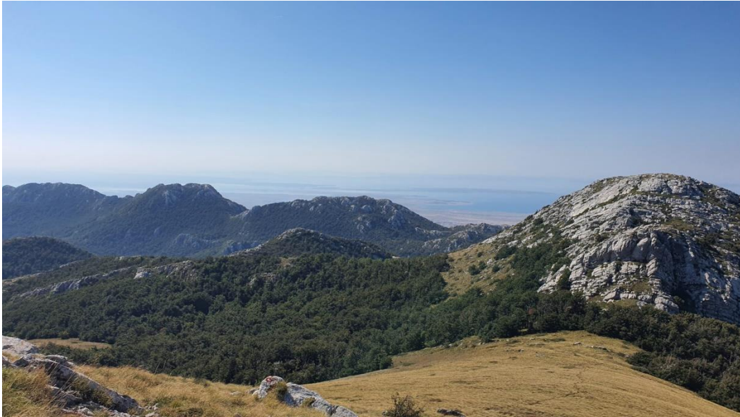
Slika 19. Pogled na živopisne predjele Velebita

Jedna od brojnih prometnica koja spaja more i unutrašnjost Hrvatske je ona koja ide preko Baških Oštarija. Vijugava strma cesta koja prolazi kroz predjele Velebita, a penje od mjesta Brušane do Baških Oštarija. Te strme stjenovite padine poznate su pod nazivom Takalice. Porijeklo riječi Takalica dolazi od „takati“, tj. spuzati drvo niz strminu.