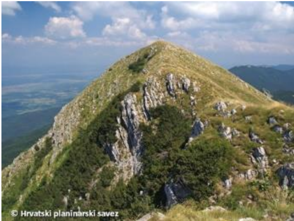
Slika 9. Prikaz Visočice