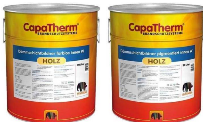
Slika 13. Capatherm Holz bezbojni i bijelo pigmentirani.

Vatrootporni bezbojni ili bijelo pigmentirani premaz za korištenje u unutarnjim prostorima. Pod utjecajem požara stvara izolirajući sloj koji sprječava daljnje širenje požara. Sastoji se od smola te se baza ne razrjeđuje. Koristi se u impregnaciji masivnog drva, iverica i stolarskih ploča te je premaz službeno ispitan prema normi HRN EN 13501-1. Podlogu na koju se nanosi treba temeljno obrusiti, očistiti od mrlja i prašine. Nanosi se valjkom, kistom ili špricanjem. Nema naknadnog gorenja zaštićenih površina te reducira plinove (Synthesa; sl. 13).