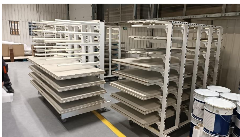
Slika 18. Prikaz sušenja i egalizacije elementa.