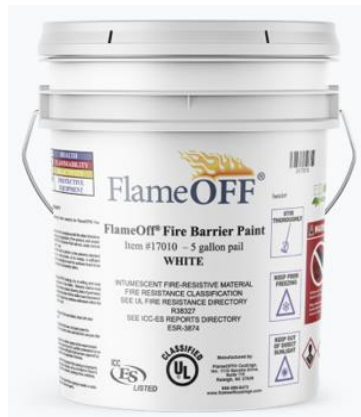
Slika 14. FlameOFF Fire Barrier Paint

štrcaljkom zbog ravnomjernijeg nanosa te lakšom završnom obradom (FlameOFF, 2022; sl. 14).