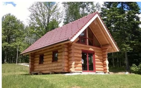
Slika 1. Prikaz primjera drvene kuće.

Najbitnije prednosti drva su danas, u graditeljstvu u odnosu na ostale materijale, laka obradivost, visok omjer čvrstoće i gustoće, ugradnja CO 2 sa ekološkog pogleda, minimalna potrošnja energije već pri ugradnji drva, izolacijska svojstva, trajnost, sigurnost od potresa te brzina gradnje (Kuzman, 2010.). Problem kod uporabe drva je niska dimenzijska stabilnost i podložnost napadu bioloških čimbenika razgradnje drva (koji razgradnjom drvene tvari smanjuju fizička i mehanička svojstva drva), a najveći problem je laka zapaljivost drva. To stvara specifične rizike za korištenje drva kao građevinskog materijala u smislu jer lako dolazi do zapaljenja i stvaranja požara, širenja požara u obliku dima i vatre ili promjene nosivosti uslijed izgaranja (Sauerbier i sur., 2020). Uz pravilnu brigu i održavanje drvene kuće od trupaca mogu imati dugi životni vijek i povoljno utječu na psihičku ravnotežu. Svojom estetikom i izgledom drvene su kuće još od davnina privlačile ljude za gradnju, ali zbog straha kratkovječnosti drva i teškog održavanja, te zbog dostupnosti betona i drugih materijala za gradnju, ljudi se nisu često odlučivali za gradnju drvenih kuća. Danas se zbog sve veće ekološke osviještenosti i istraživanja svojstava drva gradnja drvenih kuća postaje sve popularnija. Također mnoga istraživanja i znanje o drvu su omogućila razvoj različitih zaštitnih premaza koji omogućavaju dugotrajnost drva.