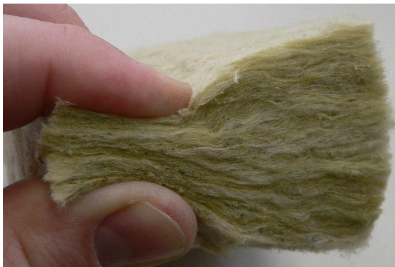
Slika 8. Prikaz mineralne vune.

Najpoznatiji materijal je mineralna vuna. Svojim se svojstvima poput niskog koeficijenta toplinske provodljivosti, negorivosti, veliki toplinski interval primjene, tijekom gorenja se oslobađa minimalna količina opasnih plinova, velika paropropusnost i zanemariv temperaturni rad ističu mineralnu vunu kao jako kvalitetan izolacijski materijal (Novak, 2021).