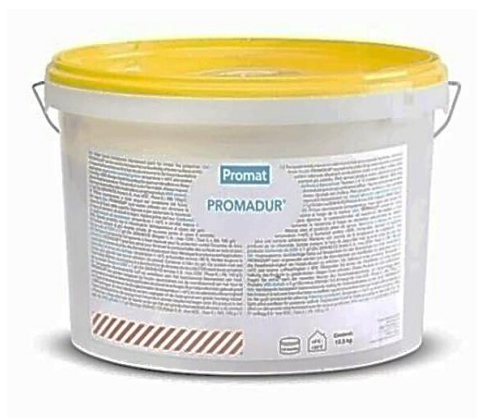
Slika 11. Promadur temeljni premaz.

Najnoviji protupožarni premaz za drvo koji se koristi kao zaštita drvnih konstrukcija od požara. Reaktivni premaz koji se svojim vatrootpornim svojstvima i prozirnošću ističe u odnosu na druge slične tvari. Čimbenici koji povećavaju otpornost drva na požar su debljina elemenata, oblik, vrsta materijala, gustoća materijala, dostupnosti kisika i kvaliteti nanesenih vatrootpornih premaza. Zavisno o tim parametrima „Promadur“ smanjuje ili povećava razred otpornosti na požar. Svojim vatrootpornim svojstvima prema stupnju zapaljivosti spada u razred B, s1 d0 prema normi „EN- 13501“ i svrstava se u najveći mogući razred vatrootpornosti za reaktivne premaze. Koristi se u raznim ustanovama da bi se svojim svojstvima produljio evakuacijsko vrijeme. Dugotrajni premaz koji ne mijenja svojstva te ostaje vatrootporan i ne mijenja boju (Promat). Prednosti „Promadur“ premaza je visoka zaštita od požara, visoka prozirnost, lako i jednostavno nanošenje, ekološki prihvatljiv, poboljšava mehanička svojstva te vodootpornost (sl.11).