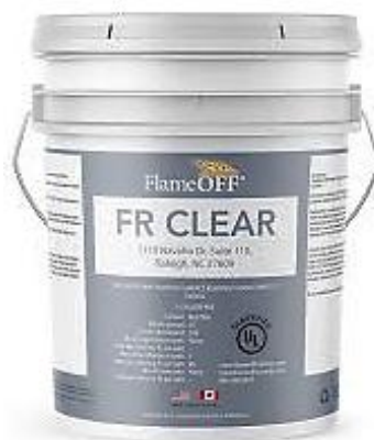
Slika 15. FlameOFF® FR Clear

Vatrootporni bezbojni vodeni premaz namijenjen zaštiti drvnih te drugih prirodnih i sintetičkih materijala. Sigurnost protupožarnog premaza je visoka. Završnom bezbojnom obradom postiže se zadržavanje početne boje, izgleda te trajnosti. Vatrootporni premaz visokokvalitetno štiti drvo i ostale materijale te uz to nije toksičan i ekološki je prihvatljiv što pridonosi njegovoj širokoj primjeni. Učinkovit je u zaštiti materijala od širenja požara te očuvanju početnih svojstava materijala. Lako i jednostavno se nanosi te se koristi u interijeru (FlameOFF, 2020; sl. 15).