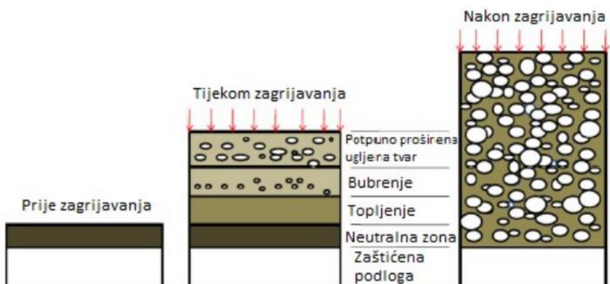
Slika 3. Prikaz djelovanja upjenjujućih premaza (Kristić, 2023.)

Izolacijski materijal je klasificiran kao polimer ili smole male toplinske vodljivosti. Nakon zagrijavanja površine ona se pirolitički razgrađuje sloj po sloj te tvoreći na površini toplinsko otporan sloj drva koji se tijekom procesa razgrađuje i pretvara u zaštitni sloj koji tijekom zagrijavanja zaštićuje drvo. Ablacijskim premazima se dodaje metalni oksid kao pigment. Djelovanjem visokih temperatura nastaju antimonovi halidi koji sudjeluju u kondenzatnoj i plinovitoj fazi. U kondenzatnoj fazi pod utjecajem topline nastaje pougljeni sloj koji ima zaštitnu ulogu na površini drva. U plinovitoj fazi dolazi do prekida stvaranja slobodnih radikala stvaranjem halogenih radikala. Najveći nedostatak ablacijskih premaza je to da imaju visoku koncentraciju aditiva da bi se osiguralo potreban stupanj zaštite od vatre. Zbog visoke koncentracije aditiva premazi su viskozni i podložni kredanju i nisu dugotrajni. Najbolja svojstva su pokazali premazi s visokim udjelom pigmenta. Najčešće se sastoje od epoksidnih, kloniriranihalkidnih, poliuretanskih ili vinilnih smola (Zanić, 2018). Upotrebljava se u unutarnjim i vanjskim interijerima u različitim bojama. Ablacijski premazi se mogu kombinirati sa kemijskim premazima te tvoriti pjenasti karbonizirani sustav. Tako kombinirani sloj premaza znatno pouspješuju vatrootpornost drvna.