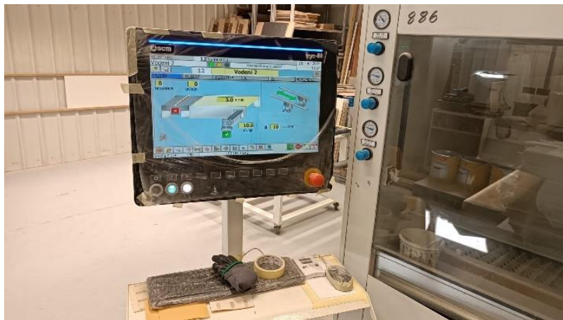
Slika 16. Prikaz računala lakirnice. Dobiveno iz vlastite arhive.

Vatrootporni premazi se nanose linijskom lakirnicom. Drvni elementi koji se zaštićuju ovom metodom se prije nanošenja fino bruse. Brušenje se provodi zbog bolje kvalitete površine na koju nanosimo premaz. Proces lakiranja na linijskoj lakirnici ima više faza od nanošenja laka do sušenja samog laka prolaskom kroz lakirnicu. Lakirnica je automatizirana i svi parametri se preko računala unose prije samog početka lakiranja, što omogućava ravnomjieran sloj, visoku kvalitetu završne obrade te minimalnu potrošnju premaza. Prvo se nanosi temeljni premaz nakon kojeg se element ponovno brusi te se nakon njega nanosi zaštitni sloj. Nakon prolaska linijom elementi se dodatno suše i egaliziraju na metalnim stalcima.