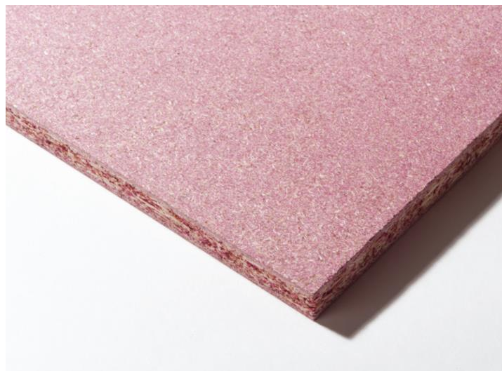
Slika 5. Vatrootporna iverica.

Iverice u kombinaciji sa vatrootpornim svojstvima čine jako kvalitetan i u graditeljstvu zanimljiv materijal. Iverice sa svojim kvalitetama čvrstoće, dugotrajnosti te lakoćom obrade i rezanja jako privlače izvođače da je ugrade u dio svog interijera. Najčešće se koriste za oblaganje unutarnjeg dijela interijera u javnim prostorima. Kao što su škole, dvorane, vrtići, kina te prostorima izloženim lakozapaljivim tvarima (Drvodom).