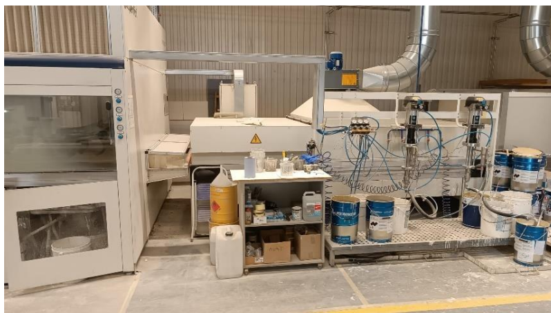
Slika 17. Prikaz postrojenja lakirnice.