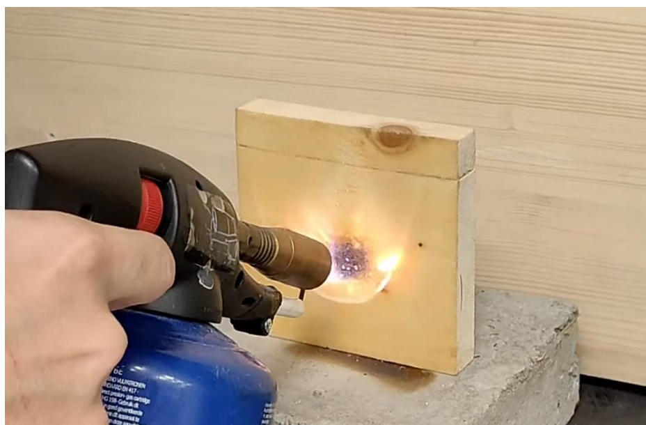
Slika 10. Vatrooporni premaz.

Intumescentni protupožarni premazi su boje, lakovi i impregnacijski premazi oni smanjuju reakciju na požar. Njihova glavna svojstva su da povećaju otpornost te zaštite drvene dijelove konstrukcije i pokazali su se kao jedno od najučinkovitijih metoda zaštite. Kroz povijest su se drveni elementi uranjali u morsku vodu koja je smanjivala zapaljenje, dok se danas specijalnim premazima stvaraju toplinske barijere. Intumescentni premazi se šire na oko 200 °C i tvore multicelularni zaštitni sloj koji štiti drvo od požara (Promat).