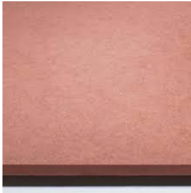
Slika 7. Prikaz srednje tvrde vlaknatice (MDF ploča).