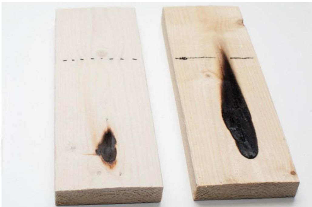
Slika 4. Prikaz usporedbe zaštićenog uzorka i nezaštićenog uzorka vatrootpornim sredstvom.

Vatrootpornost drva je svojstvo drva da čim dulje zadrži svoja početna svojstva te se ne deformira. Vatrootporni materijali djeluju na način da mogu usporiti rast temperature, proizvode plinoviti zaštitni omotač, generiraju nezapaljive karbonske obloge, reflektiraju toplinsko zračenje ili stvaraju fizičku barijeru između kisika i drvenog sloja. Najčešće pa dolazi do kombinacije različitih načina djelovanja (Sauerbier i sur., 2020). Drvo zahtjeva dosta pažnje oko odabira zaštitnih sredstava do same primjene istih sredstava. Bitno je da se sa primjenom zaštitnih sredstava smanji rizik na požar, uspori početak izgaranja, poveća otpornost na požar i najbitnije poveća kapacitet nosivosti konstrukcije. Kapacitet nosivosti kod požara se najviše smanjuje zbog smanjenja poprečnog presjeka kod izgaranja drva. Sa oblaganjem drvene konstrukcije, nereaktivnom izolacijom, ožbukanim zidovima ili protupožarnim premazima za drvo se može produljiti kapacitet nosivosti drva.