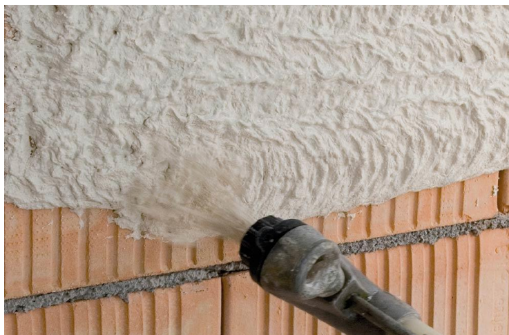
Slika 9. Nanošenje žbuke na zidove.

miješanjem suhe tvari sa vodom. Na zidove se nanosi sa pumpom prskalicom (Promat). Nedostaci ovakve metode su hrapavost površine, greške prilikom nanošenja i slaba otpornost na nepovoljne vremenske uvjete.