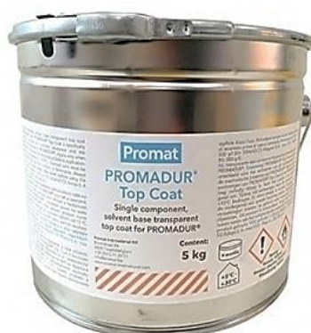
Slika 12. Promadur Top Coat – završni premaz.

jednostavno nanošenje i brzo sušenje pridonose uporabi ovog premaza. Njegova primjena ne šteti vatrootpornim svojstvima temeljnih premaza te se kao takav lako primjenjuje (sl. 12).