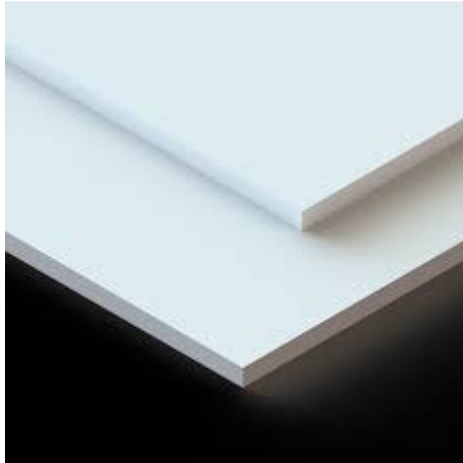
Slika 6. Primjer vatrootporne ploče.

kako će se ploča ponašati u najzahtjevnijim uvjetima, a ne samo termičko ponašanje. „Promatove“ ploče testirane su i ispitane su u najzahtjevnijim uvjetima uporabe te su pokazale visoku termičku stabilnost (Promat).