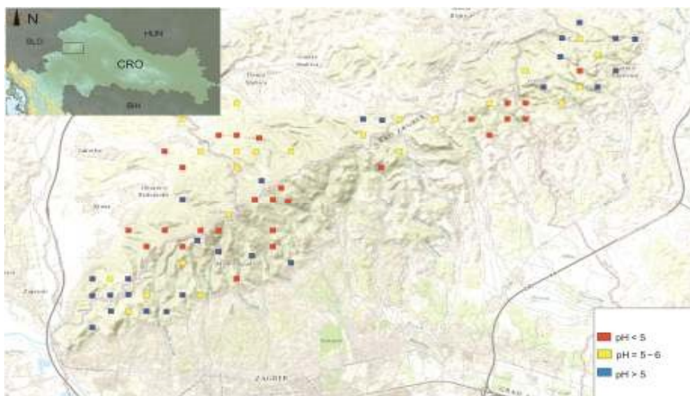
Slika 6. Karta uzorkovanja tala za istraživanje

Uzorci tla su prikupljeni s različitih mjesta s Medvednice kako prikazuje (slika 6.). Uzorci su razvrstani u tri skupine s obzirom na raspon kiselosti ( \text{pH} < 5,00 ; 5,00 < \text{pH} < 6,00 ; \text{pH} > 6,00 ).