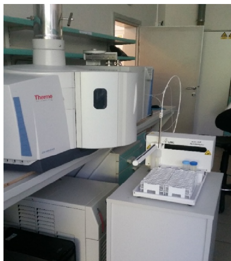
Slika 3. Spektrometar (ICP-AES)

Koncentracije istraživanih elemenata u priređenim otopinama određivane su tehnikom atomske emisijske spektrometrije uz induktivno spregnutu plazmu (ICP-AES). Stabilni uvjeti za rad uređaja su podešeni te je obavljena vanjska kalibracija serijom standardnih otopina. Na (slici 3). je prikazan spektrometar koji je korišten za istraživanje Thermo Fischer iCAP6300 Duo .