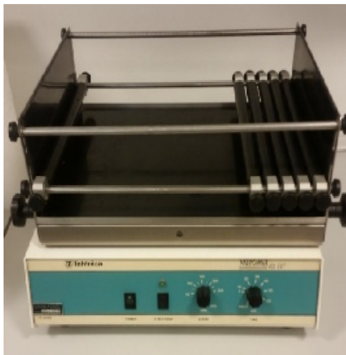
Slika 4. Mućkalica Tehtnica VIBROMIX 403

Za mućkanje uzoraka korištena je tresilica Tehtnica VIBROMIX 403 EVT (slika 4). Uređaj je korišten za mućkanje uzoraka tala s otopinom određene soli u jednom mjerenju s HCl ili CH 3 COOH. Uzorci su mućkani na 200 okr/min., 24 sata bez prestanka.