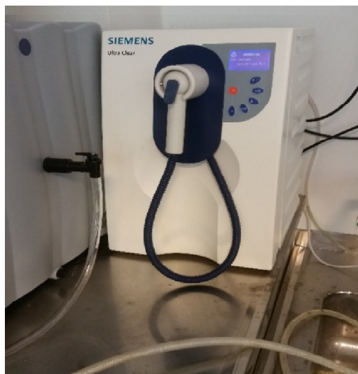
Slika 1. Uređaj za pripravu ultračiste vode Siemens Ultra clear

Razrjeđivanja i pranje posuđa rađeno je ultračistom vodom (0,055 μS/cm) priređenom uređajem Siemens Ultra clear. (Slika 1.) prikazuje uređaj za pripremu ultračiste vode Siemens Ultra clear.