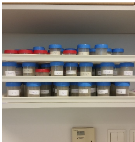
Slika 2. Uzorci tala za istraživanje s Medvednice