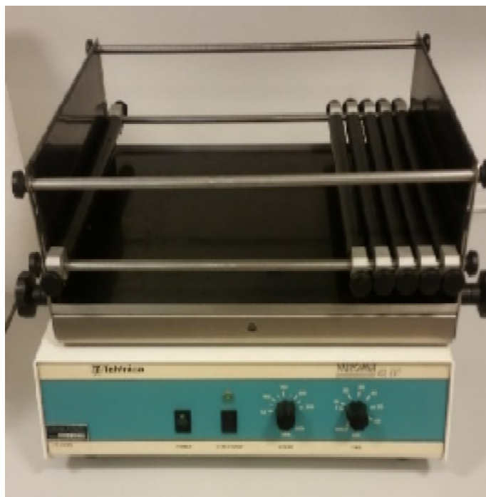
Slika 4. Mućkalica Tehtnica VIBROMIX 403

Za mućkanje uzoraka korištena je tresilica Tehtnica VIBROMIX 403 EVT (slika 4). Uređaj je korišten za mućkanje uzoraka tala s otopinom određene soli u jednom mjerenju s HCl ili CH 3 COOH. Uzorci su mućkani na 200 okr/min., 24 sata bez prestanka.