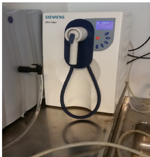
Slika 1. Uređaj za pripravu ultračiste vode Siemens Ultra clear

Razrjeđivanja i pranje posuđa rađeno je ultračistom vodom (0,055 μS/cm) priređenom uređajem Siemens Ultra clear. (Slika 1.) prikazuje uređaj za pripremu ultračiste vode Siemens Ultra clear.