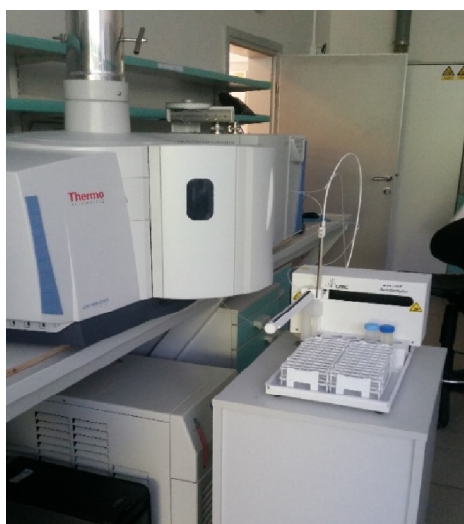
Slika 3. Spektrometar (ICP-AES)

Koncentracije istraživanih elemenata u priređenim otopinama određivane su tehnikom atomske emisijske spektrometrije uz induktivno spregnutu plazmu (ICP-AES). Stabilni uvjeti za rad uređaja su podešeni te je obavljena vanjska kalibracija serijom standardnih otopina. Na (slici 3). je prikazan spektrometar koji je korišten za istraživanje Thermo Fischer iCAP6300 Duo .