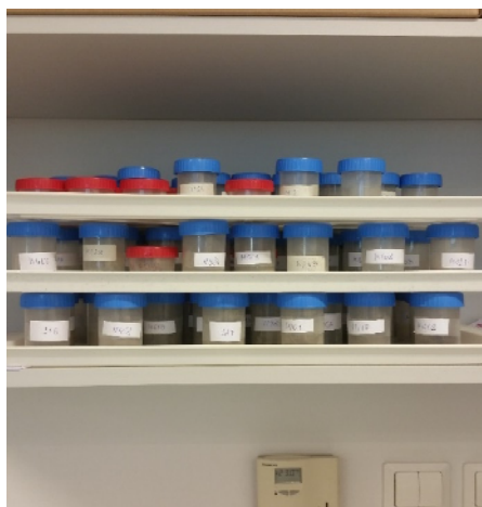
Slika 2. Uzorci tala za istraživanje s Medvednice