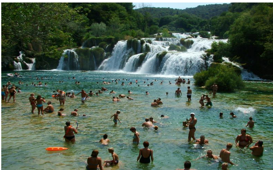
Slika 21. Kupači na donjem dijelu Skradinskog buka

Skradinski buk u Nacionalnom parku Krka vrvi kupačima, koji se pračkaju tek 20 metara od sedrenih slapova. Problem je ljetno, jer ljeti dolazi prevelik broj posjetitelja- u isto vrijeme na premalenom