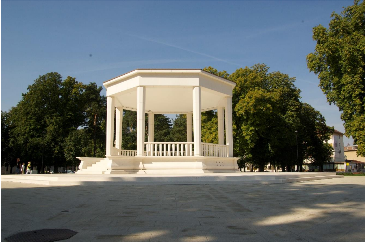
Slika 2. Glazbeni paviljon na trgu Eugena Kvaternika - prepoznatljiv simbol grada (slikano nakon obnove 2016. godine).

vježbanje vojnika i sakupljanje stoke prije tjeranja na ispašu. Oko 1883. godine trg je počeo poprimati oblik perivoja. Trg je stazama razdijeljen u četiri dijela te su 1889. godine posađena stabla divljega kestena. Neka od tih stabala zadržala su se do danas, iako nisu u najboljem zdravstvenom stanju. 1943. godine u središtu parka sagrađen je glazbeni paviljon od bijelog bračkog mramora, koji je u potpunosti obnovljen 2016. godine. Tijekom 20. stoljeća u park su unesene brojne egzotične vrste, čemu svjedoči popis vrsta iz 1977. godine koji bilježi čak 40 stranih vrsta i svega 4 autohtone.