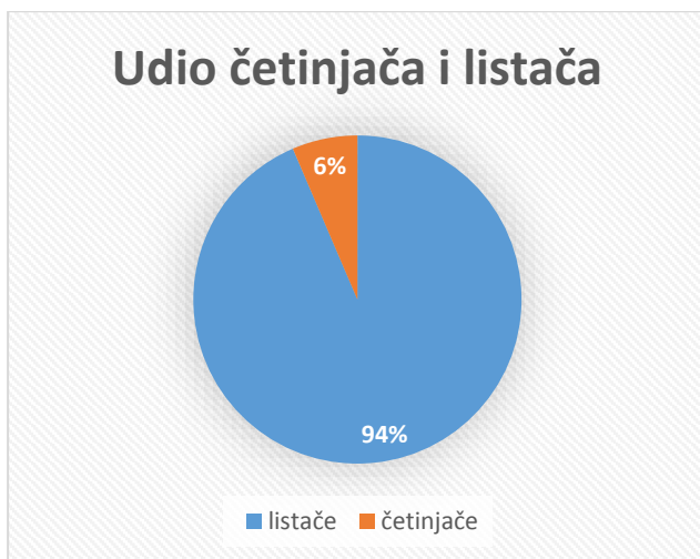
Slika 10. Grafički prikaz udjela četinjača i listača.

Udio četinjača i listača, u drvodredima i alejama Bjelovara, prikazan je na slici 10.