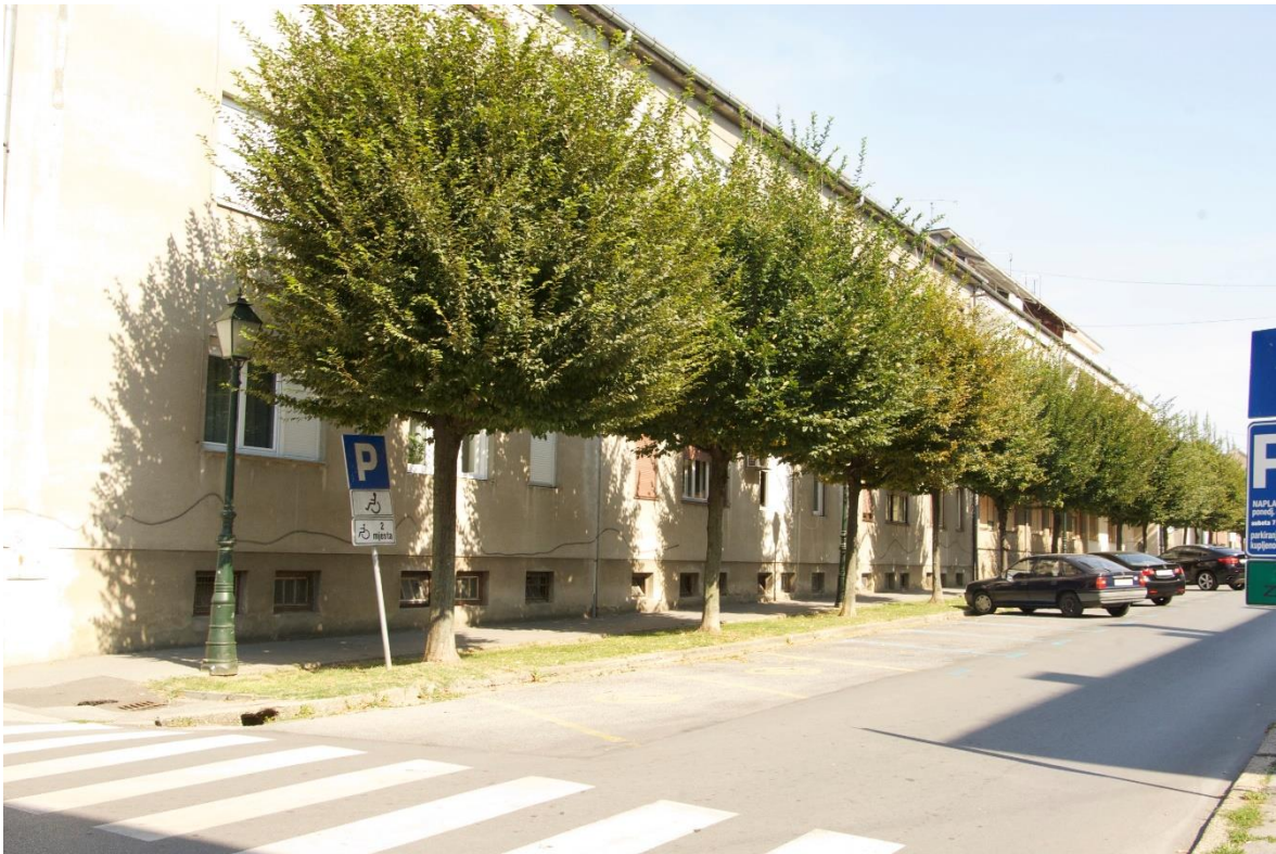
Slika 5. Drvored običnoga graba u ulici dr. Ante Starčevića osnovan sadnicama iz obližnje šume.