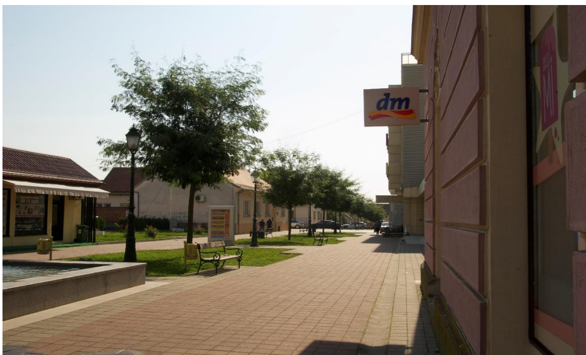
Slika 4. Drvored kultivara 'Inermis' gledičije u ulici Vatroslava Lisinskog.

U nastavku se mogu vidjeti detalji drvoreda u ulici Vatroslava Lisinskog (slika 4), dr. Ante Starčevića (slika 5) i Ante Trumbića (slika 6) te detalj aleje u ulici Ivana Mažuranića (slika 7).