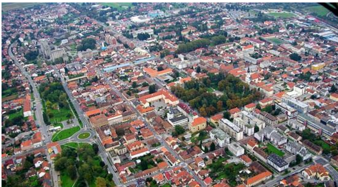
Slika 1. Prikaz Bjelovara iz zraka - vidljiv je pravilan ortogonalni raster gradske jezgre.

Urbanistički je jezgra Bjelovara riješena po strogo ortogonalnom sistemu. Široke paralelne ulice sjeverozapadnog i jugoistočnog smjera sijeku se pod pravim kutom s paralelnim ulicama sjeveroistočnog i jugozapadnog smjera. U toj planskoj cjelini glavni element je prostrani središnji trg koji ima gotovo centralni položaj (slika 1). Današnju zaštićenu kulturno-povijesnu jezgru renesansnog tipa ortogonalnog rastera tvori četverokut ulica između šetališta dr. Ivše Lebovića, ulice Ante Starčevića, Matice Hrvatske i trga Stjepana Radića. Prisutna je smjena arhitektonsko-umjetničkih stilova tijekom tri stoljeća postojanja grada - barok, klasicizam, secesija, historicizam i eklekticizam. Na pojedinim zgradama miješaju se renesansni motivi s klasicističkima, nešto zgrada građeno je u duhu romantizma, a prisutan je i gotički utjecaj.