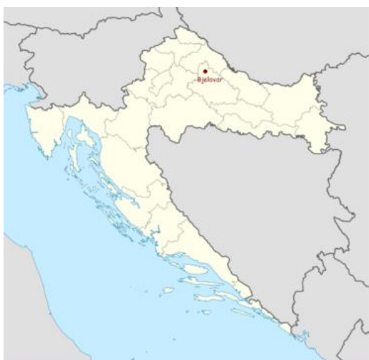
Slika 3. – položaj Bjelovara

U današnjem prometnom sustavu, Hrvatske i Europe, Bjelovar nema dobar prometni položaj. Naime, kroz njega ne prolazi nijedan veliki prometni pravac: poprečni Podunavsko-sjevernojadranski pravac (Budimpešta - Zagreb - Rijeka) prolazi zapadnije, Koprivnicom i Varaždinom, a uzdužni pravci koji povezuju Srednju i Zapadnu Europu s Bliskim istokom izgrađeni su sjevernije, odnosno južnije, dolinama Save i Drave. Međutim, Bjelovar ima mogućnosti popraviti ovu nepovoljnu situaciju - izgradnjom kvalitetne željezničke pruge Gradec - Sveti Ivan Žabno uvelike bi se skratio put između Zagreba i Osijeka što bi pravac preko Bjelovara učinilo povoljnijim od onoga koji ta dva velika hrvatska grada povezuje preko Koprivnice. Najveći pokretač gospodarskog razvoja bilo bi dovršetak gradnje planirane brze ceste Sveta Helena - Vrbovec - Bjelovar – Virovitica. (Biruš , 2005).