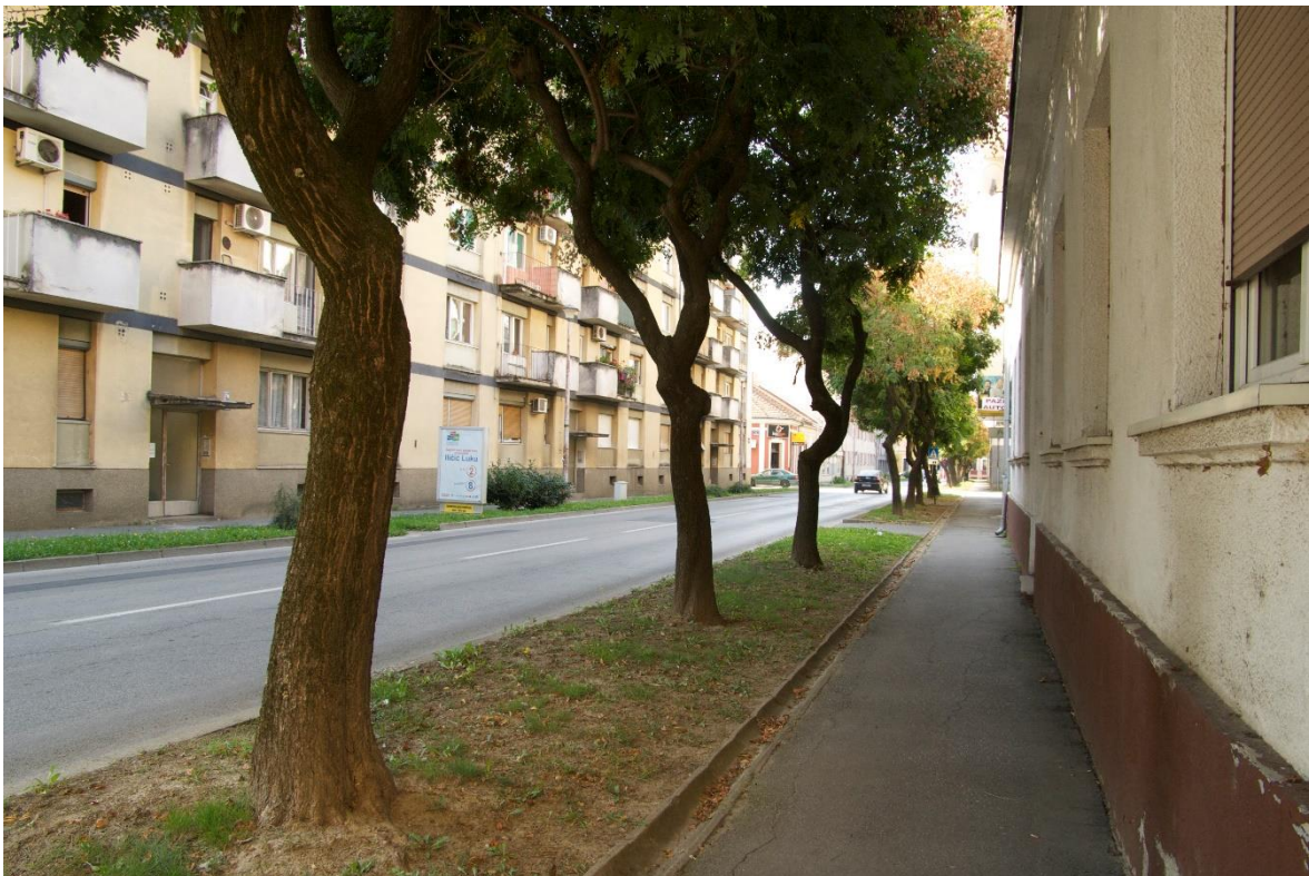
Slika 6. Drvored kelreuterije u ulici Ante Trumbića.