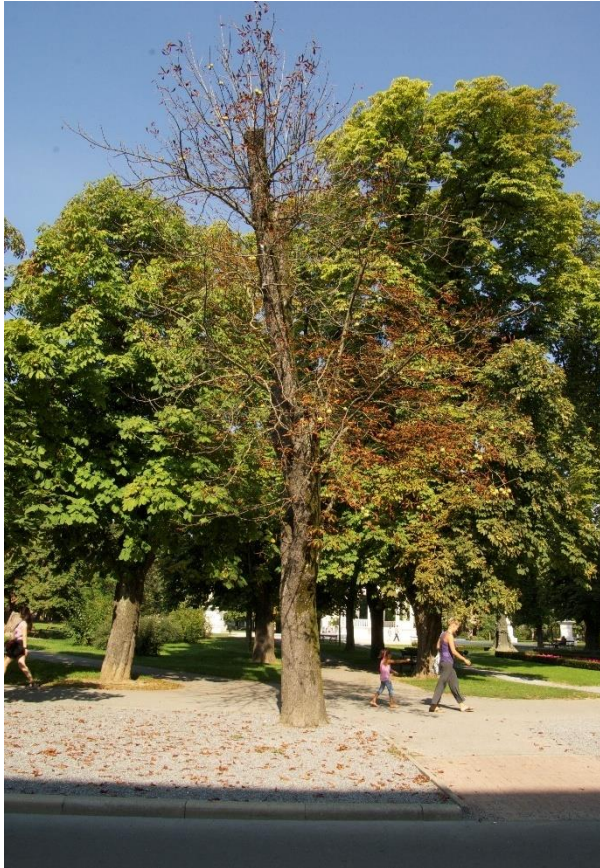
Slika 11. Stablo divljeg kestena u jako lošem stanju na trgu Eugena Kvaternika.

može pretpostaviti da takva stabla predstavljaju potencijalnu opasnost za prolaznike (slika 11). Velik broj tih stabala je vrlo oštro orezan i postepeno se zamjenjuje mladim stablima. Ne pokazuju samo stara stabla znakove oštećenosti i odumiranja. Uočena su i pojedina potpuno suha mlada stabla okruglastog bagrema i javora mliječa.