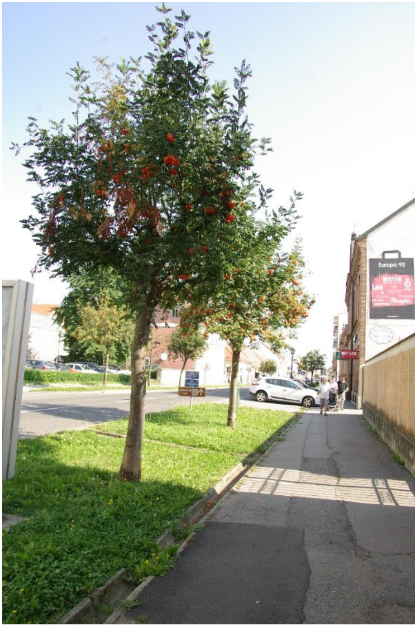
Slika 7. Detalj iz aleje u ulici Ivana Mažuranića - jarebika ( Sorbus aucuparia ).