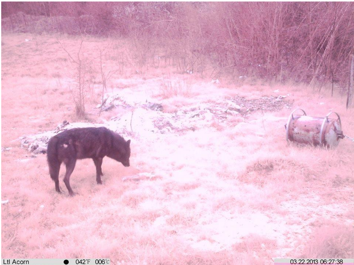
Slika 3: Crni vuk snimljen na nadzornoj kameri, LU Cincar Livno