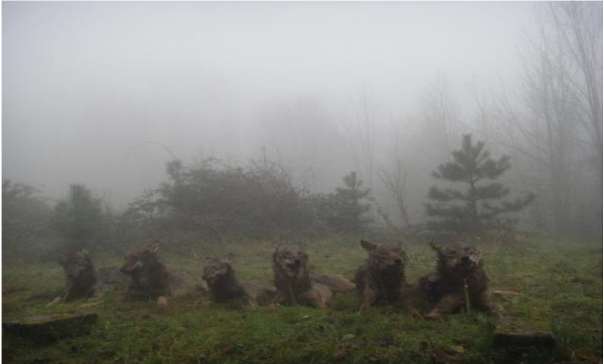
Slika 2: 6 odstreljenih vukova za jedno jutro, LD Toplica Živinice, 7.12.2014.