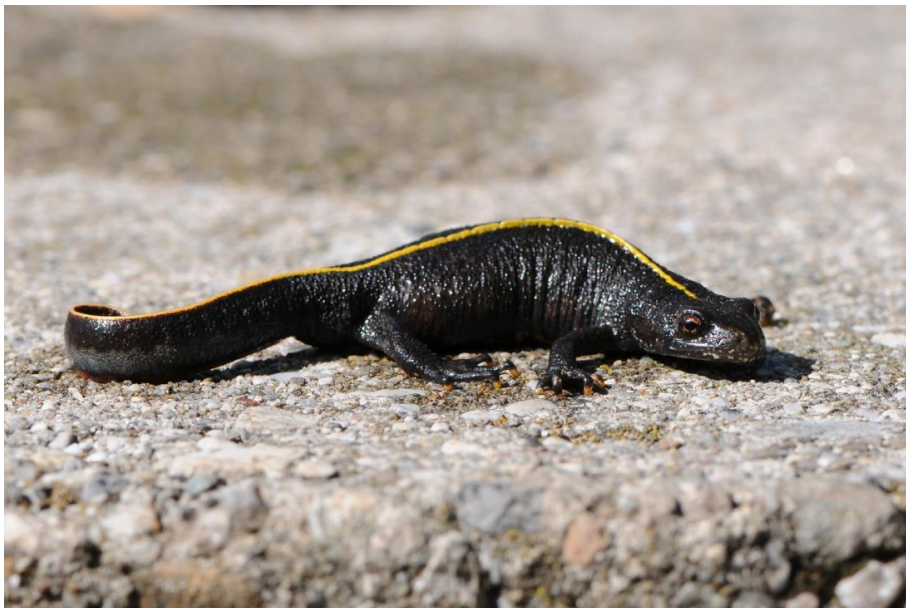
Slika 6. Veliki vodenjak