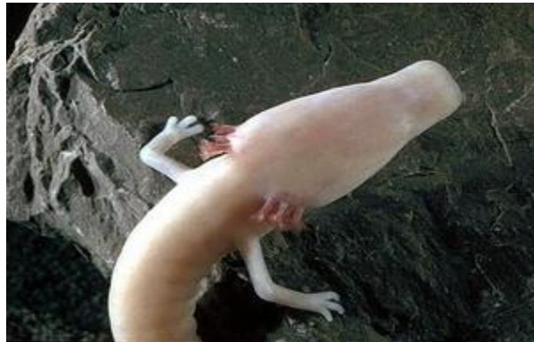
Slika 2. Glava čovječje ribice s vanjskim škragama

Proteus anguinus Laurenti, 1768 Engleski naziv: Olm Sinonimi: Siren anguina (Shaw,1802.), Hypochthton carrarae Fitzinger, 1850 Razred: Amphibia, vodozemci, amphibians Red: Caudata, repati vodozemci, salamanders and newts Porodica: Proteidae, glavašice, olms Globalna kategorija ugroženosti: VU B2ab(ii,iii,v) Europska kategorija ugroženosti: VU B2ab(ii,iii,v) Mediteranska kategorija ugroženosti: VU Nacionalna kategorija ugroženosti: ugrožena svojta, EN B2ab(ii,iii,iv,v)