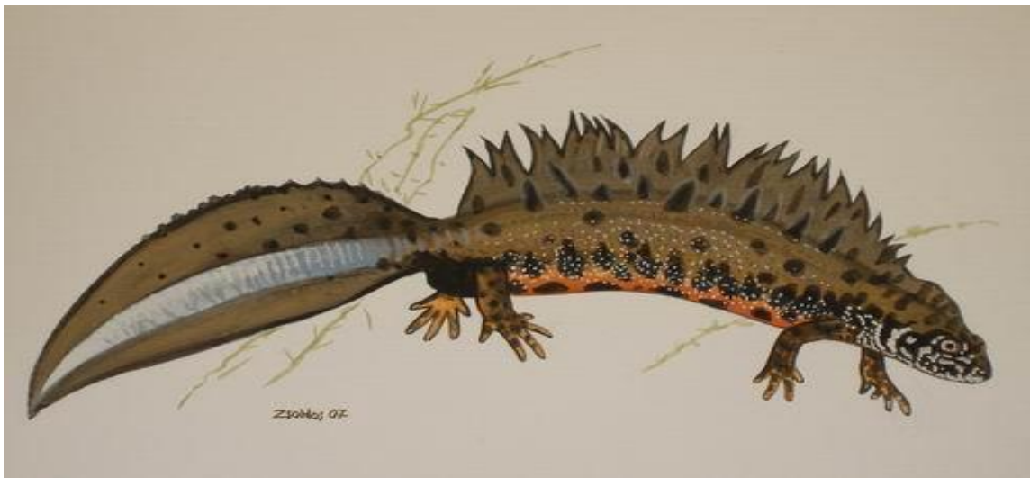
Slika 7. Veliki dunavski vodenjak Triturus dobrogicus