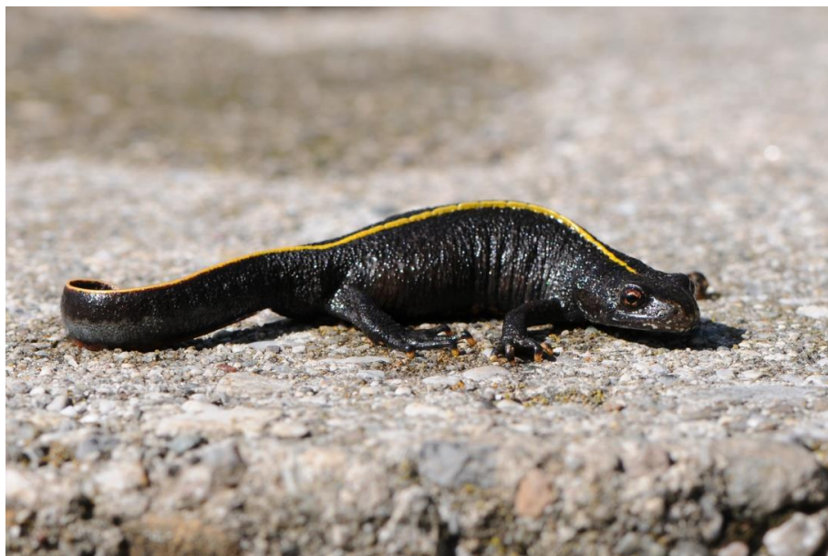
Slika 6. Veliki vodenjak