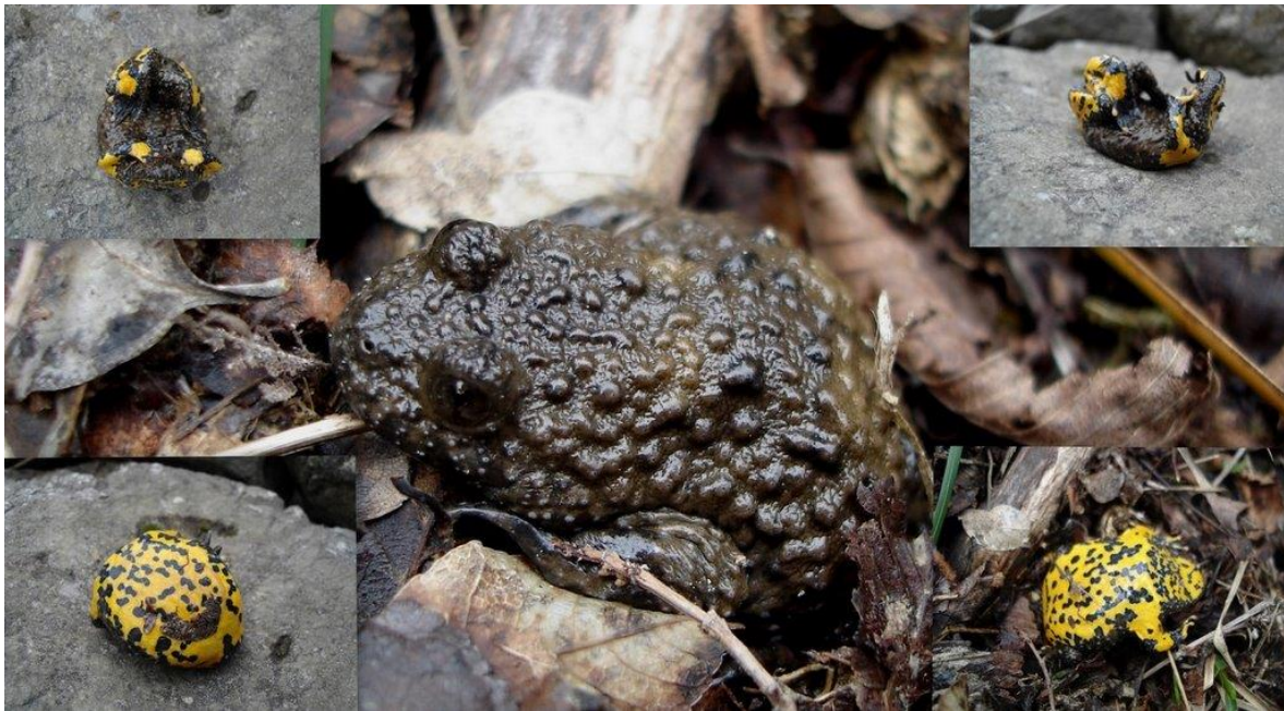
Slika 8. Žuti mukač Bombina variegata

Bombina variegata (Linnaeus, 1758) Engleski naziv: Yellow-bellied Toad Sinonimi: Rana variegata Linnaeus, 1758 Razred: Amphibia, vodozemci, amphibians Red: Anura, bezrepci, frogs and toads Porodica: Bombinatoridae, mukači, Fire-bellied toads