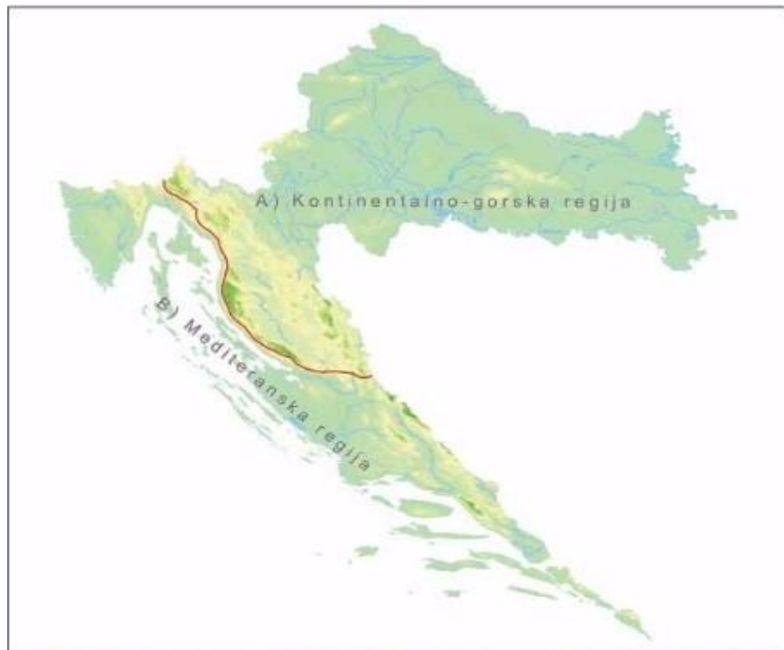
Slika 1. Prikaz dviju herpetoloških regija u Hrvatskoj

joj oblikovala današnje granice, njena bioraznolikost je prilično velika, pa je i herpetofauna jedna od raznolikijih u regiji. Fauna gorske i mediteranske regije posebno je raznolika. Zbog brojnih endemskih (pod)vrsta Hrvatska je prepoznata i kao dio mediteranskog centra bioraznolikosti, te je u samom vrhu zemalja Mediterana po broju vrsta vodozemaca i gmazova (Jelić i sur., 2012). Uz biogeografske, mogu se definirati i dvije odvojene „herpetološke“ regije koje se odlikuju značajnim razlikama u sastavu vrsta vodozemaca i gmazova, a to su kontinentalno-gorska i mediteranska regija.