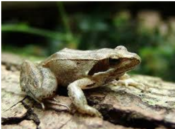
Slika 3. Lombardijska smeđa žaba, odrasla jedinka

Rana latastei Boulenger, 1879 Engleski naziv: Italian agile frog Sinonimi: talijanska smeđa žaba Razred: Amphibia, vodozemci, amphibians Red: Anura, bezrepci, frogs and toads Porodica: Ranidae, prave žabe, true frogs