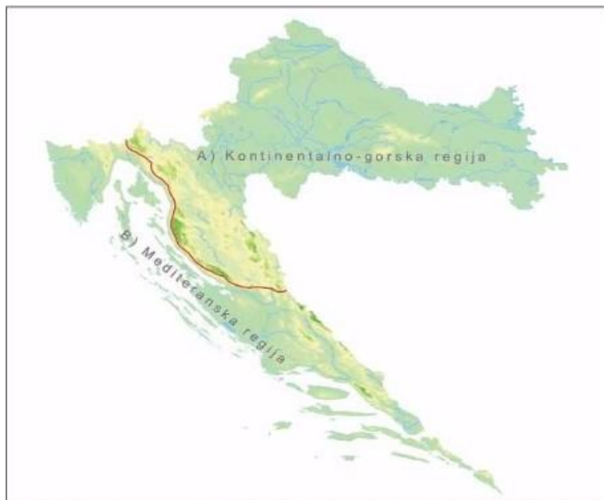
Slika 1. Prikaz dviju herpetoloških regija u Hrvatskoj

joj oblikovala današnje granice, njena bioraznolikost je prilično velika, pa je i herpetofauna jedna od raznolikijih u regiji. Fauna gorske i mediteranske regije posebno je raznolika. Zbog brojnih endemskih (pod)vrsta Hrvatska je prepoznata i kao dio mediteranskog centra bioraznolikosti, te je u samom vrhu zemalja Mediterana po broju vrsta vodozemaca i gmazova (Jelić i sur., 2012). Uz biogeografske, mogu se definirati i dvije odvojene „herpetološke“ regije koje se odlikuju značajnim razlikama u sastavu vrsta vodozemaca i gmazova, a to su kontinentalno-gorska i mediteranska regija.