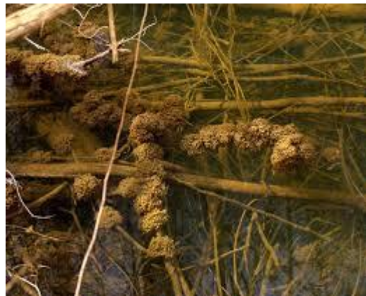
Slika 4. Mrijest lombardijske žabe