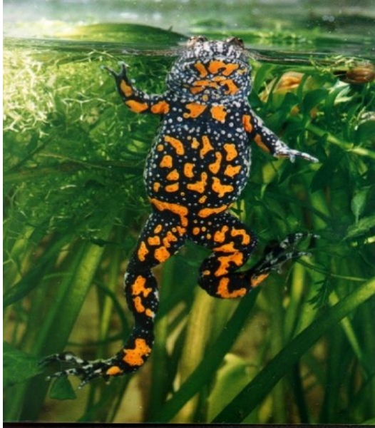
Slika 5. Crveni mukač Bombina orientalis