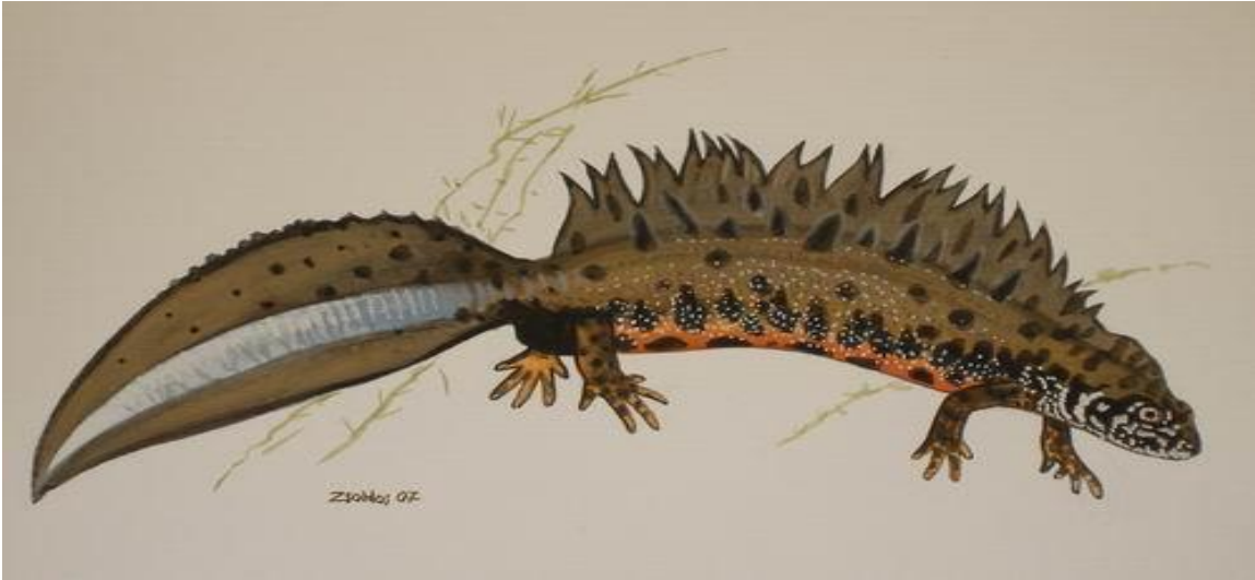
Slika 7. Veliki dunavski vodenjak Triturus dobrogicus