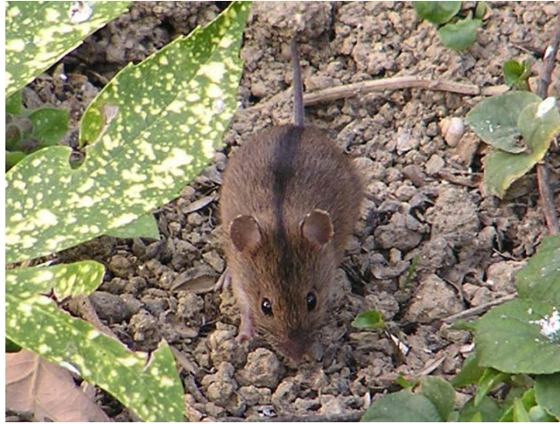
Slika 19. Prugasti poljski miš u potrazi za hranom