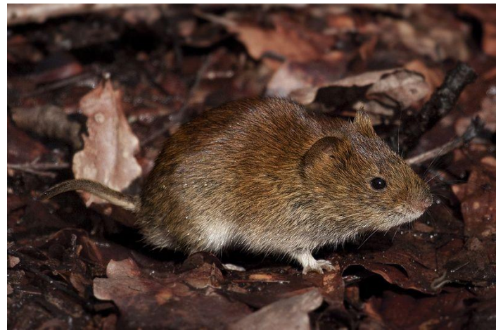
Slika 12. Šumska voluharica u izlasku iz jame Slika 13. Šumska voluharica na listincu