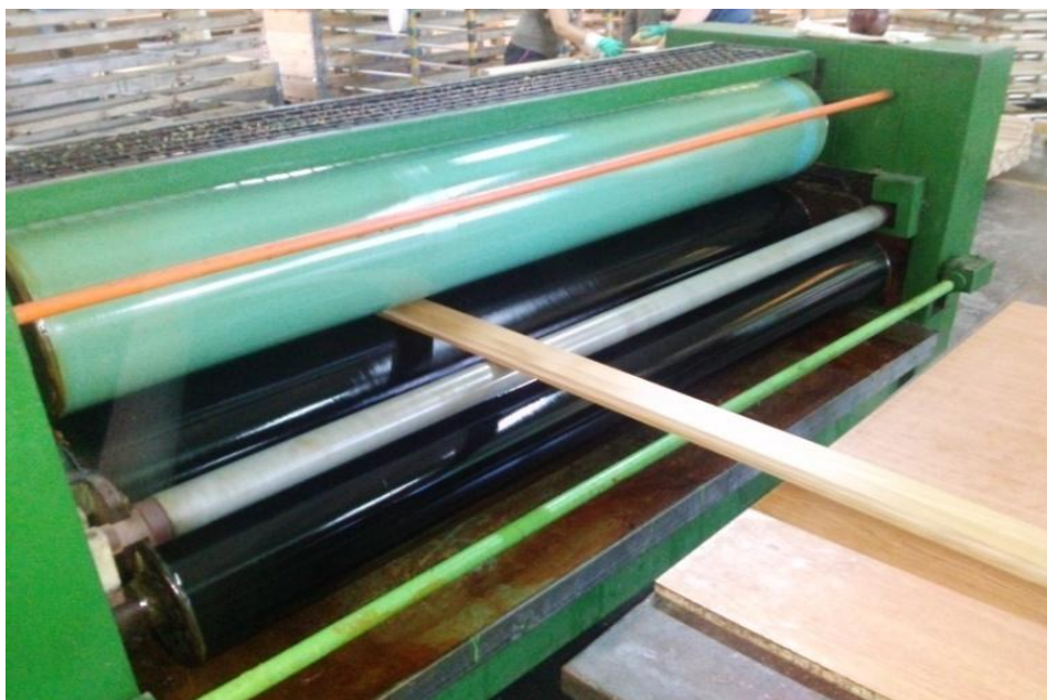
Slika 14. Nanos ulja valjcima