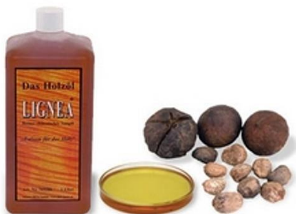
Slika 2. Tungovo ulje ( http://www.bogensport-bogenbau.at/ )

Tungovo ulje se dobiva od sjemenki tungovine. Zbog vrlo dobrih zaštitnih svojstava ovo je ulje poznato pod nazivom drveno ulje. Većinom se koristi u Japanu i Kini. Ovo se ulje vrlo brzo apsorbira na površinu drva te daje vrlo fleksibilne i trajne prevlake, otporne na vodu. Za razliku od lanenog ulja neće tamniti i mijenjati boju s vremenom. To je ulje otporno na alkalije i vodu pa ga zato u kombinaciji s prirodnim smolama često koriste za izradu vodootpornih premaza. U smjesi s lanenim uljem dobro se pokazalo kod uljenja drvenih podnih obloga (Petrič, 2006).