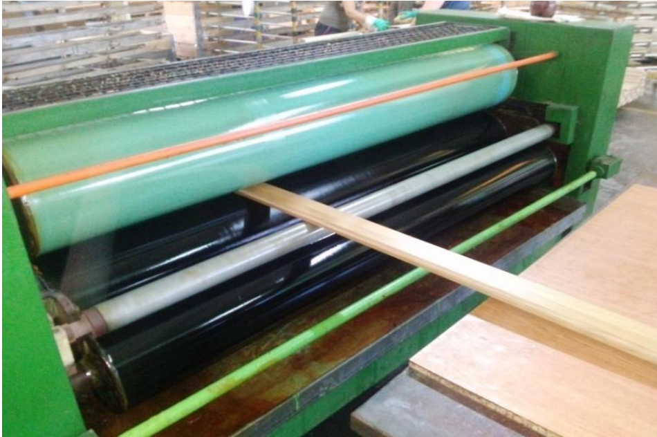
Slika 14. Nanos ulja valjcima