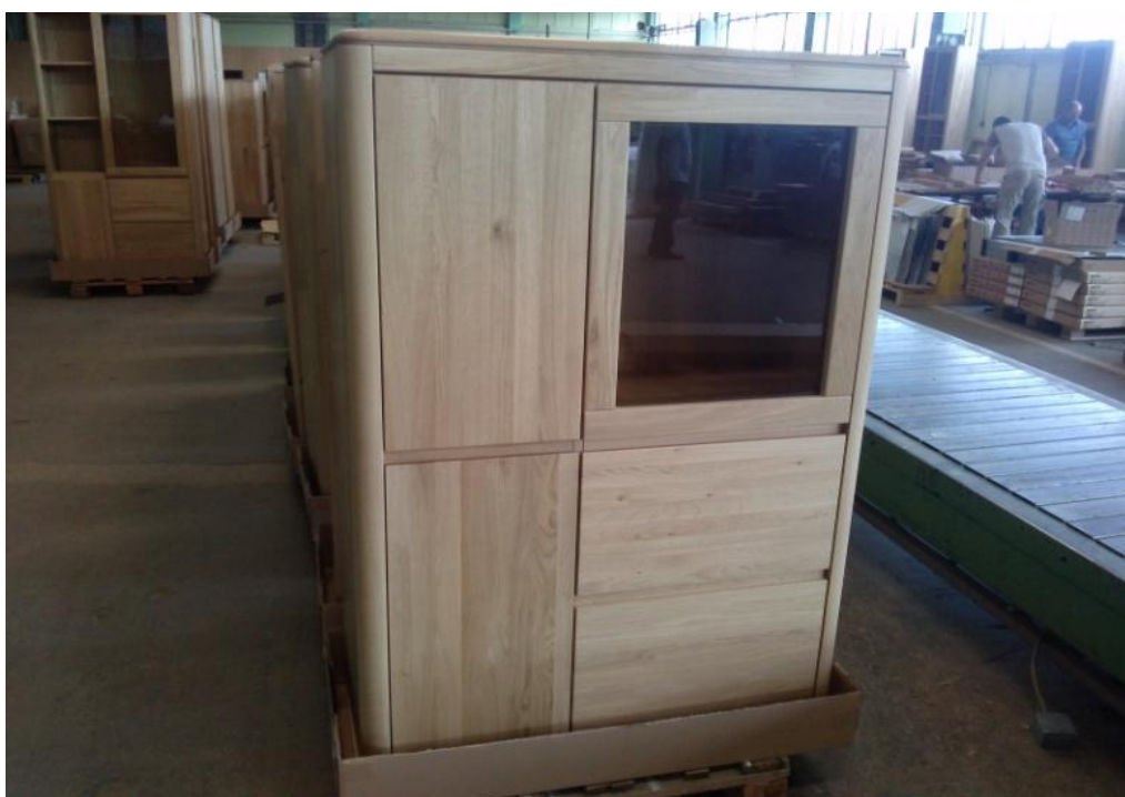
Slika 20. Proizvod 3 - vitrina od hrastovine površinski obrađena uljima