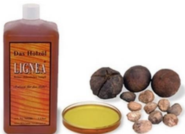
Slika 2. Tungovo ulje ( http://www.bogensport-bogenbau.at/ )

Tungovo ulje se dobiva od sjemenki tungovine. Zbog vrlo dobrih zaštitnih svojstava ovo je ulje poznato pod nazivom drveno ulje. Većinom se koristi u Japanu i Kini. Ovo se ulje vrlo brzo apsorbira na površinu drva te daje vrlo fleksibilne i trajne prevlake, otporne na vodu. Za razliku od lanenog ulja neće tamniti i mijenjati boju s vremenom. To je ulje otporno na alkalije i vodu pa ga zato u kombinaciji s prirodnim smolama često koriste za izradu vodootpornih premaza. U smjesi s lanenim uljem dobro se pokazalo kod uljenja drvenih podnih obloga (Petrič, 2006).