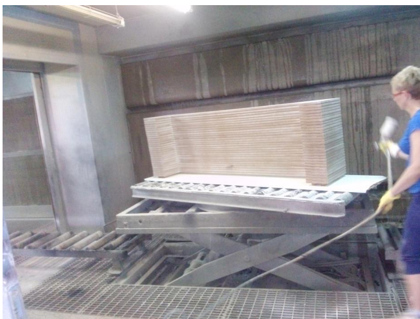
Slika 15. Obrada rubova štrcanjem

Odmah poslije nanošenja ulja na površinu masivnih elemenata skida se višak ulja suhim krpama potom se elementi slažu na kolica sa češljevima (stalaže) koja su odmah do radnog stola. Masivni elementi su složeni jedan pored drugog