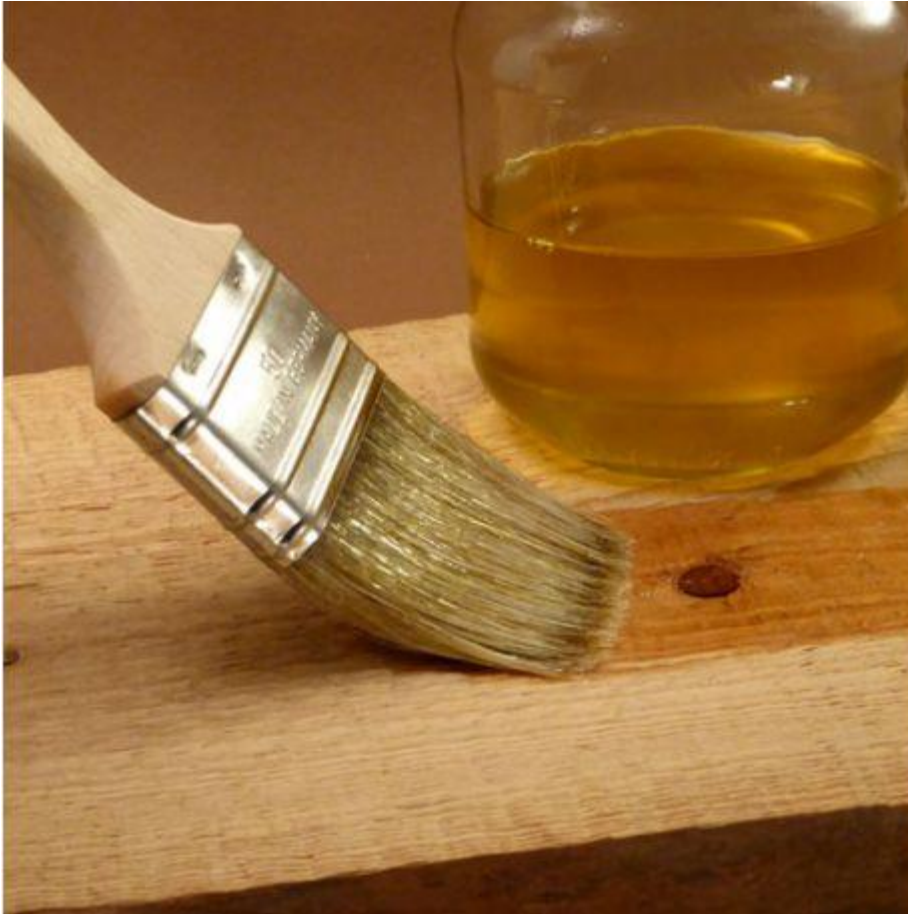
Slika 4. Nanošenje ulja kistom