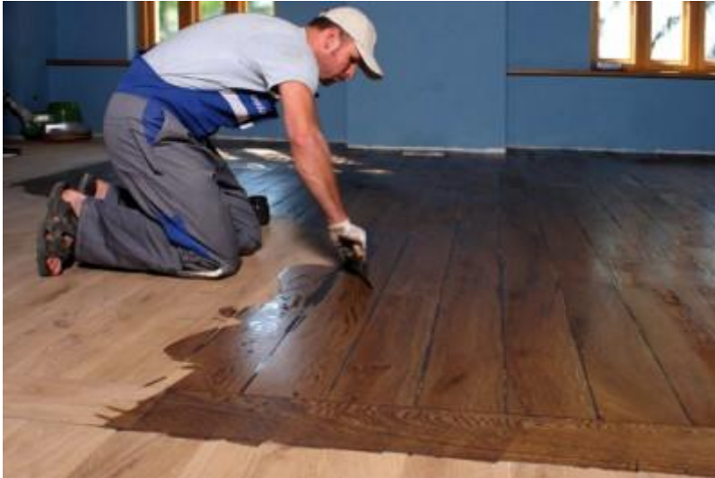
Slika 5. Nanošenje ulja lopaticom