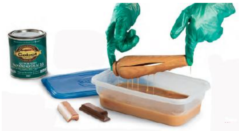
Slika 7. Nanošenje ulja uranjanjem

Manji drveni dijelovi kao što su prihvatnici, drvene figurice mogu se uranjati ili oblijevati uljem. Nakon nanošenja treba se ostaviti neko vrijeme da ulje otkapa sa obratka (Hã gele, 2003).