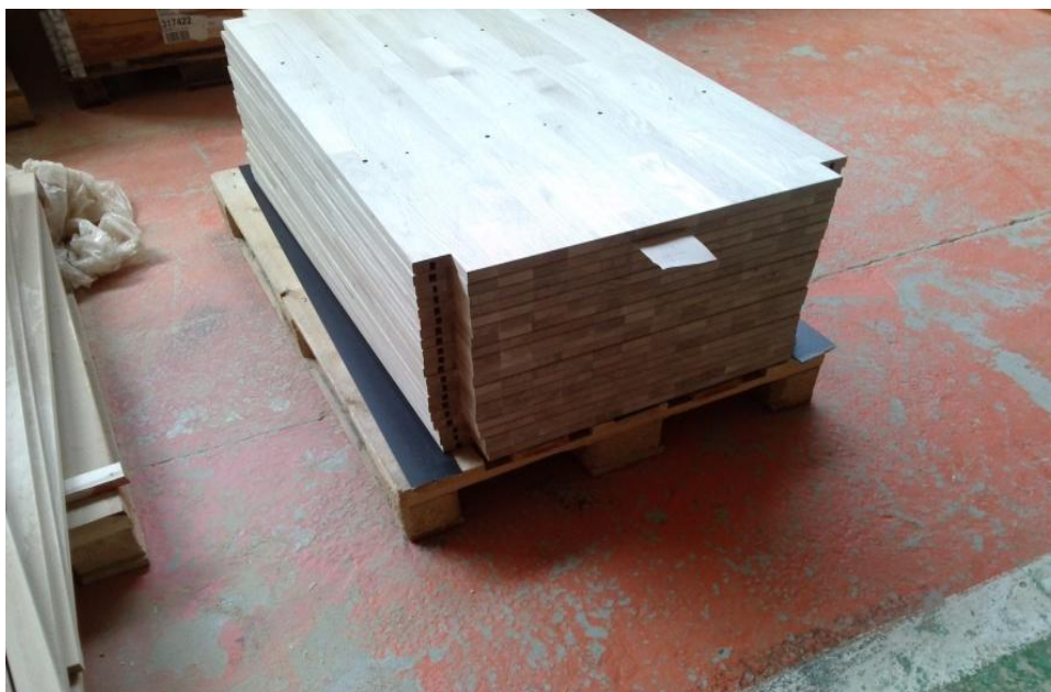
Slika 10. Elementi složeni za proces brušenja

P150 što nije dovoljno glatko i kvalitetno za daljnju obradu, te se obrušeni elementi slažu ponovno na palete i transportiraju do linije za lakiranje pomoću valjčanih transportera. Na liniji za lakiranje se provodi finije brušenje. Linija za lakiranje ima dvije brusilice. Na početku linije se nalazi širokotračna brusilica marke "DMC Toopsand" s 3 agregata od kojih je i jedan poprečni agregat. Brusilica ima četku za čišćenje prašine i ostalih sitnih čestica zaostalih na površini elemenata. Brušenje se na početku odvija brusnom trakom granulacije P180, a na drugoj brusilici koja je ista odvija se brušenje brusnom trakom granulacije P220. Kontrolu obrađene površine kontrolira tehnolog i radnik na kraju linije. Obrada mora biti takva da je pod prstima glatka i da nema fizičkih oštećenja. Mora se naglasiti da se zahtjevniji elementi koji nemaju ravne površine nego imaju zaobljenja bruse papirom P180, te završno brusnim papirom granulacije P220. Ovaj proces može u konačnici dosta dugo potrajati.