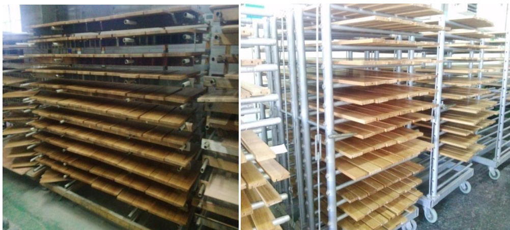
Slika 16. Sušenje masivnih elemenata na "stalažama"

uz minimalan razmak dovoljan da se mogu osušiti. Sušenje traje oko 24h. Krpe koje su iskorištene za nanos ulja se odvajaju u kantu s vodom izvan tvornice zbog njihove zapaljivosti.