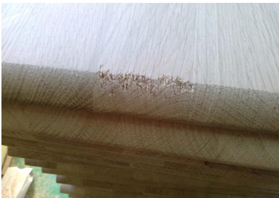
Slika 13. Greška koja je nastala prilikom strojne obrade drva