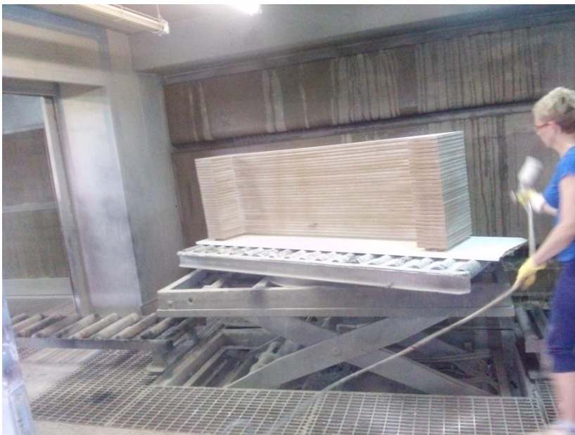
Slika 15. Obrada rubova štrcanjem

Odmah poslije nanošenja ulja na površinu masivnih elemenata skida se višak ulja suhim krpama potom se elementi slažu na kolica sa češljevima (stalaže) koja su odmah do radnog stola. Masivni elementi su složeni jedan pored drugog