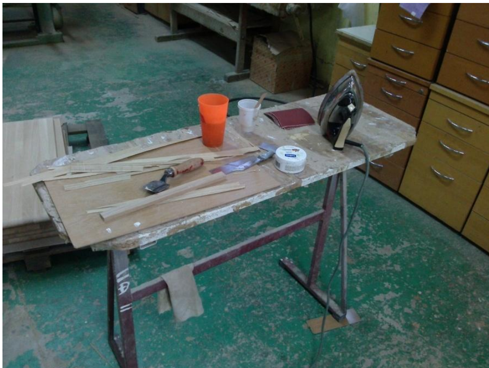
Slika 11. Ručno brušenje i kitanje

Kada radnik na liniji i tehnolog pregledaju je li površina elemenata dovoljno dobro obrađena, šalju se elementi složeni preko valjčanih transporterata do mjesta gdje radnici nanose ulje. U tvornici 1 rade pomoću "mazalice" koja radi po principu valjčanog nanosa, s dozirnim i nanosnim valjkom kojim se kontrolira nanos ulja. Nanos ulja na površinu elementa na stroju za nanošenje valjcima iznosi u prosjeku 15 \text{ g/m}^2 , dok se ručnim nanosom ostvaruje nanos 30 \text{ g/m}^2 . Strojem za nanošenje ulja valjcima može se obraditi veći broj elemenata ali uz manju količinu nanosa ulja na površini što određene kupce zadovoljava. Ručni rad ima prednost zbog kvalitetnije obrađene površine elemenata, ali je proces puno sporiji. Radnik koji nanosi ulje mora imati zaštitne rukavice, stol na kojem će stavljati elemente, te krpe kojima će nanositi ulje na površinu elementa. Ručni nanos se radi tako da se suha krpa umoči u posudu gdje se nalazi ulje te se nanese premazivanjem preko površine elementa uzduž smjera vlaknaca.