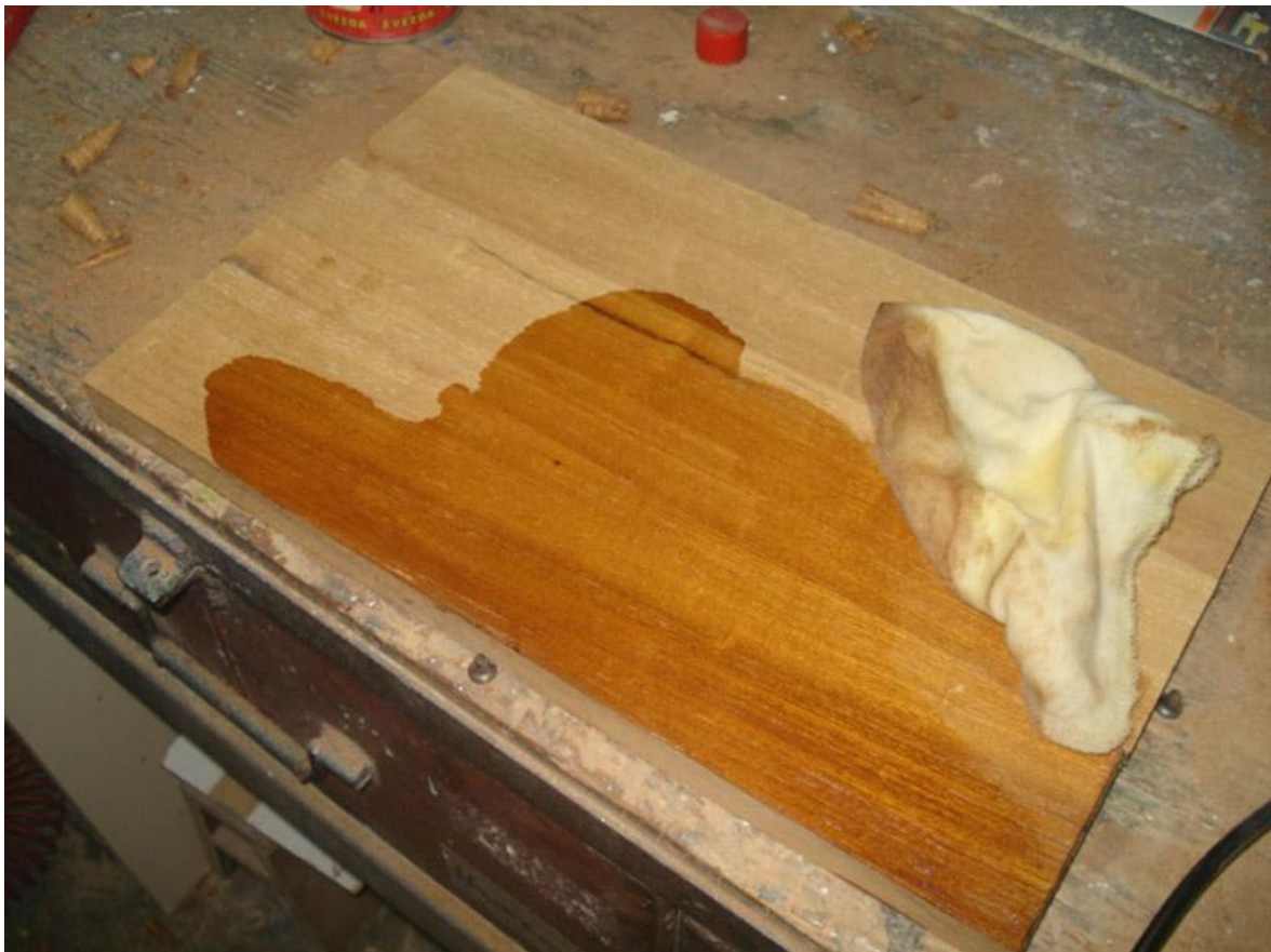
Slika 1. Površina drva premazana lanenim uljem u usporedbi sa neobrađenom površinom ( http://majstorisanje.me/skanj-hoklica-samlica/ )

Prednosti šland ulja su da manje žute, daju veći sjaj, imaju bolju sposobnost razlijevanja, elastičnost i otpornost prema vremenskim utjecajima. Šland ulja se suše sporije i vežu manje kisika od sirovih ulja. Sirovo ulje može vezati od 10-12 % (w/w) kisika, dok toplinom obrađena ulja vežu 3 % kisika. Osim toga, prednost šland ulja je manja promjena volumena tijekom sušenja, što je razlog slabijem nabiranju uljenog filma. Zbog manjeg sadržaja linolenske kiseline šland ulja su manje sklona žućenju (Pavela-Vrančić, Matijević, 2009). Za brži proces sušenja lanenog ulja dodaju mu se sikativi koji su spojevi metala (kobalt, managan, olovo). Laneno ulje je komercijalno dostupno kao sirovo (osuši se za oko 140 sati), kuhano, polimerizirano, izbijeljeno ili s dodanim sikativima.