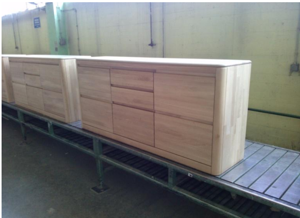
Slika 19. Proizvod 2 - komoda od hrastovine površinski obrađena uljima