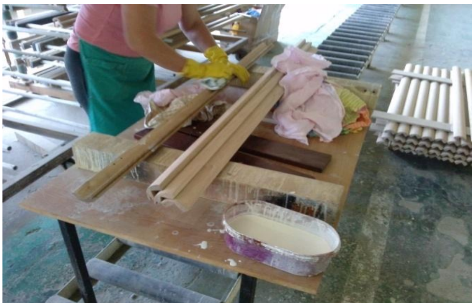
Slika 12. Ručni nanos ulja