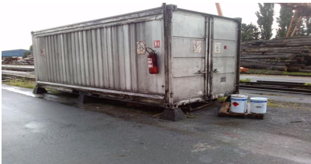
Slika 9. Spremište ulja i lakova

Ulja skladište u posebnom zatamnjenom kontejneru koji štiti od utjecaja atmosferilija. Temperatura tog prostora mora biti od +5 °C do +25 °C.