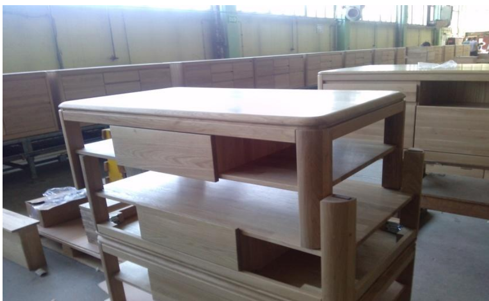
Slika 18. Proizvod 1 - masivni stolić od hrastovine površinski obrađen uljima

Nakon toga elementi su spremni za montažu i sastavljanje u gotov proizvod. Na sljedećim slikama su prikazani gotovi proizvodi koji su površinski obrađeni uljima.