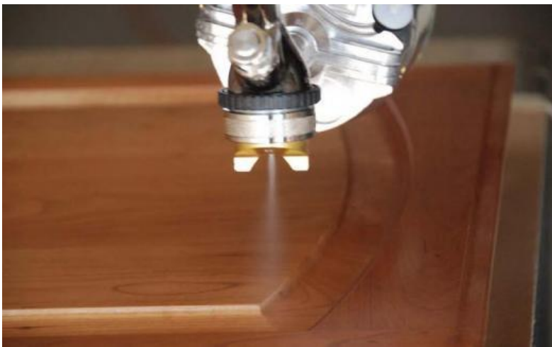
Slika 6. Nanošenje ulja HVLP štrcanjem ( https://www.canadianwoodworking.com )

Pri štrcanju se koriste pištolji s niskim tlakom (HVLP) koji imaju grubo raspršivanje, ne stvaraju maglu i zbog toga su dobri za nanošenje ulja. Nanošenje štrcanjem ima svoje prednosti kao što su jednakomjerno nanošenje po površini, manje dodatnog rada, dobro iskorištavanje materijala i kratko vrijeme obrade.