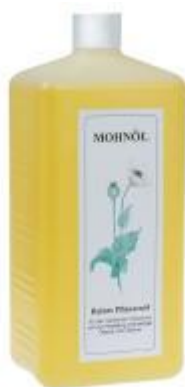
Slika 3. Makovo ulje

Dobiva se hladnim prešanjem sjemenki bijelog maka ( Papaver somniferum ). Svjetlije je boje, a izbijeljeno postaje prozirno kao voda. S obzirom na to da ne sadrži linolensku kiselinu suši sporije od lanenog i orahovog ulja (oko 15 dana). Dobro štiti površine od vlažnosti i nečistoća, ne žuti, dobro prodire u drvo. Pri višestrukom nanošenju daje površine svilenkastog sjaja i ugodne na dodir. Ova vrsta ulja najmanje žuti pa se koristi kao vezivo za tvorničke bijele pigmente i za pigmente koji bi se zbog kemijskog sastava brzo sušili (Šoljić, 2014).