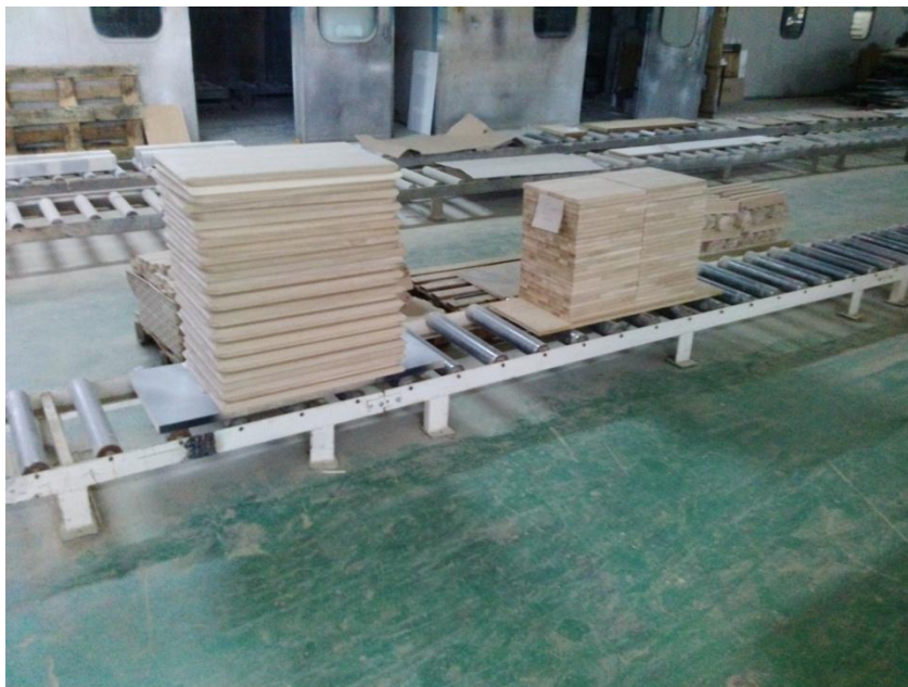
Slika 17. Transport obrađenih elemenata

Nakon toga elementi su spremni za montažu i sastavljanje u gotov proizvod. Na sljedećim slikama su prikazani gotovi proizvodi koji su površinski obrađeni uljima.