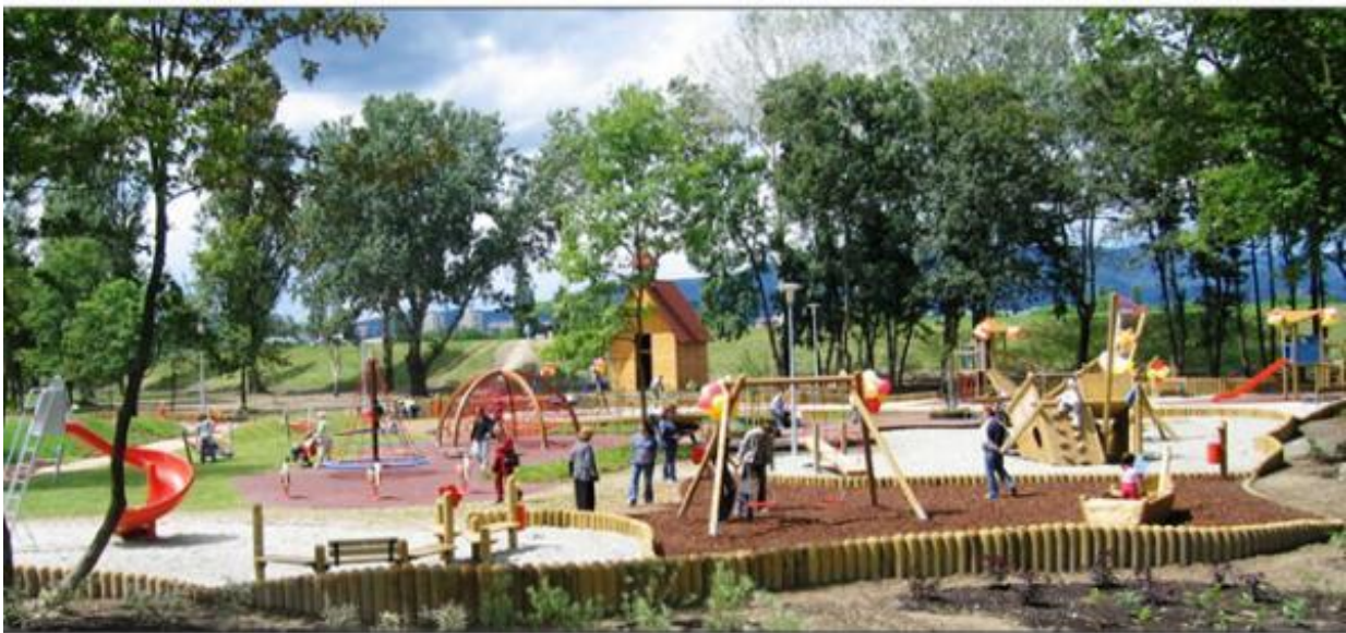
Slika 12. Dječje igralište u sklopu parka Bundek.

Kombinacijom različitih materijala, boja i oblika park ostavlja snažan estetski dojam.