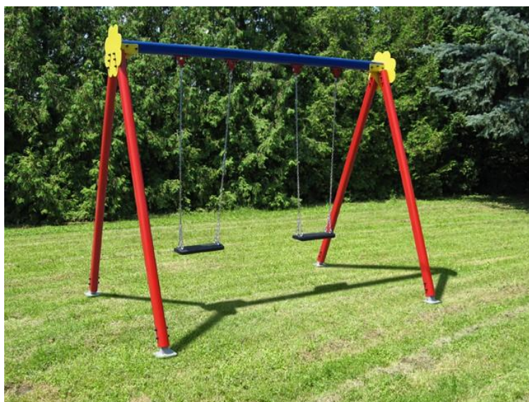
Slika 5. Primjer ljujačke u dječjem parku.