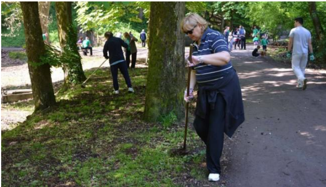
Slika 21. Sve se može kad se hoće - zajedničke snage raznih Udruga grada Siska

Najznačajniji projekt im je „Zona odmora i rekreacije u perivoju Viktorovac“. Cijeneci veliki i neiskorišteni potencijal perivoja Viktorovac, poznate Šumice, cilj Građanske inicijative je trajna skrb o Šumici kao zoni odmora i rekreacije, na temelju organiziranog volonterskog rada građana uz profesionalno angažiranje javnih i komunalnih poduzeća grada.