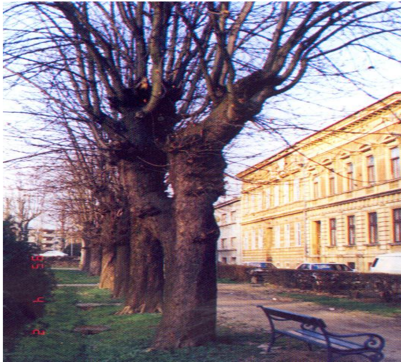
Slika 3. Šetalište danas