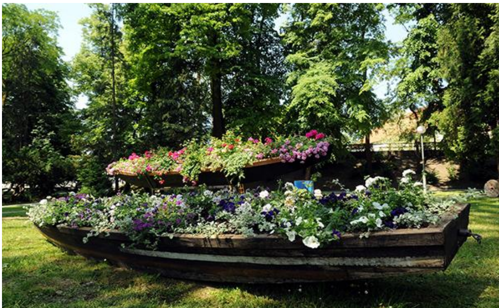
Slika 5. Detalj sa Sajma cvijeća

Danas se park bitno ne razlikuje od izvornog. Svake godine u svibnju, u parku se održava Sajam cvijeća.