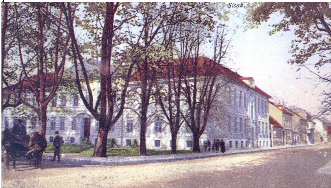
Slika 7. Trg s početka 20.stoljeća