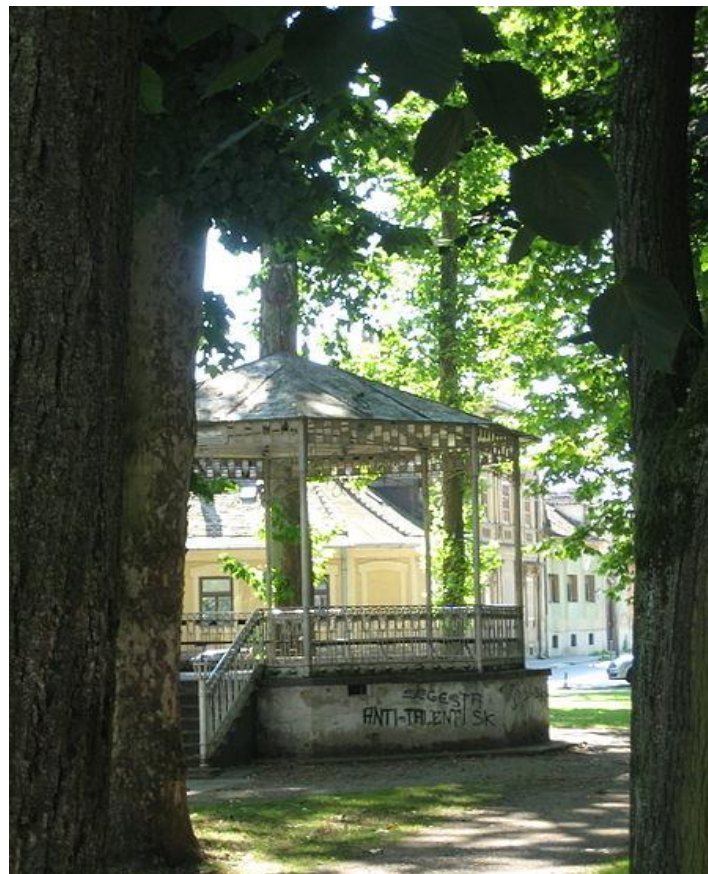
Slika 4. Muzički paviljon izgrađen 1925.godine