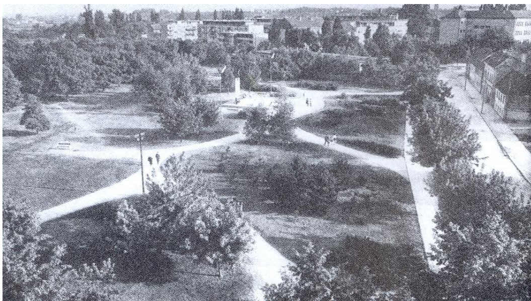
Slika 13. Park 60-tih godina prošlog stoljeća

Prvobitno Trg narodnog ustanka, a od 2001. godine Park dr. Franje Tuđmana, zauzima površinu od 14.937 m 2 , a smjestio se između ulica F. Lovrića, I.K. Sakcinskog, gradske tržnice Kontrola, Doma umirovljenika i gradskog bazena. Nastao je 50- tih godina 20. stoljeća na vrlo frekventnoj lokaciji. Neadekvatnim održavanjem park je zapušten, ali se 1999. godine pristupilo njegovu preuređenju i obnovi.