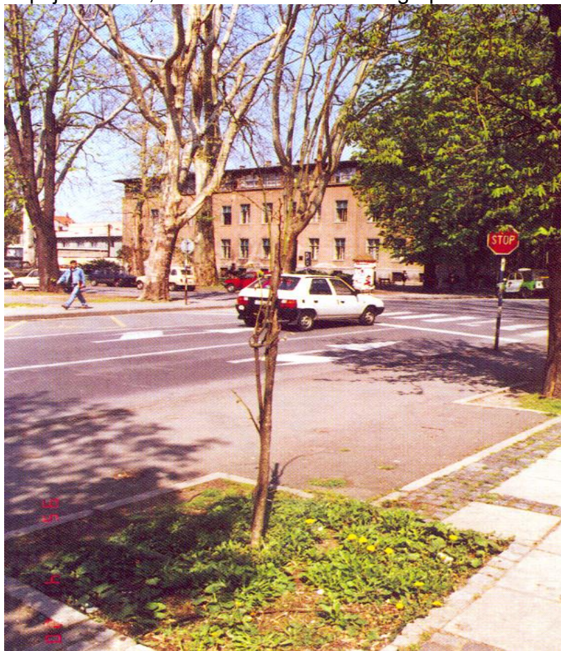
Slika 8. Obnova drvoreda na trgu

Parkovni potencijal trga danas je predstavljen drvoredom stogodišnjih platana, obezvrijeđenih neadekvatnom brigom i održavanjem. Osim drvoreda lipa, ostatak drveća je sađen pojedinačno, kao soliterna stabla ili u grupama.