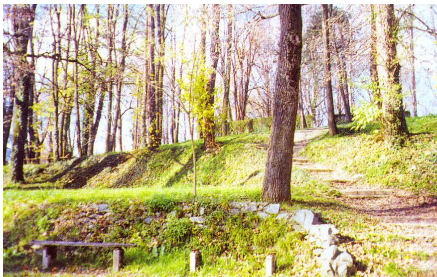
Slika 19. Zona odmora i rekreacije