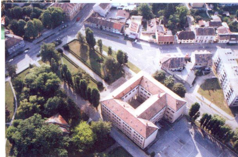
Slika 15. Dio parka snimljen iz zraka

Park na Trgu hrvatskih branitelja se proteže na površini 16.909 m 2 na prostoru krajem 19. stoljeća nasute Špeljakove grabe. Okružen je zgradom katastra, gimnazije, Doma zdravlja i stambenim zgradama.