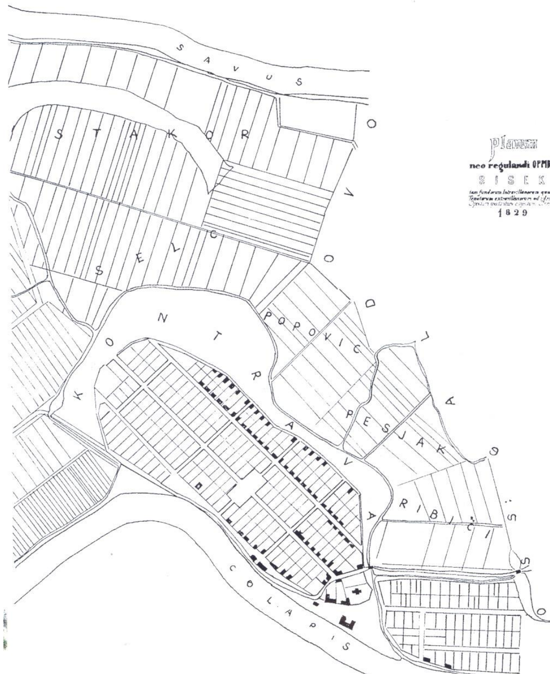
Slika 20. Urbanistički plan grada Siska iz 1829.godine

Osim nužnosti ozelenjavanja grada radi zaštite zdravlja stanovništva od štetnog utjecaja industrijskog razvoja u novijoj povijesti Siska, za Sisak je važno je istaknuti da je sistematska izgradnja gradskog urbanog prostora grada počela još u 19. stoljeću. Izgled grada pratio je brzi gospodarski razvoj. Tridesetih godina 20. stoljeća u gradu djeluje društvo za poljepšavanje grada Siska, skrbi o zelenim parkovnim