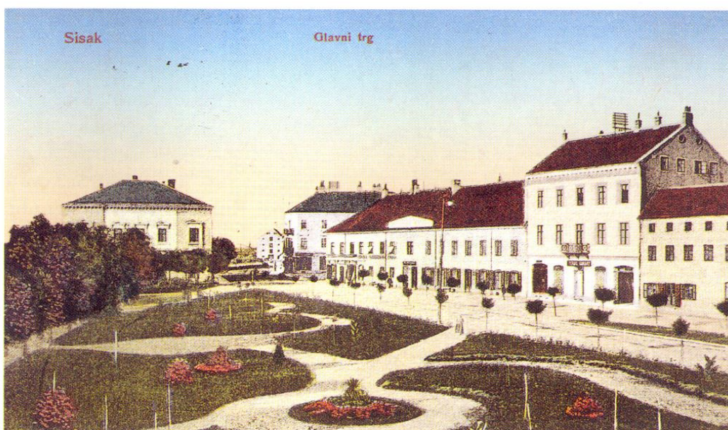
Slika 9. Trg početkom 20.stoljeća

Unatoč tome što je u navedenim građevinama bilo okupljalište Iliraca, što je u dvorani Velikog Kaptola 1839. godine prvi put izvedena kazališna predstava na štokavskom narječju, plansko uređenje trga počinje 1906. godine. Zaslugom inženjera Lavoslava Hanzlovskog Siščani su dobili uređeni zeleni prostor – mali park na trgu. Uz obalu Kupe zasađen je i troredni drvored divljeg kestena, a parkom su dominirala 3 rondela. Na glavnom je rijetkost i atrakcija bilo stablo japanske banane. Na centralnom rondelu je 1916. godine podignut spomenik hrvatskom domobranu.