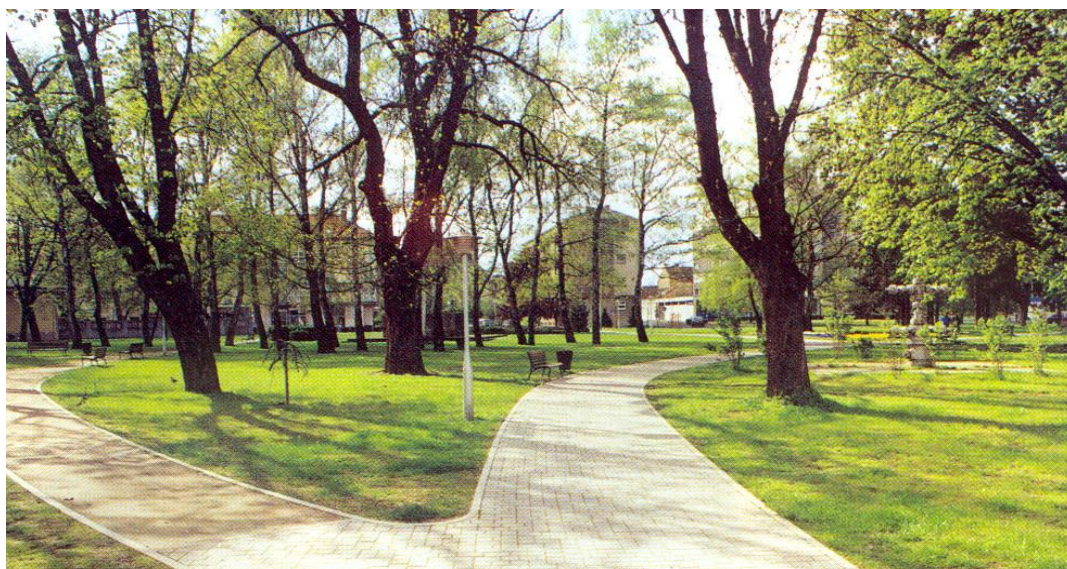
Slika 14. Park danas

Park je upotpunjen popločenim stazama, raznolikim vrstama visokog i niskog zelenila (drvoredi, skupine stabala, soliteri, grmovi, cvjetne lijehe) i parkovnom opremom (klupe, košarice za otpad, rasvjeta).