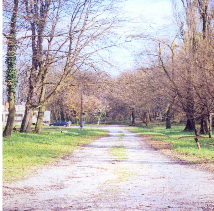
Slika 18. Asfalt u perivoju

Naime, popularna Šumica kroz zadnjih je nekoliko godina ostala bez dijela stabala, a u nju sve više zadire i širenje Gradskih groblja Viktorovac. Također, na samom ulazu iz Strossmayerove ulice, u park - šumi gradska je vlast prije više godina asfaltirala veliku zelenu površinu, s ciljem stvaranja skate parka u Sisku, koji međutim nikada nije služio predviđenoj namjeni.