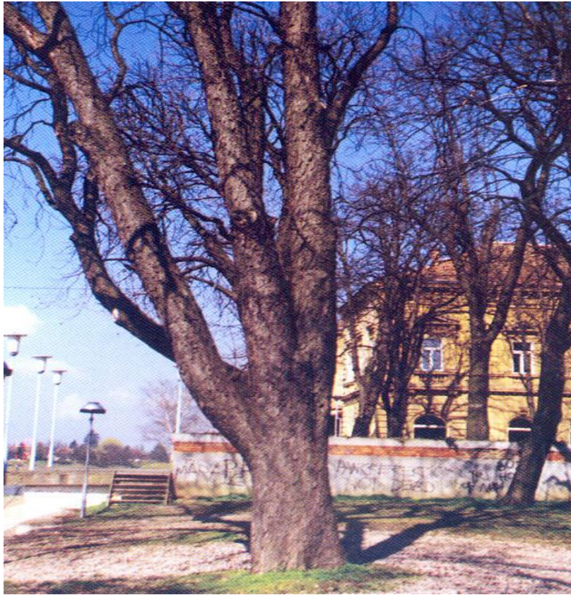
Slika 12. Stablo divljeg kestena iz drvoreda na sisačkoj šetnici