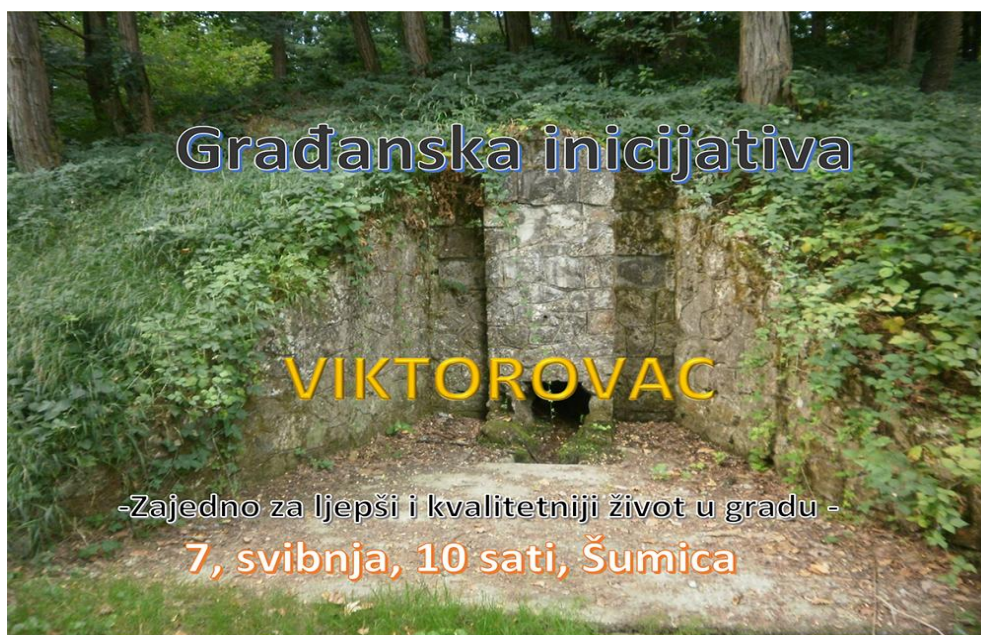
Slika 17. Schroederov izvor pitke vode na plakatu za uređenje "Šumice"

Vrijednost perivoja leži i u zadnjim sisačkim vinogradima. Stoga bi to područje trebalo revitalizirati objedinjavanjem povijesnog, kulturnog i krajobrazno-biološkog aspekta.