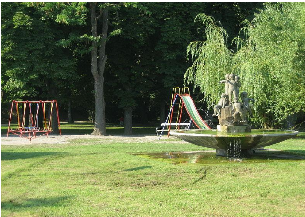
Slika 6. Fontana u parku