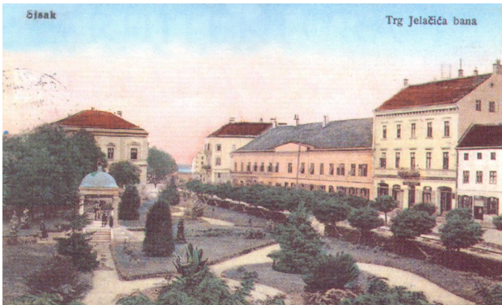
Slika 10. Trg dvadesetih godina 20.stoljeća

Od prvobitne vegetacije još postoje stabla platane, tise i američkog javora.