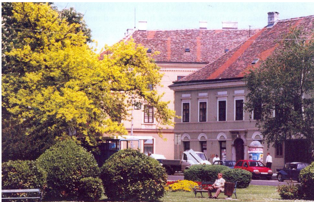
Slika 11. Trg danas

Od prvobitne vegetacije još postoje stabla platane, tise i američkog javora.