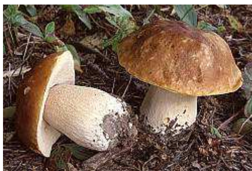
Slika 1. Vrganj u prirodi

Gljive se koriste najvećim dijelom kao hrana.