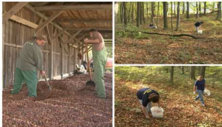
Slika 13. Sakupljanje i sušenje žira

se ide u sjetvu i sadnju. Samo na takav način Hrvatske šume moći će zadržati kvalitetu i ljepotu za buduće naraštaje.