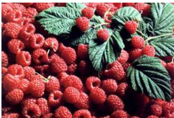
Slika 11. Malina

Malina sadrži mnogo različitih minerala i vitamina A i C. Ima značajno mjesto u prehrani, a također liječi i pomaže kod niza bolesti koje su povezane s temperaturom u tijelu. Otklanja upale, osobito usne šupljine i grkljana, sprečava pobačaj, olakšava trudnoću i porođaj, olakšava tešku menstruaciju, zaustavlja proljev, liječi crijevne upale i dizenteriju, smiruje živčanu napetost, liječi kožne bolesti, jača cijeli organizam, a osobito srce. Izvanredna je dijetalna prehrana bolesnika koji boluju od šećerne bolesti te od reumatskih, bubrežnih i želučanih tegoba. Svježi plodovi posebno su preporučljiva dijetalna hrana kod šećerne bolesti kao i kod reumatskih, bubrežnih i želučanih oboljenja.