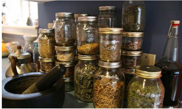
Slika 6. Osušeno ljekovito bilje