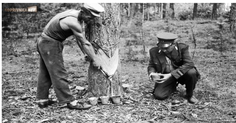
Slika 14. Smolarenje

Smolarenje je djelatnost koja se pojavila početkom 20 stoljeća, a danas rijetko da je u upotrebi. Postupak se je izvodio na način da se prvo se na stablu guljačem, specijalnom alatom oštrom kao nož, gulila stara kora. Zatim se je neobičnom, krivom smolarskom sjekirom popreko zasjecao ostatak kore do samog smolastog stabla. Na taj prorez bi se stavio savijeni lim, a ispod njega bi se pričvrstila posuda za sakupljanje smole. Smola bi iz rane bora izlazila za vrijeme ljetnih dana, i punila posudu smolom. Nakon što bi se posuda napunila smolom, sakupljači smole bi pokupili svu smolu i odvezi na daljnju preradu. Stabla koja su bila ozljeđena prilikom postupka smolarenja, špricala su se sumpornom kiselinom da bi se izazvao brži izlazak smole. Smolarenjem na ovakav način stabla su bila trajno oštećena, pa se iz tog razloga danas smola industrijski proizvodi.