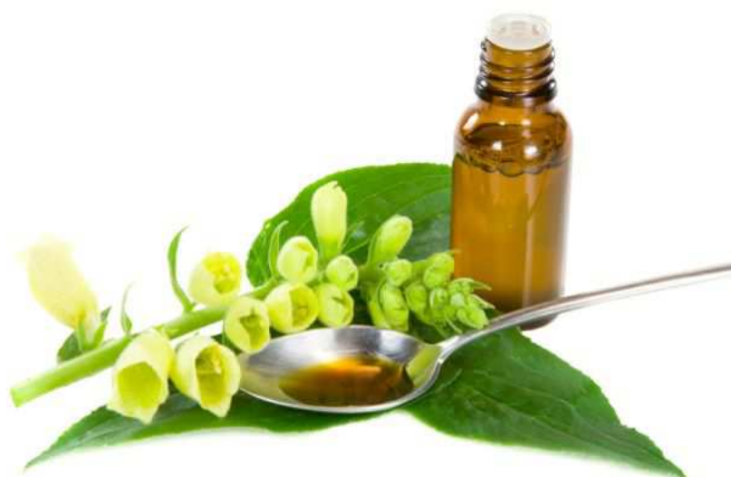
Slika 4. Sirup od ljekovitog bilja

Teško je postaviti granicu što je ljekovito bilje, a što nije. Prema nekim teorijama, sve biljke mogu biti ljekovite, samo je pitanje pristupa i korištenja. Biljke mogu pomoći i u nekim medicinskim tegobama, ali u svakodnevnom životu, kada je u pitanju stres, upale i slično. Ono što je važno za naglasiti, ovdje se ne zagovara isključiva upotreba biljaka, umjesto lijekova propisanih od strane doktora, ali je činjenica da se pravilnim korištenjem biljaka može pomoći vlastitom organizmu kroz neko vrijeme. Ljekovito bilje pokazalo se učinkovitim u liječenju i ublažavanju mnogih bolesti i stanja, poput astme, alergije, karcinoma, ekcema, hormonalnih poremećaja, migrene, artritisa, kroničnog umora, probavnih smetnji, depresije, tjeskobe, nesanic. Ljekovito bilje se koristi i kao sastojak u proizvodnji sintetičkih lijekova, zatim kao osnovna sirovina raznih kozmetičkih krema, mirisa, kolonjske vode, toaletnih sapuna, zubnih pasta i drugog, a u prehrambenoj industriji kao začini u mesnim prerađevinama, gotovim jelima i pićima.