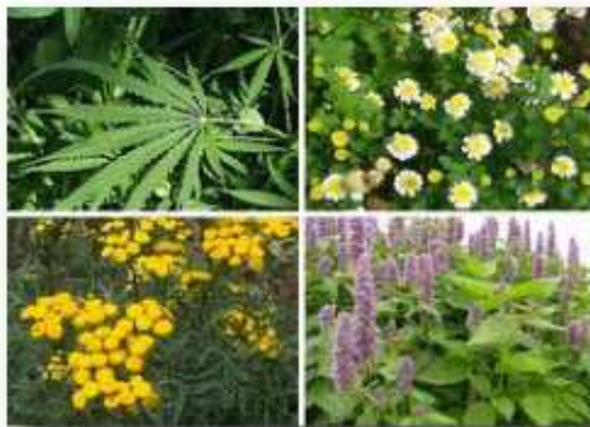
Slika 5. Ljekovito bilje

Ljekovito bilje našeg podneblja je: kopriva, kamilica, timijan, vrkuta, metvica, bazga, neven, sikavica, lavanda, korijander, konoplja, kadulja, pelin, bijela imela, bosiljak, ružmarin, trava iva, matičnjak, boražina, tratinčica, valerijana, breza, glog, origano, sladić, medvjedi luk, maslačak, tratinčica, gavez, trputac itd.