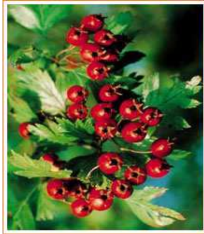
Slika 8. Glog

Lješnjak je biljka koja raste blizu tla, kao mala drvca ili grmlje. Plodove je najbolje skupljati dok su svježi, a ne one s poda, jer često sagnjile, i nisu dobri za jelo. Koriste ih tvornice slatkiša kao dodatak čokoladama.