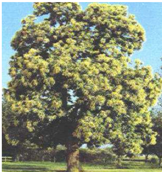
Slika 10. Stablo kestena

Malina sadrži mnogo različitih minerala i vitamina A i C. Ima značajno mjesto u prehrani, a također liječi i pomaže kod niza bolesti koje su povezane s temperaturom u tijelu. Otklanja upale, osobito usne šupljine i grkljana, sprečava pobačaj, olakšava trudnoću i porođaj, olakšava tešku menstruaciju, zaustavlja proljev, liječi crijevne upale i dizenteriju, smiruje živčanu napetost, liječi kožne bolesti, jača cijeli organizam, a osobito srce. Izvanredna je dijetalna prehrana bolesnika koji boluju od šećerne bolesti te od reumatskih, bubrežnih i želučanih tegoba. Svježi plodovi posebno su preporučljiva dijetalna hrana kod šećerne bolesti kao i kod reumatskih, bubrežnih i želučanih oboljenja.