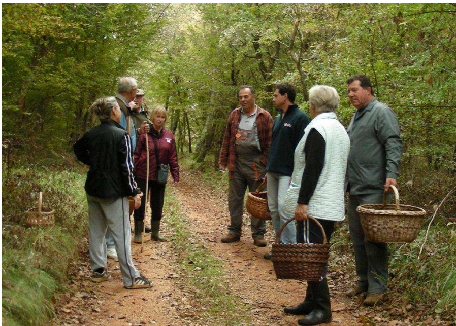
Slika 17. Prikaz pregledavanja ubranih sporednih šumskih proizvoda od strane nadležne osobe

Ranijih godina odlazak u šumu radi sakupljanja sporednih šumskih proizvoda bio je slabiji dok u novije vrijeme to je postala masovna pojava. Bere se sve ne vodeći pri tome računa o zaštiti prirode. Posljednjih godina u šumu su počeli dolaziti i strani državljani koji u svojim matičnim državama ili nemaju bogat biljni svijet ili nemaju dozvolu za ulazak u šumu.