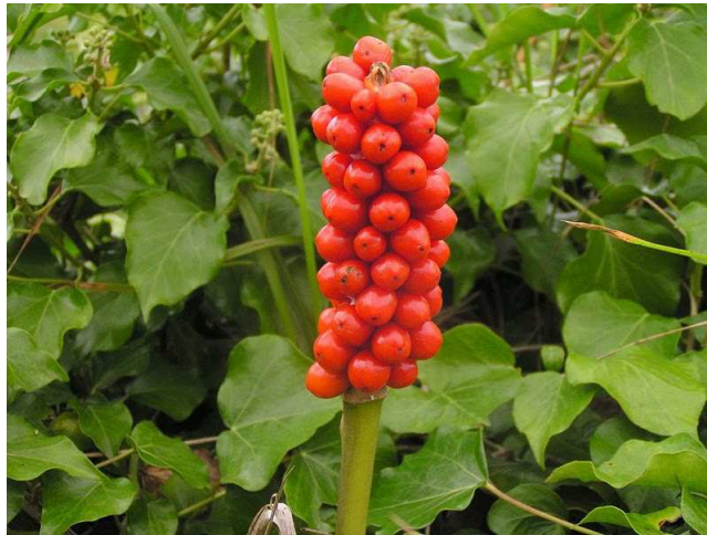
Slika 12. Kozlac

povišene temperature toksične tvari razaraju (npr. crna bazga, jarebika, šibikovina). Postoje i jestivi sočni plodovi, kao npr. šumske jagode, koje mogu izazvati alergične reakcije kod posebno osjetljivih osoba. Štetne reakcije otrovnih plodova također ovise i o količini pojedinih plodova. Trovanja su najčešća kod djece, uglavnom zbog privlačnih žarkocrvenih ili crnih boja plodova. Zbog toga je potrebno djecu informirati o opasnostima koje im prijete ako jedu nepoznato bilje. Malo kada dolazi do trovanja odraslih osoba.