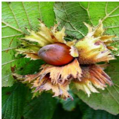
Slika 9. Lješnjak

Lješnjak je biljka koja raste blizu tla, kao mala drvca ili grmlje. Plodove je najbolje skupljati dok su svježi, a ne one s poda, jer često sagnjile, i nisu dobri za jelo. Koriste ih tvornice slatkiša kao dodatak čokoladama.