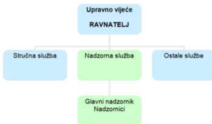
Slika 16. Hijerarhija nadzorne službe u Ministarstvu zaštite prirode i okoliša

Kontrole i nadzora odnosi se samo na državne šume. A ono što mnogi berači ne znaju, je kako razlikovati državnu od privatne šume. Većina berača ne zna gdje se nalazi. Najlakše je razlikovati po tome što državna šuma ima oznake odjela na stablima, a privatna to nema.