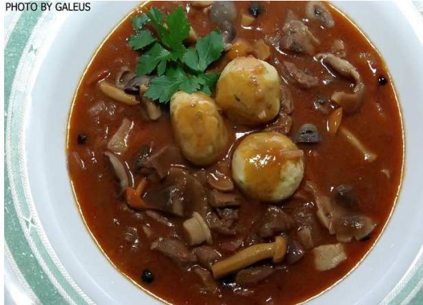
Slika 21. Specijalitet od gljiva