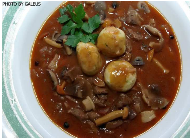
Slika 21. Specijalitet od gljiva