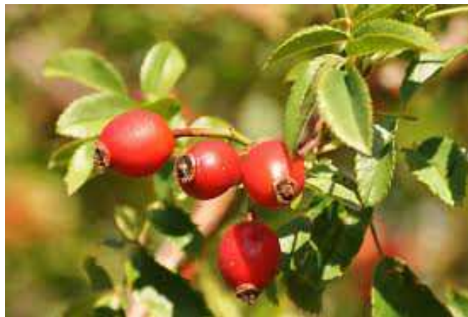
Slika 7. Šipak

Šipak je plod divlje ruže koji je narančasto-crveni kad sazrije i jednostavno se uoči u ružinu grmlju. Ovaj je plod jedan od najboljih izvora C vitamina. Nakon što se osuši, odličan je za pripremanje čaja, a možete ga naći u brojnim voćnim mješavinama čaja u dućanima.. Plodovi gloga se beru bez peteljke, suše se u hladu da upola uvenu, a iza toga se dosuše u toploj peći.