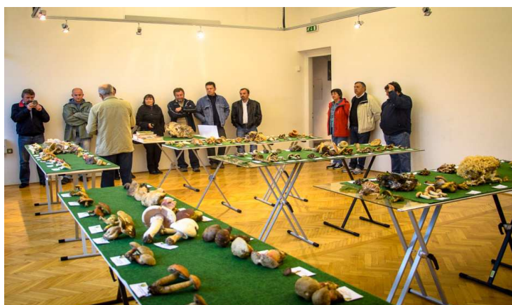
Slika 20. Prepoznavanje gljiva

Zalaže se za redovito okupljanje, druženje, održavanje predavanja, priređivanje izložbi gljiva, odlasci u prirodu radi proučavanja gljiva, kako bi se probudila svijest o sporednim šumskim proizvodima a ne samo o gljivama. Društva se zalažu da se napravi red u šumi, kako bi se suzbilo nekontrolirano iznošenje ovoga vrijednog proizvoda iz šume.