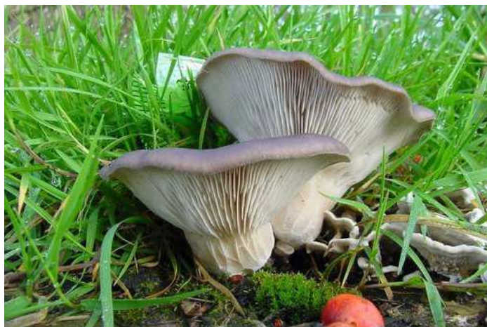
Slika 2. Bukovača u prirodi

U medicinskom časopisu International Journal of Oncology , objavljeno je da ove gljive, odnosno njihov alkoholni ekstrakt potiče barem dva molekularna mehanizma koji ometaju rast raka debelog crijeva i rak dojke bez da znatno utječu na normalne stanice tkiva.