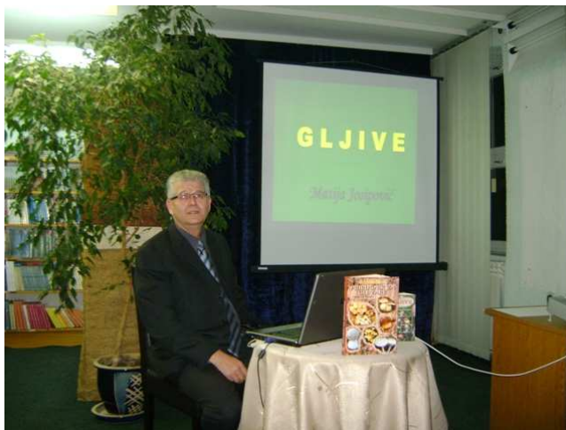
Slika 19. Edukacija o gljivama

Postoji veliki broj gljivarskih udruga, ljubitelja gljiva. Cilj društva je edukacija građana i članova društva o gljivama, razvijanje ekološke svijesti, njegovanje i usavršavanje prehrane, stručno-znanstveno osposobljavanje. Jedno od takvih društava je i Boletus.