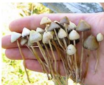
Slika 3. Čarobna gljiva

U pojedinim europskim državama, posjedovanje i osobna konzumacija psilocibinskih gljiva je legalno, dok se drugdje, pa i u Hrvatskoj, tretiraju kao kazneno djelo. Nikad se ne jedu sirove već ih je uvijek potrebno termički obraditi. One sadrže veće količine hemolitičkog proteina koji može biti otrovan, osim ako gljive nisu termički obrađene na temperaturi višoj od 60° Celzijeva.