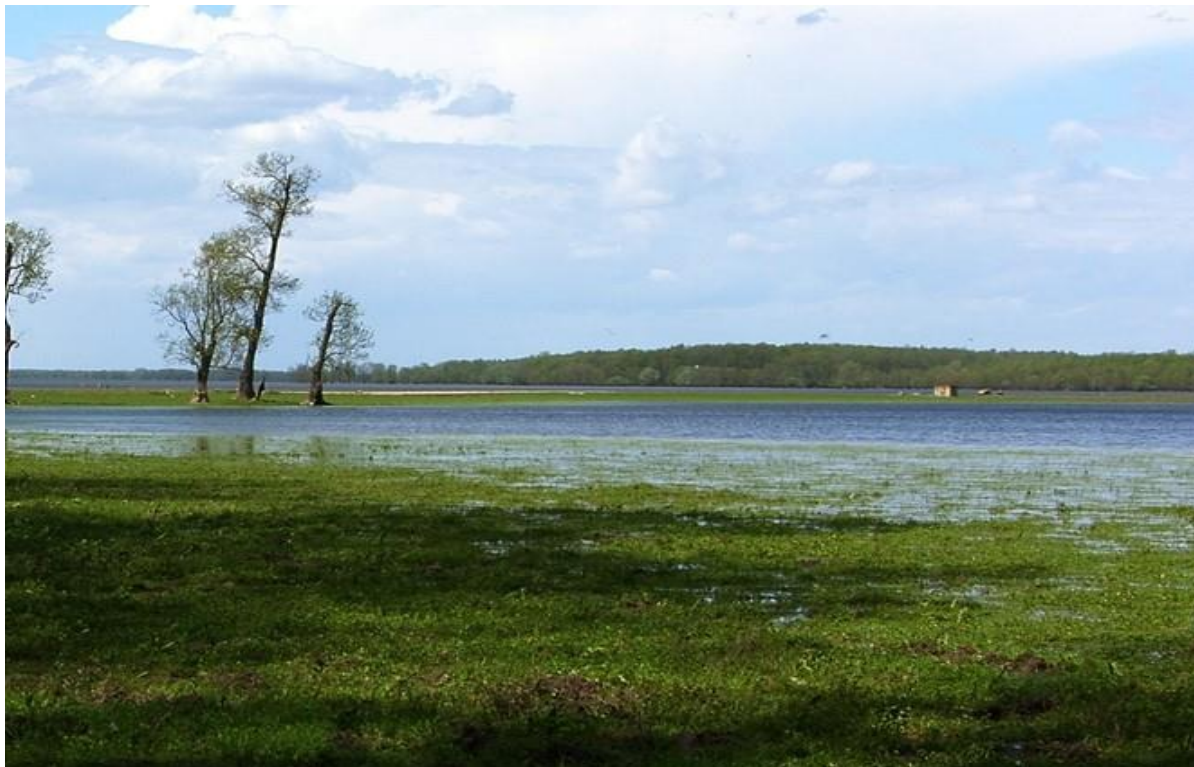
Slika 6. Močvarni krajobraz Lonjskog polja

Uzroci ugroženosti šumskih staništa su: promjena vodnih režima, hidromelioracija, širenje invazivnih biljnih vrsta ( Amorpha fruticosa L.), nekontrolirana ispaša i žirenje svinja (šuma hrasta lužnjaka).