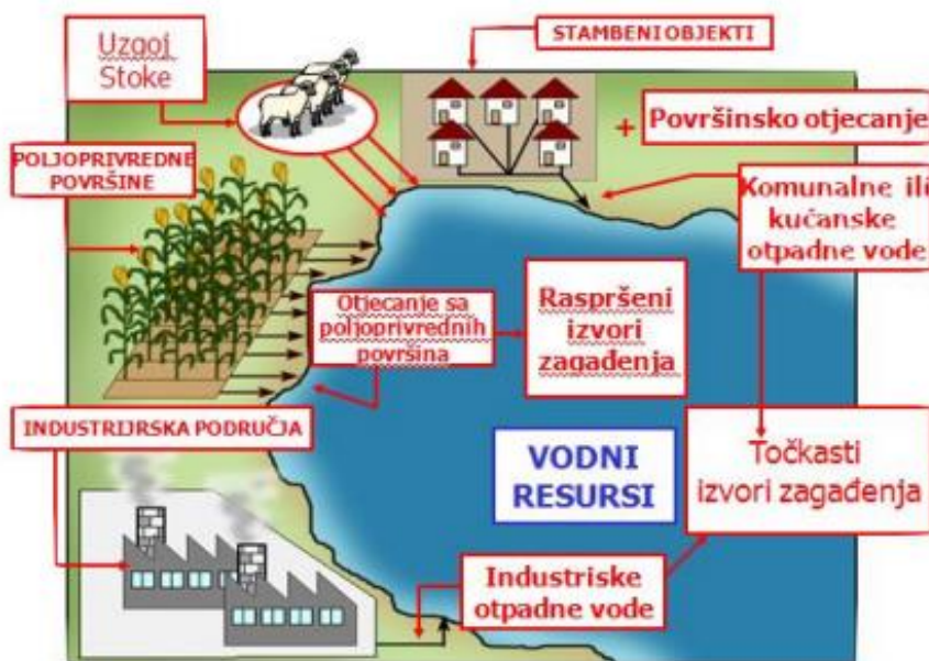
Slika 2. Izvori onečišćenja voda

prostoru, ubrajaju se naftovodi, cjevovodi i plinovodi kojima se transportiraju opasne tvari i energenti, spremišta opasnih tvari i izvori termalnog onečišćenja.