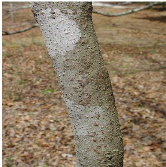
Slika 14. Kora.

Razvija plitki korijenov sustav s žilom srčanicom od koje se grana gusto postrano korijenje. Pupovi su nasuprotni, jajasto stožasti, zaobljenog ili tupog vrha s puno ljusaka i stoje na okruglastim, smeđim, golim i sjajnim, s lenticelama posutim izbojcima. Ljuske pupova su smeđe do zelenkasto smeđe i nisu ljepljive. Terminalni pup je višestruko veći od postranih pupova. Listovi su nasuprotni, dlanasto sastavljeni s 5-7 liski veličine 7-10 cm i blago nazubljenog ruba i ušiljenih vrhova. Boja listova je tamnozeleno, osim u jesen kada poprime žutu boju prije nego otpadnu.