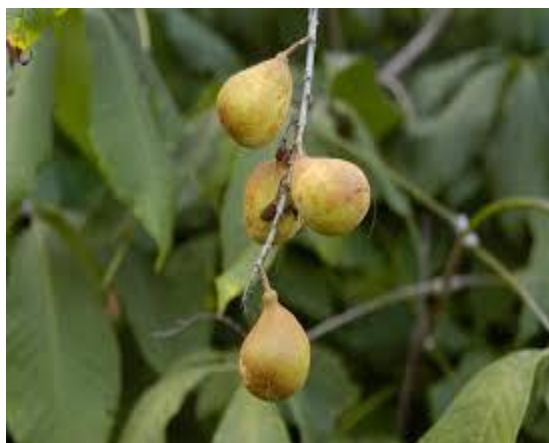
Slika 19. Plodovi.

Grmoliki divlji kesten raste na srednje vlažnim do dosta vlažnim tlima. Teško podnosi sušne terene, pogotovo u mladosti dok mu žila srčanica ne probije dublje u tlo. Sadi se u gradskim parkovima, vrtovima i u okućnicama zbog svojih cvjetova i lijepih žutih listova u jesen.