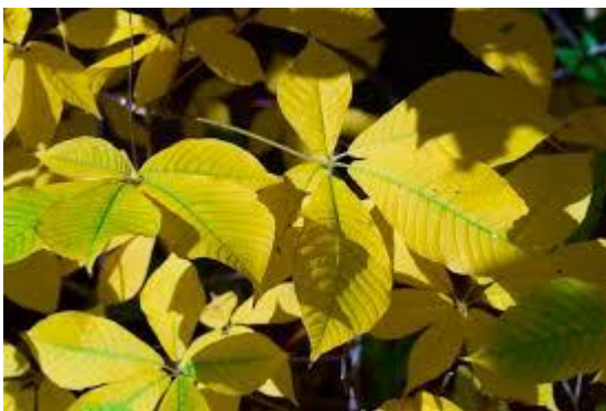
Slika 17. List u jesen.

Cvjetovi su dvospolni, jednospolni muški i jednospolni ženski, entomofilni. Prašnika ima 6. Između latica i prašnika nalaze se nekariji. Puno cvjetova zajedno u vršnim, 20-30 cm dugim, uspravnim i stožastim metlicama. Cvjetovi su žućkastobijele boje. Muški cvjetovi nalaze se u gornjem, dvospolni u srednjem, a ženski u donjem dijelu cvata. Cvijeta u srpnju i kolovozu. Plod je obrnuto jajasti, 2-4 cm dugački tobolac. Egzokarp tobolca je gladak, žućkastosmeđ i bez bodlji. U tobolcu se nalaze 1-3 velike, kuglaste, otrovne sjemenke koje imaju glatku, sjajnu i kestenjastosmeđu sjemenu ljusku. Plodovi dozrijevaju u rujnu kada se tobolci uzdužno otvaraju i raspadaju na tri dijela.