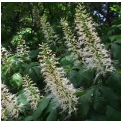
Slika 18. Cvjetovi.

Cvjetovi su dvospolni, jednospolni muški i jednospolni ženski, entomofilni. Prašnika ima 6. Između latica i prašnika nalaze se nekariji. Puno cvjetova zajedno u vršnim, 20-30 cm dugim, uspravnim i stožastim metlicama. Cvjetovi su žućkastobijele boje. Muški cvjetovi nalaze se u gornjem, dvospolni u srednjem, a ženski u donjem dijelu cvata. Cvijeta u srpnju i kolovozu. Plod je obrnuto jajasti, 2-4 cm dugački tobolac. Egzokarp tobolca je gladak, žućkastosmeđ i bez bodlji. U tobolcu se nalaze 1-3 velike, kuglaste, otrovne sjemenke koje imaju glatku, sjajnu i kestenjastosmeđu sjemenu ljusku. Plodovi dozrijevaju u rujnu kada se tobolci uzdužno otvaraju i raspadaju na tri dijela.