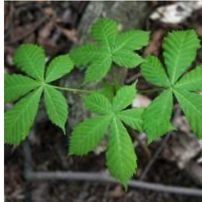
Slika 4. Listovi.

Cvjetovi su veliki i uspravni, sakupljeni u 20 do 30 cm duge piramidalne grozdove, bijele su boje s izraženim žutim i rozim mrljama. Pored dvospolnih, na istoj se biljci redovito nalaze i jednospolni cvjetovi. Muški cvjetovi nalaze se u gornjem, dvospolni u srednjem, a ženski u donjem dijelu cvata. Prašnika ima 7, a između prašnika i latica nalaze se nektariji. Cvjetanje je u travnju i svibnju, za vrijeme ili neposredno nakon listanja. Plod je kuglasti tobolac veličine 5 do 6 cm. Tobolac s vanjske strane ima mekane bodlje i dlake, a u njemu se nalaze 1 do 3 kuglaste sjemenke promjera do 3 cm koje imaju glatku, sjajnu, crvenkastosmeđu sjemenu ljusku. Tobolac nakon dozrijevanja puca na 3 dijela. Plodovi dozrijevaju u rujnu i listopadu.