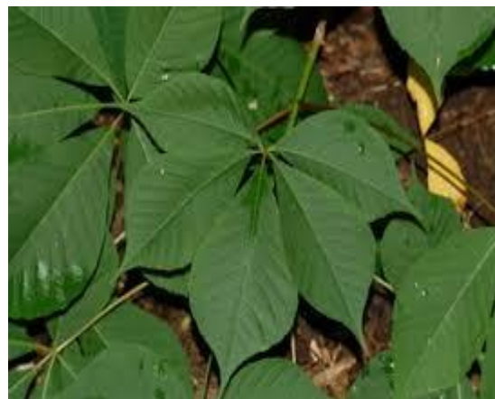
Slika 16. List.