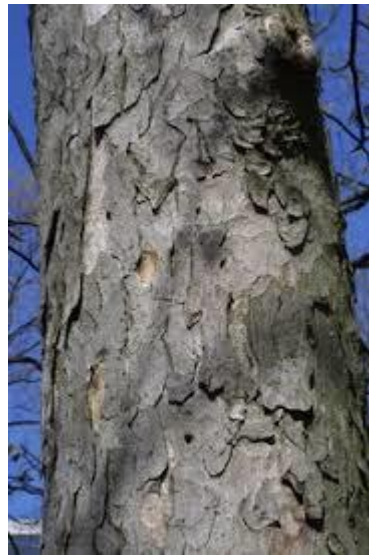
Slika 8. Kora.

Razvija korijenov sustav s žilom srčanicom, a u starosti se iz glavne žile razvija gusto postrano korijenje. Pupovi stoje nasuprotno na izbojku, jajasti su, ušiljenog vrha i pokriveni većim brojem ljusaka. Ljuske pupova su gole, sjajne, narančastosmeđe i nisu ljepljive. Postrani pupovi su sitni i malo otklonjeni od izbojka. Terminalni pup je višestruko veći od postranih pupova. Listovi su nasuprotni, dlanasto sastavljeni s 5 liski dugih 10-15 cm. Rubovi liski su nazubljeni i ušinjenog vrha. List koji stoji na peteljci je dugačak 25-35 cm. Boja listova je zelena do tamnozeleno, osim u jesen kada znaju poprimiti nijanse žuto-narančaste boje prije nego otpadnu.