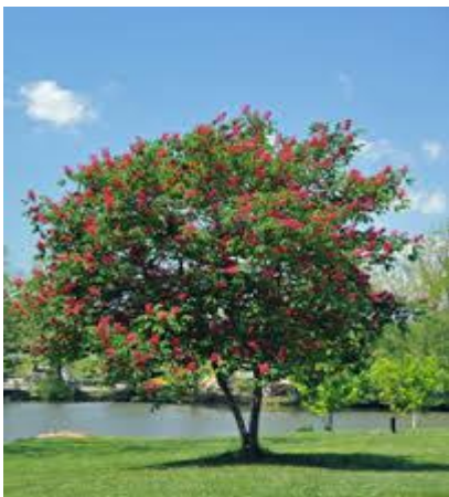
Slika 20. Habitus.

Crveni divlji kesten je grm ili niže stablo do 8 m visine. Može biti grm ili stablo za orezivanje raznih oblika. Kora mu je sive boje, tanka i ljuskasto raspucala.