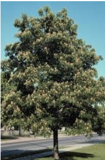
Slika 7. Habitus.

Raste kao stablo visine do 20 m, široke i kuglaste krošnje. Kora mu je smeđe do sive boje i ljušti se u tankim ljuskama različitog oblika i veličine.