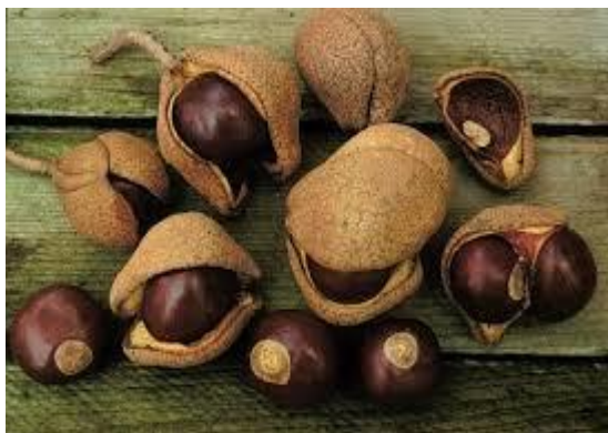
Slika 12. Plodovi.

Žuti divlji kesten je vrsta koja raste pretežito na mezofilnim tlima, ali se može prilagoditi i na sušne uvjete. Ne preporuča se sadnja uz ulice ili uz šetnice zbog težine svojih plodova i velikih listova koje u jesen padnu na tlo i potrebno ih je dugo sakupljati. Najpogodniji je kao osamljeno drvo u parkovima ili vrtovima gdje će imati dosta svjetla, iako se može prilagoditi i na djelomičnu zasjenu. Plodovi žutog divljeg kestena su za čovjeka otrovni, ali ih životinje mogu jesti.