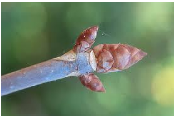
Slika 9. Izbojak.