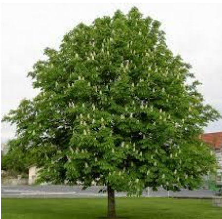
Slika 1. Habitus.

Raste kao stablo visine do 25(30) metara. Krošnja mu je okruglasta, široko razgranjena. Kora je na mladim stablima glatka i sivkastosmeđa, a na starijim stablima crnosiva, oko 1 cm debela, ispucala i ljušti se u malim tankim ljuskama.