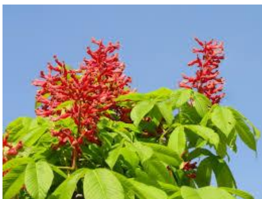
Slika 24. Cvjetovi.

Cvjetovi su dvospolni, jednospolni muški i jednospolni ženski, entomofilni, veličine do 3 cm. Prašnika ima 8, kraći su ili malo duži od postranih latica, pričvršćeni na prstenasti disk koji luči nektar. Puno cvjetova se nalazi zajedno u uspravnim i pustenastim 10-15 cm dugačkim metlicama. Muški cvjetovi nalaze se u gornjem, dvospolni u srednjem i ženski u donjem dijelu cvata. Boja cvjetova je svjetlocrvena do tamnocrvena. Cvjeta u lipnju nakon listanja. Plodovi su jajasti do okruglasto jajasti tobolci smeđe boje 3,5-5 cm veličine. Egzokarp tobolca je gladak, tanak i bez bodlji. Sadrže 1-3 velike otrovne sjemenke, koje imaju glatku, sjajnu i tamnosmeđu sjemenu ljusku. Plodovi dozrijevaju u jesen u rujnu kada se tobolci uzdužno otvaraju i raspadaju na 3 dijela.