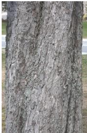
Slika 2. Kora.

Razvija dobro razvijen, plitki korjenov sustav, u mladosti se formira žila srčanica, a kasnije formira mnogo postranih žila. Pupovi su krupni i smolasto ljepljivi, pokriveni velikim i širokim, ušiljenim ljuskama crvenosmeđe boje. Termalni pup je najveći (do 2,5 cm), bočni pupovi su nasuprotni i vrhom jače otklonjeni od izbojka. Listovi su nasuprotni, dlanasto sastavljeni od 5-7(9) liski koji stoje na zajedničkoj peteljci dugoj 15 do 20 cm, liske duguljasto obrnuto jajaste, ušiljenog vrha i dvostruko napiljenog ruba. Liske su s donje strane tamnozeleno, gole i sjajne, a s gornje su svijetlije i uzduž žila smečkasto dlakave, perasto mrežaste nervature s jako izraženom srednjom žilom. Listovi u jesen poprime zlatnožutu boju prije nego otpadnu.