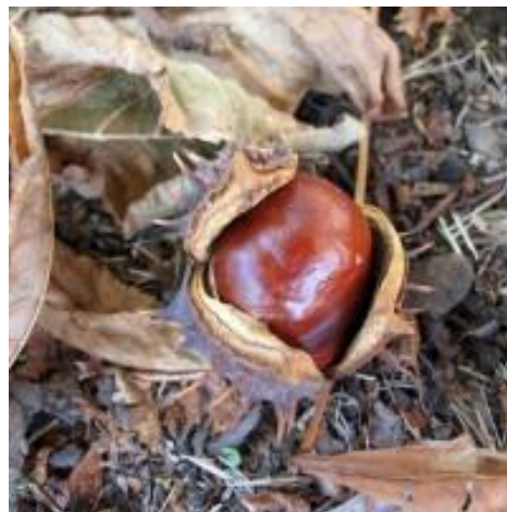
Slika 6. Plod — tobolac sa sjemenkama.