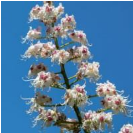
Slika 5. Cvjetovi.

Cvjetovi su veliki i uspravni, sakupljeni u 20 do 30 cm duge piramidalne grozdove, bijele su boje s izraženim žutim i rozim mrljama. Pored dvospolnih, na istoj se biljci redovito nalaze i jednospolni cvjetovi. Muški cvjetovi nalaze se u gornjem, dvospolni u srednjem, a ženski u donjem dijelu cvata. Prašnika ima 7, a između prašnika i latica nalaze se nektariji. Cvjetanje je u travnju i svibnju, za vrijeme ili neposredno nakon listanja. Plod je kuglasti tobolac veličine 5 do 6 cm. Tobolac s vanjske strane ima mekane bodlje i dlake, a u njemu se nalaze 1 do 3 kuglaste sjemenke promjera do 3 cm koje imaju glatku, sjajnu, crvenkastosmeđu sjemenu ljusku. Tobolac nakon dozrijevanja puca na 3 dijela. Plodovi dozrijevaju u rujnu i listopadu.