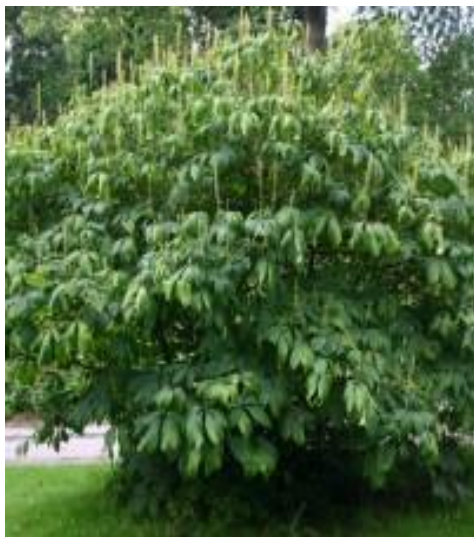
Slika 13. Habitus.

Ova vrsta je grmolikog rasta, doseže visinu do 4 m, a širinu do 10 m. To je gusti, srušeni i po podu rašireni grm. Kora mu je sive boje, plitko raspucala s poprečnim lenticelama.