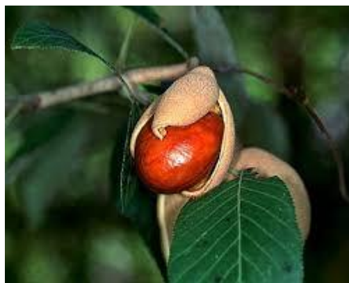
Slika 25. Plod.