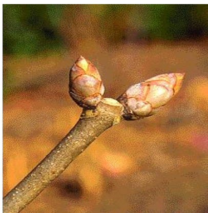
Slika 22. Izbojak.

Razvija plitki korijenov sustav s žilom srčanicom u mladosti, a u starosti se od glavne žile grana gusto postrano korijenje. Pupovi su nasuprotni, jajasti do stožasti i otklonjeni od izbojka. Pupovi pokriveni većim brojem ljusaka koje su gole, sjajne i nisu ljepljive. Ljuske pupova u donjem dijelu svjetlosmeđe, u srednjem sivkastosmeđe, tamnosmeđih i izrezuckanim rubova. Pupovi se nalaze na izbojcima koji su okruglasti, debeli, goli, sjajni, svjetlosmeđi i posuti istobojnim lenticelama. Terminalni pup je višestruko veći od postranih pupova. Listovi su nasuprotni i dlanasto sastavljeni s 5-7 liski veličine 10-13 cm. Liske napiljenog ruba i ušiljenih vrhova. Veličina listova je 15-25 cm. Boja listova je u proljeće i ljeto tamnozeleno, a listovi počinju otpadati već krajem kolovoza. Boja listova prije otpadanja može biti različita, od tamnozelene, preko žućkaste do skroz smeđe boje.