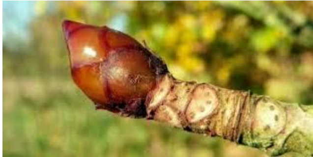
Slika 3. Izbojak.