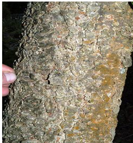
Slika 21. Kora.

Razvija plitki korijenov sustav s žilom srčanicom u mladosti, a u starosti se od glavne žile grana gusto postrano korijenje. Pupovi su nasuprotni, jajasti do stožasti i otklonjeni od izbojka. Pupovi pokriveni većim brojem ljusaka koje su gole, sjajne i nisu ljepljive. Ljuske pupova u donjem dijelu svjetlosmeđe, u srednjem sivkastosmeđe, tamnosmeđih i izrezuckanim rubova. Pupovi se nalaze na izbojcima koji su okruglasti, debeli, goli, sjajni, svjetlosmeđi i posuti istobojnim lenticelama. Terminalni pup je višestruko veći od postranih pupova. Listovi su nasuprotni i dlanasto sastavljeni s 5-7 liski veličine 10-13 cm. Liske napiljenog ruba i ušiljenih vrhova. Veličina listova je 15-25 cm. Boja listova je u proljeće i ljeto tamnozeleno, a listovi počinju otpadati već krajem kolovoza. Boja listova prije otpadanja može biti različita, od tamnozelene, preko žućkaste do skroz smeđe boje.