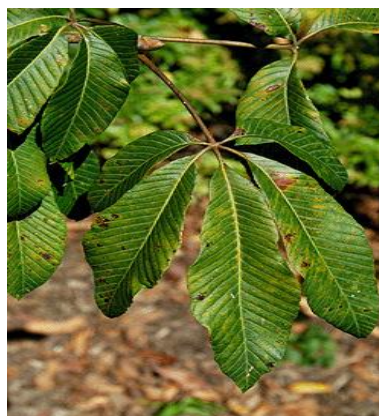
Slika 23. Listovi.