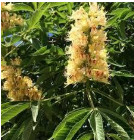
Slika 11. Cvjetovi.

Cvjetovi su dvospolni, jednospolni muški i jednospolni ženski, entomofilni. Prašnika ima 7 koji su dugački 1,5 – 2 cm. Cvjetovi se nalaze u grozdastom cvatu veličine 10-17 cm koji su obojani od žućkastobijele, tamnožute, purpurnocrvene do crvenkastosmeđe boje. Muški cvjetovi nalaze se u gornjem, dvospolni u srednjem, a ženski u donjem dijelu cvata. Cvjeta u svibnju, nakon listanja. Plod je kuglasti ili duguljasti, svjetlosmeđi i glatki tobolac veličine 5-7 cm. Egzokarp tobolca nije bodljikav, a endokarp je kožast. Sadrži jednu do dvije velike kuglaste sjemenke koje imaju glatku, sjajnu i kestenjastosmeđu sjemenu ljusku. Plodovi dozrijevaju u rujnu kada se tobolci uzdužno otvaraju i raspadaju na tri dijela.