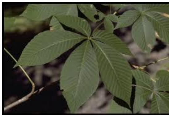
Slika 10. List.

Cvjetovi su dvospolni, jednospolni muški i jednospolni ženski, entomofilni. Prašnika ima 7 koji su dugački 1,5 – 2 cm. Cvjetovi se nalaze u grozdastom cvatu veličine 10-17 cm koji su obojani od žućkastobijele, tamnožute, purpurnocrvene do crvenkastosmeđe boje. Muški cvjetovi nalaze se u gornjem, dvospolni u srednjem, a ženski u donjem dijelu cvata. Cvjeta u svibnju, nakon listanja. Plod je kuglasti ili duguljasti, svjetlosmeđi i glatki tobolac veličine 5-7 cm. Egzokarp tobolca nije bodljikav, a endokarp je kožast. Sadrži jednu do dvije velike kuglaste sjemenke koje imaju glatku, sjajnu i kestenjastosmeđu sjemenu ljusku. Plodovi dozrijevaju u rujnu kada se tobolci uzdužno otvaraju i raspadaju na tri dijela.