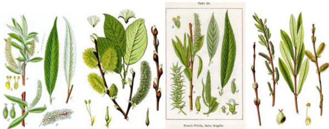
Slika 14. Salix alba , S. caprea , S. fragilis , S. purpurea .