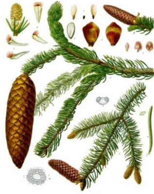
Slika 3. Picea abies .