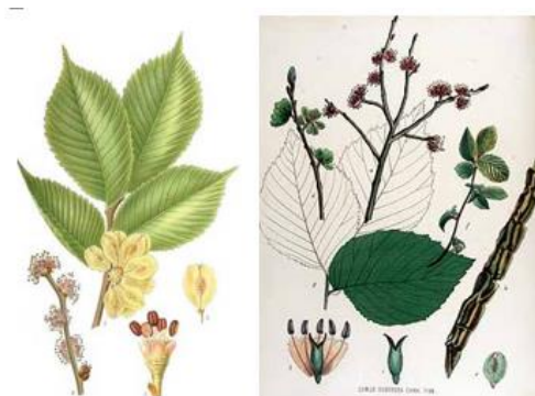
Slika 15. Ulmus glabra , Ulmus minor .

Rasprostranjen je u južnoj i zapadnoj Europu, u Maloj Aziji i u sjevernoj Africi. Raste na sunčanim mjestima, na kiselim, dubokim i plodnim, svježim ili suhim zemljištima šuma (hrast lužnjak, bukva, gorski javor), u nizinama i brdskom području. Uspravnog je rasta, naraste do 30 metara visine tvoreći gustu i široku krošnjju. Deblo je promjera do 2 metra, kora je smeđa i debela, u početku glatka, kasnije postane duboko izbrazdana. Korijenov sustav je jak i dobro razvijen. Listovi su eliptični, asimetrične osnove. Cvjetovi su dvospolni, sjedeći, skupljeni po 15-20 u čuperke na prošlogodišnjim izbojcima. Cvjetaju prije listanja, u ožujku i travnju. Plod je okriljeni svijetlosmeđi oraščić, velik do 2,5 cm, visi na kratkoj stapci, krilce je orezano i dopire do sjemenke. Dozrijeva u svibnju i lipnju (sl. 15.).