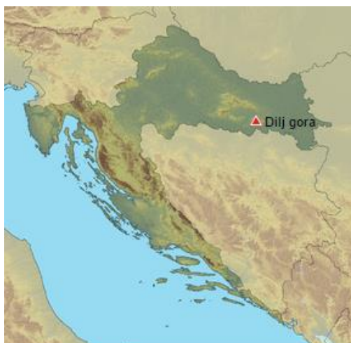
Slika 1. Pozicija Dilja na karti Hrvatske (Tomašević i Samardić 2000).

U ovom radu medonosno drveće i grmlje istraživano je na području Dilja, koji je smješten u istočnom kontinentalnom dijelu Hrvatske, u središnjoj Slavoniji, sjeverno od Slavenskog broda. Dilj je gora koja se odlikuje izrazitim florističkim bogatstvom, zahvaljujući svom položaju na granici različitih klimatskih utjecaja (sa zapada alpskoga, s juga dinarskoga, s istoka i sjevera panonskoga).