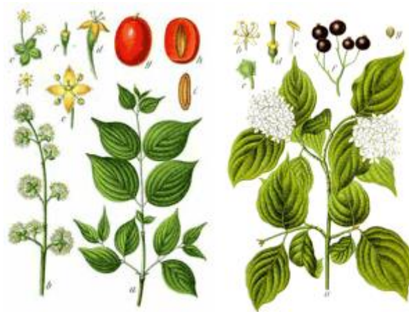
Slika 7. Cornus mas , Cornus sanguinea .