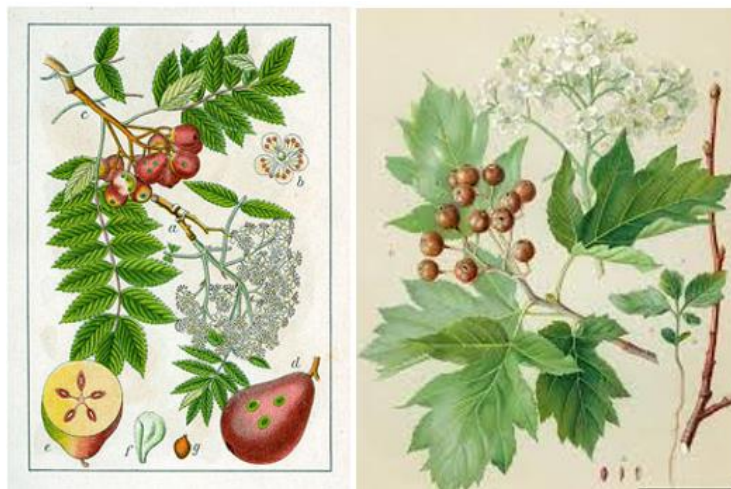
Slika 12. Sorbus domestica , Sorbus torminalis .

Rasprostranjena je u većem dijelu Europe, u dijelovima Azije i Afrike. Staništa su joj šume, do 1500 m n. v. Naraste do 15 m visine tvoreći razgranatu i gustu, okruglastu krošnju. Promjer debla je do 70 cm. Kora mu je tamnosmeđa, u početku glatka, kasnije uzdužno naborana. Listovi su dublje ili pliće urezani na nekoliko ušiljenih režnjeva, dugi do 10 cm, nejednoliko nazubljeni i nalaze se na peteljci dugoj 2-4 cm. Na licu su tamnozeleni i sjajni, naličje im je sivozeleno. Ujesen poprime žutu i crvenosmeđu boju prije nego otpadnu. Cvjetovi su bijeli, skupljeni u uspravne paštite cvatove. Cvjetaju u svibnju i lipnju (sl. 12.).