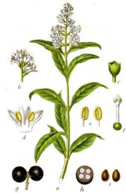
Slika 10. Ligustrum vulgare L.