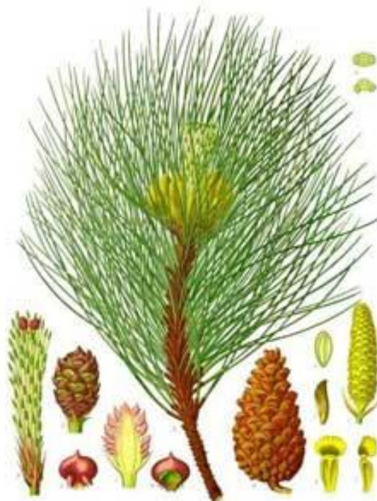
Slika 4. Pinus nigra .

Zreli češeri su smeđi, manji. Dozrijevaju krajem druge godine, a otvaraju se u proljeće iduće godine kada se ljuske češera rašire i oslobode sjemenke (sl. 4.)