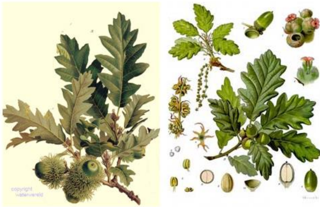
Slika 9. Quercus cerris , Quercus petraea .