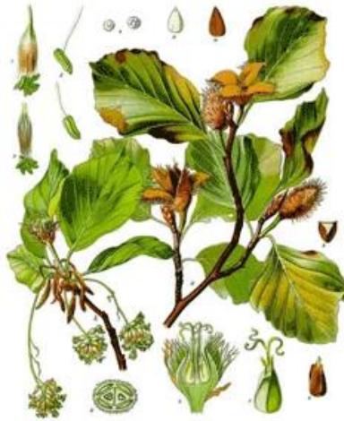
Slika 8. Fagus sylvatica L.