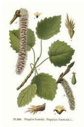
Slika 13. Populus tremula L.

Rasprostranjena je u cijeloj Europi, ima je u sjevernoj Africi te u Sibiru u sjevernoj Aziji. Raste u svijetlim šumama, uz vodotoke na vlažnim područjima, od nizina do pretplaninskog područja. Otporna je na hladne temperature i oštre zime. Stablo je srednje visine, u prosjeku naraste 20-30 metara visine. Tvori okruglastu i prozračnu krošnju. Korijen je dobro razgranat, premda plitak. Deblo je promjera do 1 metar, kora je debela oko 2 cm, u mladosti je glatka i bijela do žutosmeđa, kasnije postane tamnosiva, ispucana i izbrazdana. Listovi su naizmjenični, u početku dlakavi, poslije goli. Cvjeta u ožujku i travnju, oprašuju se vjetrom. Plod je goli, sivosmeđi, mali i uski tobolac. Dozrijeva u rano ljeto (sl. 13.).