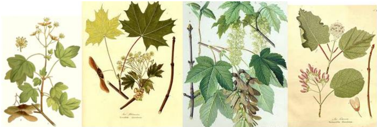
Slika 6. Acer campestre , Acer platanoides , Acer pseudoplatanus , Acer tataricum .

Raste u listopadnim, crnogoričnim ili mješovitim šumama i gustišima od nizinskih do brdskih područja. Često se uzgaja u parkovima. Razmnožava se sjemenom. Brzog je rasta, živi do 500 godina. Naraste do 30-40 metara visine, krošnja mu je ovalna i bujna. Promjer debla je do 2,5 m. Kora je u početku glatka i sivosmeđa, kasnije ispuca u tanke i nepravilne ljuske crvenkastosmeđe boje. Listovi su jednostavni, veliki, nalaze se na dugačkoj peteljci. Široki su do 20 cm, dugi 10-15 cm, urezani na pet ušiljenih režnjeva nazubljenih rubova. Cvjetovi su žućkasto zeleni, skupljeni u viseće grozdaste, razgranate cvatove duge do 10 cm. Cvjeta nakon listanja, u travnju i svibnju. Pčele ih posjećuju radi sakupljanja nektara i peludi. Plod je okriljena perutka (sl. 6.).