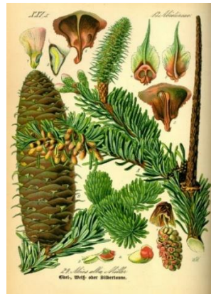
Slika 2. Abies alba .

Jela obilno proizvodi prašni pelud no pčele ga slabo sakupljaju jer je siromašan bjelančevinama. Skupljaju velike količine medljike – medne rose koja nastaje izlučevinama biljnih ušiju, te dosta propolisa. Prinos po košnici je do 80 kg, na jednom hektaru može se sakupiti i do 700 kg medljike. Medljika je ukusna, tamnozeleno, mirisa na smolu, brzo se kristalizira (Šimić 1980).