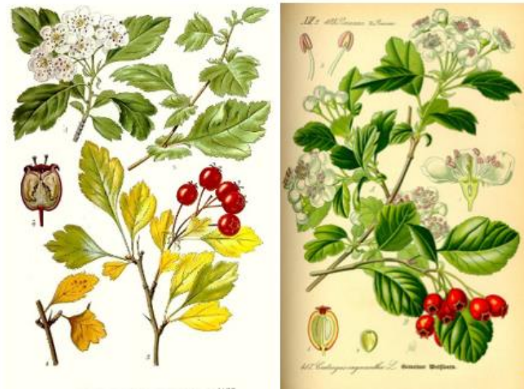
Slika 11. Crataegus laevigata , Crataegus monogyna .