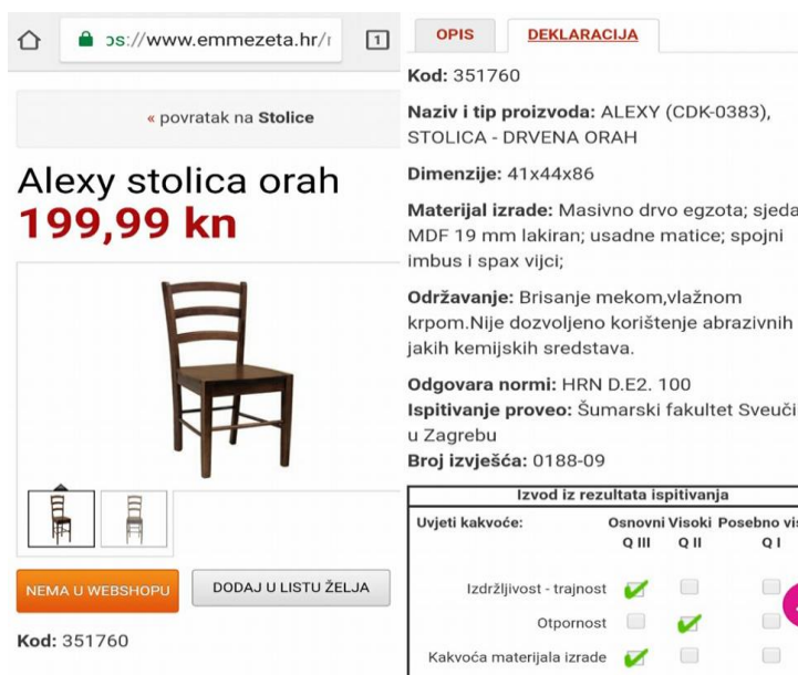
Slika 10. Detaljan opis proizvoda, pravilan način deklariranja stolice

Ispitivanje svojstva drvnih proizvoda za određene tvrtke provodi i Šumarski fakultet (slika 10), a deklaracije koje se nalaze na web stranici daju sve potrebne podatke kupcu, te mu omogućuju bezbrižnu on-line kupovinu.