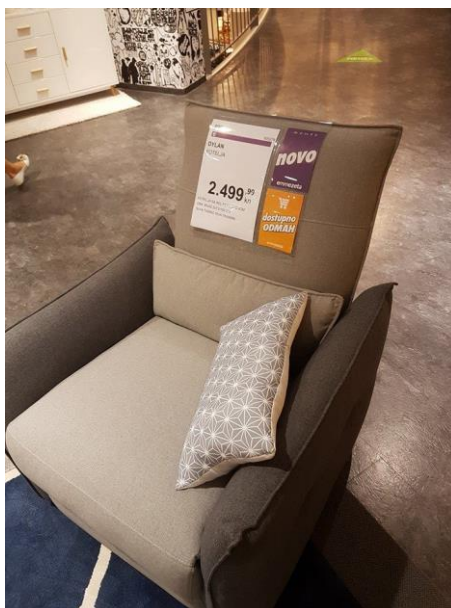
Slika 5. Nepravilna deklaracija tapeciranog namještaja

Prodavač sa dobrim sposobnostima uvjeravanja uspjeh će prodati proizvod slabije kvalitete i nepotpune deklaracije neodlučnom kupcu.