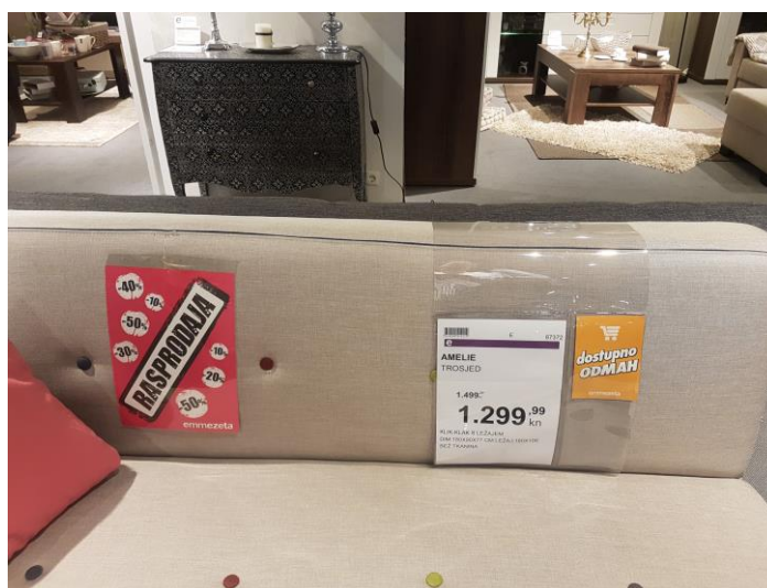
Slika 2. Nepotpuna deklaracija za vrijeme trajanja sezonskih sniženja

Za vrijeme prikupljanja podataka u trgovinama je trajalo sezonsko sniženje određenih proizvoda, a pri kupnji namještaja sa sniženom cijenom ili namještaja na rasprodaji, kupac treba imati ista prava kao u uredovitoj prodaji namještaja. Proizvođač je obavezan na namještaju koji se nalazi na sniženju istaknuti početnu cijenu i novu sniženu cijenu proizvoda, tijekom trajanja sezonskih sniženja proizvođač često smanjuje vrijeme reklamiranja proizvoda kojim je potrošač nezadovoljan i želi povrat novca ili zamjenu za novi proizvod. Česti nedostatak prilikom trajanja sezonskih sniženja namještaja je nepotpuna deklaracija, a primjer nepravilnog izlaganja prikazan je (slika 2).