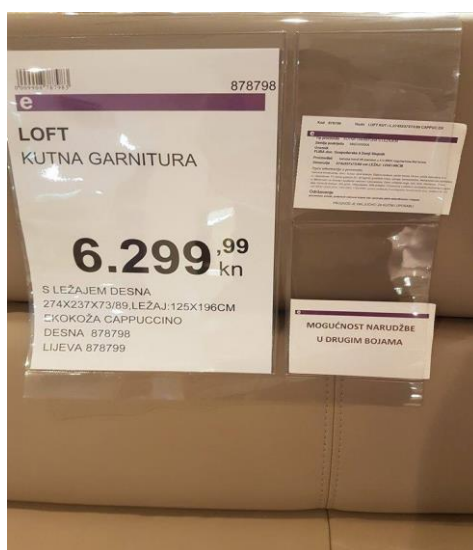
Slika 6. Pravilan način deklariranja tapeciranog namještaja

Na hrvatskom tržištu namještaja nalaze se i deklaracije koje će kupcu dati sve bitne informacije, a one su mu potrebne u konačnom odlučivanju i kupnji proizvoda. Pravi primjer (slika 6) deklaracije koja daje kupcu osnovne informacije kao što su tip proizvoda, zemlja podrijetla, uvoznik, proizvođač, dimenzije, opće informacije, održavanje, i cijena.