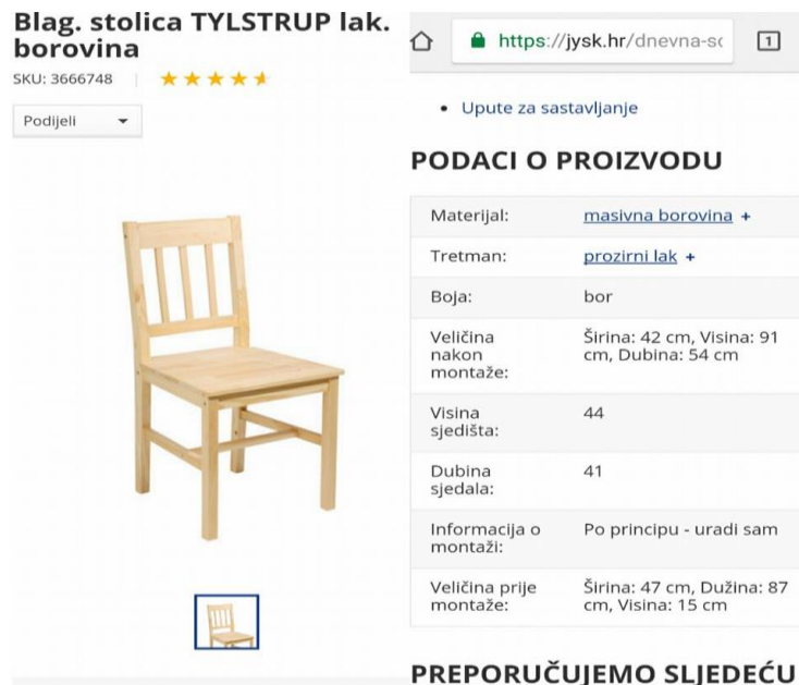
Slika 9. Osnovni opis proizvoda, stolice

Većina trgovina na web stranice stavljaju samo osnovni opis (slika 9) proizvoda (dimenzije, boju, upute o sastavljanju), deklaraciju proizvoda izostavljaju koja je kupcu potrebna u konačnom odlučivanju pri on-line kupnji proizvoda.