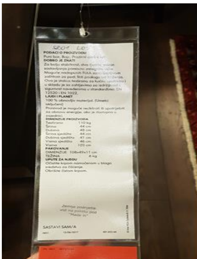
Slika 8. Nepotpuna deklaracija, nedostaje informacija o zemlji podrijetla

Istraživanjem trgovina na području Grada Zagreba primijećeno je da većina deklaracije na sebi ima neke osnovne informacije o udjelu materijala, vrsti završne obrade, vrsti vijaka kojima se spaja, promjeri raznih rupa itd., ali na većini deklaracija nedostaju podaci o zemlji porijekla proizvoda i ime proizvođača. Od navedenih prodajnih mjesta Emmezeta i Prima na svojoj deklaraciji imaju najopširniji opis proizvoda sa svim potrebnim informacijama od proizvođača, do vrste i debljine iverice. Za prikupljanje informacija o zemlji podrijetla proizvoda kod tvrtke IKEA-e bilo je potrebno otići u njihovo veliko skladište, te po kutijama tražiti konkretniju deklaraciju o proizvodu jer na izloženom proizvodu u samom prodajnom centru ta deklaracija ne sadrži potrebni podatak (slika 8). Prodajni centar Lesnina isključen je iz istraživanja, zbog velike neljubaznosti trgovca koji nisu htjeli dati informacije o zemlji podrijetla određenog namještaja, a te informacije nisu navedene na deklaraciji proizvoda.