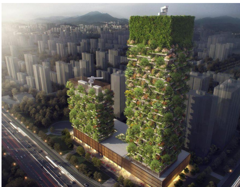
Slika 4. Izgled budućih tornjeva Nanjinga

S balkona će posjetitelji imati zapanjujući pogled na vrtoglave vertikalne šume koji nisu samo estetski dodatak, nego bi trebale pomoći u obnovi lokalne biološke raznolikosti. Nakon što završe ovaj projekt, ova talijanska tvrtka planira izgraditi i cijeli šumski grad u Nanjingu, te u još nekim kineskim gradovima koji se također bore protiv izuzetno velike zagađenosti zraka. (Web 3)