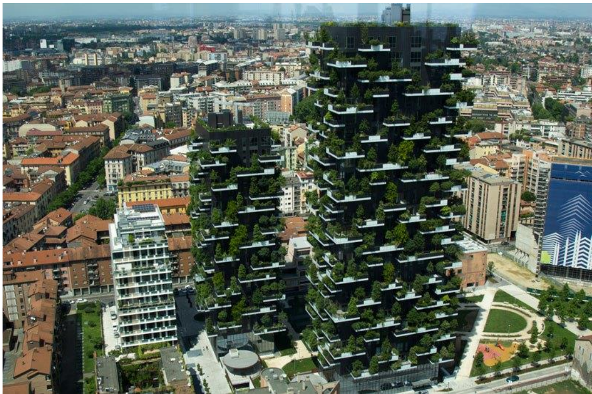
Slika 1. 'Zeleni' neboderi „Bosco Verticale“

Prvi projekt nastao kao rezultat ovog koncepta jesu upravo zeleni neboderi talijanskog arhitekta Stefana Boerija. Neboderi u talijanskome gradu Milanu nazvani su „ Bosco Verticale “ (tal. vertikalna šuma), a smješteni su u milanskoj četvrti Isoli u neposrednoj blizini ulice Corso Coma, najpoznatijeg odredišta za modu, kupnju i noćne izlaske u tome gradu. Prema Boeriju, do ideje o zelenim stambenim tornjevima došao je tijekom posjeta Dubaiju 2007. kada je shvatio kako ekološki neodrživi neboderi niču po cijelome svijetu nevjerovatnom brzinom. To ga je navelo na to da razmisli o realnim održivim alternativama u području izgradnje nebodera, a rješenje se pojavilo u obliku zelenih, organskih pročelja. (Bogdan, 2016.)