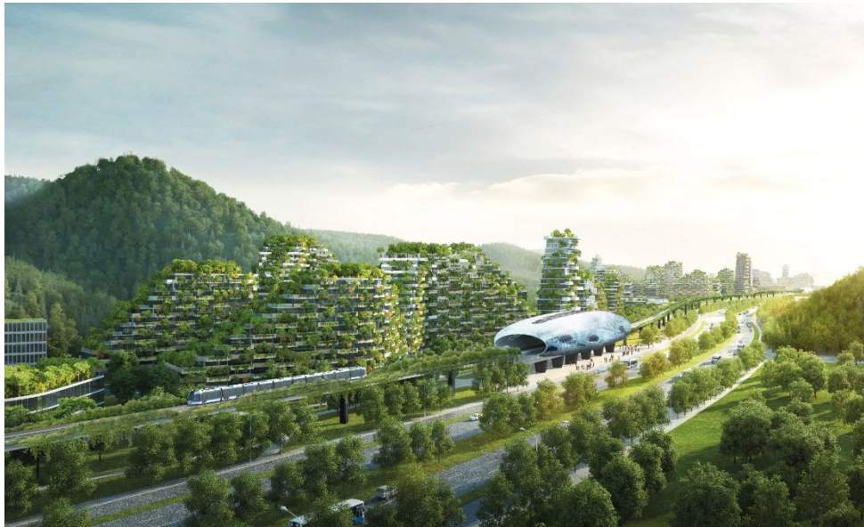
Slika 13. Budući „Šumski grad“

Po uzoru na Boerijeve nebodere, u gradu Liuzhou u Kini, gradi se prvi vertikalni šumski grad s ciljem smanjivanja zagađenja zraka. Područje samostalne četvrti veličine 175 hektara, obuhvaćat će 70 zgrada, uključujući domove, bolnice, hotele, škole i urede, a svaku od njih prekrivat će 40 000 stabala i skoro milijun biljaka, od preko 100 različitih vrsta. S vremenom, do 30 000 ljudi moglo bi „Šumski grad“ zvati domom. (Web 14) Predviđa se da će 'biljni' život apsorbirati skoro 10 000 tona ugljikovog dioksida i 57 tona polutanata kroz godinu te da će proizvesti 900 tona kisika godišnje, smanjujući temperaturu zraka i pružajući novo stanište za raseljeni divlji život. (Web 15) Solarni paneli na krovovima skupljat će obnovljivu energiju za funkcioniranje zgrada dok će geotermalna energija pokretati pročišćavanje zraka, apelirajući na zelenilo projekta, a jedan od načina prijevoza bit će brza električna željeznička linija. (Web 14)