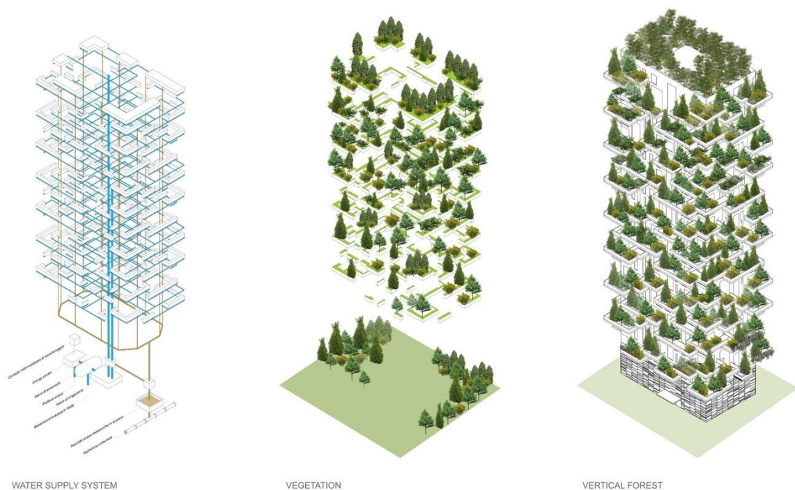
Slika 3. Sustav izgradnje 'zelenog' nebodera

Prije početka izgradnje provedene su složene i opsežne studije. Za rad na njima Stefano Boeri okupio je interdisciplinarni tim arhitekata, građevinskih inženjera i botaničara s Agronomskog fakulteta u Milanu. Oni su ustanovili koje su vrste drveća najotpornije na hladnoću, vjetar i sušu. Morali su se razraditi sigurnosni i konstrukcijski aspekti te je za svako stablo morala biti pronađena odgovarajuća lokacija s obzirom na količinu svjetlosti i vjetra te razinu vlažnosti. Najprikladnije biljke uzgajane su u stakleniku dvije godine prije početka gradnje. Osim toga za upravljanje i održavanje vertikalne šume oformljen je specijalizirani tim koji se brine za vegetaciju. Boeri tvrdi kako uključivanje stabala povećava troškove gradnje samo pet posto te je to prijeko potreban odgovor na širenje modernoga grada. Zgrada koja je prekrivena florom zapravo pomaže u smanjenju razine zagađenja zraka filtriranjem čestica prašine koje su prisutne u svim velikim gradovima, a Milano je upravo jedan od najzagađenijih gradova u Europi, što je vjerojatno i razlog zbog kojeg je Boeri odlučio svoju vertikalnu šumu graditi upravo na tome području. (Bogdan, 2016.)