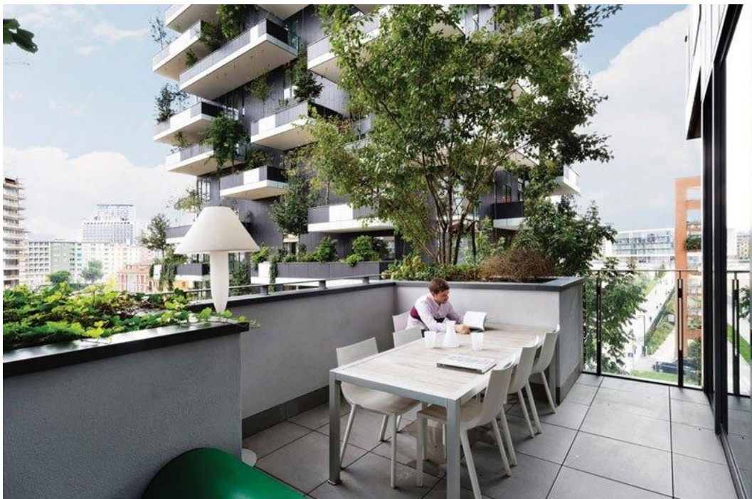
Slika 2. Pogled s balkona nebodera

Svi stanari tih šumovitih nebodera iz vlastitog stana imaju pogled na prirodu i izlaz u nju, odnosno na pošumljenu terasu. „ Bosco Verticale “ sastoji se od dva tornja visine 119 i 87 metara. Na njima raste oko 900 stabala (od 3,6 do 9 m visine), 11 tisuća komada niskog raslinja i pet tisuća komada grmova. Sve te biljne vrste bi na ravnoj površini zauzele površinu od čak jednog hektara ili 10.000 m 2 . Taj stambeno-poslovni kompleks sadrži 400 stambenih i poslovnih jedinica, a cijena jednoga stambenog kvadrata kreće se od 3000 eura naviše. Stanovi su veličine od 65 do 450 m 2 , a svaka stambena jedinica ima velike pošumljene terase. Balkoni na tornjevima prostiru se na udaljenosti od 3,35 m od stanova sa sve četiri strane zgrade. Raspoređeni su nepravilno kako bi se stvorio prirodni dojam i kako bi bilo dovoljno mjesta za biljke. Na balkonima zasađena su stabla koja odgovaraju svim vremenskim uvjetima. Tijekom ljeta ona pružaju fantastičnu prirodnu hladovinu, dok istodobno filtriraju zagađenje, a zimi golo drveće omogućuje prodor sunčeve svjetlosti u stanove. (Bogdan, 2016.)