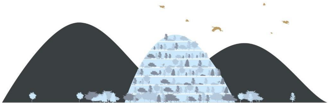
Slika 8. Hotel kao imitacija brda

Sveukupna površina projekta iznosi 400 ara, a površina koju zauzima hotel kao najposebniji dio, iznosi 31 200 m 2 . Koncept proizlazi iz jedinstvenog scenografskog područja „10 tisuća vrhova“, zajedno u kombinaciji terasastih struktura i oblika plemenskih manjina koja ističe dizajn hotela u obliku polumjeseca, oslanjajući se na originalne planine. Cilj dizajna jest obnoviti pejzaž rekonstrukcijom nekada postojećeg brda koji se izravnao tijekom godina, na ovaj način imitirajući prošla i sadašnja brda. (Web 6)