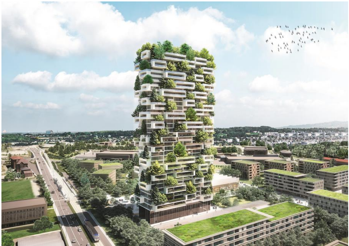
Slika 5. Predviđen izgled tornja cedrova

Koncept vertikalne šume ubrzo je prepoznat diljem svijeta kao odlično rješenje za prenapučene i zagađene metropole pa će nakon Milana svoju ultramodernu i ekološki prihvatljivu zgradu dobiti i švicarski grad Laussane, čija je gradnja započela u prvoj polovini 2017. Boerijev tim izradio je projekt zgrade visoke 117 m, pravokutnog oblika 52 x 15,5 metara, koja ima 36 katova, a na njoj će rasti više od 100 komada cedrova, 6000 komada grmova i 18 tisuća komada drugih zimzelenih biljaka. Zgrada će uključivati teretanu, urede, stanove, restoran i 5.000 četvornih metara trgovačkog centra. (Bogdan, 2016.)