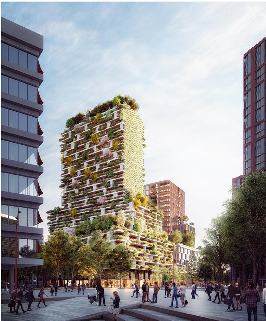
Slika 9. Budući toranj Hawthorn

90 metara visok toranj Stefana Boerija, u centru Utrechta, nastoji stvoriti inovativno iskustvo suživota grada i prirode. Toranj Hawthorn će, kao pravi urbani ekosustav, na svojim fasadama, krovovima i balkonima 'udomačiti' više od 10 000 biljaka različitih vrsta (preko 30 vrsta; 960 stabala, 9 640 grmova i cvijeća), što će biti jednako površini od jednog hektara šume. (Web 9)