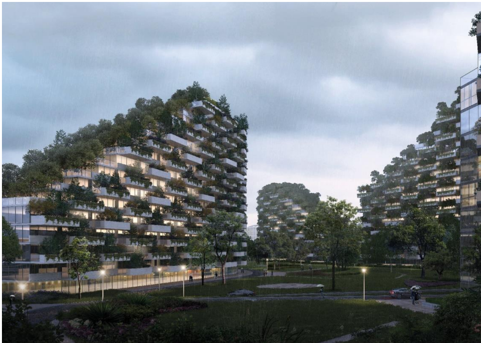
Slika 14. Difuzija vegetacije na fasadi zgrade namjenjena je za poboljšanje kvalitete zraka (Web 15)

Svaka shema pruža održivo stanovanje i poslovne prostore obuhvaćene gustim zelenilom, kao način smanjenja zagađenja okoliša, filtrirajući čestice prašine iz zraka i apsorbirajući ugljični dioksid. Po prvi će puta, u Kini i svijetu, inovativno urbano naselje kombinirati izazov za energetske samodostatnost i korištenje obnovljivih izvora energije sa izazovom za povećanje bioraznolikosti i za efektivno smanjenje zagađenja zraka u urbanim područjima, zahvaljujući umnožavanju povrtnih i bioloških urbanih površina. Druge prednosti shema uključuje smanjenje temperature zraka, pružajući barijere protiv buke od prometa i stvarajući dom za ptice, insekte i male životinje. Početak gradnje predviđa se 2020.godine. (Web 15)