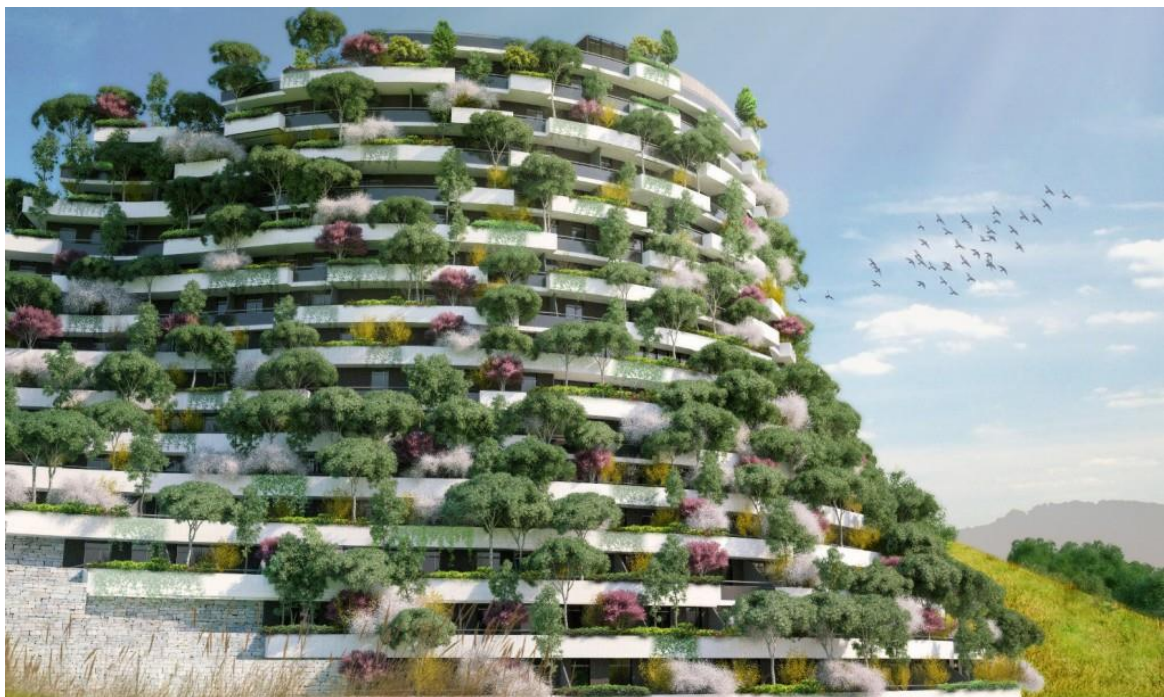
Slika 7. Izgled vertikalne 'planine' – Hotel

Dizajniran kao vertikalna 'planinska' šuma, hotel s 250 soba bit će izgrađen u kineskom gradu Xinyi (u regiji zvanoj 'Šuma od 10 tisuća vrhova' – Forest of Ten Thousand Peaks) u pokrajini Guizhou, za Cachet Hotel grupu čije je sjedište u Hong Kongu, a njegov dizajn izrađen je po istom principu kao prethodni projekti, s naglaskom na održivu arhitekturu i 'zelenu' fasadu koja bi mogla poboljšati kvalitetu zraka u okolini. Zgrada će biti prekrivena zelenilom od temelja do krova. Dizajn interijera uključuje sadržaje poput teretane, prostore za druženje i relaksaciju, VIP zonu, bar, restorane i konferencijske sobe. Ovaj projekt osigurat će mogućnost da svaki građanin uživa u 8 kvadratnih metara zelenila i poljoprivrede, zajedno s 40-ak grmova, 2 stabla i 30 životinja. Kako bi se osiguralo održivo korištenje energije, uvest će se obnovljivi izvori i tehnike. (Web 6)