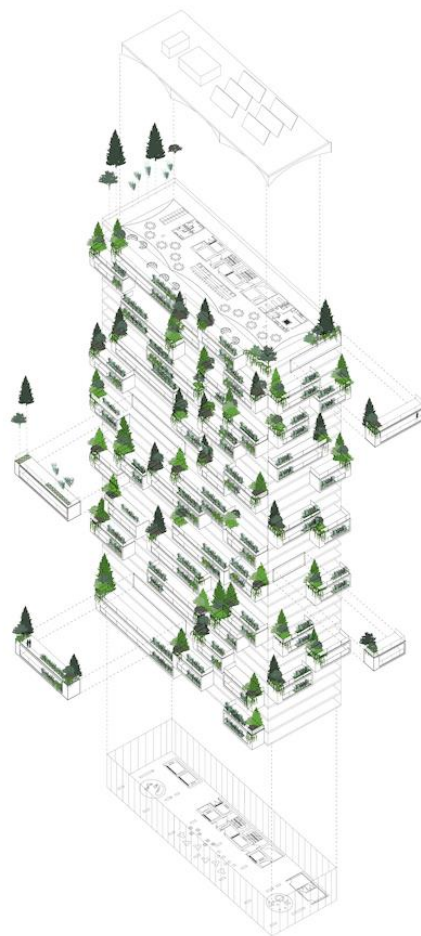
Slika 6. Koncept izgradnje tornja cedrova

Inače, švicarski grad Lausanne želi postati jedan od vodećih gradova u pogledu kvalitete grada s obzirom na biološku održivost i raznolikost. Neboder je nazvan „The Ceder Trees Tower“ baš zbog činjenice što je kao dominantno drvo izabran cedar koji je prilično izdržljiv te može opstati u raznim klimama, a k tome je i crnogorično drvo pa će biti zeleno tijekom cijele godine. Između ostaloga, cedar hvata čestice smoga, a i dobro će izgledati u vizuri grada. Radi se dakle o projektu koji će spajati klasične materijale poput stakla i betona i tradicionalno drvo, a bit je u tome što je drveće u ovome slučaju živo. Dakako, radi se o dekoraciji, ali taj 117 metara visoki neboder s ukupno 36 katova ipak će stvarati osjećaj mnogo zelenijeg i ugodnijeg životnog prostora. Na svakome će katu i međukatu te na krovu i oko zgrade biti posađeno mnoštvo biljaka. Na ukupno 3000 m 2 zelene površine naći će se i oko 6000 grmova i 18.000 različitih drugih biljaka, a glavni je cilj poboljšati kvalitetu života stanara i cijeloga grada te izazvati druge arhitekta i građevinare da se prihvate takvih održivih projekata. (Bogdan, 2016.)