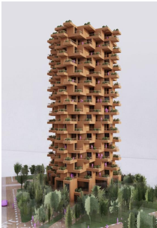
Slika 12. Model tornja

Veliki modulirani balkoni raspoređeni su tako da izgledaju kao grane drveća s optimiziranim pogledima za svakog stanovnika. (Web 12) Velike vanjske terase poduprijet će ogroman vegetacijski sistem koji će uključivati povrtnjake, grmlje pa čak i drveće te će sve to pomoći pasivnom hlađenju zgrade i osigurati privatnost svakom apartmanu. Postavljanjem drveća direktno u okolini strukturnih drvenih panela, moguće je promatrati neke vrste simbioze prirode i izgrađenog okoliša. Smatra se da će ova povezanost pružiti mogućnosti razvoja pravog ekološkog porasta, a uz to opskrbljuje stanovnike svježim zrakom i smanjuje tragove ugljika. (Web 13)