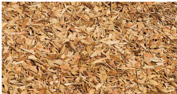
Slika 6. Drvena sječka u skladištu

dolazi do mogućnosti zagušenja sustava i stvaranja čađe, te se zbog toga drvena sječka za manja postrojenja mora uskladištiti i prosušiti (Loibnegger 2011).