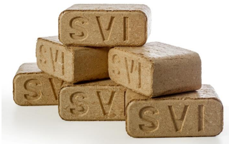
Slika 9. Briketi firme Spin Valis Internacional Požega (SVI)

Briketi su slični kratko cijepanom drvu po obliku, dimenzijama i načinu uporabe, ali ih karakterizira veći energetska potencijal (Šafran 2015). Proizvode se prešanjem suhog usitnjenog drva i bez dodavanja vezivnih sredstava. Ogrjevna vrijednost briketa iznosi 18,5 MJ/kg, a energija koja se dobije izgaranjem 2 kg briketa ekvivalentna je onoj iz jedne litre loživog ulja (Krhen 2012). Briketi se mogu koristiti u svim vrstama ložišta za čvrsto gorivo, uz pažljivo doziranje (Herak 1987). Osim toga, korištenje briketa ima značajnu ekološku prednost jer sadržaj sumpora je u tragovima (dolazi do manjeg zagađenja okoliša), a nastali pepeo može poslužiti kao mineralno gnojivo (Brkić 2007).