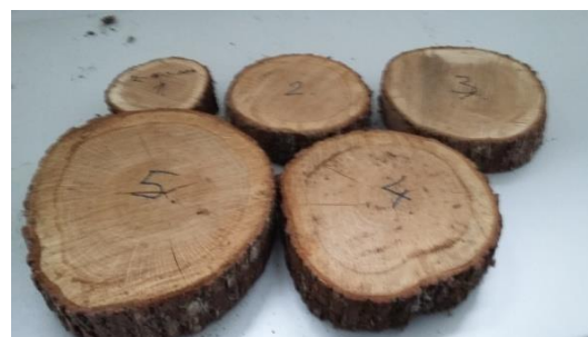
Slika 13. Obilježba uzoraka kolotova hrasta