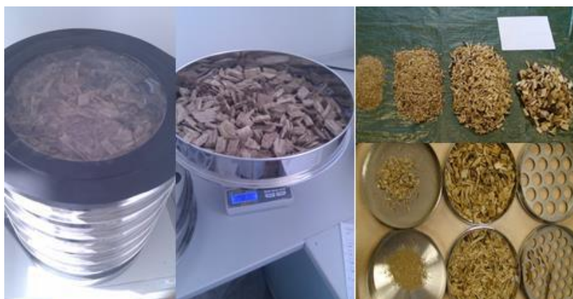
Slika 19. Oscilator za utvrđivanje granulometrijskog sastava drvene sječke

Jedan od najvažnijih parametara za učinkovitu pretvorbu drvene sječke u energiju je distribucija veličine čestica drvene sječke. Prilikom prosijavanja drvene sječke dolazi do gubitka drvene tvari zbog razvoja gljiva i bakterija koje razlažu celulozu u drvnoj tvari pri čemu dolazi do oslobađanja topline. Prosušivanje ovisi o dimenzijama drvene sječke jer povećanjem dimenzija se pospješuje prosušivanje i smanjuje se zdravstveni rizik, mogućnost zapaljenja te gubitak kalorične vrijednosti goriva.