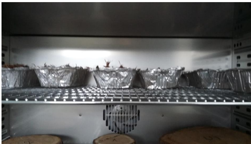
Slika 18. Sušenje uzoraka u sušioniku

Za određivanje sadržaja vode u drvu postoji više vrsta direktnih i indirektnih metoda. Direktnim metodama zajedničko je izdvajanje vode iz drva i određivanje njene mase ili volumena. U direktne metode ubrajamo: gravimetrijska metoda, destilacijska metoda i metoda titracije. Indirektnim metodama, sadržaj vode se procjenjuje na temelju odnosa između određenog fizičkog svojstva i sadržaja vode u tlu. Najvažnija i najčešće korištena metoda je metoda električnih higrometara kojima se sadržaj vode u drvu procjenjuje na temelju otpora odnosno vodljivosti električne struje.