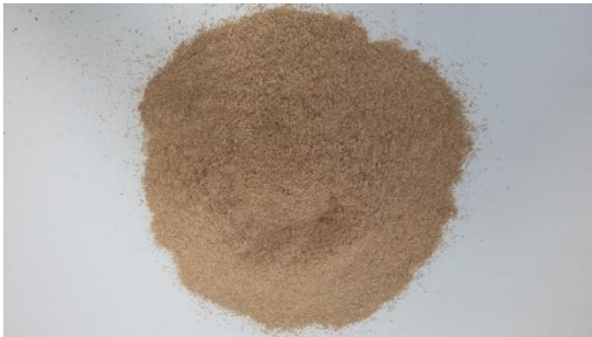
Slika 16. Priprema uzoraka nakon usitnjavanja

Nakon vađenja posudica iz sušionika, stavlja ih se u eksikator na pola sata. Uzimaju se posudice te ih se važe. Nakon toga se stave u njih dvije žličice (minimum 2 grama) uzorka te se posudice važu (s poklopcem). Posudice sa uzorkom se stave u sušionik (makne se poklopac) i ostavljaju u sušionik na 3 sata. Za vaganje se koristi analitička vaga Mettler Toledo, XA 204 DR.