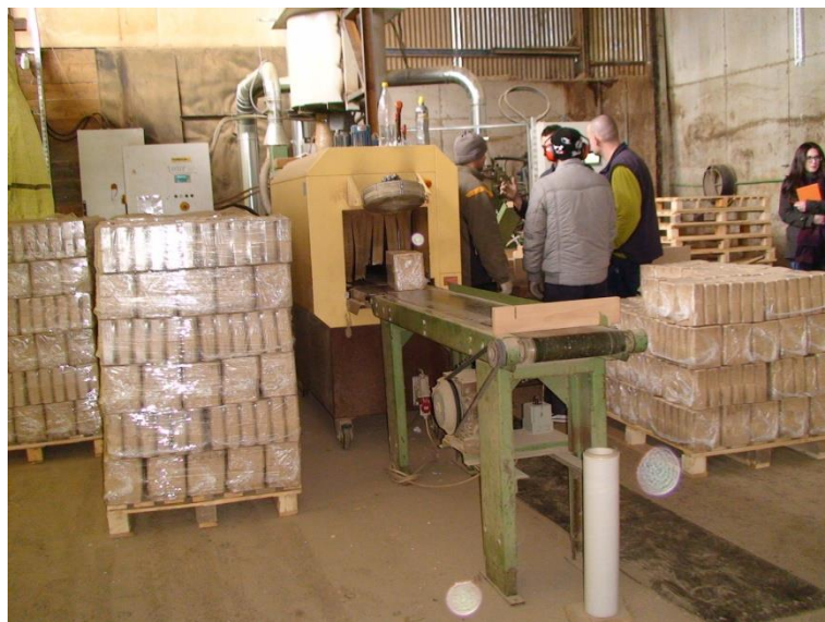
Slika 10. Pogon za proizvodnju briketa u firmi Spin Valis Internacional Požega 2016.

Prilikom prešanja drvene sirovine volumen iste se smanjuje pri čemu se postiže gustoća briketa 800 do 1200 kg/m 3 . Temperatura alata preše iznosi 90°C. Termoplastičnim sljepljivanjem čestica se postiže zbijenost i kompaktnost usitnjenih čestica. Također, važnu ulogu pri prešanju ima i sadržaj vode koji bi trebao biti ispod 15. Ogrjevna vrijednost sirovine iznosi 16 do 18 MJ/kg.