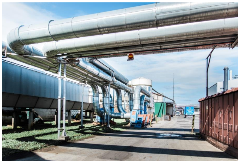
Slika 4. Ulaz u tvrtku Spin Valis sa kolnom vagonom

Ulaganja u posljednje četiri godine u visini od oko 120 milijuna kuna su u novu opremu, informatizaciju i kadar. Iz potrebe za toplinom za sušenje drveta za proizvodnju namještaja iz masiva bukve i hrasta krenulo se u investiciju izgradnje kogeneracijskog postrojenja na biomasu. Veličina postrojenja i njegova snaga izrađeni su na izračunu drvenog ostatka, kore i drveta nakon izrade elemenata za proizvodnju namještaja te je snaga postrojenja 1,5MW električne energije i 8,8 MW toplinske energije. Toplina se za sada isključivo koristi za vlastite potrebe sušenja drveta oko 4500 m 3 sušarskog kapaciteta, te protočna sušara za sušenje sirove piljevine iz pilane i polufinale. Iz piljevine proizvode visokokvalitetni briket u obliku ciglice koji se može koristiti u konvencionalnim ložištima za drvo te griju kompletan proizvodni prostor. Godišnje prerađuju oko 45000 m 3 bukovih trupaca i isto toliko hrastovih.