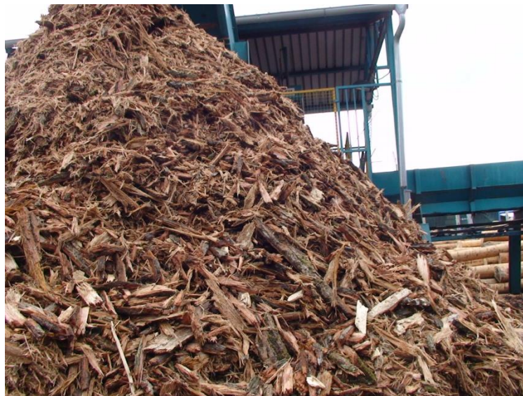
Slika 5. Hrpa kore hrasta nakon koranja trupaca

Kora se sa trupaca po dovozu iz šume skida na liniji za koranje čime se isključuje uporaba insekticida. Proizvodnja je usklađena sa što manjim štetnim utjecajem na okoliš.