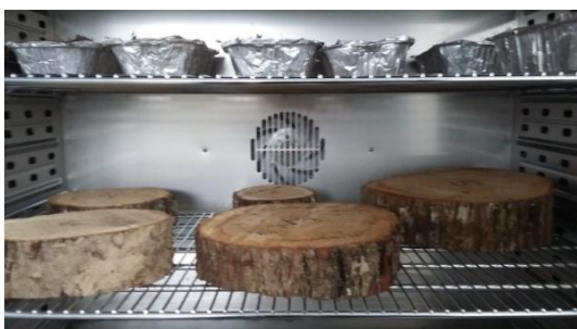
Slika 12. Uzorci kolotova i drvene sječke u sušioniku

Na terenu je prikupljeno 5 uzoraka kolotova višemetarskog drva hrasta lužnjaka ( Quercus robur L.). Pomoću digitalne vage KERN 440-49A je svaki kolot izvagano pojedinačno te nakon toga stavljen u sušionik Binder FD 115 na 24 sata. Nakon sušenja su ponovno izvagani. Pomoću dobivenih rezultata prije sušenja i nakon sušenja, dobiva se podatak o udjelu vlage za svaki pojedini uzorak, kolot višemetarskog drva, a označeni su rednim brojevima, 1-5. Prosječni udio vlage iznosi 35,9 %.