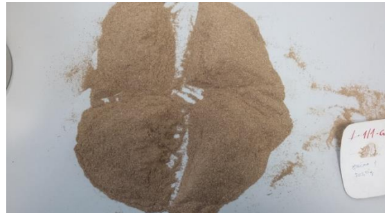
Slika 17. Priprema uzoraka za analizu pepela

Nakon sušenja vade se posudice sa uzorkom, te ih se stavlja u eksikator na pola sata. Na kraju se izvažu masa posudice sa uzorkom, te nakon toga se izračunava vlaga