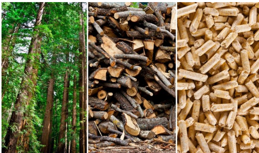
Slika 2. Porijeklo i oblici čvrstih biogoriva

Biomasa obuhvaća drvenu biomasu iz šumarstva ili u obliku otpadnog drva, drvenu uzgojenu biomasu u vidu brzorastućeg drveća, nedrvnu uzgojenu biomasu (alge i trave), ostatke iz poljoprivrede, gradski i industrijski otpad te životinjski otpad i ostatke.