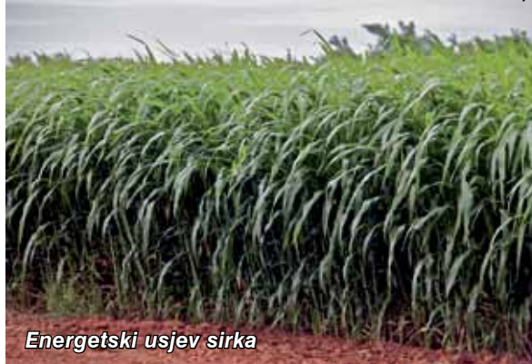
Energetski usjev sirka

Prinos energetskih usjeva poput sirka ( Sorghum sp. ) može iznositi i do 37 tona suhe mase po hektaru. Za poljodjelce koji su zainteresirani za potencijalnu proizvodnju sirovina za etanol iz celuloze, jednogodišnji usjev poput energetskog sirka mogao bi u početku biti više poželjan, budući da je većina naših poljodjelaca i navikla uzgajati jednogodišnje usjeve.