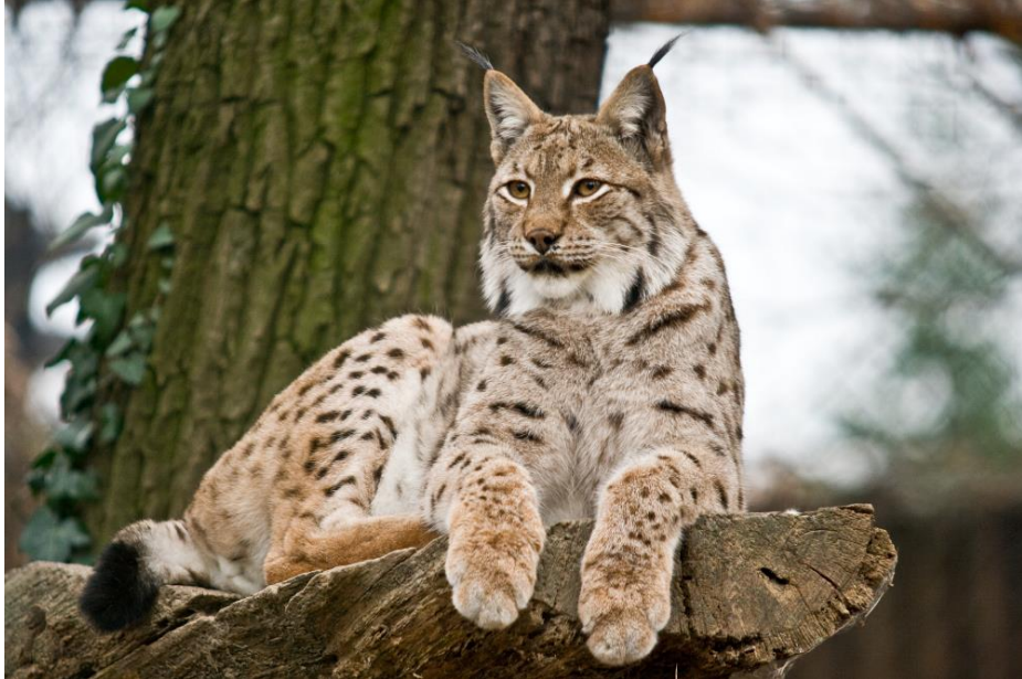
Slika 1. Euroazijski ris ( Lynx lynx )