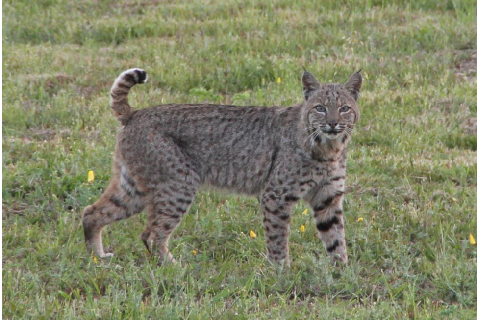
Slika 3. Crveni ris ( Lynx rufus )