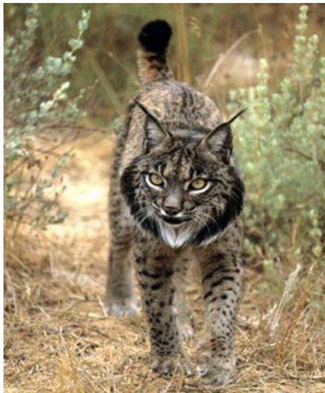
Slika 2. Iberijski ris ( Lynx pardinus )