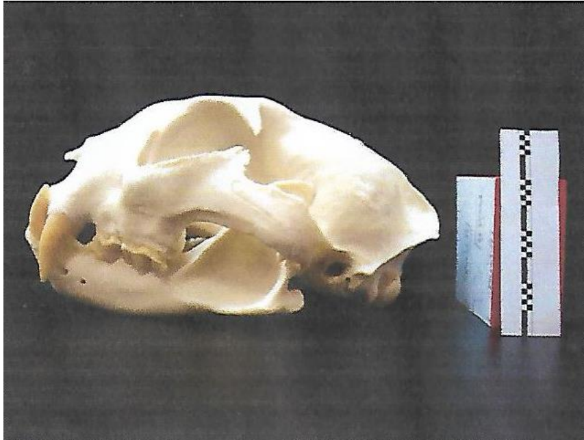
Slika 6. Lubanja euroazijskog risa ( Lynx lynx )

Tijelo euroazijskog risa dugačko je od 0,8 m do 1,3 m i prekriveno gustim, svijetlosmeđim do crvenkastim krznom karakterističnog pjegastog uzorka. Krzno je tamnije nijanse na hrptu i bokovima, dok je na trbuhu i unutarnjoj strani nogu bijele boje. Budući da pigmentacija krzna omogućuje predatoru poput risa da se lakše približi svome plijenu, odnosno vizualno uklopi u boje i uzorke koje njegov plijen percipira kao dio svoga okoliša, šare na krznu risa razlikuju se od područja do područja, ovisno o vegetacijskom pokrovu staništa. Osim toga, brojnost i sam raspored pjega na krznu specifični su za svaku pojedinu jedinku.