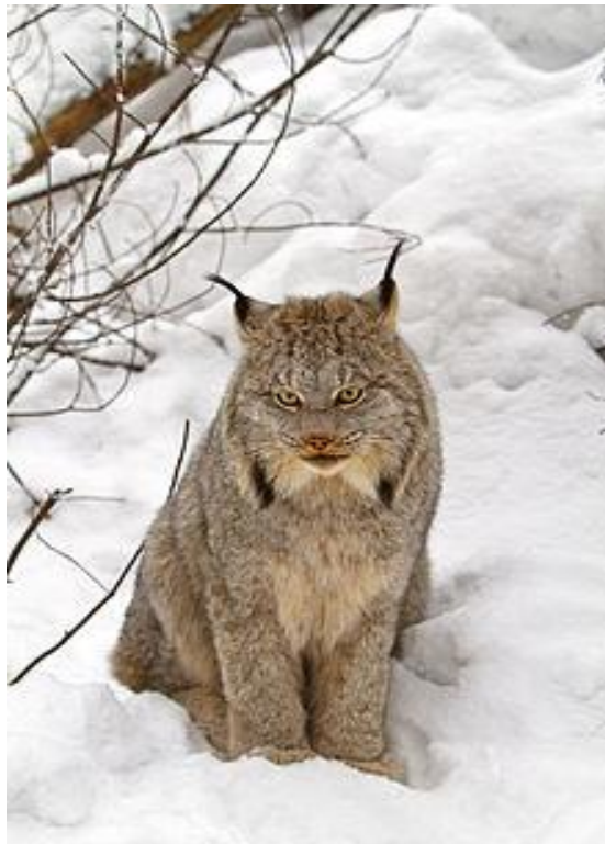
Slika 4. Kanadski ris ( Lynx canadensis )