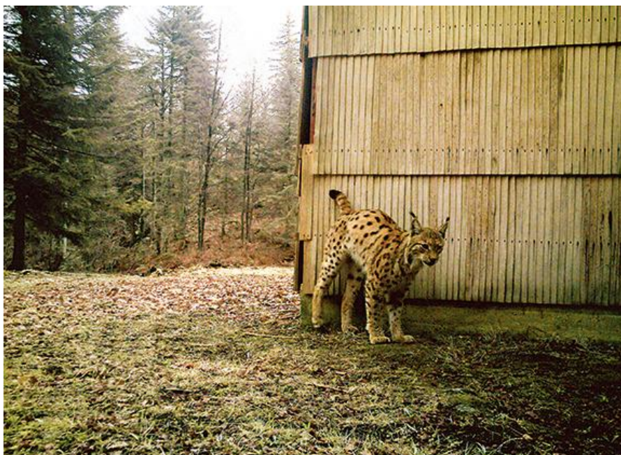
Slika 7.: Euroazijski ris uhvaćen fotozamkom Državnog zavoda za zaštitu prirode