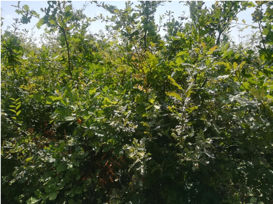
Slika 6: Primjer dobro odrađene njege gdje hrastova stabalca dominiraju

Kod pomlatka se prva njega obavlja kad drvenasti korovi prerastu hrastove biljke. Ako se s ovim zahvatom kojeg možemo svrstati u prvo pravo čišćenje zakasni, hrastove biljke propadaju u zasjeni, a ako se obavi prerano, hrastova stabalca značajno usporavaju svoj visinski rast. To je upravo razlog zašto je iznimno važno prepoznati pravi trenutak za njegu koja će ako je obavljena pravovremeno imati najviše efekta. Pravi trenutak je obično onaj kada su većini biljaka vršni listovi u razini ili tek nadrasli od okolne vegetacije. Radovi se najčešće provode od lipnja do kraja kolovoza. Sasjecanje se provodi na nepoželjnim vrstama oko 1 m ispod vrhova hrasta. Presječeni materijal potrebno je rasporediti između hrastovih stabalaca kako ne bi došlo do slučajnog blokiranja razvoja istih.