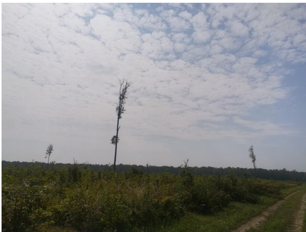
Slika 3: Jedna od promatranih površina na kojoj se provode radovi njege

Čišćenje je šumskouzgojni postupak njege šuma kojim se obavlja negativni šumskouzgojni odabir. Čišćenje se obavlja u razvojnim stadijima starijeg pomlatka i mladika (Anić, 2007). Cilj ovih radova je dovođenje sastojine u idealno stanje što podrazumijeva ciljanu strukturu sastojine. Tu spadaju vrsta, omjer i oblik smjese. Osim toga, djelomično se sprječava nastanak šteta i povećava kvaliteta stabala kao i stabilnost sastojine pa tako njega ima i preventivan karakter. Ovim postupkom regulira se i gustoća sastojine. Dobro provedeno čišćenje je neophodno za održavanje sastojinske strukture i olakšava daljnje provođenje zahvata i radova u šumi poput prorjeda. Ako se ne provede ili se obavi pogrešno, struktura sastojine će biti narušena što će ostaviti posljedice do kraja ophodnje.