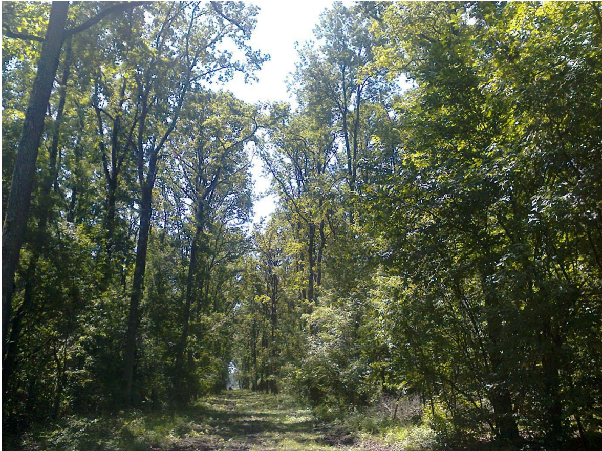
Slika 2: Prosječna u šumi hrasta lužnjaka i običnog graba