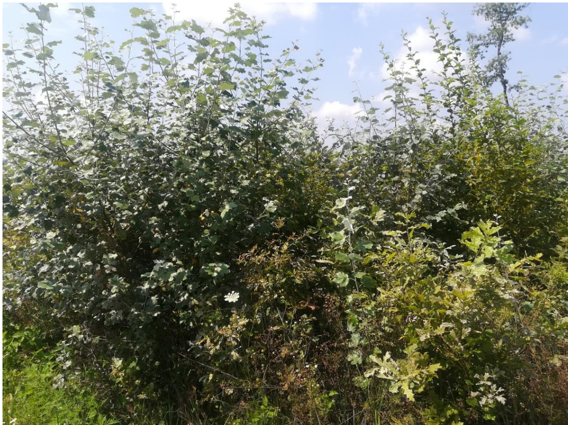
Slika 9: Topole vrlo lako preuzmu dominaciju nad hrastom

ili veljači, kad su ostale drvenaste vrste u zimskome mirovanju i bez listova. Klasična njega sasijecanjem izbojaka kupine nema nikakvoga učinka jer biljka vrlo brzo bujno potjera nove izbojke. Zbog toga je kemijsko tretiranje jedina opcija kod veće pojave kupine.