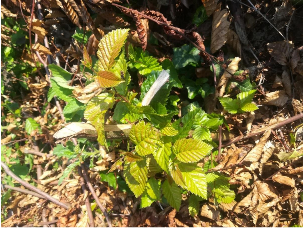
Slika 7: Neuspjeli pokušaj tretiranja mladog graba rezultira pojavom novih izbojaka iz panja

Na ovom području se obavlja i kombinirana ručno-kemijska njega koja je poznata i pod nazivom presjek-premaz metoda. Radi se kao prvi ili drugi zahvat njege pomlatka. Ako su nepoželjne drvenaste vrste značajno većih dimenzija od hrastovih biljaka one se presijecaju što niže pri zemlji i nastali panjići premazuju četkicama 40 %-tnom otopinom herbicida u vodi, s dodanom bojom za herbicid. Optimalno vrijeme za rad je rujan i prva polovica listopada, a potrebno je biti oprezan pri izvršavanju radova kako otopina ne bi prskala uokolo. Ako se radi i nakon toga koncentraciju treba povećati, a uspjeh je sve manji s odmicanjem od optimalnoga termina rada sve do pojave niskih temperatura (ispod ništice) s kojima ovi radovi i prestaju.