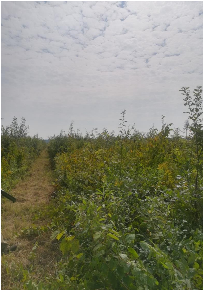
Slika 4: Površina pod zahvatom njege čišćenjem zajedno sa šljukarom na lijevoj strani

Prave se uzgojne stazice širine 1,5 m dok je razmak između njih 5 metara. Šljukare širine 3 m se rade okomito na uzgojne stazice i one su okomite na šumsku cestu, dok su šljukarice paralelne s njom. Mana ovako čestih šljukarica je smanjena proizvodna površina te otvaranje unutarnjeg dijela sastojine koje može uzrokovati asimetričnost krošanja i samim time veću pojavu kalamiteta u budućnosti.