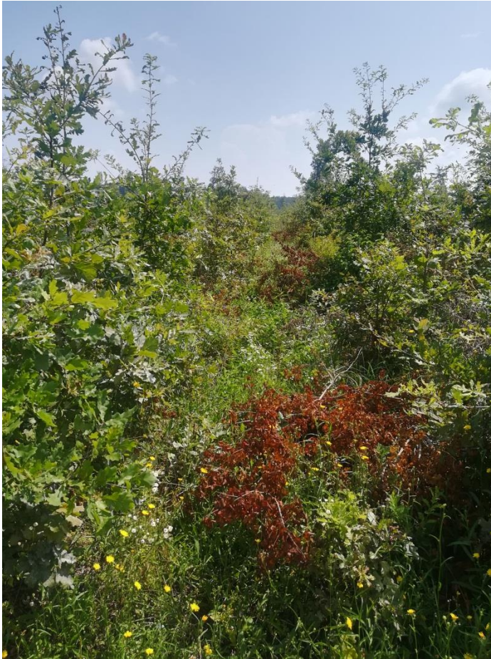
Slika 11: Presječeni dijelovi odloženi na uzgojnoj stazici

odlagati po uzgojnim stazicama, a nikako preko hrastovih biljaka. Ovaj zahvat se obavlja od lipnja do rujna, a kod većeg uzrasta hrastovih biljaka može se raditi i tijekom mirovanja vegetacije kada je nepoželjne vrste potrebno sasjeći pri tlu. Ako na dijelovima površine nema dovoljno hrastovih ili jasenovih stabalaca, ostavljaju se nepresječena tanja i niža stabalca graba, klena, lipe ili druge pogodne kvalitetnije vrste u rasporedu namijenjenom za hrastova stabalca.