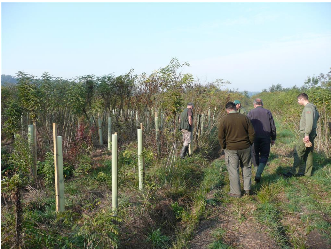
Slika 10: Svezana amorfa i jasen u Tulijevim cijevima

uzrastu hrastovih i jasenovih biljaka jer niži uzrast znači i teže provođenje zahvata njege na obnovljenoj sastojini. Prvi zahvat najčešće je vezivanje gustih stabljika amorfe u snopove. Radnici obuhvaćaju po desetak ili više biljaka i čvrsto ih vezuju u snopove odmah pod krošnjicama. Tako dovoljno svjetla dopire na tlo da hrastove i jasenove biljke mogu nastaviti razvoj. Nakon najduže dvije vegetacije amorfa potjera nove izbojke koji stvaraju zasjenu i tada je treba sasjeći klasičnom njegom nisko pri tlu. Nakon što se stabljike amorfe presijeku, one potjeraju mnogim novim izbojcima pa je nakon toga potrebna njega svake godine dok hrast ili jasen ne uzrastu dovoljno visoko. Zbog toga se presijecanje ne radi dok hrastići nisu visoki barem oko 1,2 m. U slučaju kada dođe do ekstremne gustoće