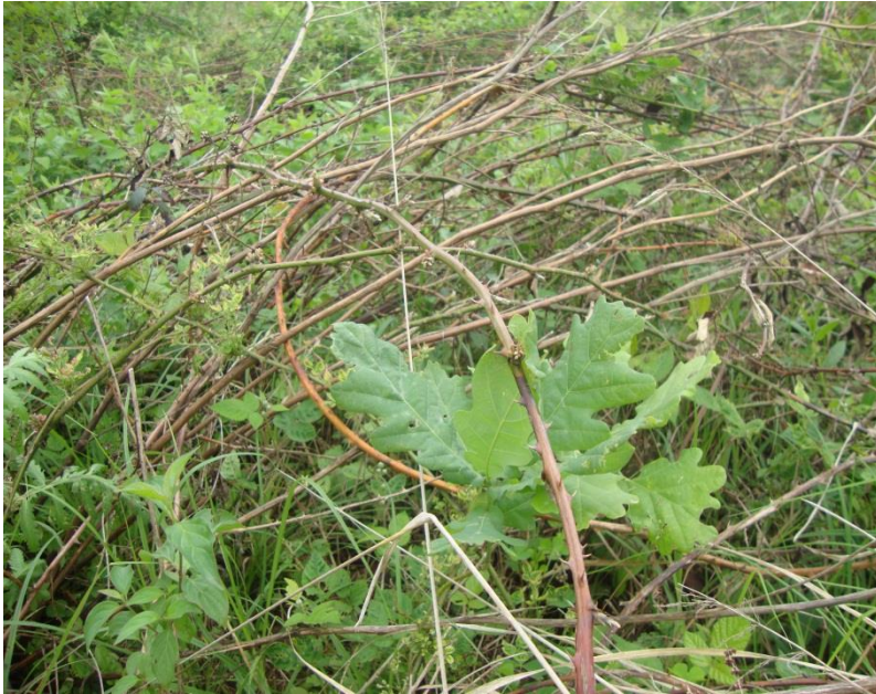
Slika 8: Osušena kupina nakon zimskog tretmana herbicidom

ili veljači, kad su ostale drvenaste vrste u zimskome mirovanju i bez listova. Klasična njega sasijecanjem izbojaka kupine nema nikakvoga učinka jer biljka vrlo brzo bujno potjera nove izbojke. Zbog toga je kemijsko tretiranje jedina opcija kod veće pojave kupine.