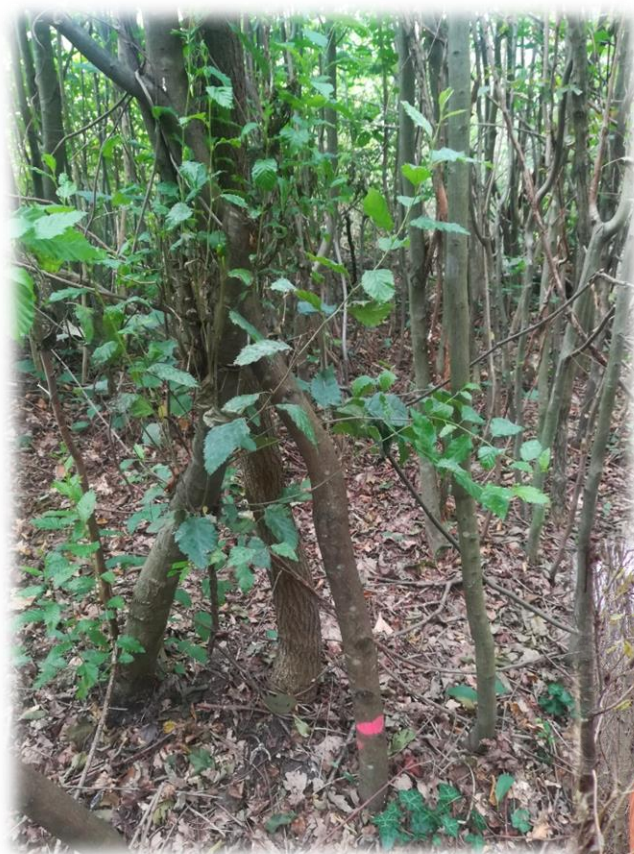
Slika 12: Izgled sastojine za vrijeme čišćenja koljika

zahvate pozitivne selekcije koji se nazivaju prorjede. One započinju nakon dvadesete godine kada se uklanjaju stabla koja smetaju odabranim stablima budućnosti.