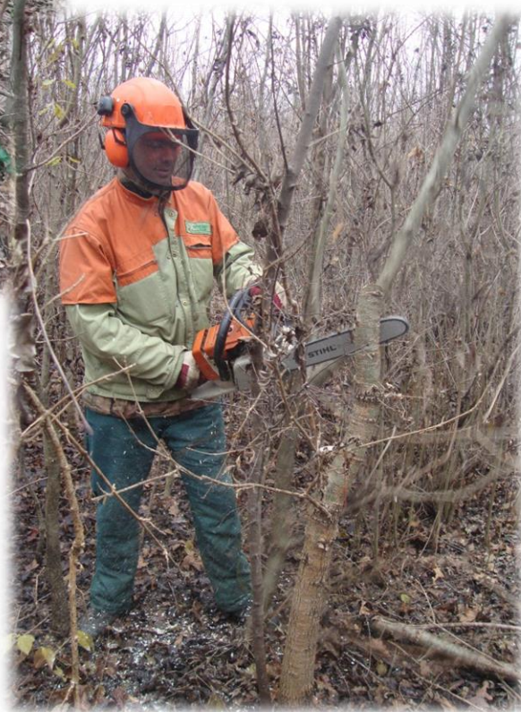
Slika 13: Čišćenje koljika motornom pilom

zahvate pozitivne selekcije koji se nazivaju prorjede. One započinju nakon dvadesete godine kada se uklanjaju stabla koja smetaju odabranim stablima budućnosti.